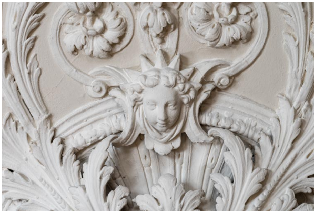
Rosace au plafond : détail.