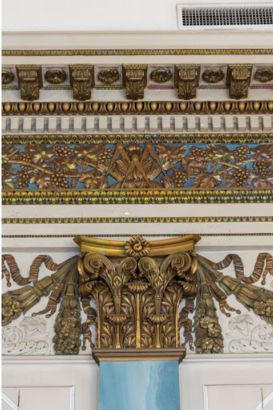
Chapiteau surmonté de l'entablement avec un motif des compas dans la frise. 21, Dijon place du Théâtre