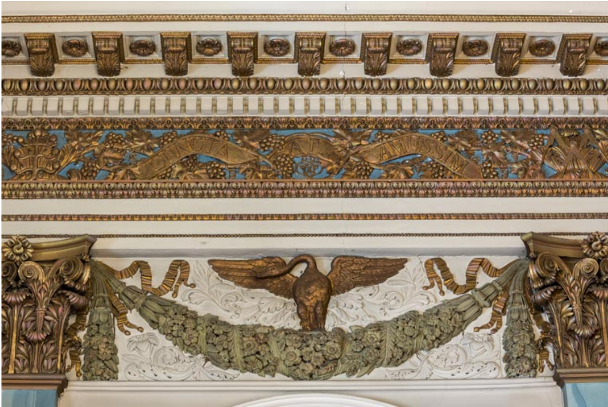
Décor en partie haute d'une travée.