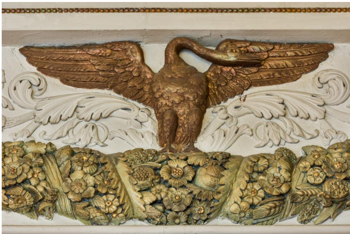
Frise : cygne aux ailes déployées.