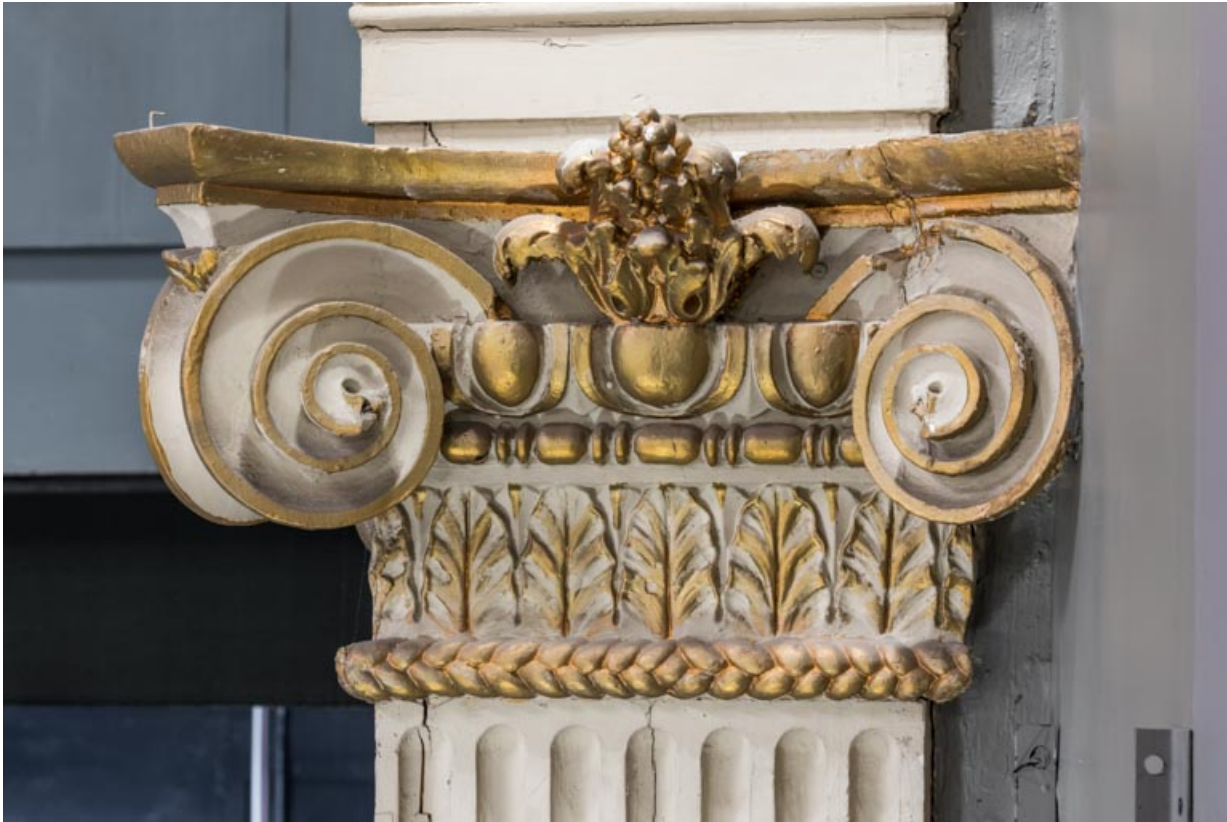
Chapiteau d'un pilastre des loges d'avant-scène. 21, Dijon place du Théâtre