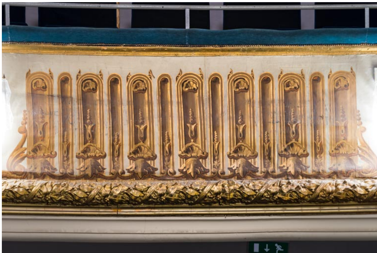
Décor peint du garde-corps du 3e balcon.