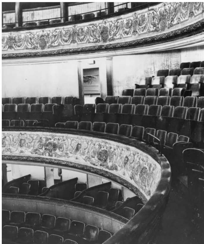
[2e balcon, avant travaux]. S.d. [1969].