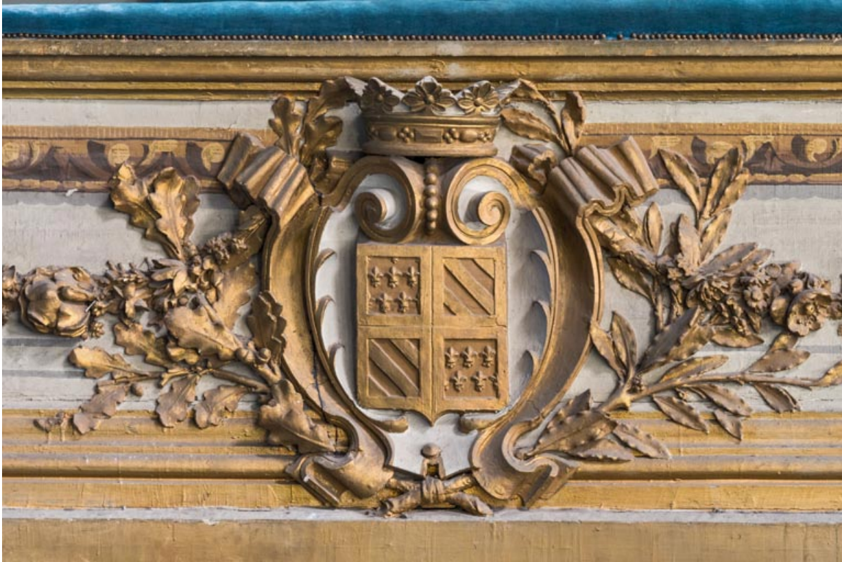
Armoiries de Bourgogne sur le garde-corps de la loge d'avant-scène côté jardin, au 1er balcon. 21, Dijon place du Théâtre