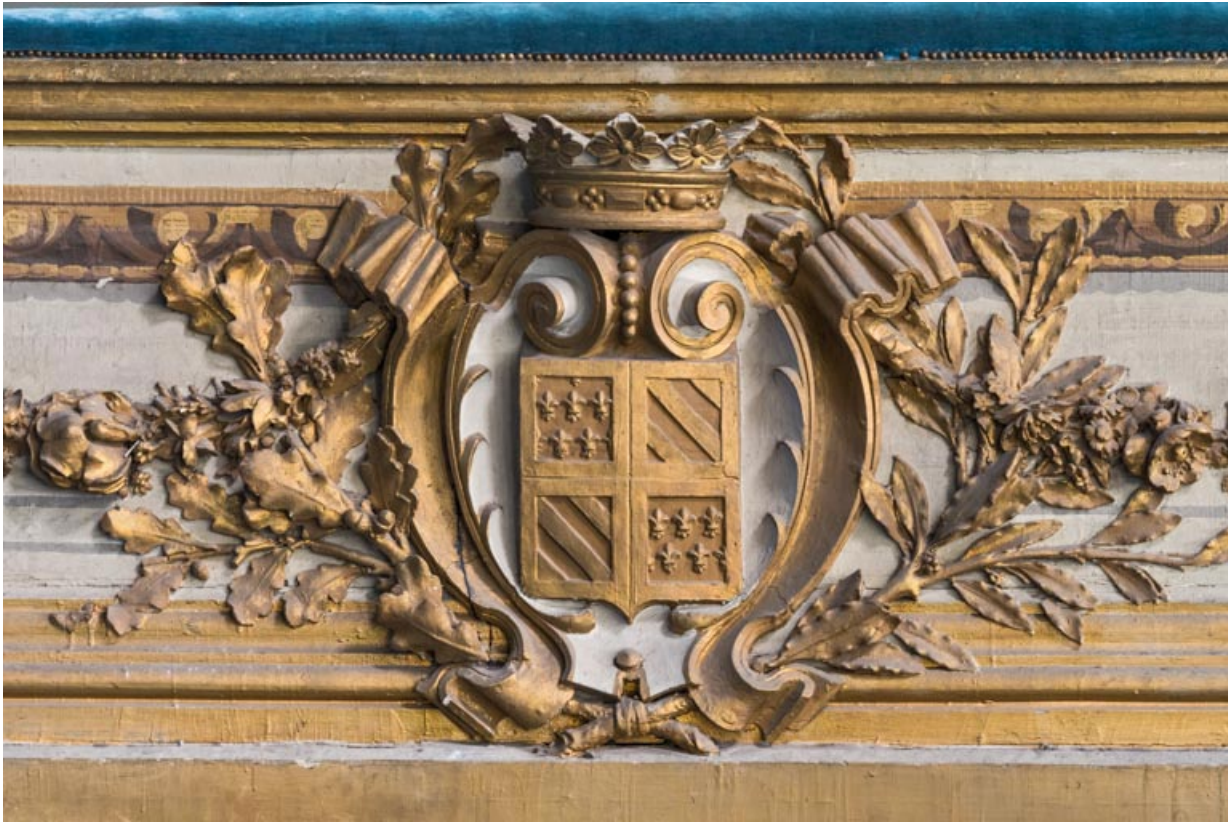
Armoiries de Bourgogne sur le garde-corps de la loge d'avant-scène côté jardin, au 1er balcon. 21, Dijon place du Théâtre