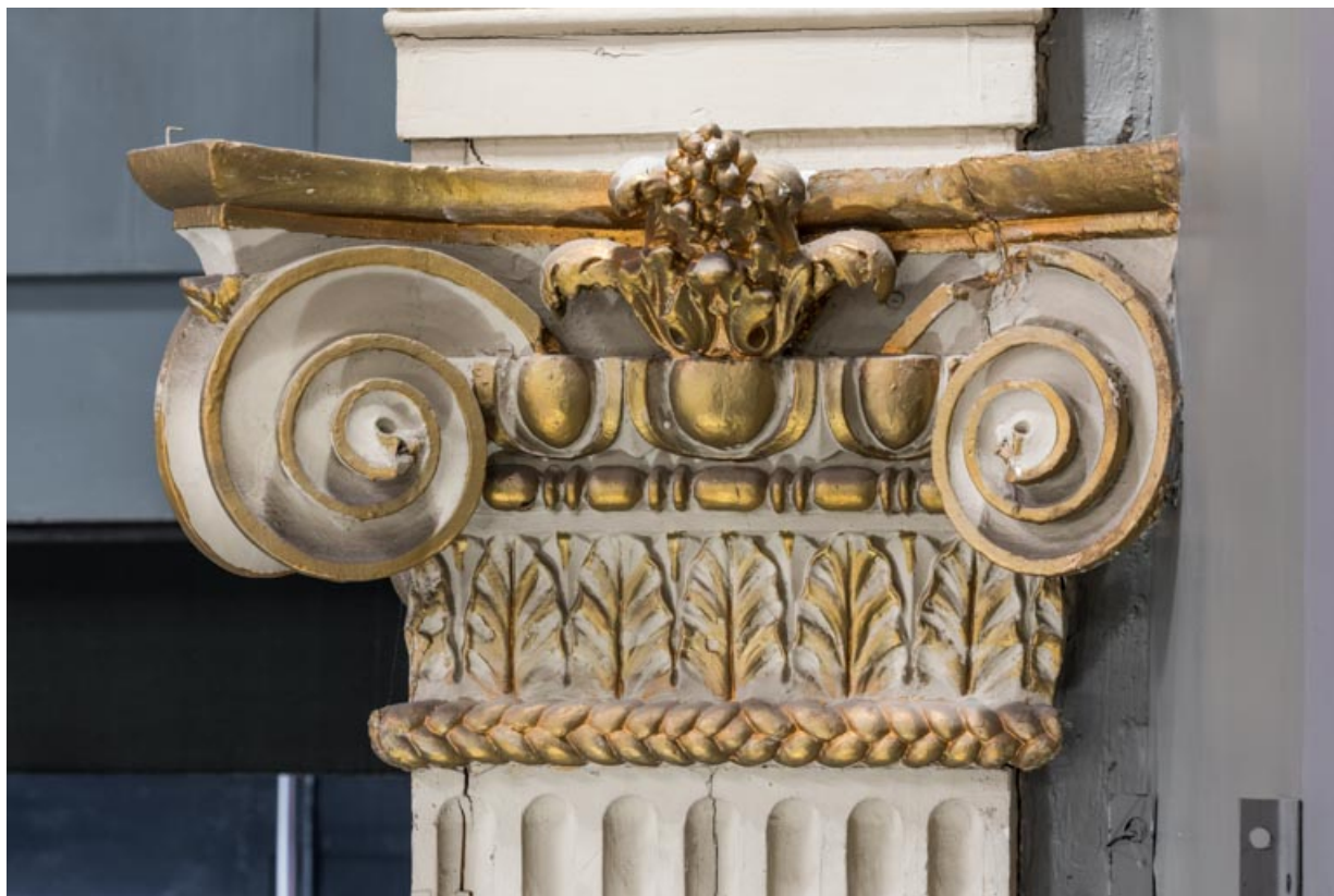
Chapiteau d'un pilastre des loges d'avant-scène.