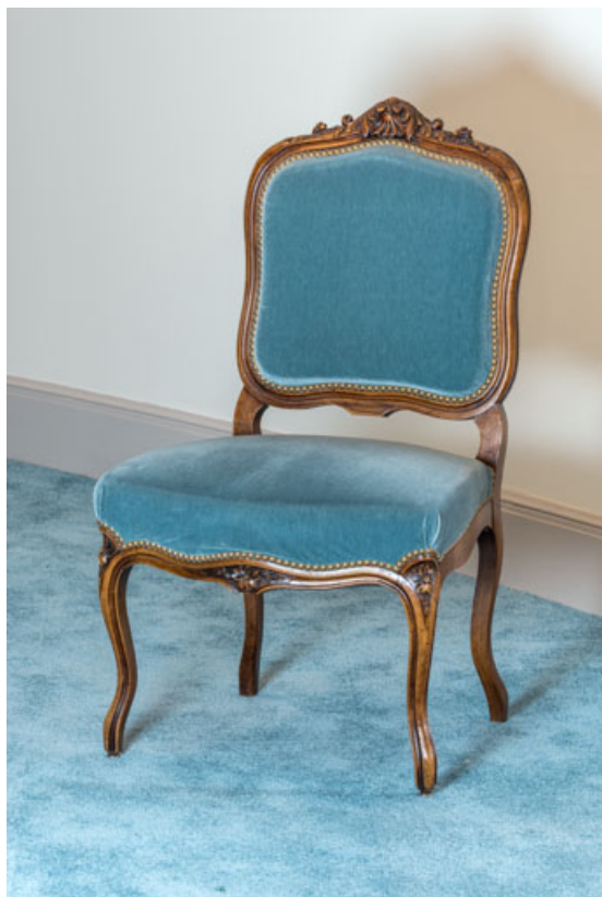
Chaise (récente) à dossier plat garni.