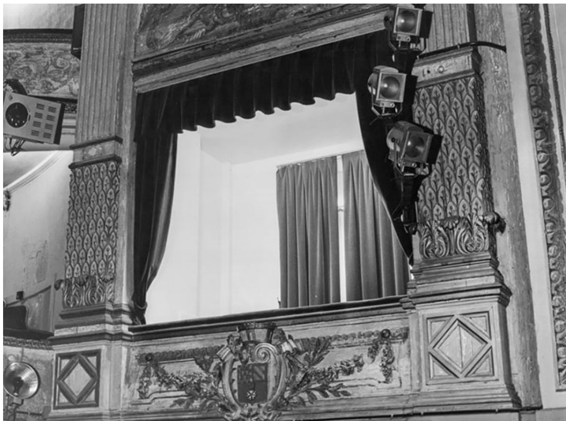
Loge du maire avant tx [travaux]. S.d. [1969].