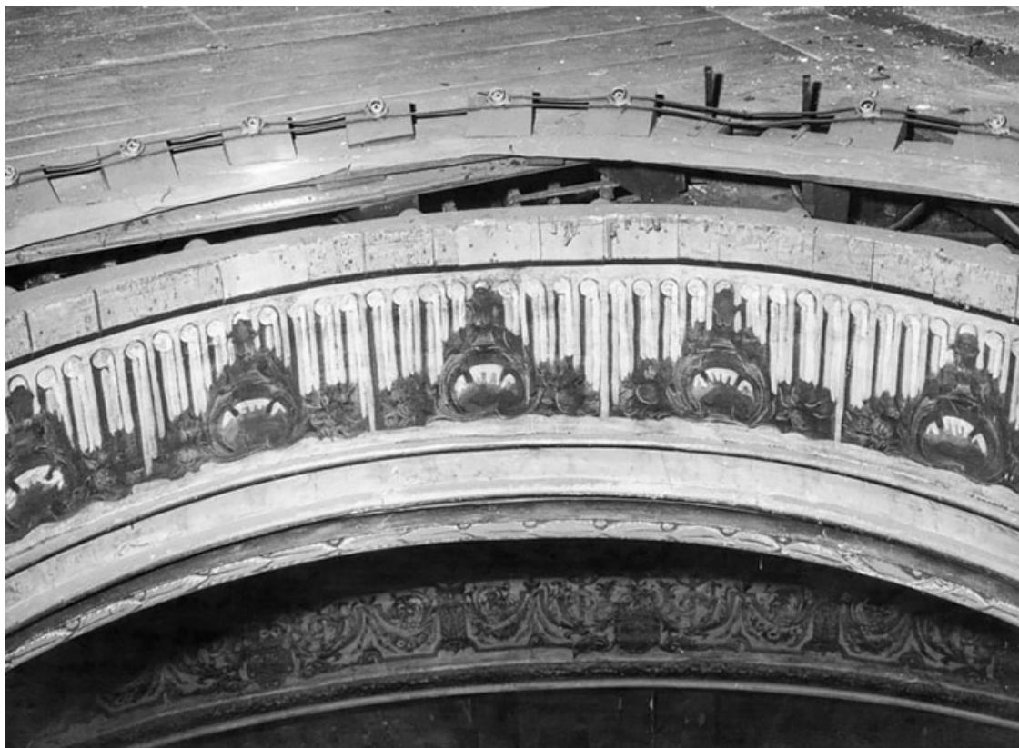
La salle - vue des combles par la couronne du plafond [avant travaux]. S.d. [1969]. 21, Dijon place du Théâtre