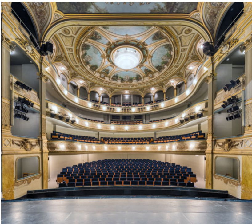
La salle vue depuis la scène.