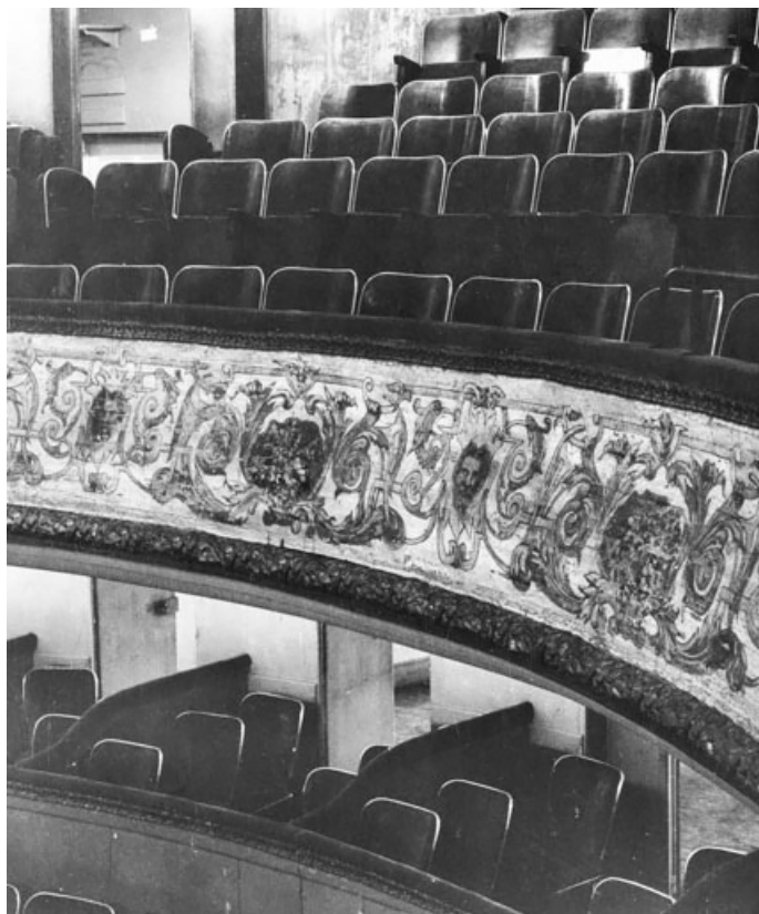
[Loges du 1er balcon et 2e balcon, avant travaux]. S.d. [1969]. 21, Dijon place du Théâtre