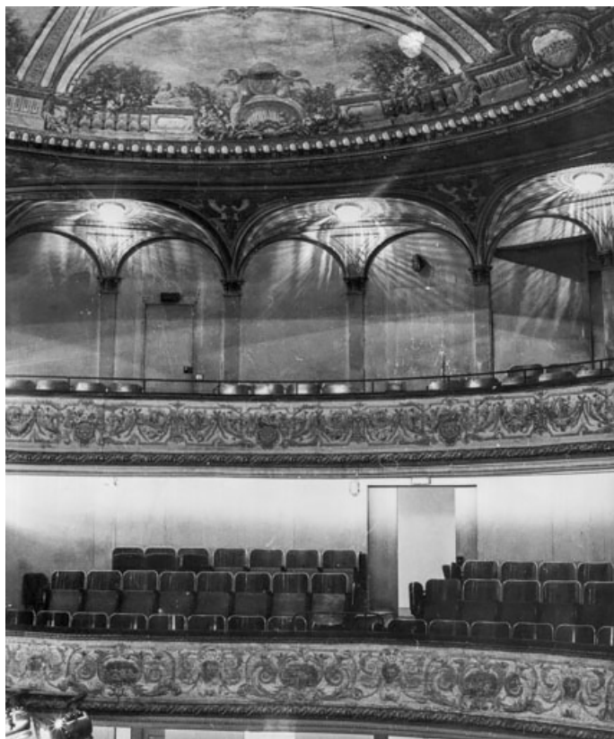
[2e et 3e balcons, avant travaux]. S.d. [1969]. 21, Dijon place du Théâtre