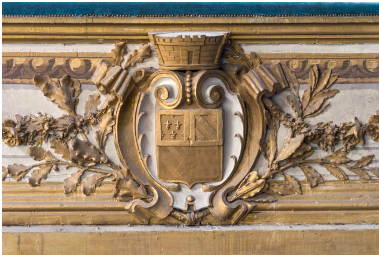
Armoiries de Dijon sur le garde-corps de la loge d'avant-scène côté cour, au 1er balcon. 21, Dijon place du Théâtre