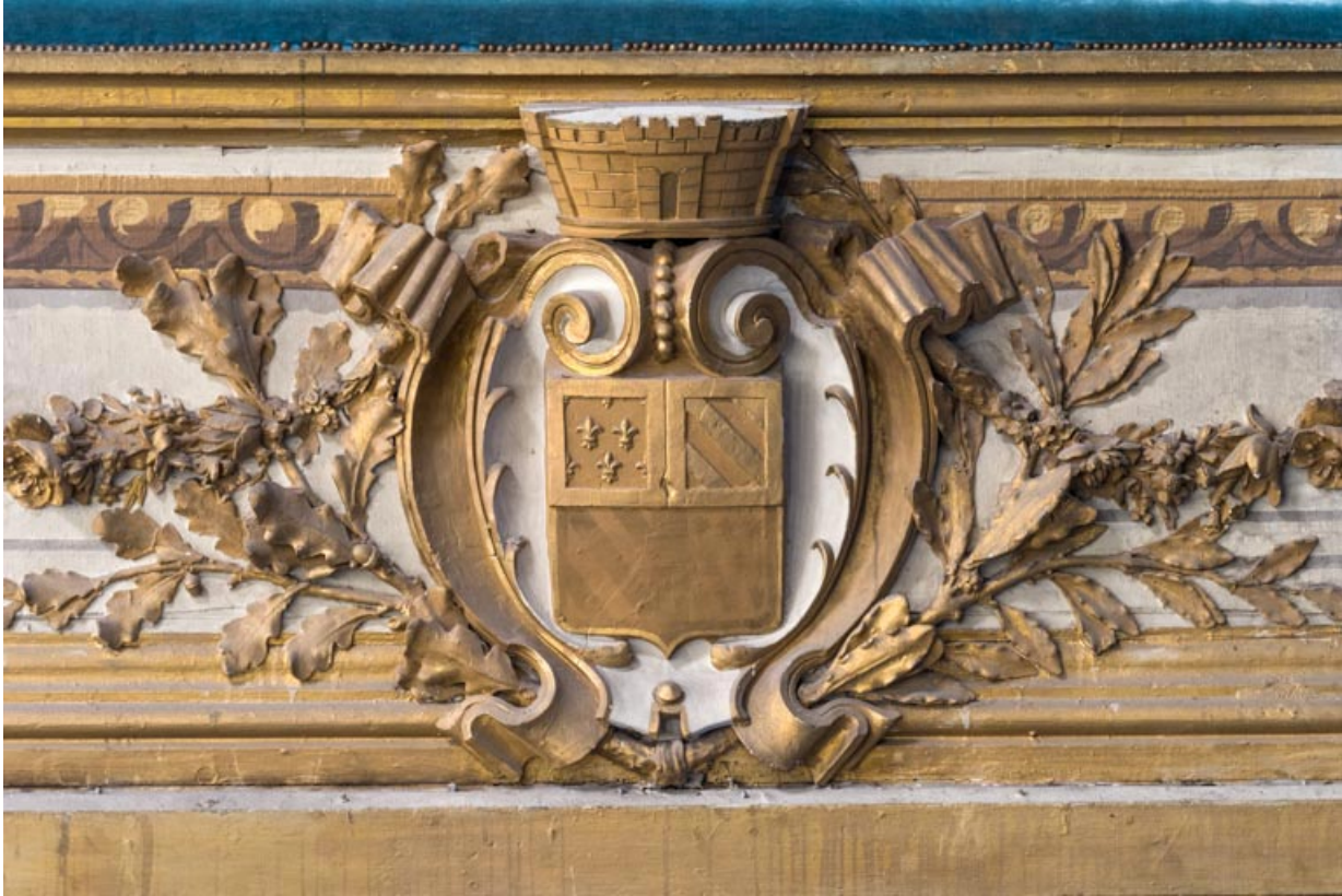
Armoiries de Dijon sur le garde-corps de la loge d'avant-scène côté cour, au 1er balcon. 21, Dijon place du Théâtre