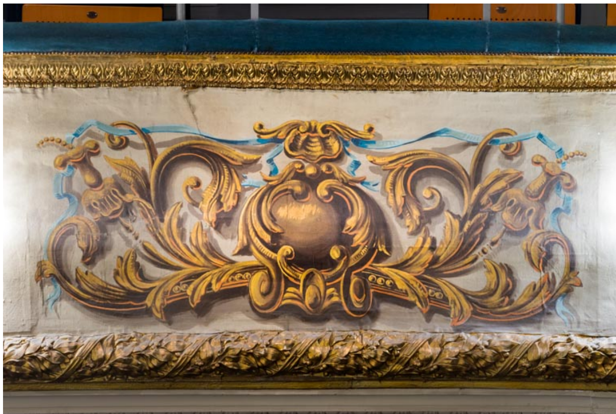
Décor peint du garde-corps d'un balcon.