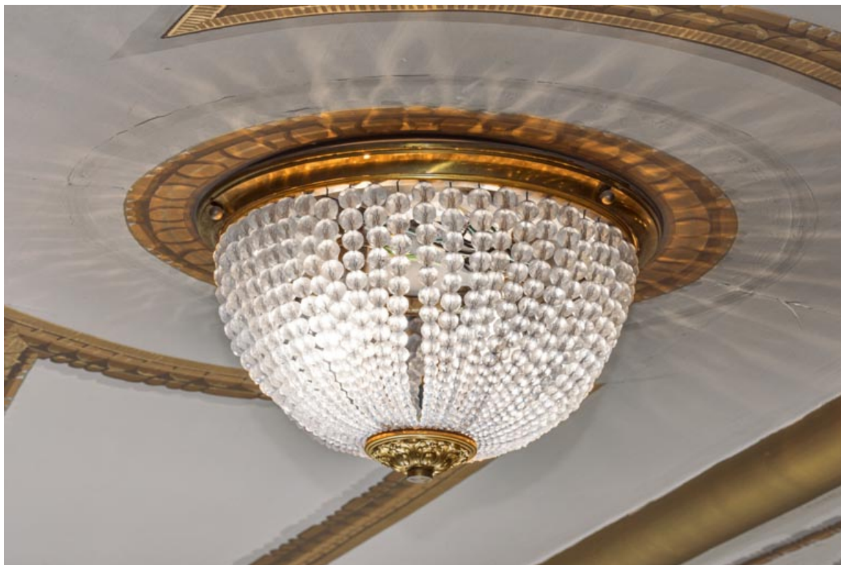
Lustre au 3e balcon.