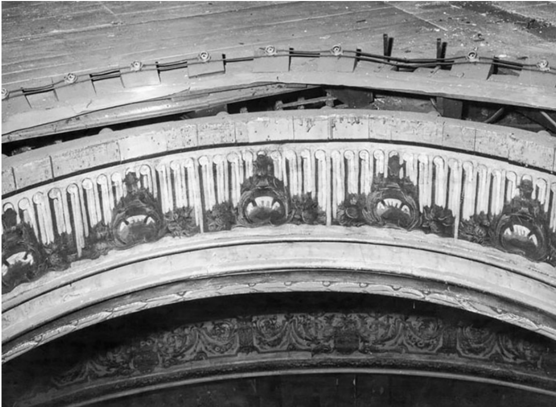
La salle - vue des combles par la couronne du plafond [avant travaux]. S.d. [1969]. 21, Dijon place du Théâtre

[Photographies de l'intérieur du théâtre avant et pendant la rénovation de 1970]. Photographie, s.n. S.d. [1969-1970]. Tirages noir et blanc.