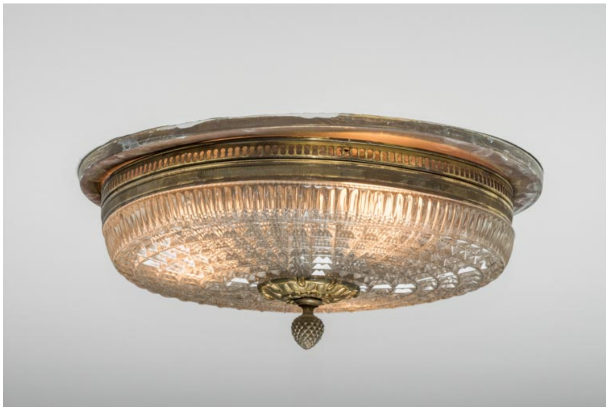
Plafonnier dans le couloir desservant le 1er balcon.