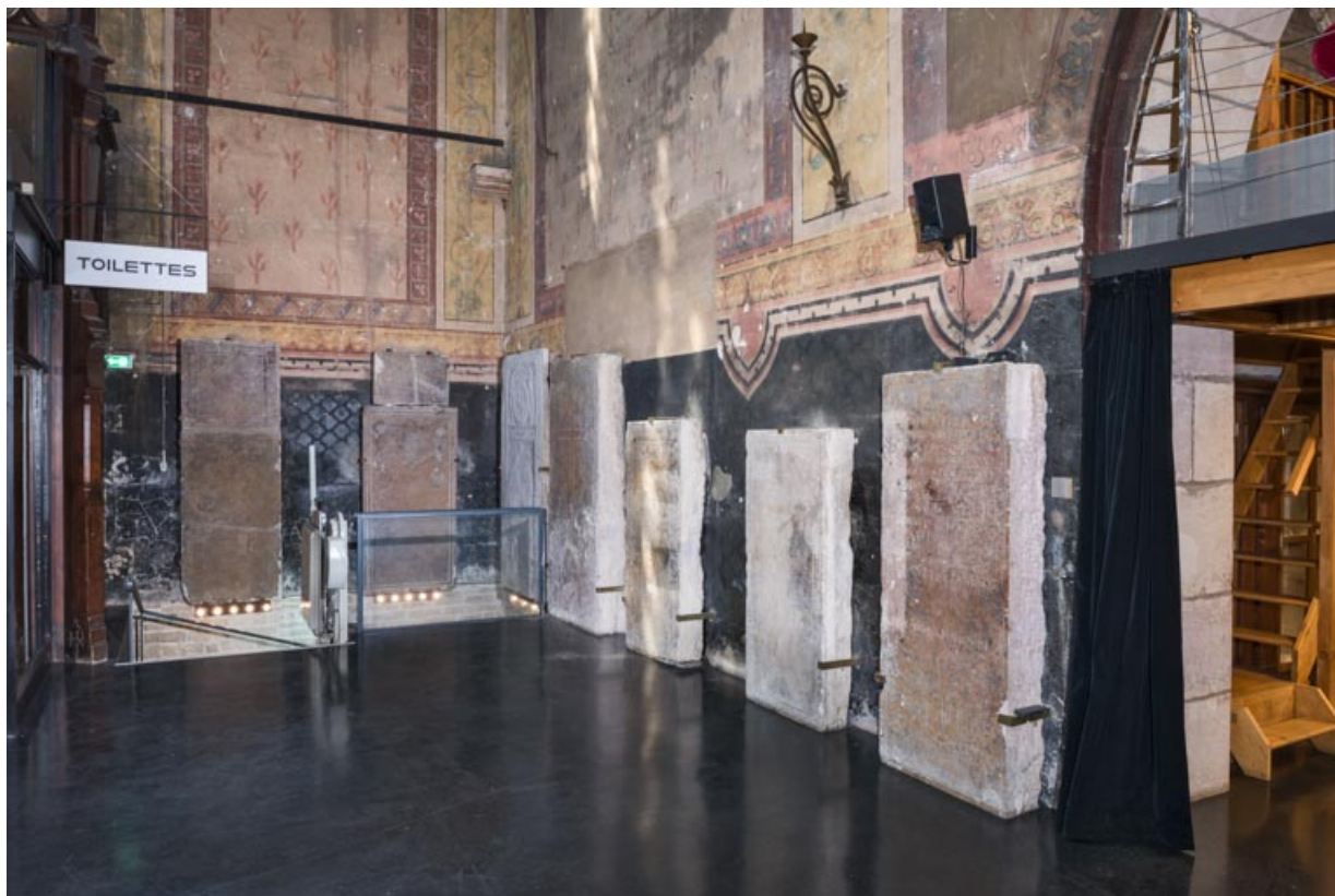
Dalles funéraires dans l'angle nord-ouest.