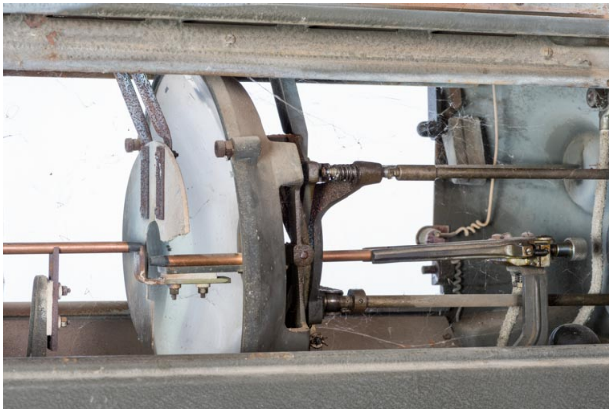
Lanterne : lampe à arc.