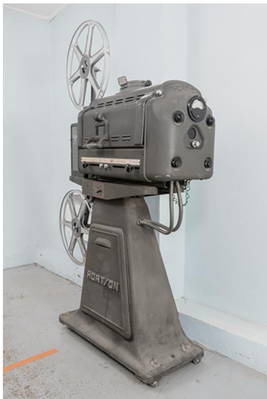
Vue d'ensemble, de trois quarts droite.