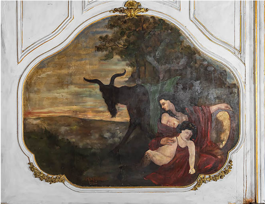
Jeune faune avec sa mère.