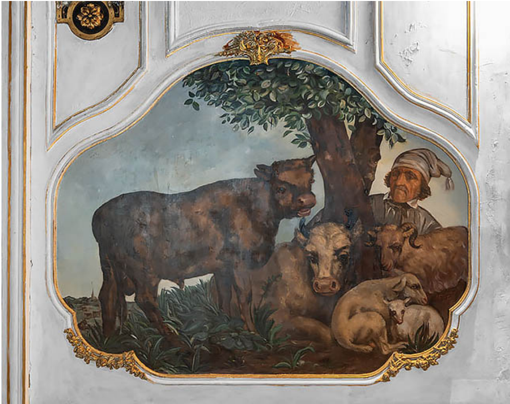
Paysan gardant son troupeau.