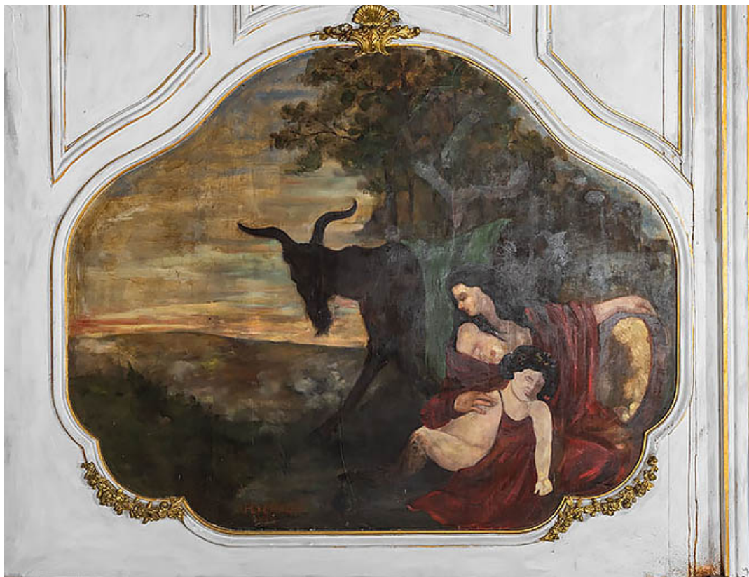
Jeune faune avec sa mère.