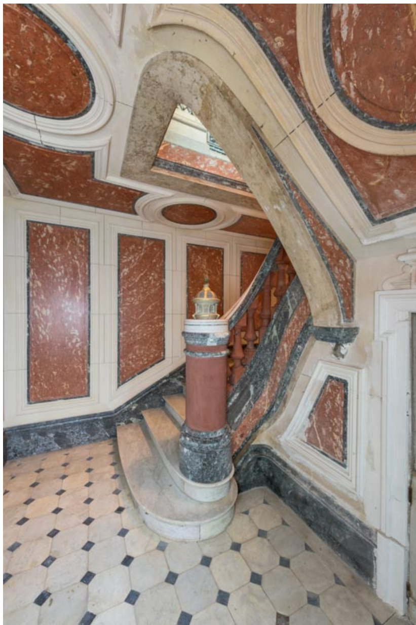
Vue depuis l'entrée.