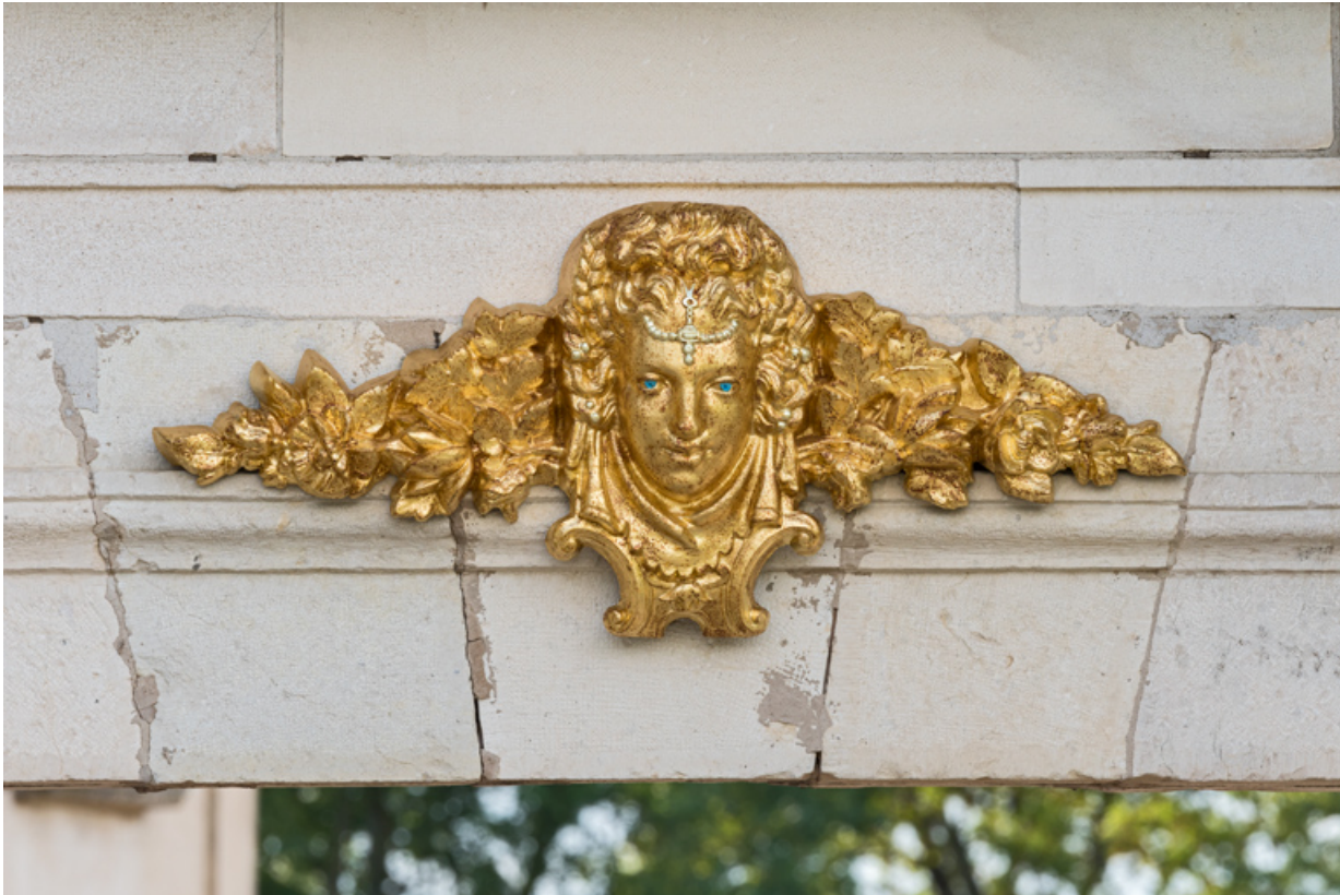
Galerie (linteau de la porte cochère) : masque en fonte peinte (il se trouvait côté cour avant 2022). 21, Chevigny-en-Valière, 23 rue Mercey