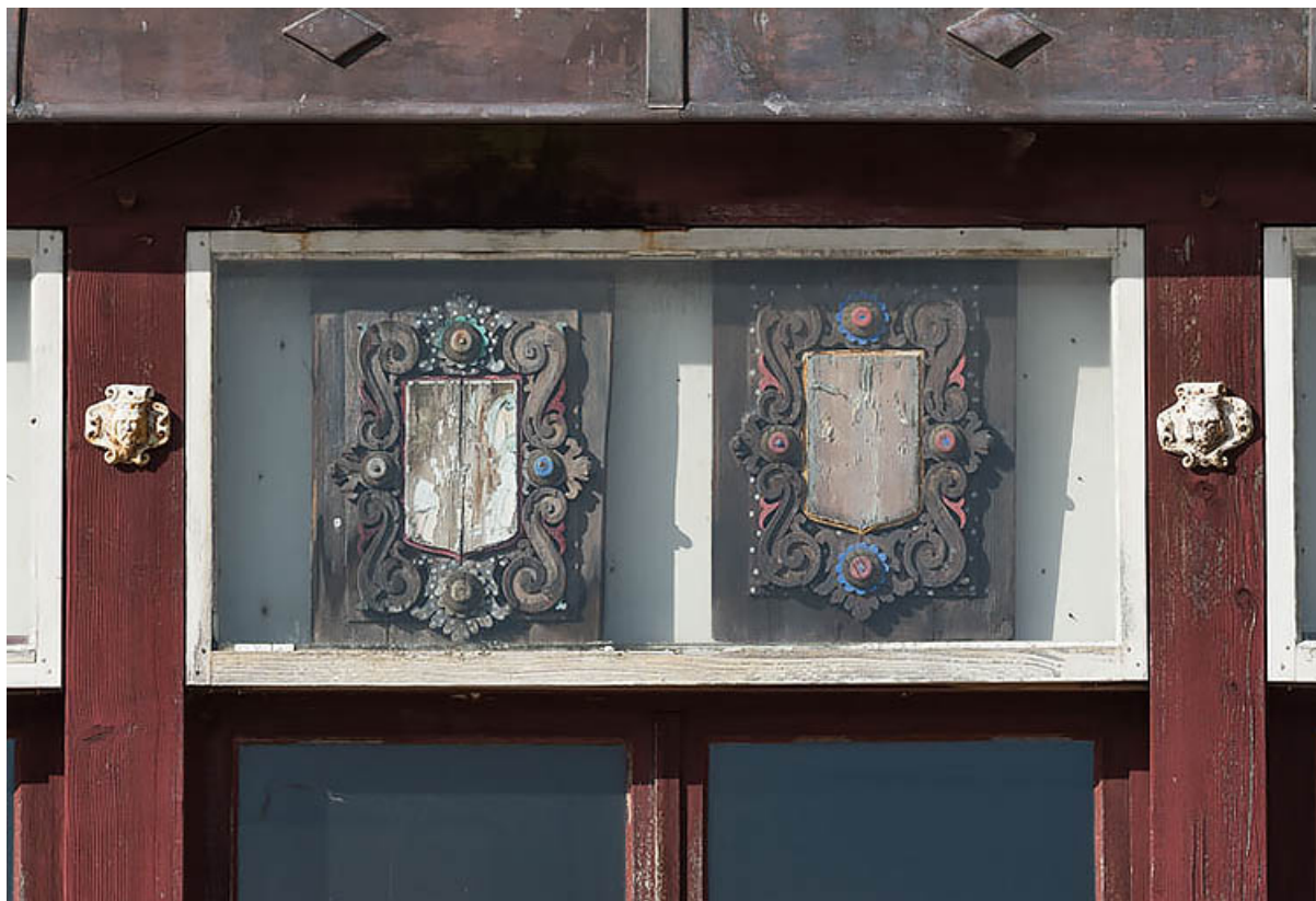
Communs (mur oriental du foyer) : deux armoiries (3e ensemble sur six en partant de la gauche).