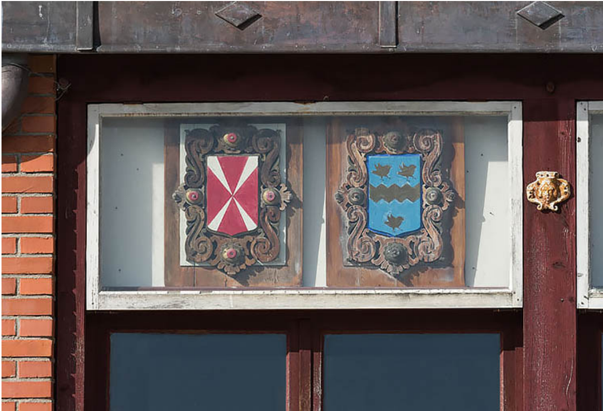
Communs (mur oriental du foyer) : deux armoiries (1er ensemble sur six en partant de la gauche).