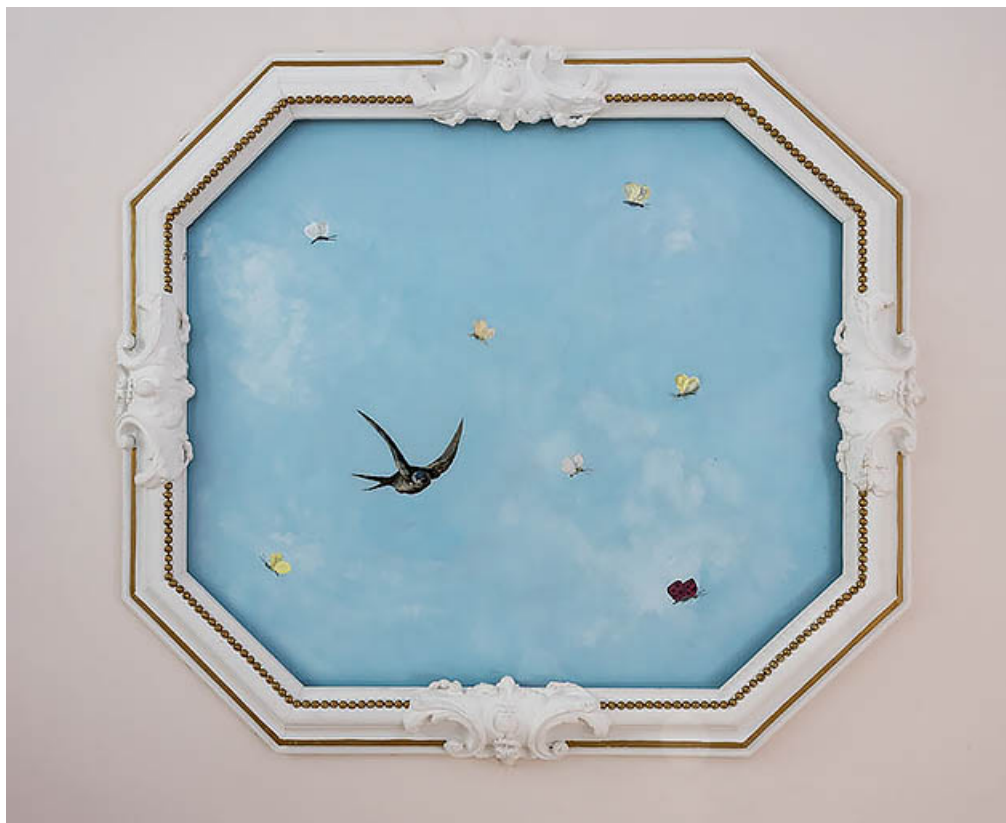
Demeure (chambre à l'étage) : peinture au plafond (hirondelle et papillons).