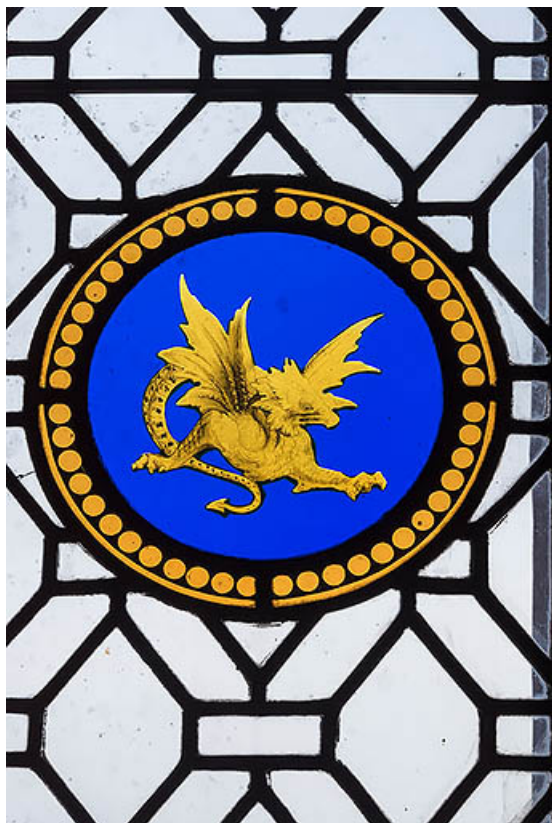
Demeure (bureau à l'étage) : rondel au basilic.