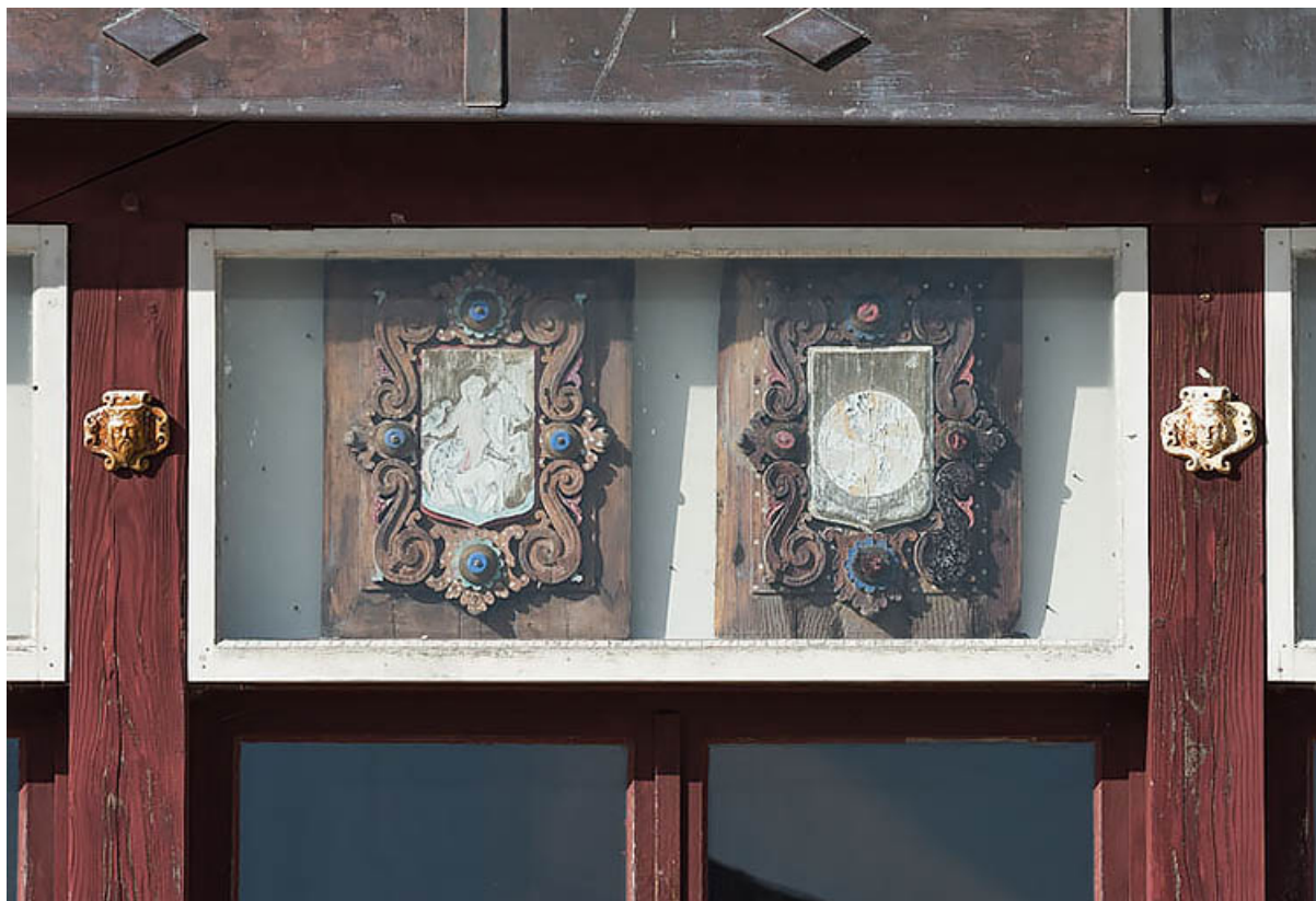
Communs (mur oriental du foyer) : deux armoiries (5e ensemble sur six en partant de la gauche).