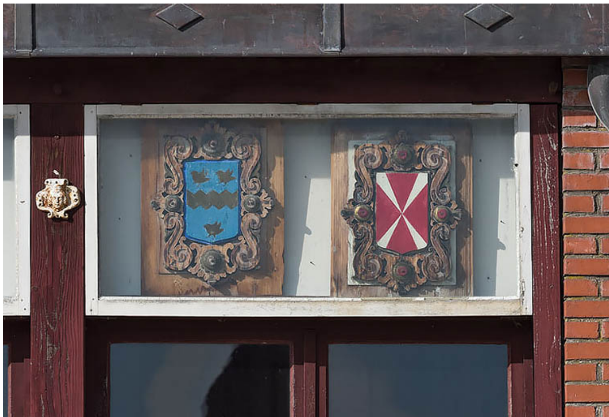
Communs (mur oriental du foyer) : deux armoiries (6e et dernier ensemble sur six en partant de la gauche).