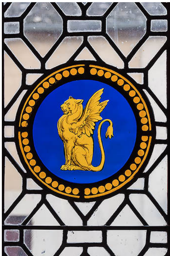
Demeure (bureau à l'étage) : rondel au lion ailé.