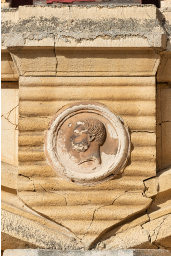
Demeure (élévation antérieure) : bas-relief.