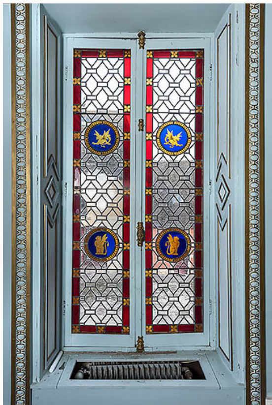
Demeure (bureau à l'étage) : vantaux de fenêtre vitrés et ornés de rondels.