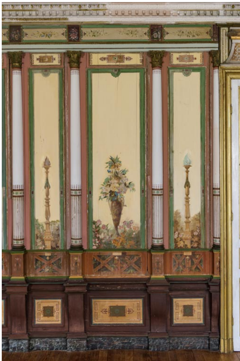
Communs (salle des fêtes dans le "Donjon") : décor peint.