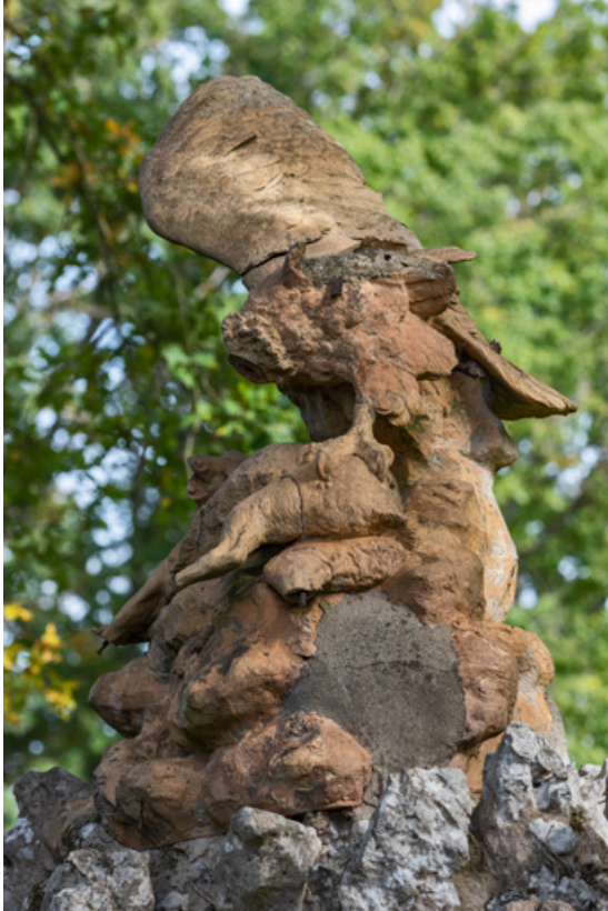
Parc : groupe sculpté.