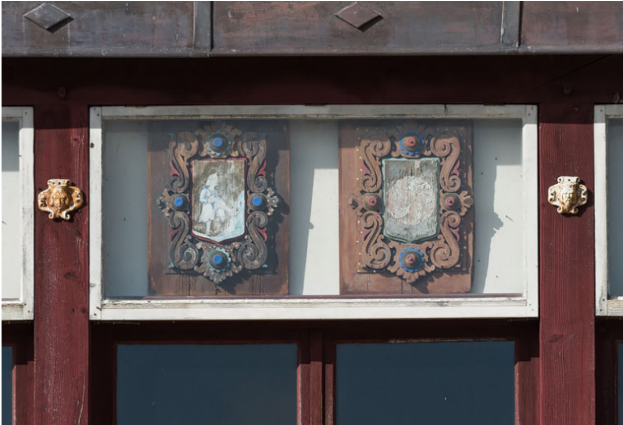
Communs (mur oriental du foyer) : deux armoiries (2e ensemble sur six en partant de la gauche). 21, Chevigny-en-Valière, 23 rue Mercey