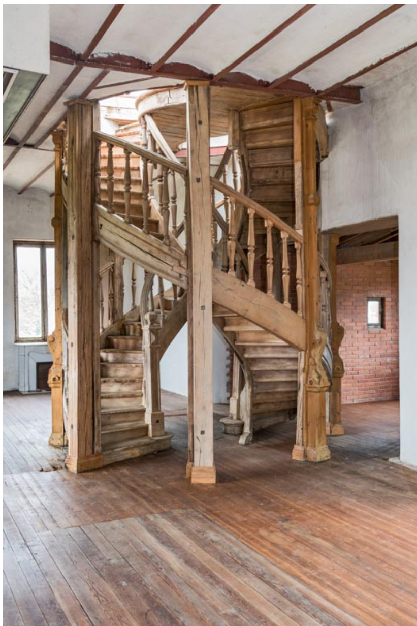
Communs (logement dans le "Donjon") : escalier à doubles révolutions dit "de Chambord" 21, Chevigny-en-Vallière, 23 rue Mercey