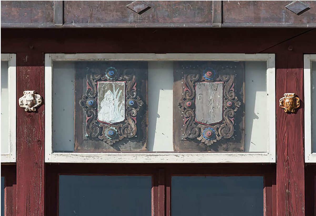
Communs (mur oriental du foyer) : deux armoiries (4e ensemble sur six en partant de la gauche).