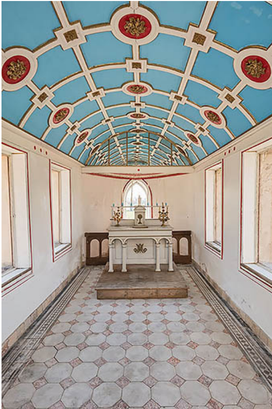
Chapelle : décor intérieur.