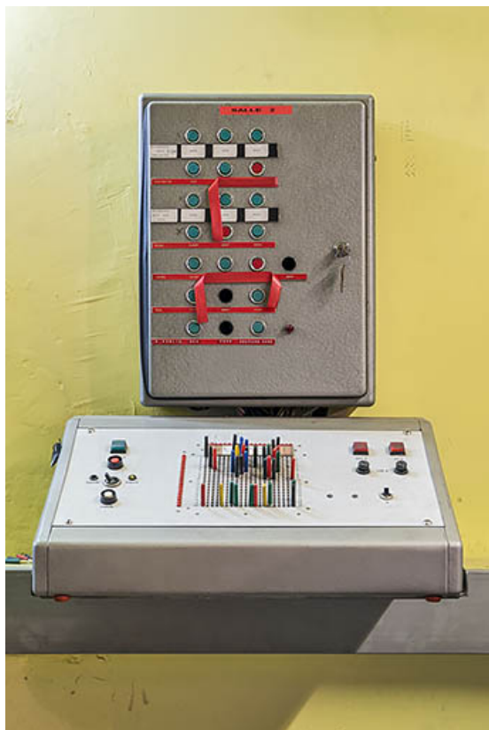
Pupitre à matrice à diodes et boîtier de commande à boutons poussoirs. 21, Dijon, 8 place Darcy