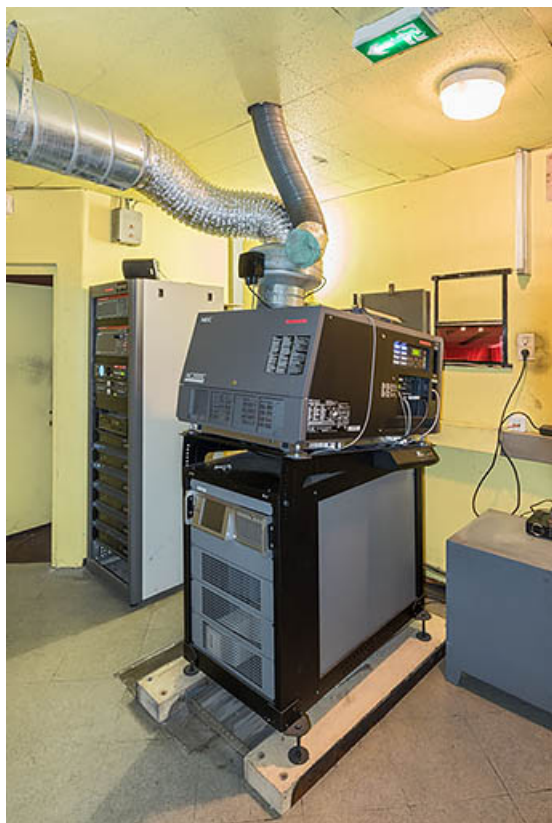
Projecteur numérique NEC NC2000C.