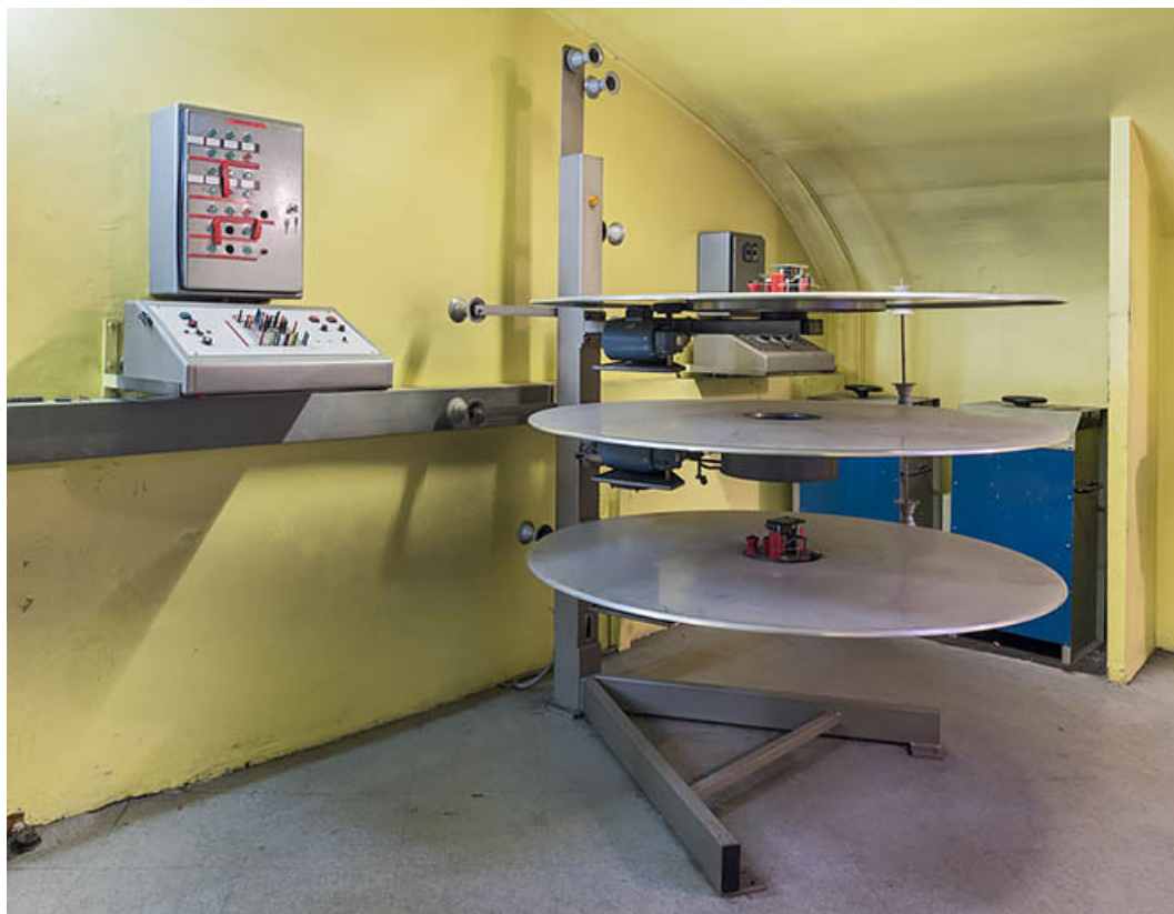
Pupitre à matrice à diodes et dérouleur à plateau Kinoton ST-270.