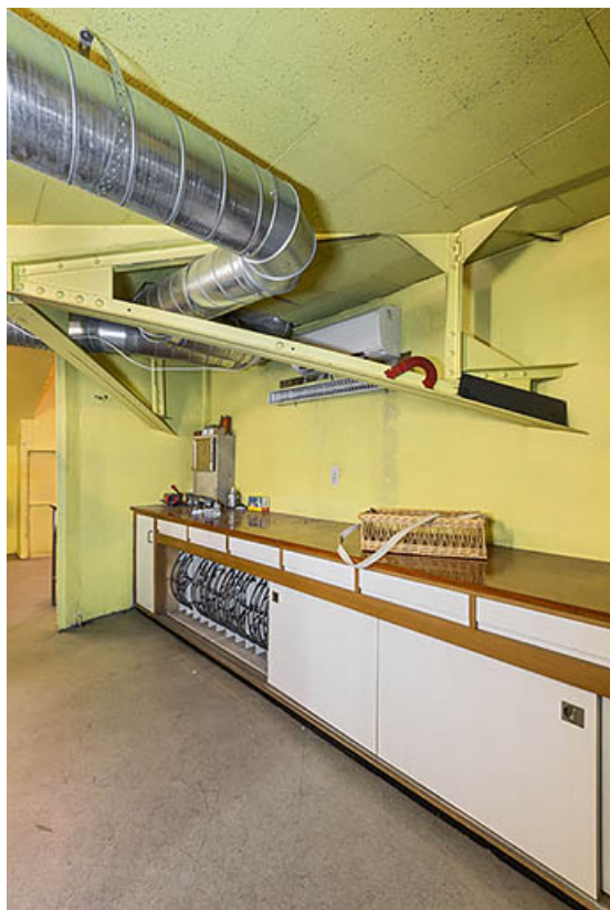
Meuble de stockage des bobines de films.