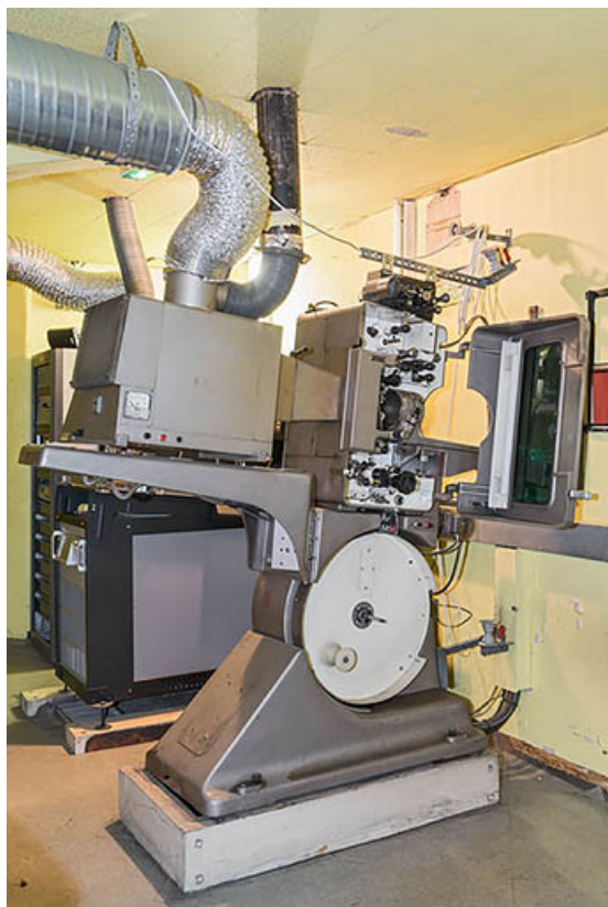
Projecteur argentique Philips DP 70 (capot ouvert). 21, Dijon, 8 place Darcy