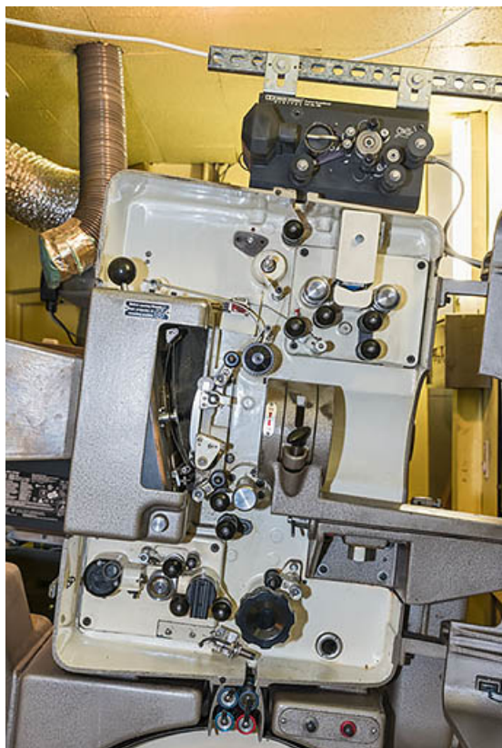
Projecteur argentique Philips DP 70 : système d'entraînement du film. 21, Dijon, 8 place Darcy