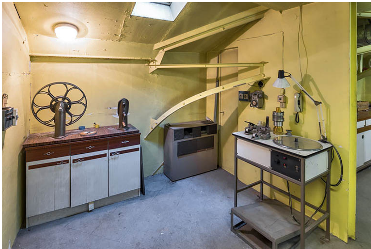
Installation de rembobinage manuel à gauche et table de bobinage Kinoton ST-272 à droite. 21, Dijon, 8 place Darcy