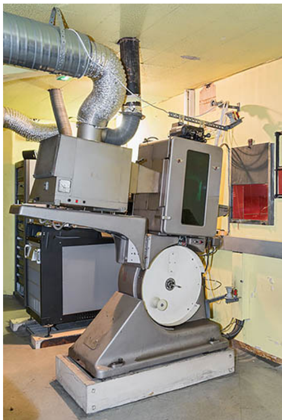
Projecteur argentique Philips DP 70.