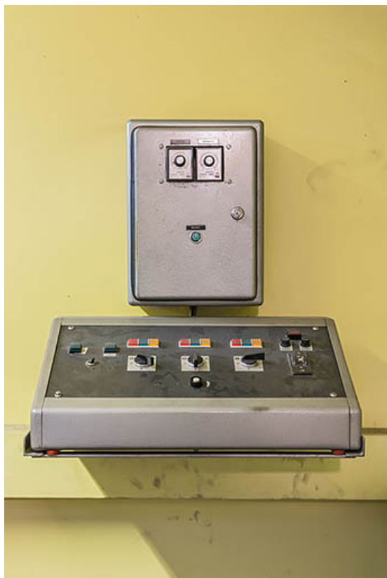
Pupitre de commande du dérouleur à plateau.