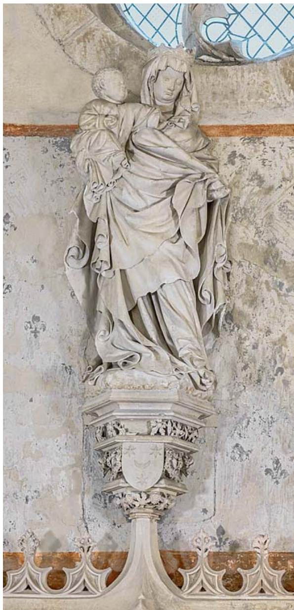
Statue de la Vierge à l'Enfant.

21, Rouvres-en-Plaine, 1 rue de l' Église