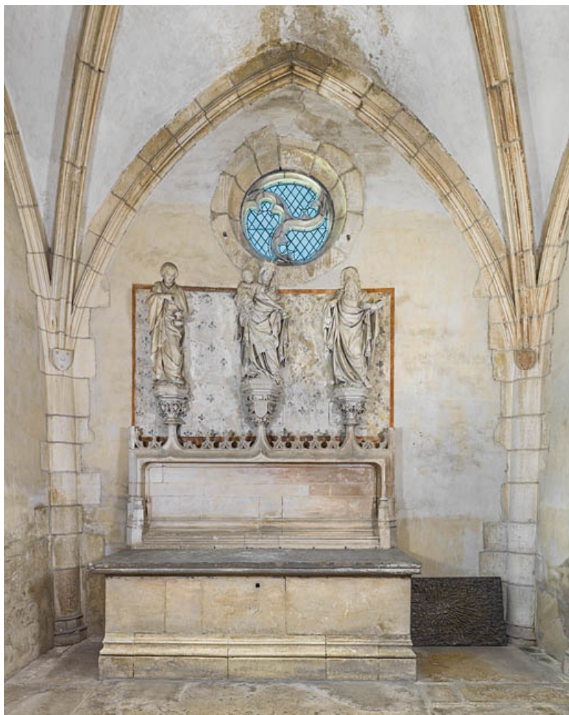
Chapelle de la famille Mâchefoing, vue en direction de l'autel.

21, Rouvres-en-Plaine, 1 rue de l' Église