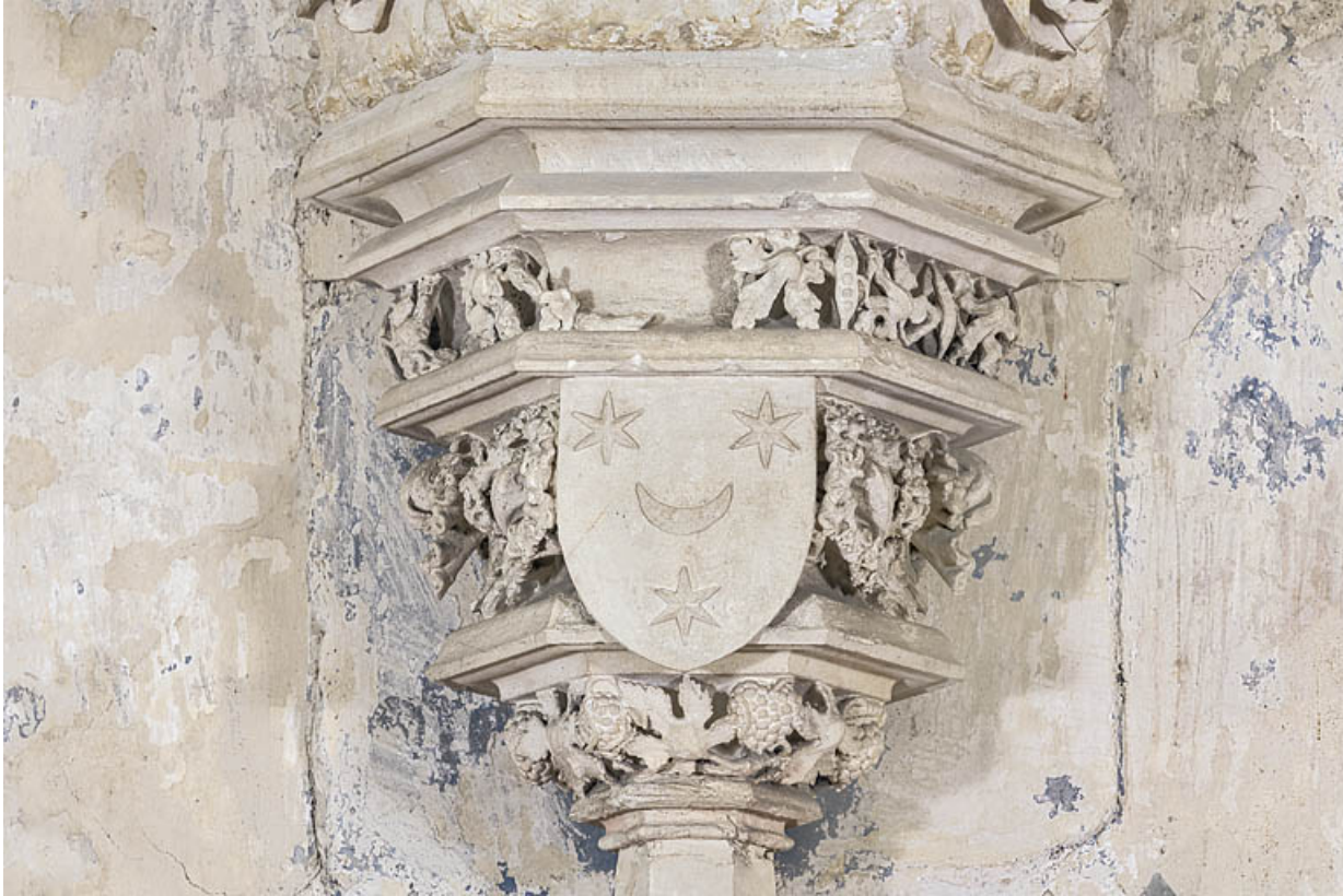
Console de la statue de la Vierge à l'Enfant aux armes des Mâchefoing.

21, Rouvres-en-Plaine, 1 rue de l' Église