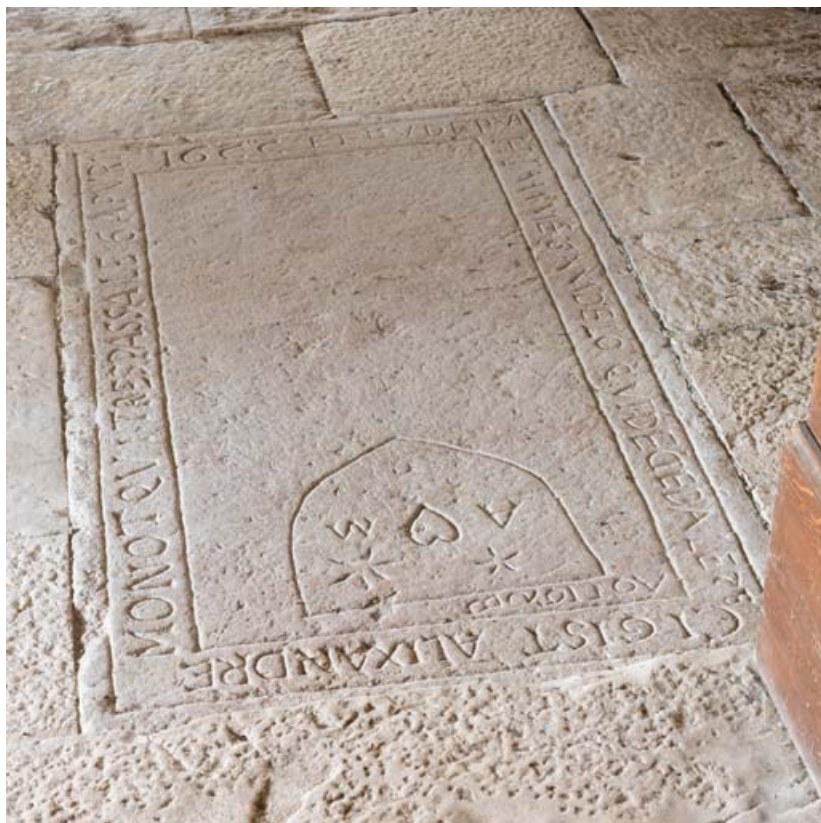
Vue d'ensemble de la dalle 6.

21, Auxey-Duresses, lieudit : Petit Auxey