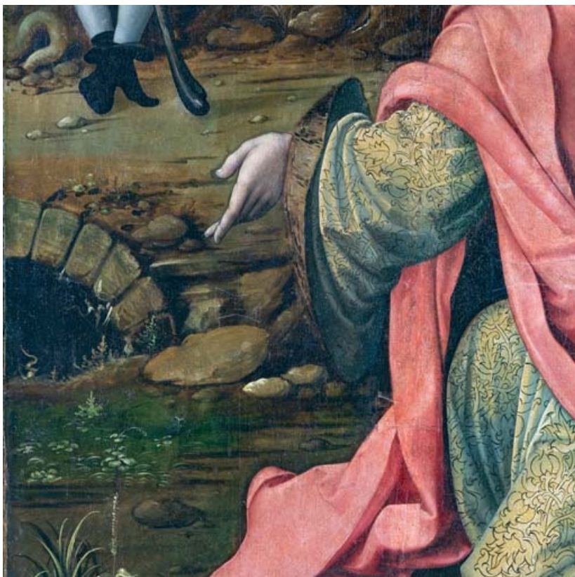
Détail du volet gauche : main de saint Joachim. 21, Auxey-Duresses