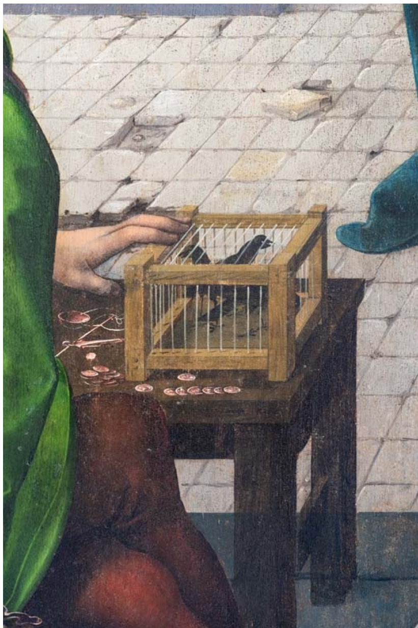
Détail du volet droit : cage à oiseaux.