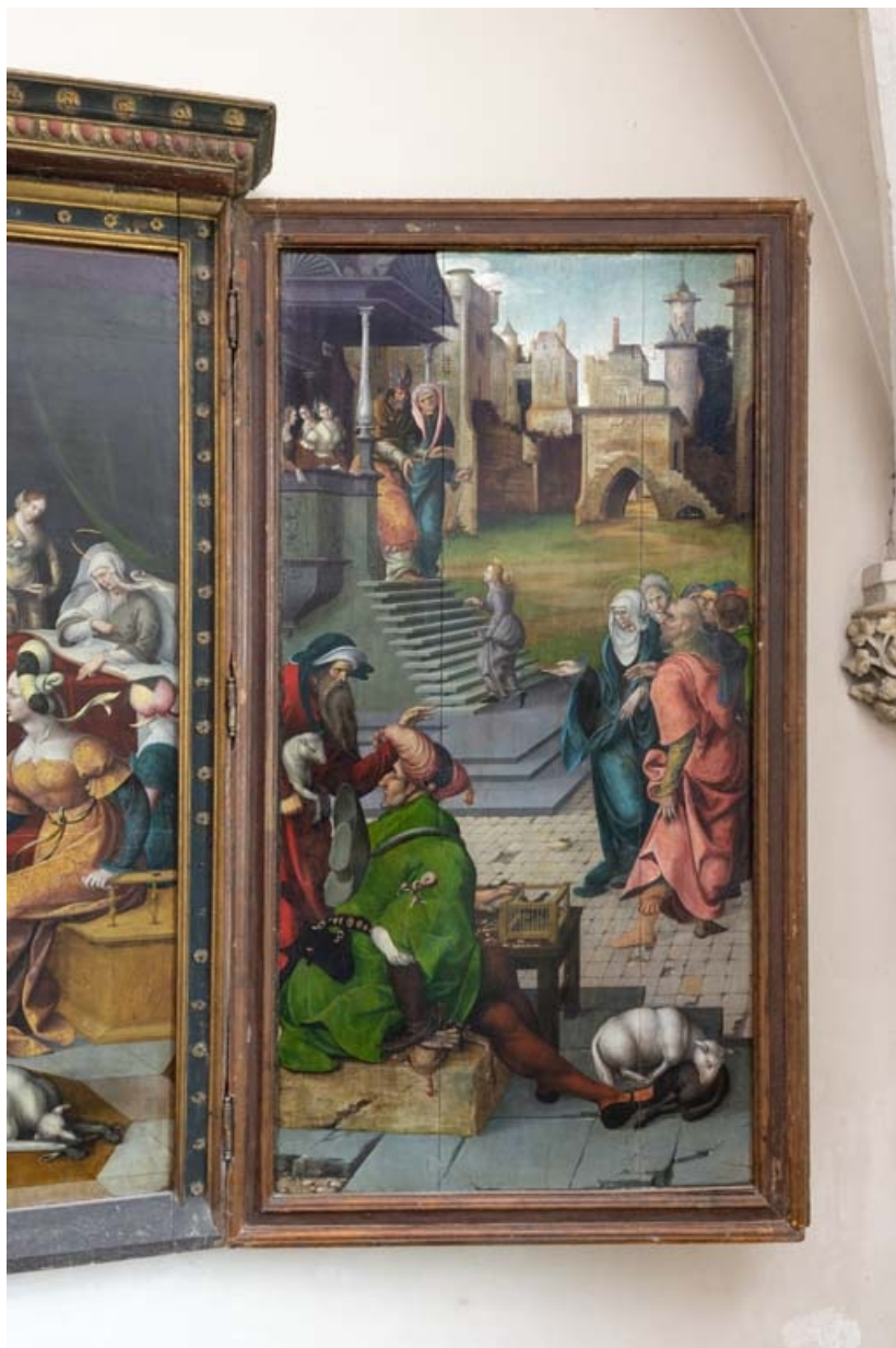
Volet droit : vue d'ensemble.