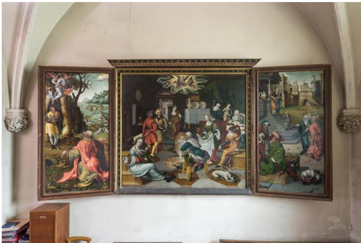
Vue d'ensemble, volets ouverts.