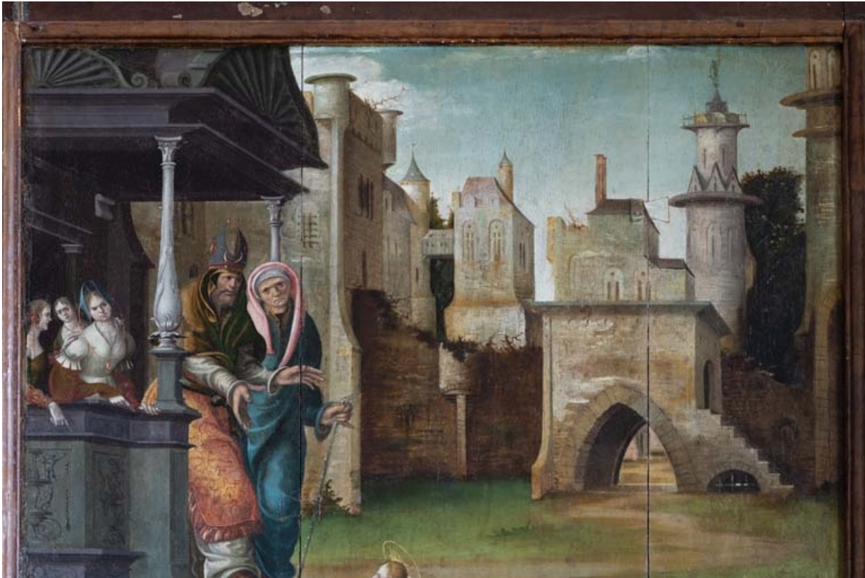
Détail du volet droit : Temple et ville à l'arrière-plan.