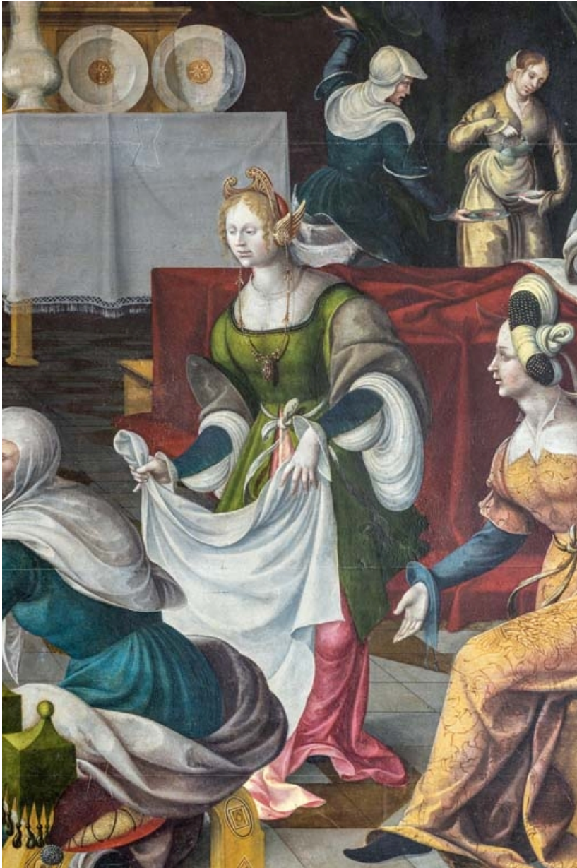
Détail du panneau central : servante de droite présentant un linge. 21, Auxey-Duresses