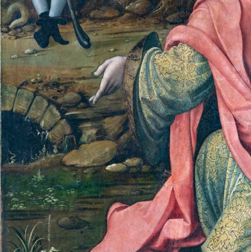
Détail du volet gauche : main de saint Joachim. 21, Auxey-Duresses