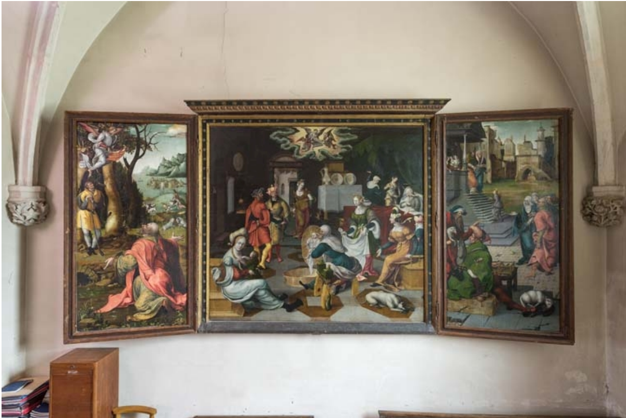
Vue d'ensemble, volets ouverts.