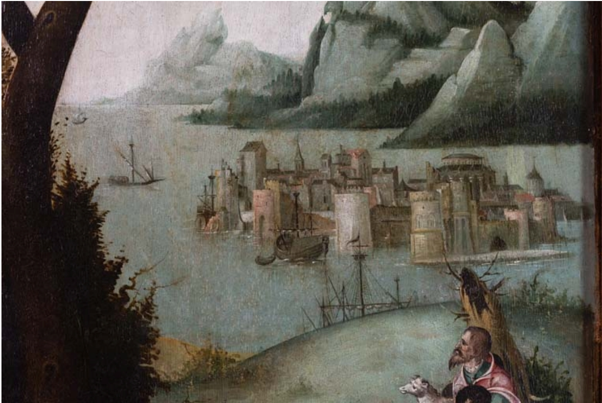
Détail du volet gauche : paysage à l'arrière-plan.