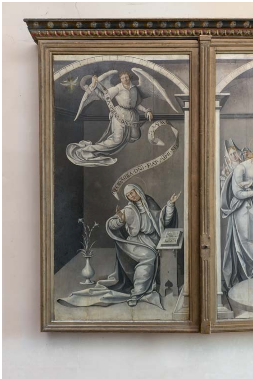
Revers du volet gauche : vue d'ensemble.