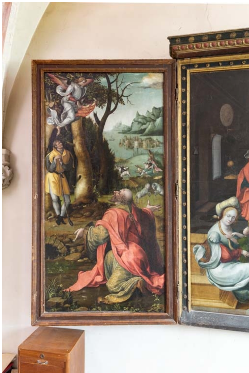
Volet gauche : vue d'ensemble.