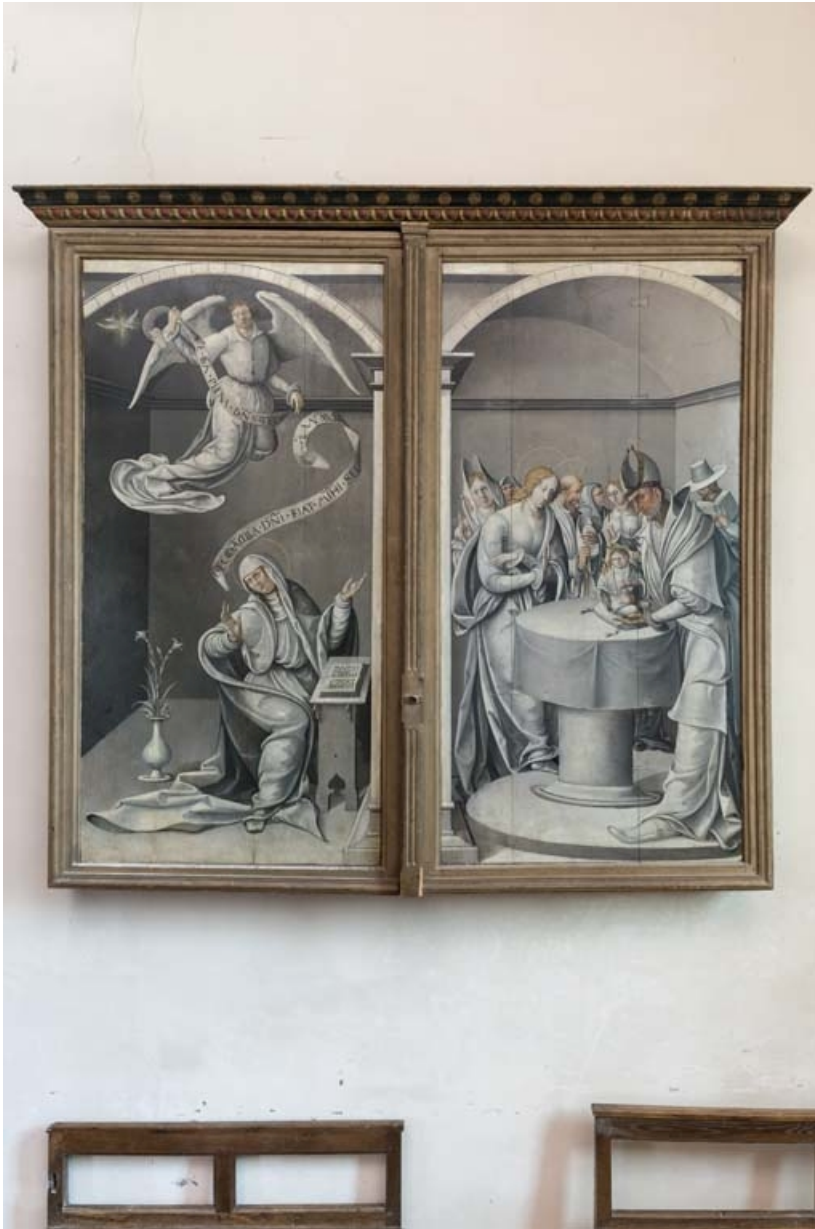
Vue d'ensemble, volets fermés.