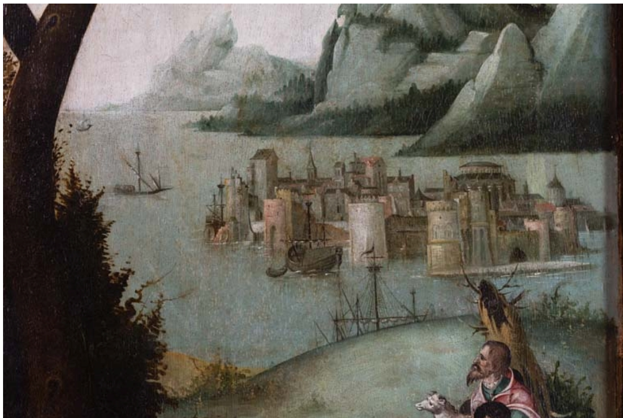
Détail du volet gauche : paysage à l'arrière-plan. 21, Auxey-Duresses