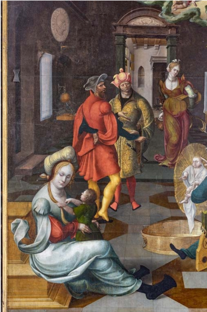
Détail du panneau central : servante/nourrice du premier-plan avec un enfant et deux spectateurs. 21, Auxey-Duresses