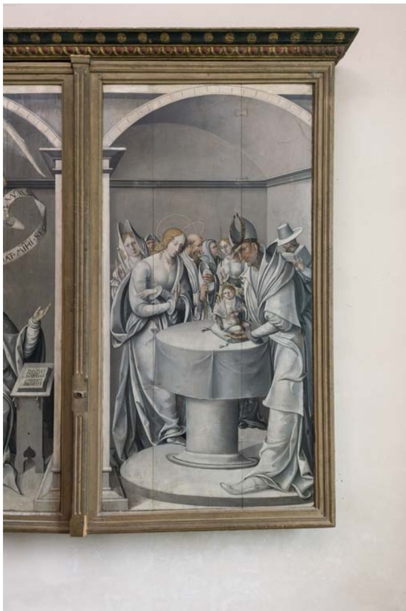
Revers du volet droit : vue d'ensemble.