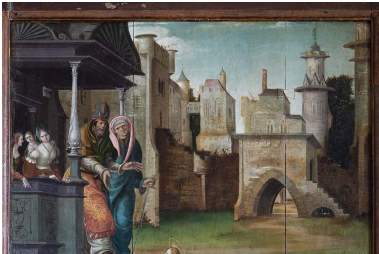
Détail du volet droit : Temple et ville à l'arrière-plan. 21, Auxey-Duresses