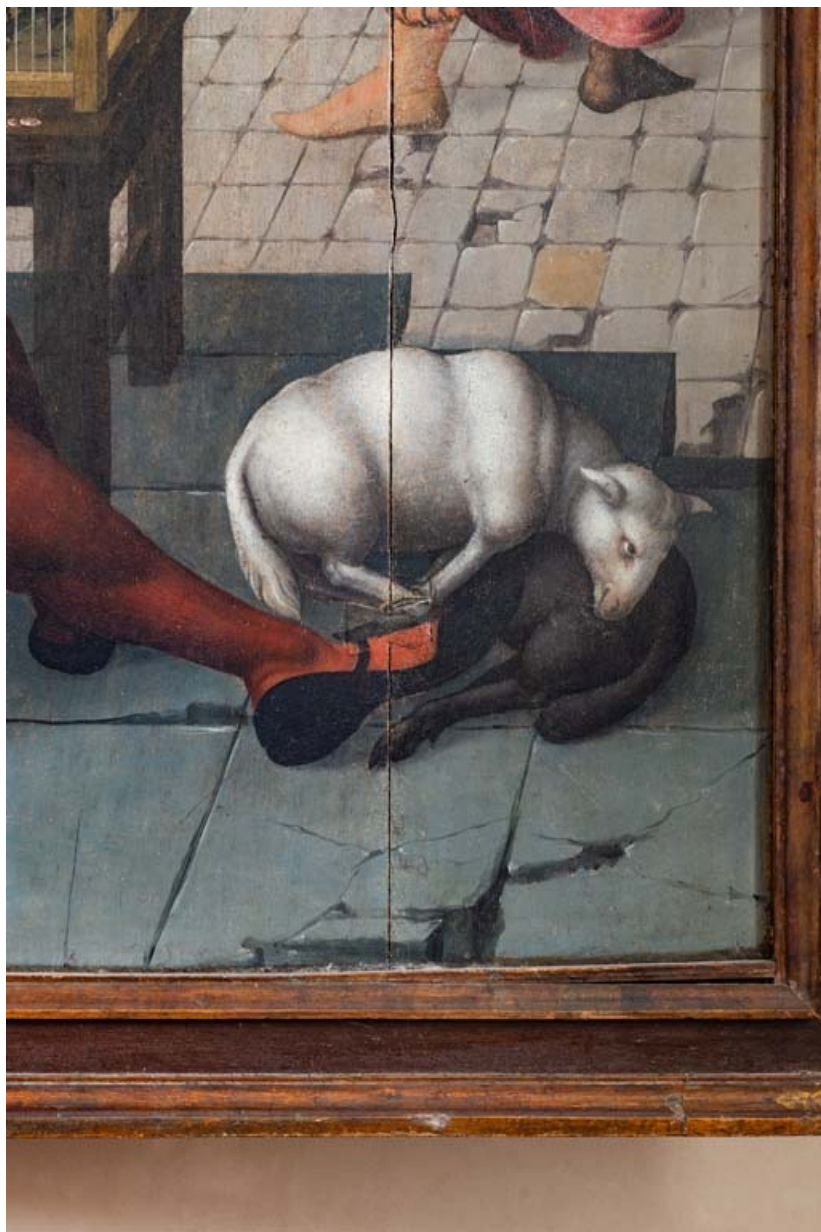
Détail du volet droit : mouton.