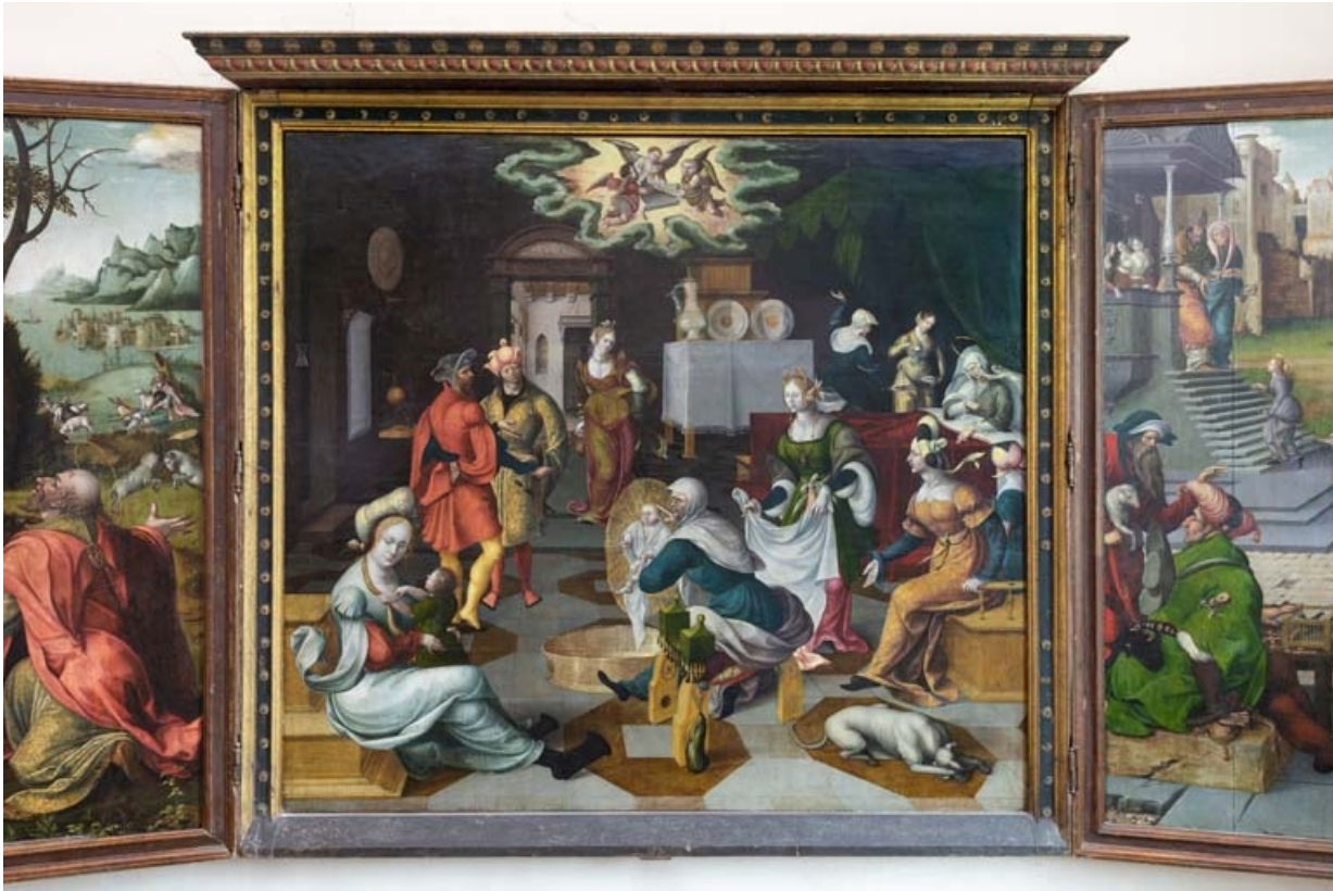
Panneau central : vue d'ensemble.