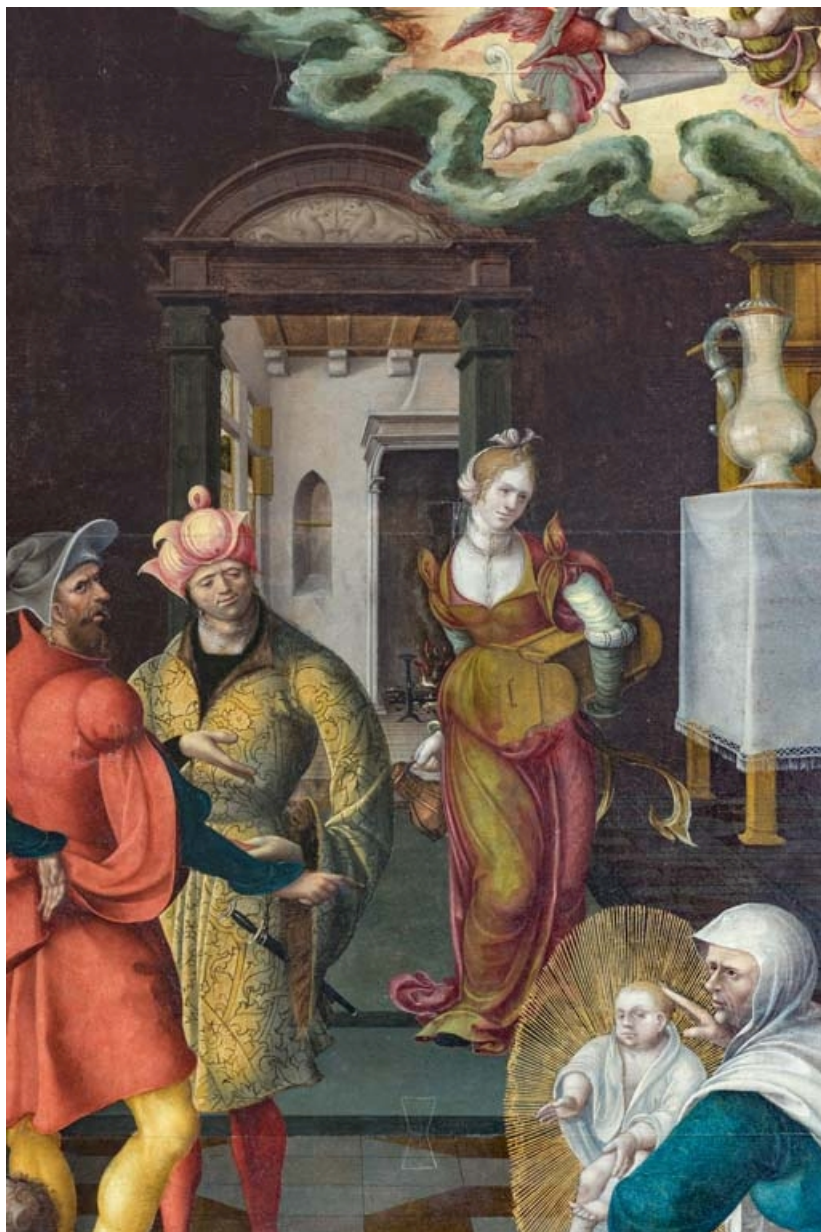
Détail du panneau central : servante et perspective sur la pièce à l'arrière. 21, Auxey-Duresses