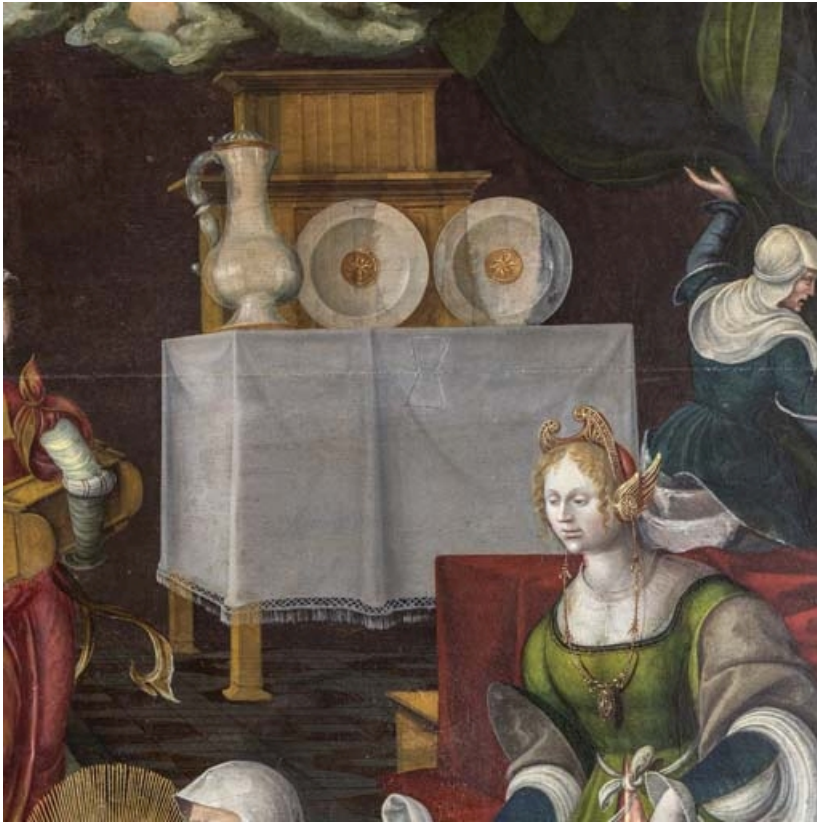
Détail du panneau central : buffet-dressoir. 21, Auxey-Duresses