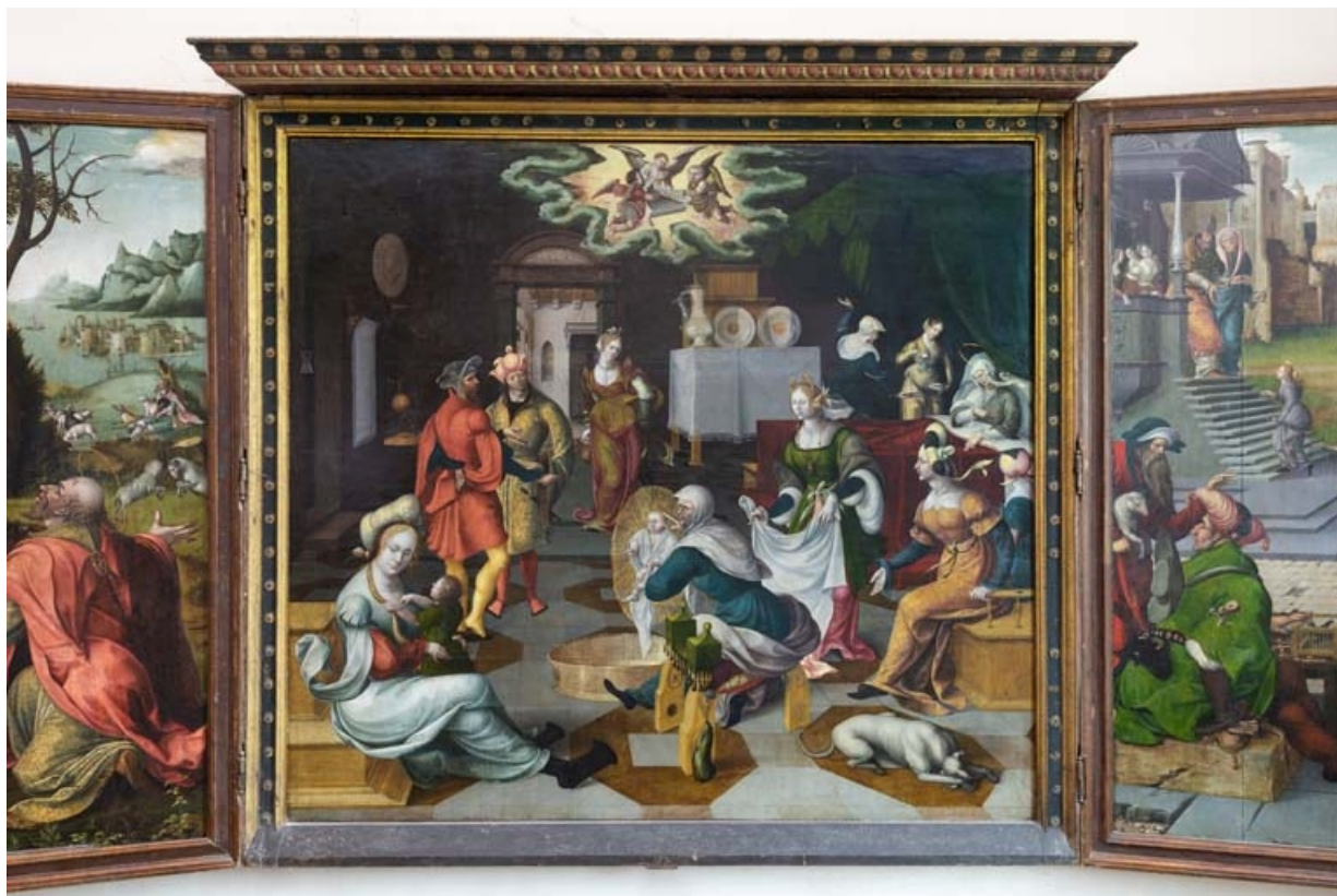
Panneau central : vue d'ensemble.