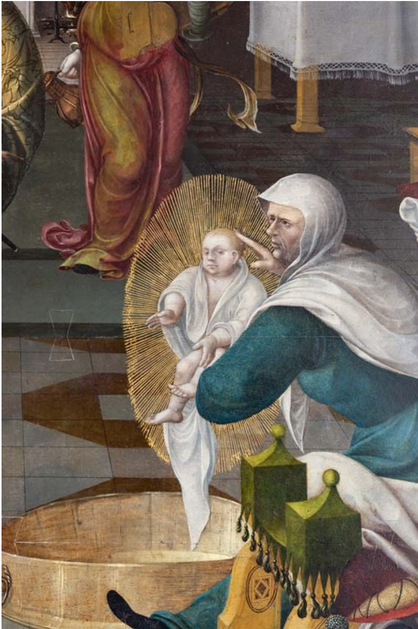
Détail du panneau central : Marie. On remarque un papillon en queue d'aronde. 21, Auxey-Duresses