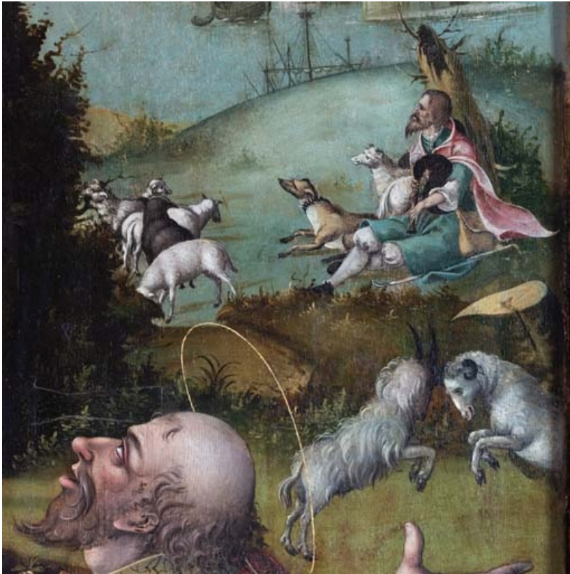
Détail du volet gauche : berger à l'arrière-plan. 21, Auxey-Duresses