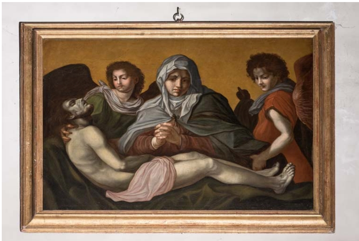
Vue d'ensemble. 21, Auxey-Duresses