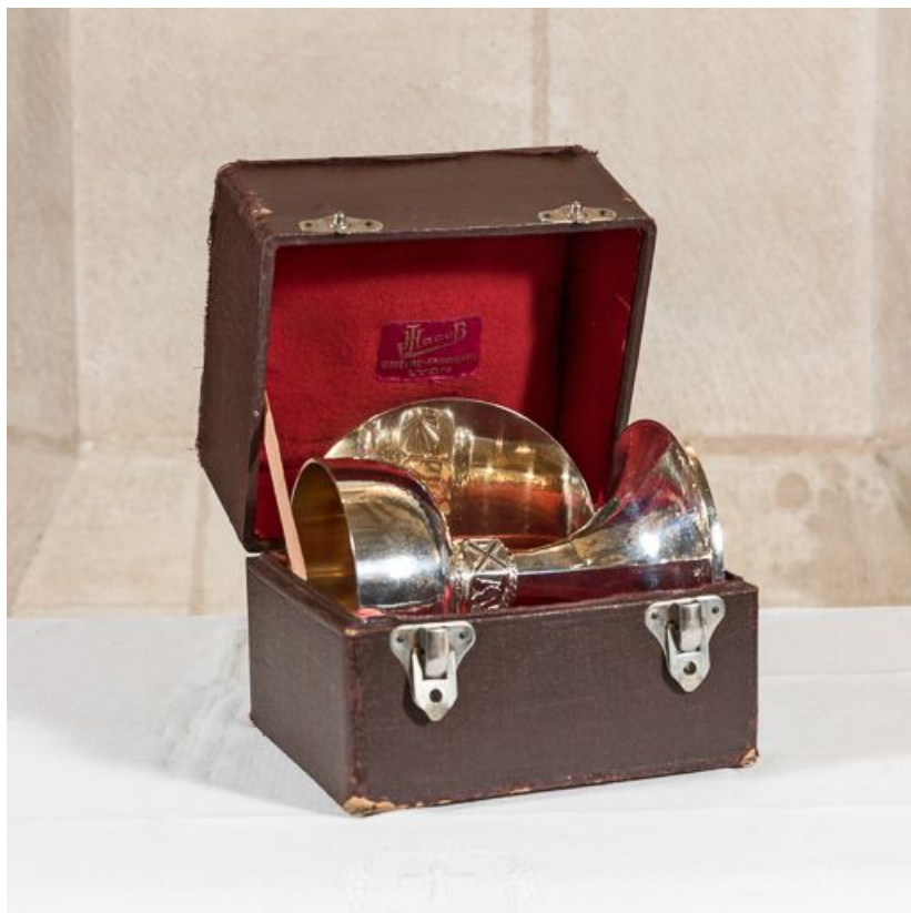
Vue d'ensemble avec le coffre.

21, Meursault place de l' Hôtel-de-Ville