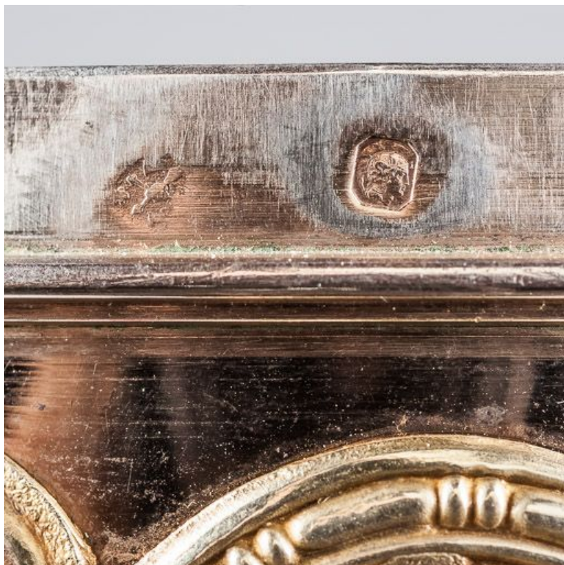
Poinçon sur la lèvre de la coupe.