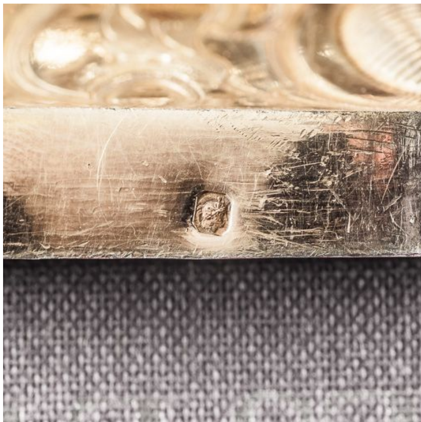
Poinçon sur la base.