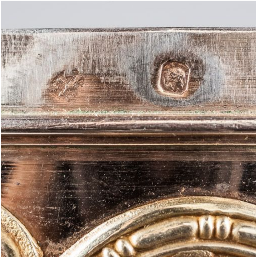
Poinçon sur la lèvre de la coupe.