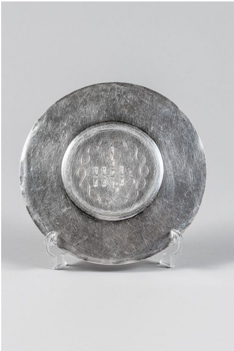
Vue d'ensemble, revers.