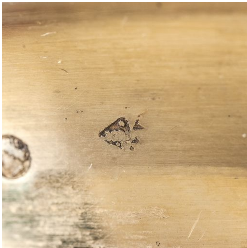
Détail de poinçons sur la lèvre de la coupe.