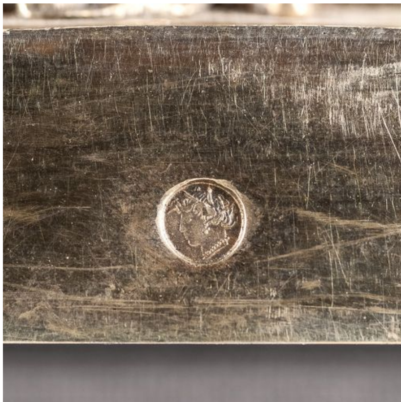
Poinçon sur la base.