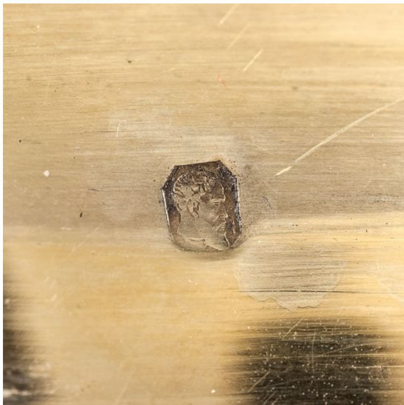
Poinçon sur la lèvre.