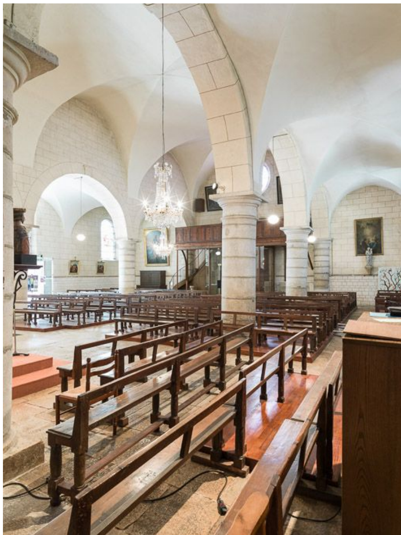
Bancs de la nef et de la chapelle nord.