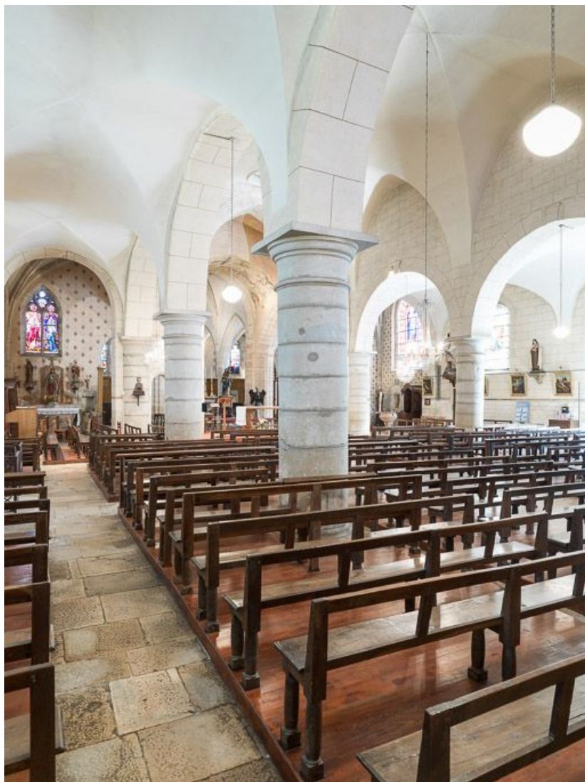
Bancs de la nef, depuis le collatéral nord. 21, Savigny-lès-Beaune