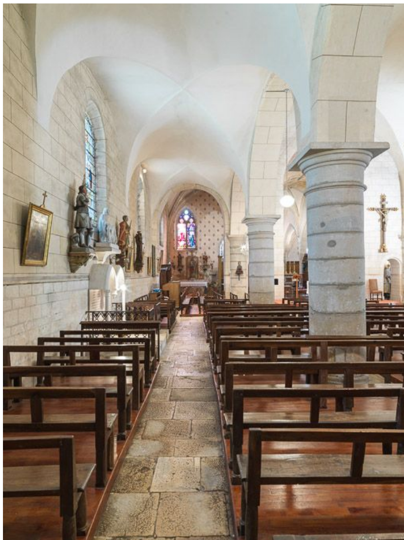
Collatéral nord : rangées de bancs.