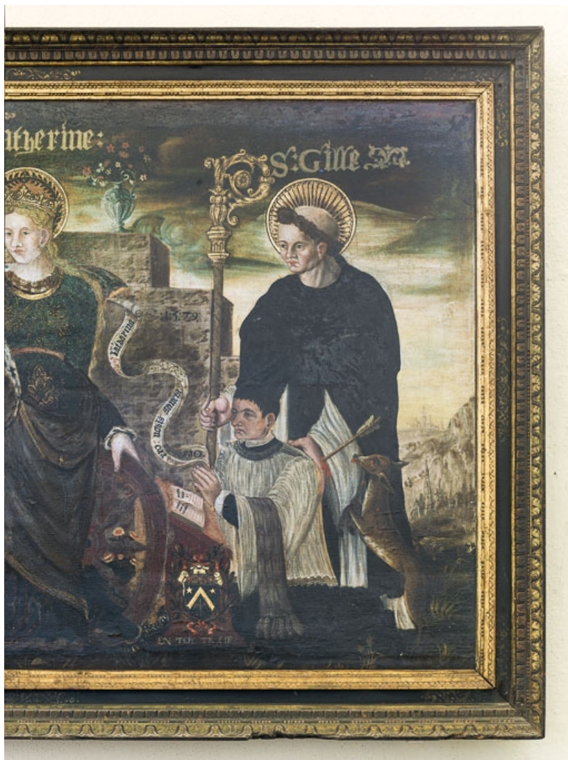
Saint Gilles. 21, Aloxe-Corton