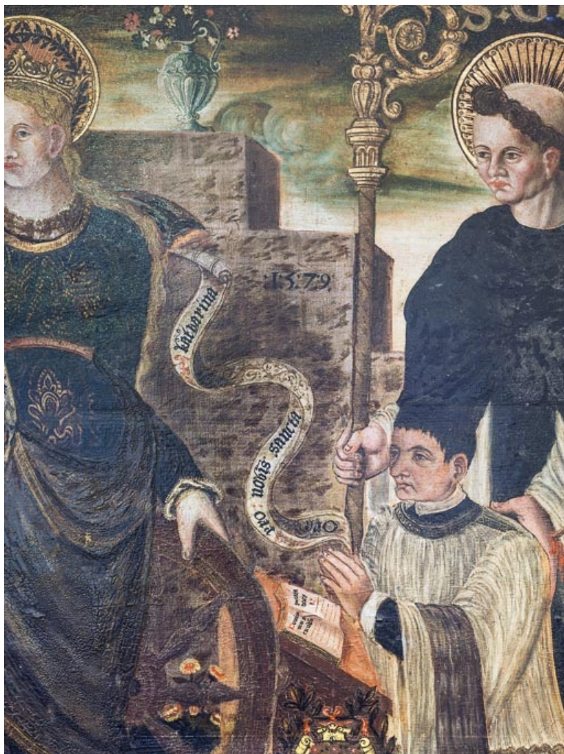
Détail du donateur. 21, Aloxe-Corton