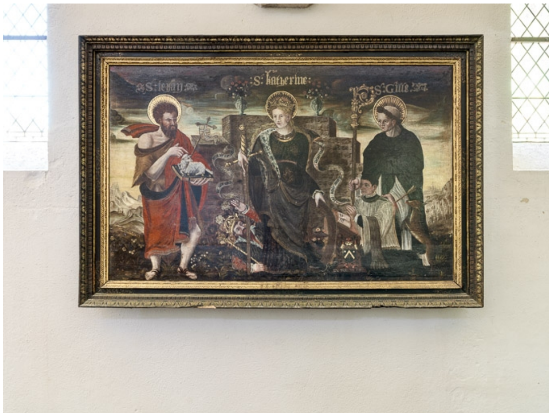
Vue d'ensemble. 21, Aloxe-Corton