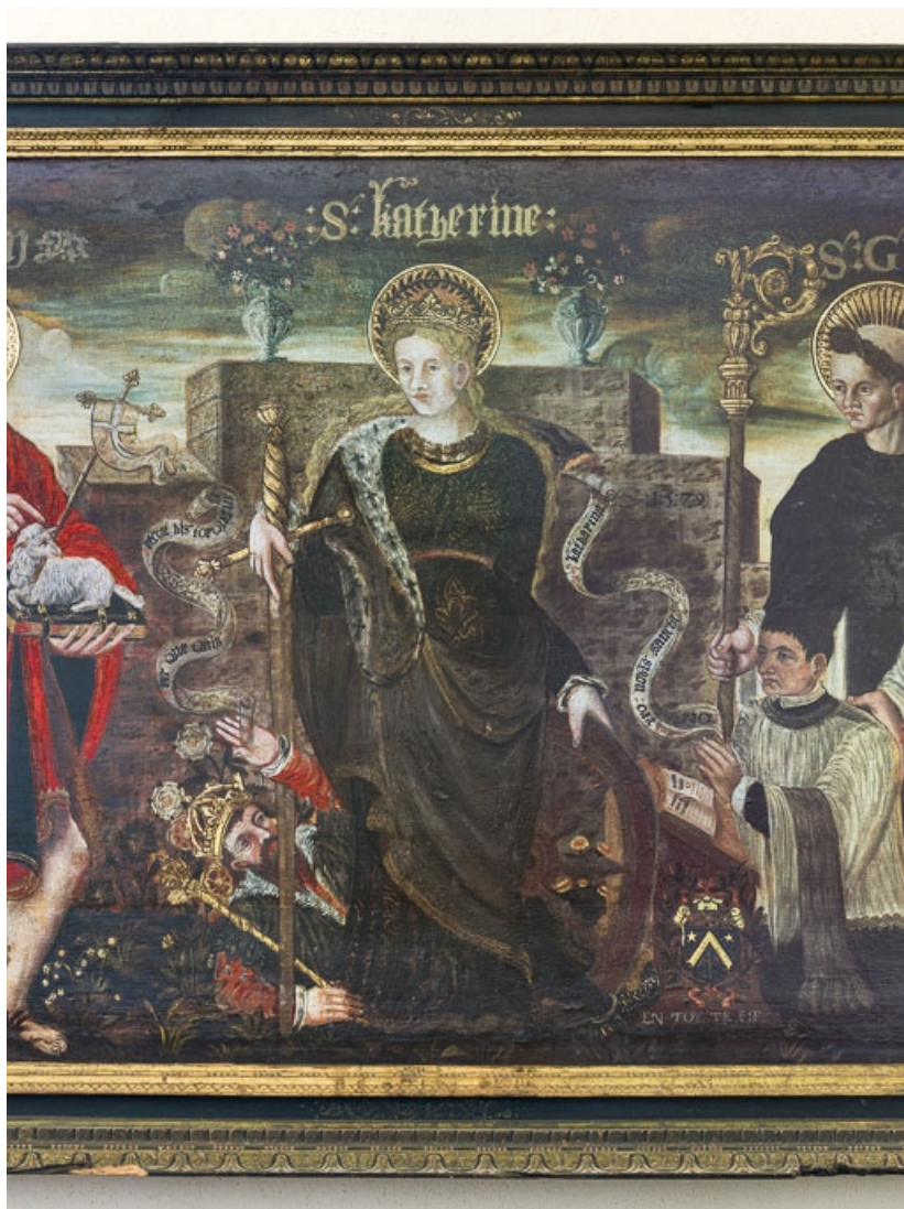
Sainte Catherine. 21, Aloxe-Corton