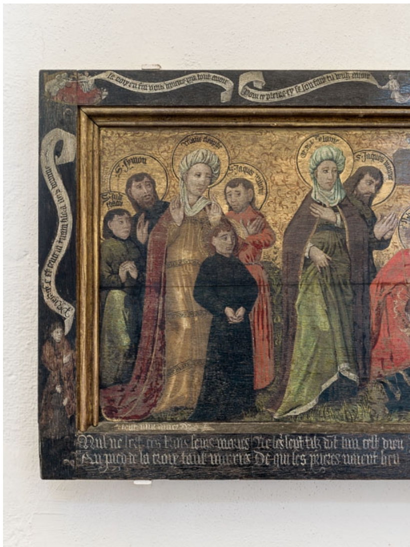
Détail de la partie gauche.