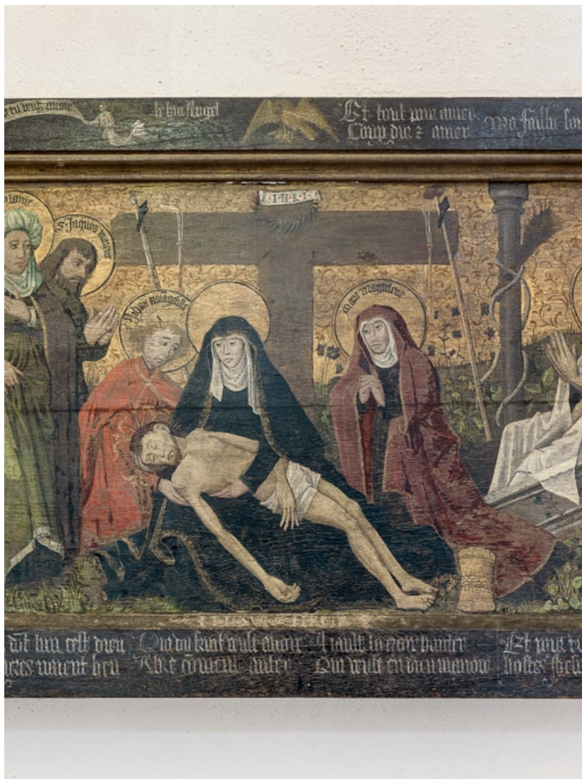
Détail de la partie centrale.