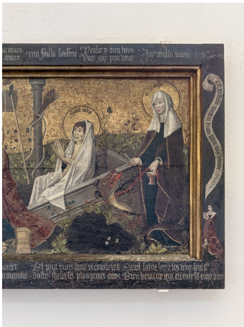
Détail de la partie droite.