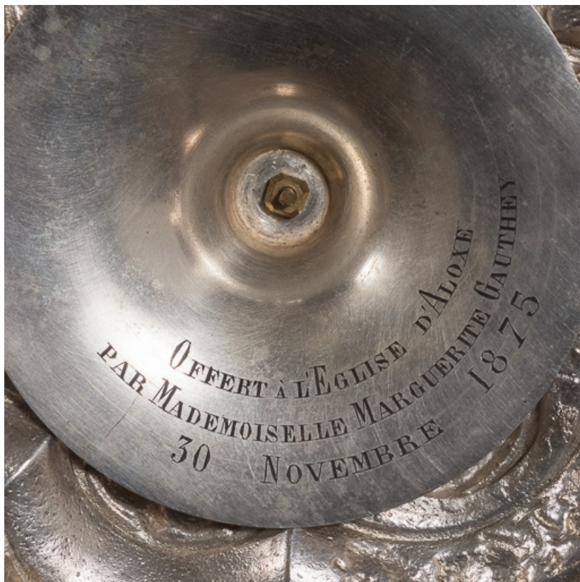
Détail de l'inscription sous le pied.