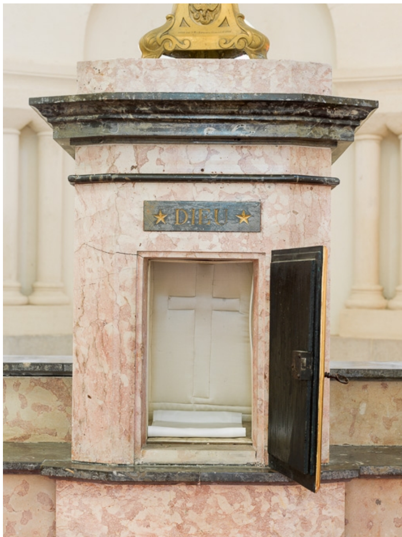
Tabernacle du maître-autel.

21, Aloxe-Corton, Allée Jules-Senard-Louis-Latour