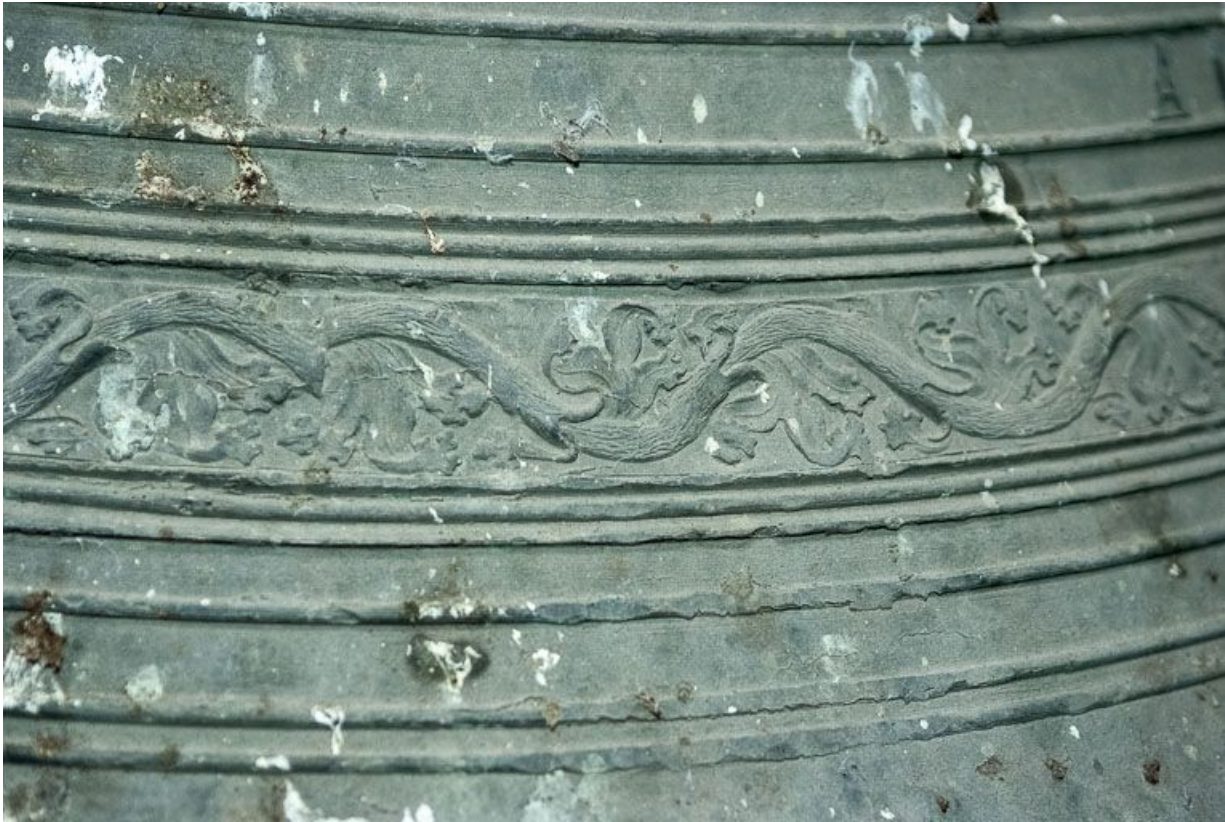
Détail de la frise.