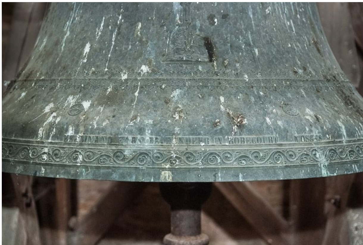
Détail de l'inscription du fondeur.