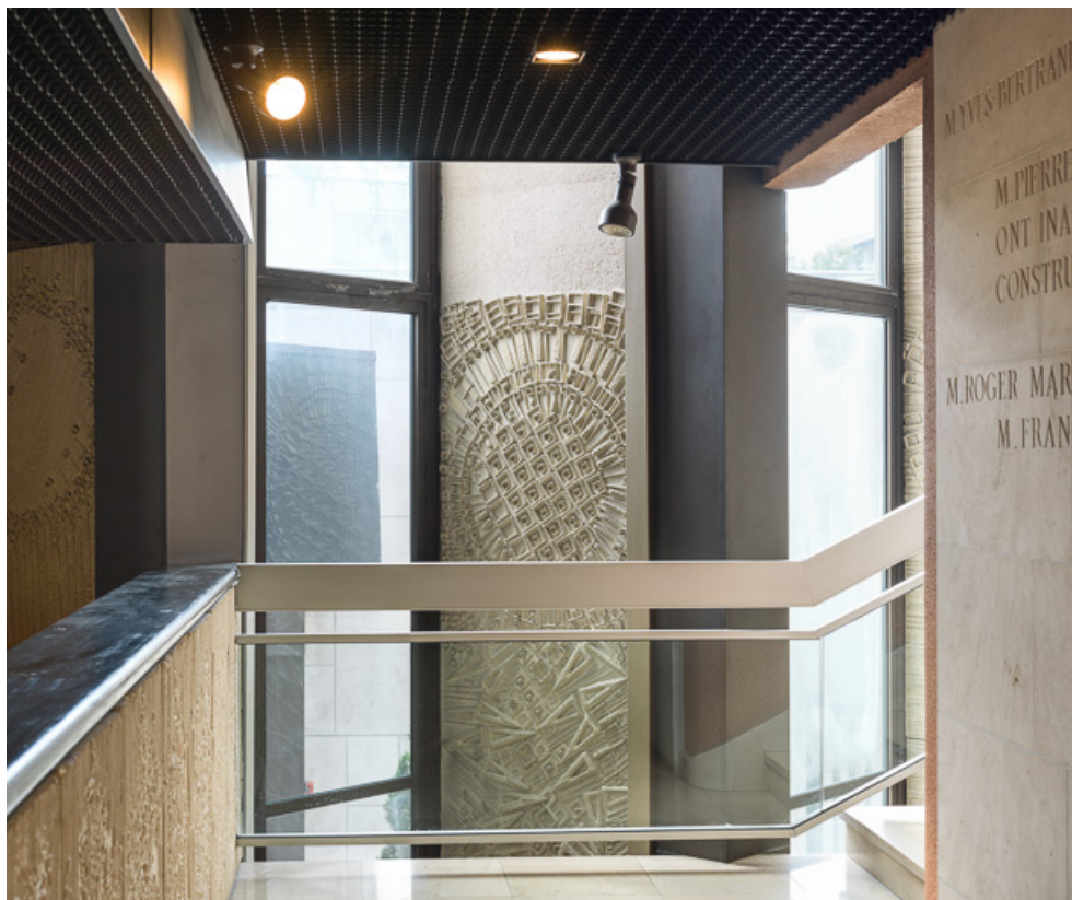
Hall d'accueil : panneaux moulés de la mezzanine. 21, Dijon