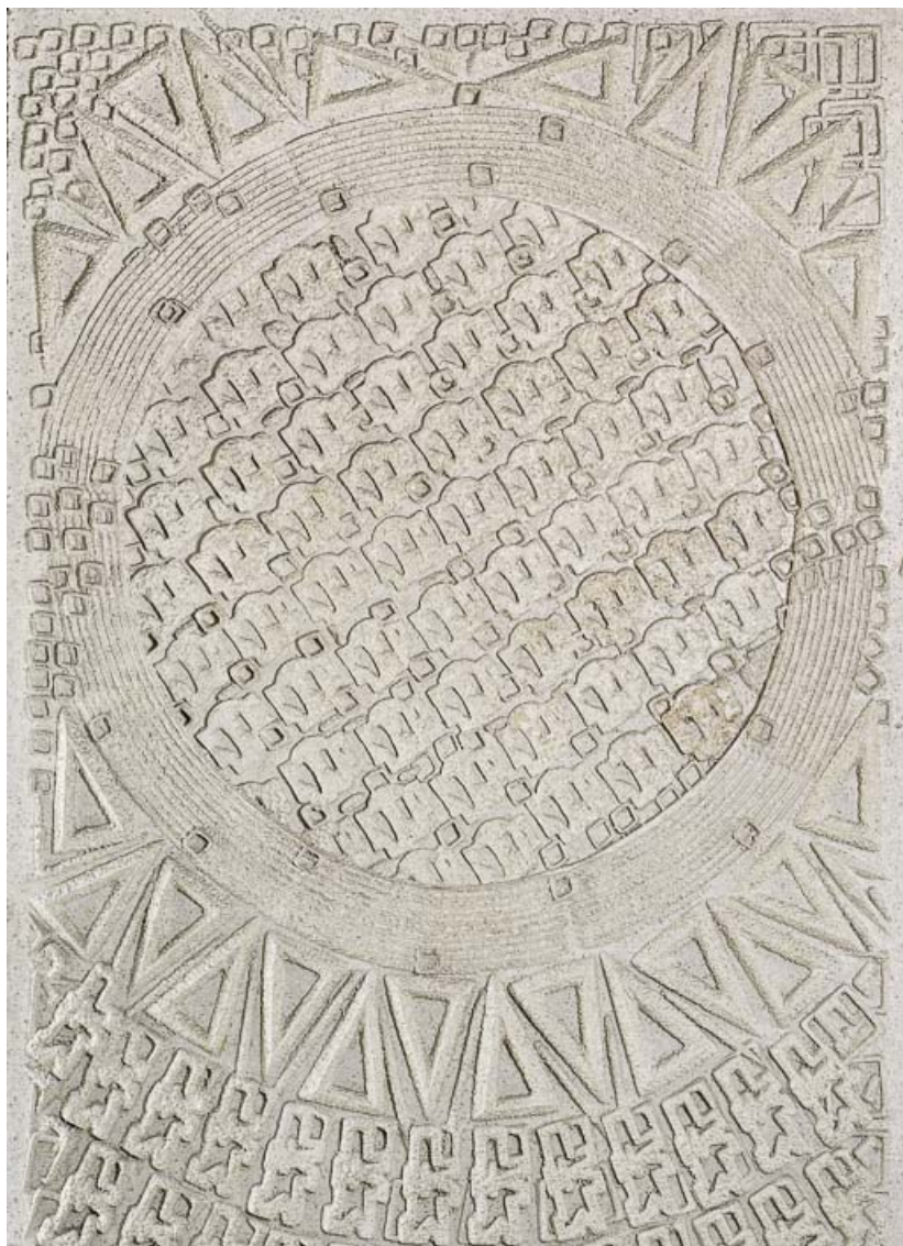
Hall d'accueil : panneaux moulés de la mezzanine, détail. 21, Dijon