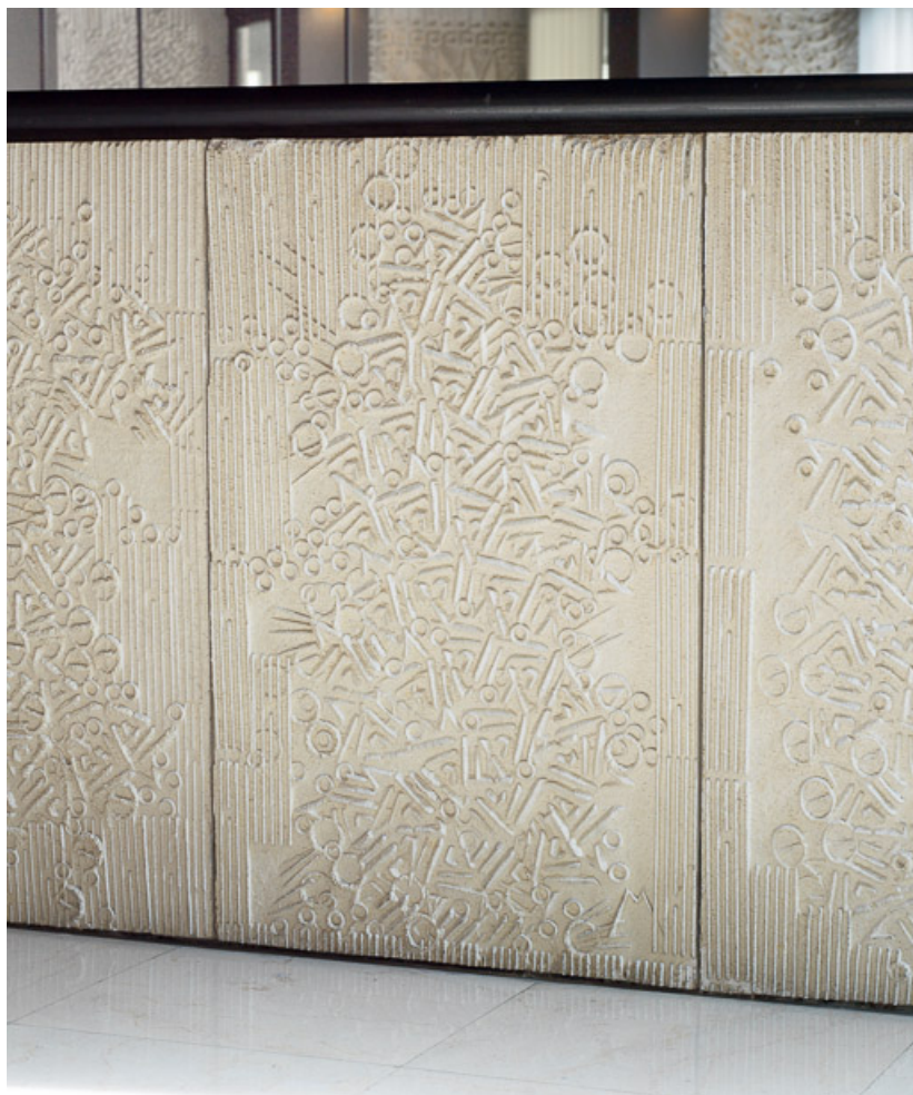
Panneaux moulés de Denis Morog pour le garde-corps de la mezzanine. 21, Dijon