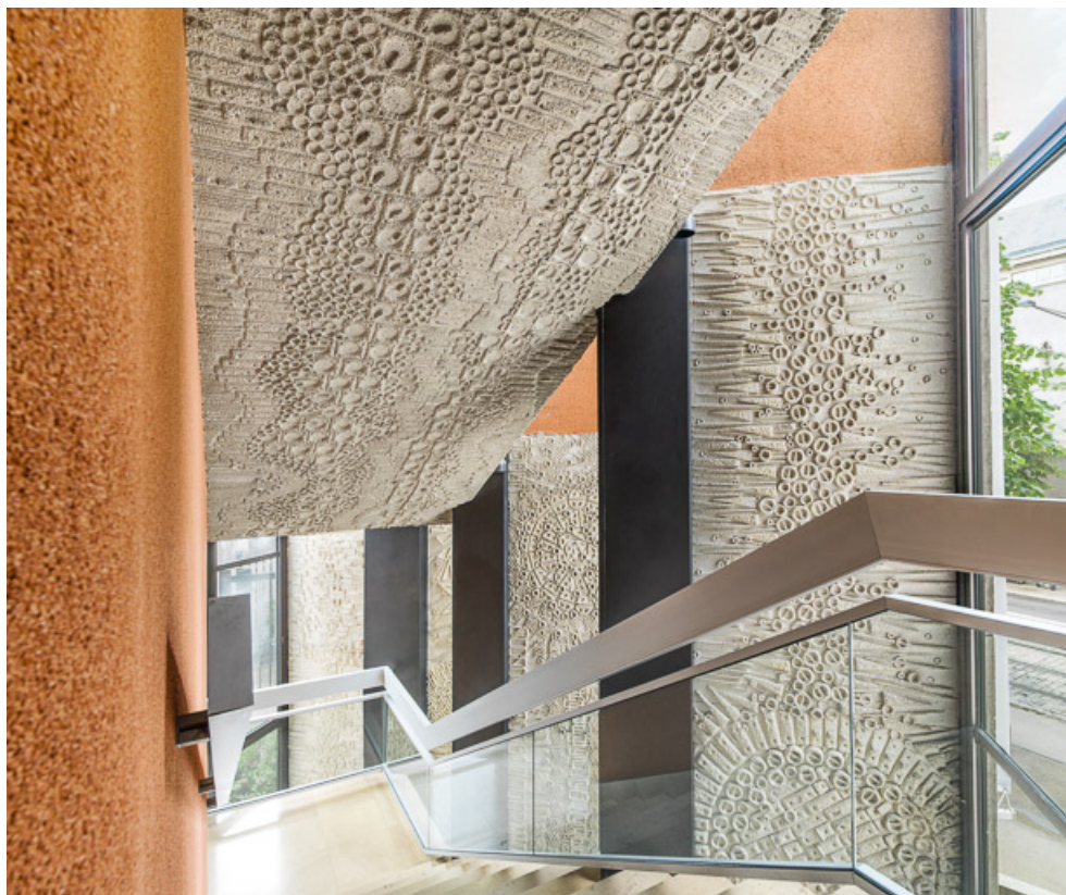
Escalier ouest : vue depuis la mezzanine, avec panneaux moulés de D. Morog. 21, Dijon

N° de l'illustration : 20142102111NUC4AQ