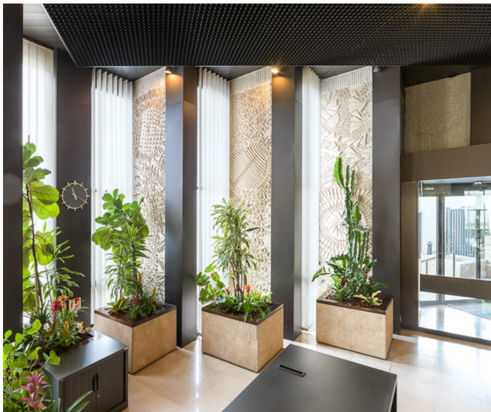
Hall d'accueil : panneaux moulés et jardinières derrière la banque d'accueil. 21, Dijon