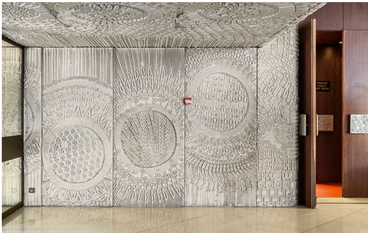
Hall d'accueil : panneaux moulés à l'entrée. 21, Dijon