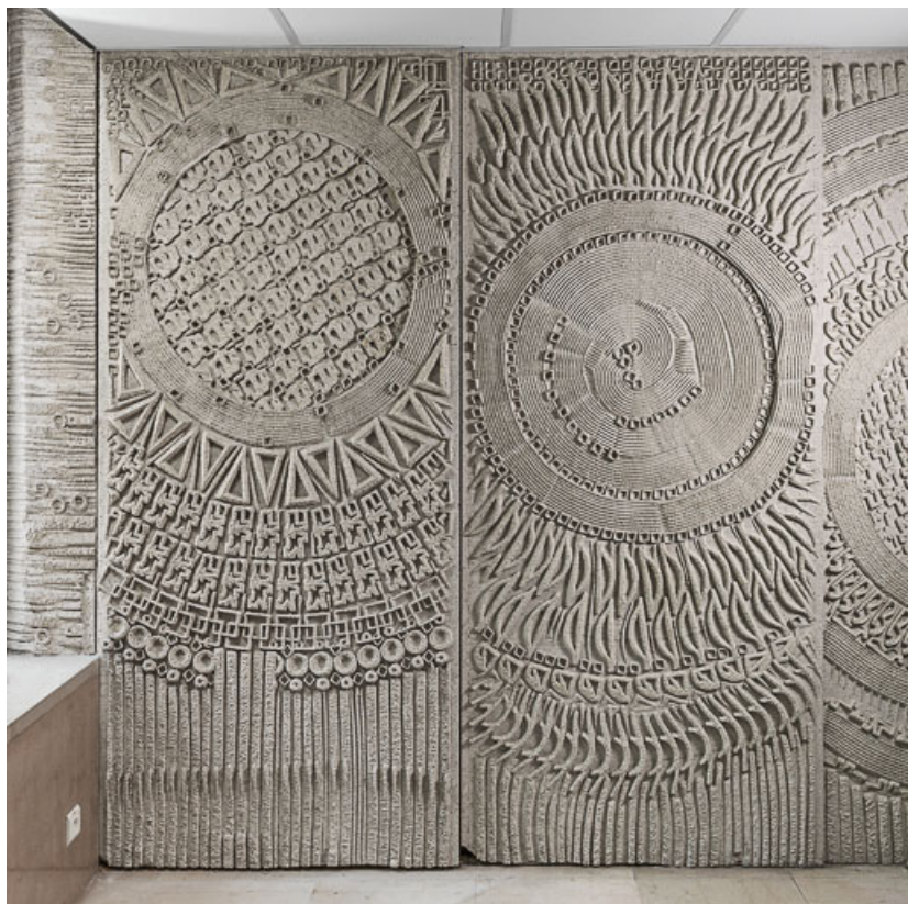
Hall d'accueil : panneaux moulés de la mezzanine. 21, Dijon