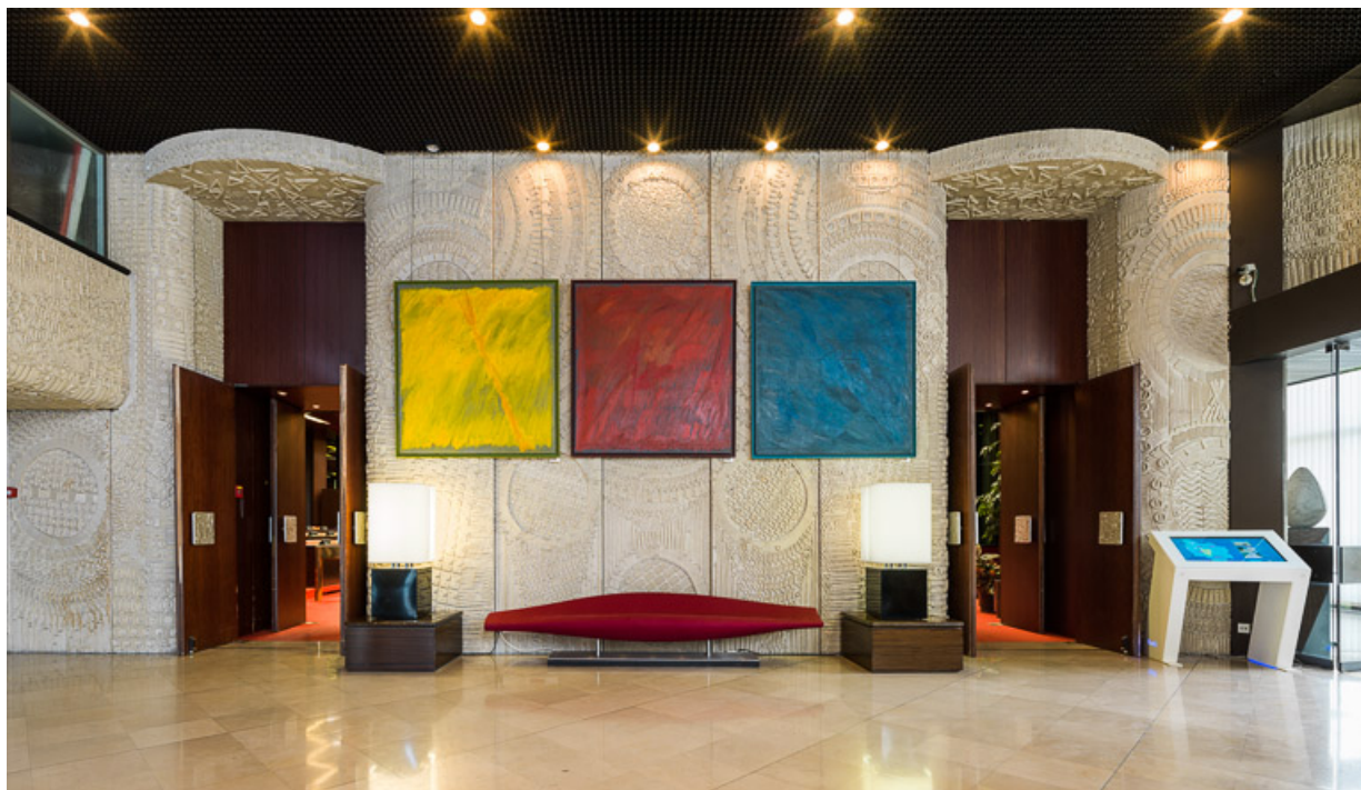
Hall d'accueil : vue générale avec les deux accès à la salle des Assemblées. 21, Dijon

N° de l'illustration : 20142102138NUC4AQ