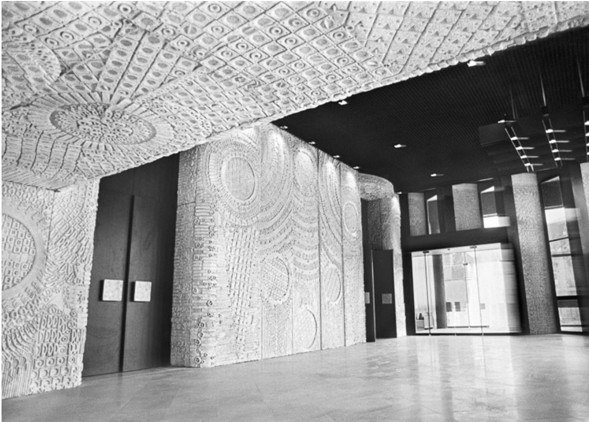
Hôtel de région : hall d'accueil (Photographie ancienne, ca. 1980). 21, Dijon