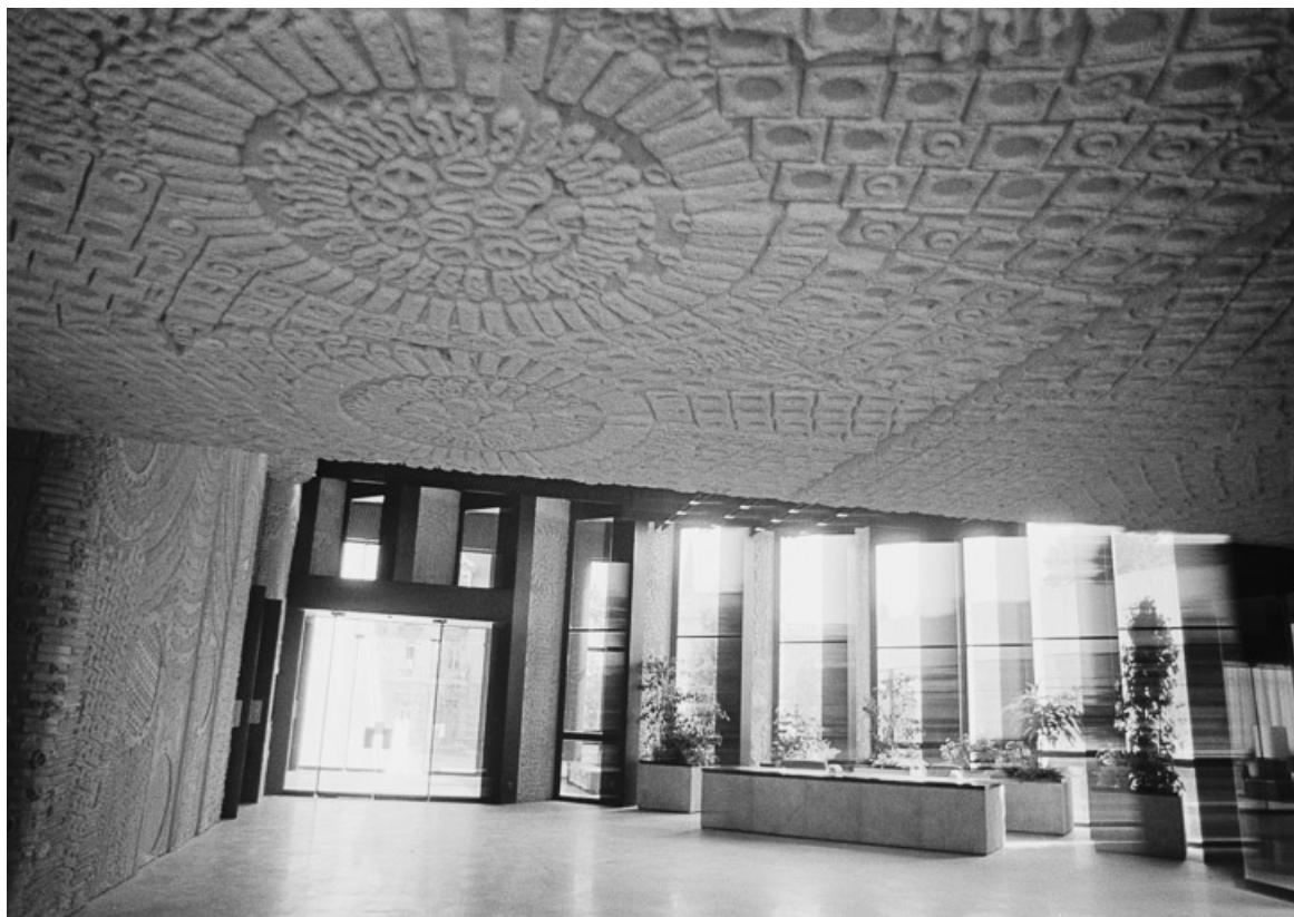
Hôtel de région : hall d'accueil (Photographie ancienne, ca. 1980). (Archives du quotidien Le Bien Public, Dijon) 21, Dijon