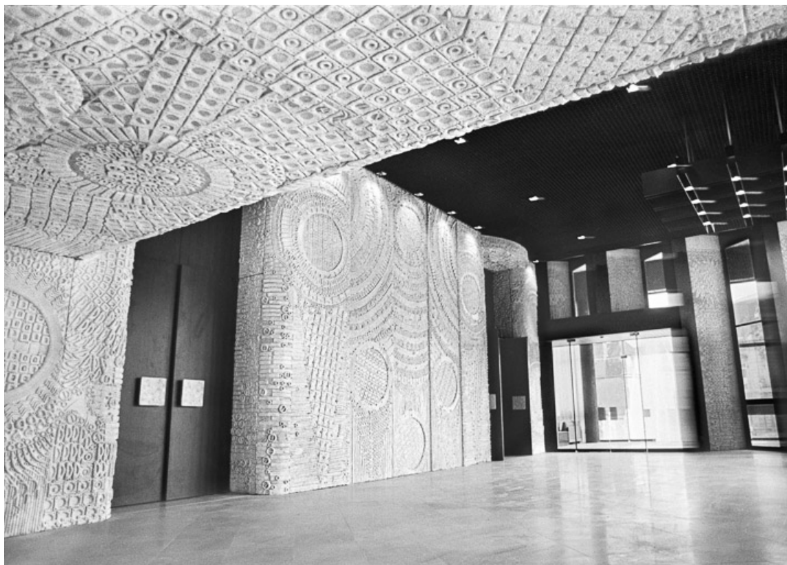
Hôtel de région : hall d'accueil (Photographie ancienne, ca. 1980). (Archives du quotidien Le Bien Public, Dijon) 21, Dijon