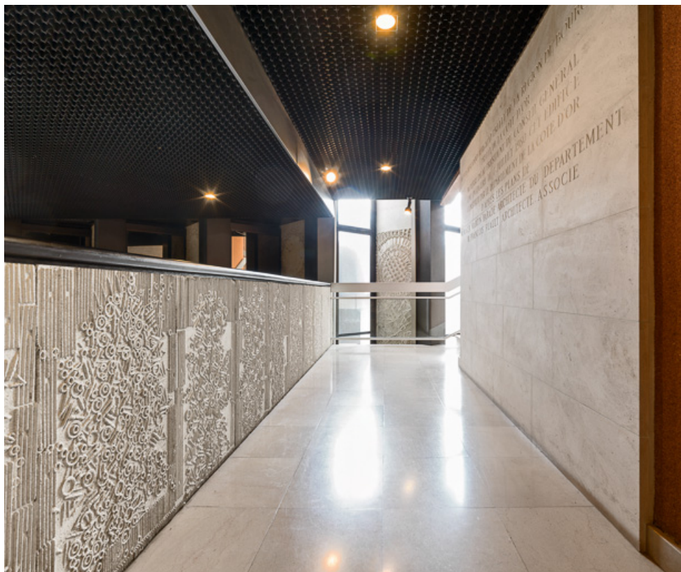
Hall d'accueil : panneaux de la mezzanine et à droite, plaque commémorative de l'inauguration. 21, Dijon