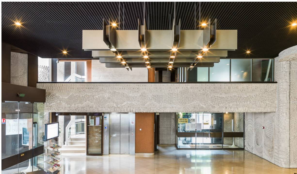
Vue d'ensemble du hall d'accueil.