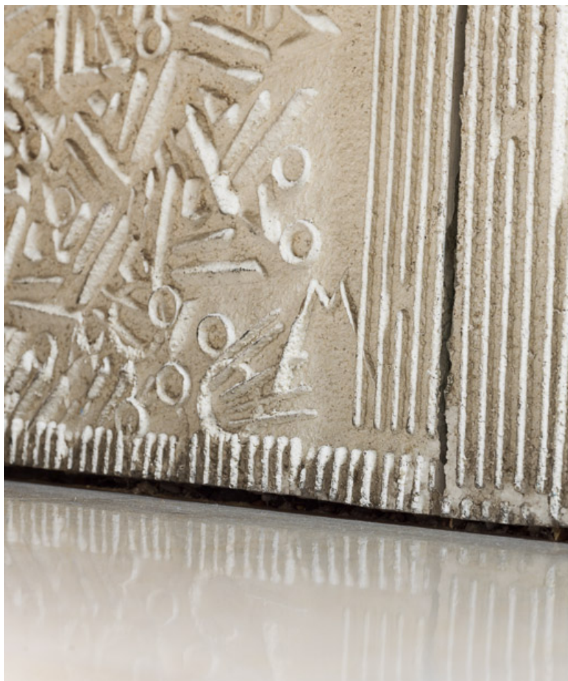
Détail d'un des panneaux moulés de la mezzanine avec la signature de Denis Morog : M. 21, Dijon