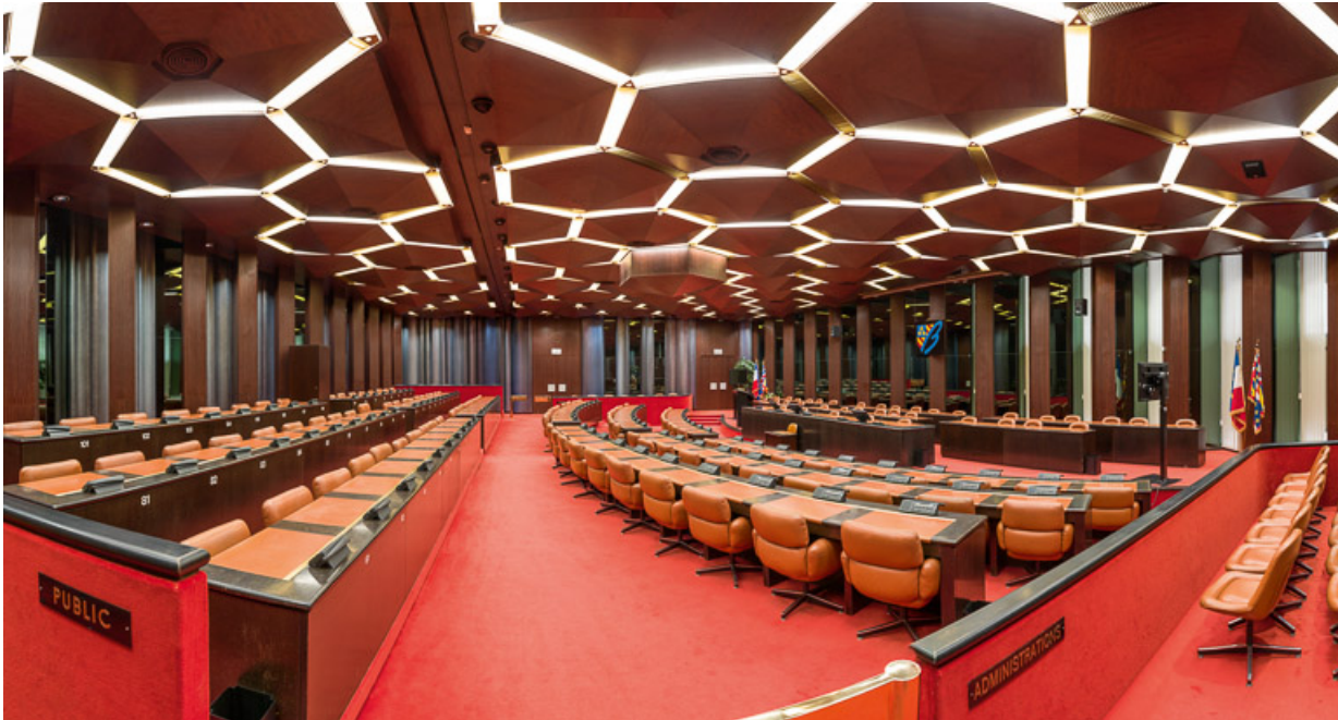
Vue panoramique de la salle des Assemblées. 21, Dijon

N° de l'illustration : 20142102159NUC4AQ