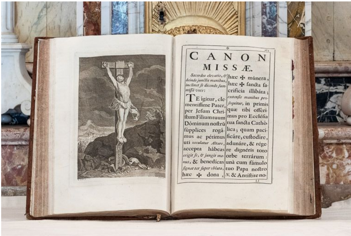
Missel : gravure du Christ en croix.