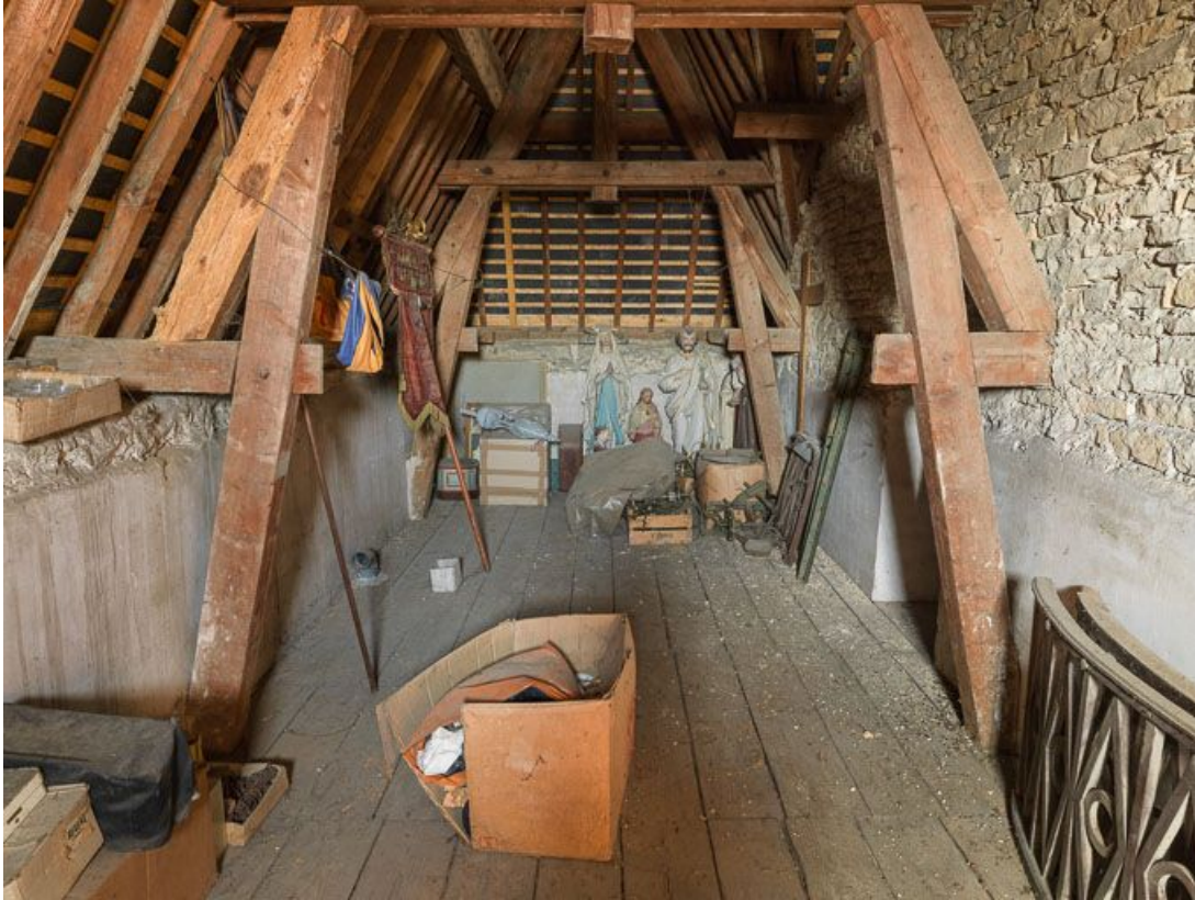
Dépôt d'objets dans les comble de la mairie.