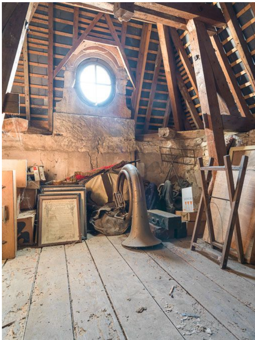
Dépôt d'objets dans les combles de la mairie.