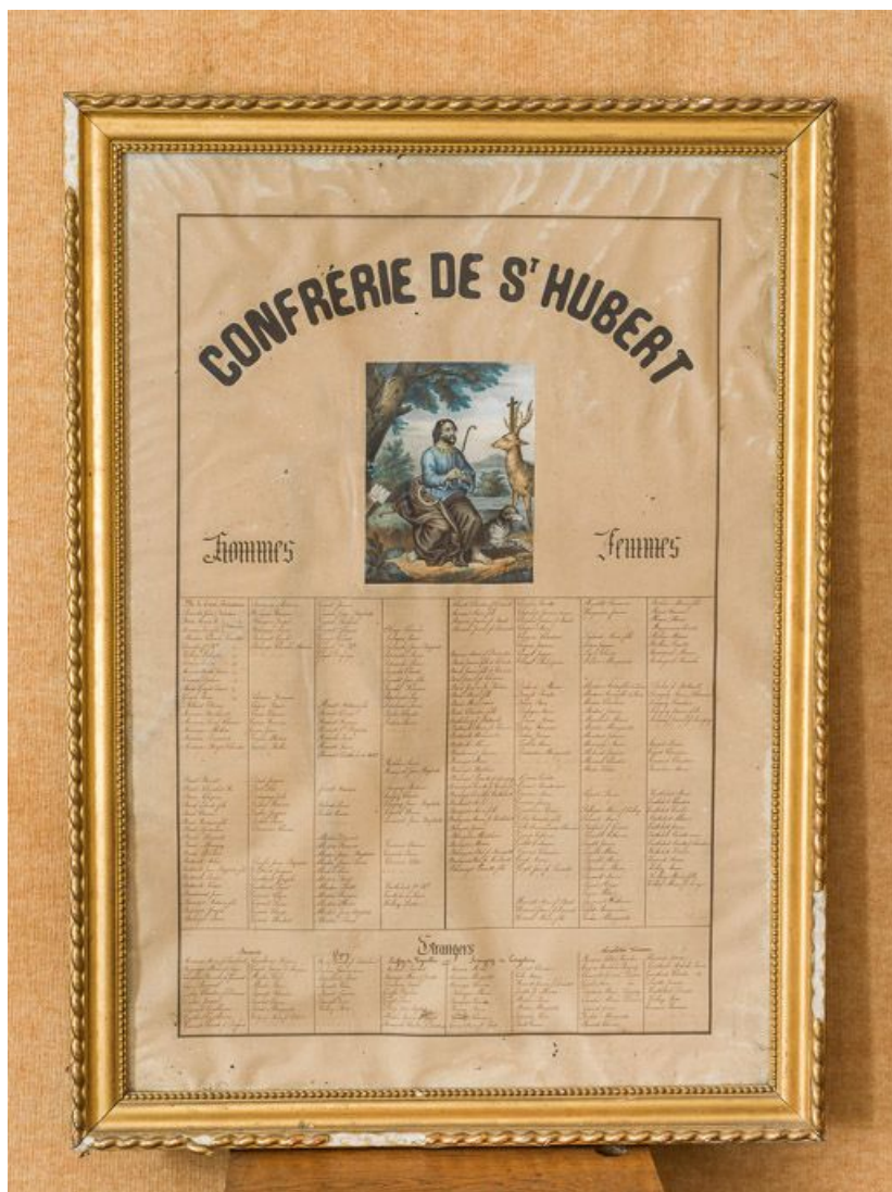
Vue d'ensemble du cadre de la confrérie de saint Hubert.