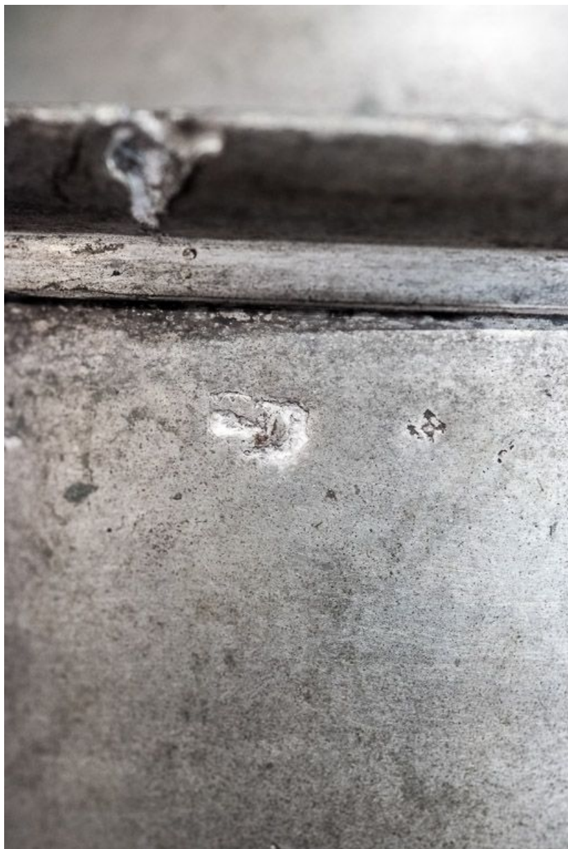
Détail de la croix de procession (poinçon effacé ?).