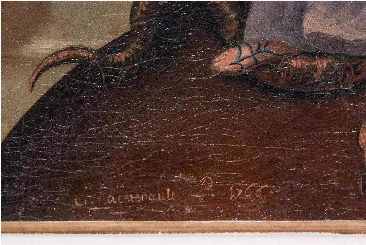
Détail du tableau de la Vierge de l'Apocalypse : signature et date. 21, Chorey-les-Beaune