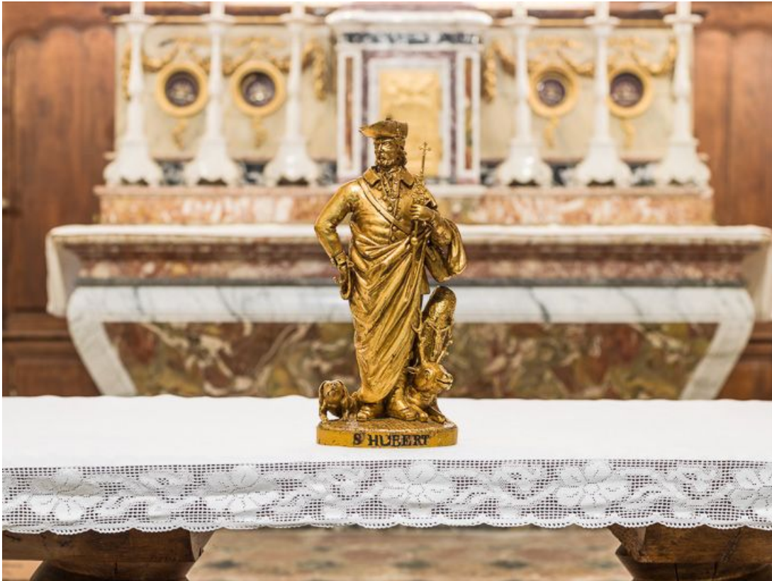
Statue de saint Hubert : vue d'ensemble.