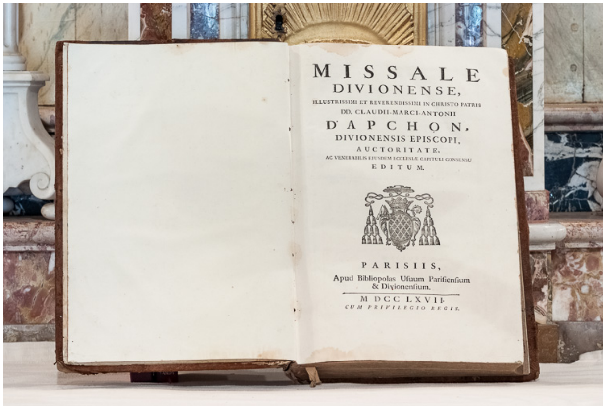
Missel : page de garde.