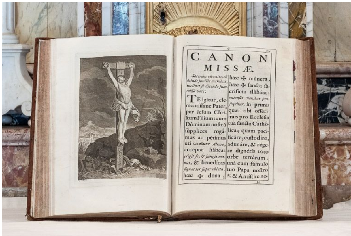
Missel : gravure du Christ en croix.