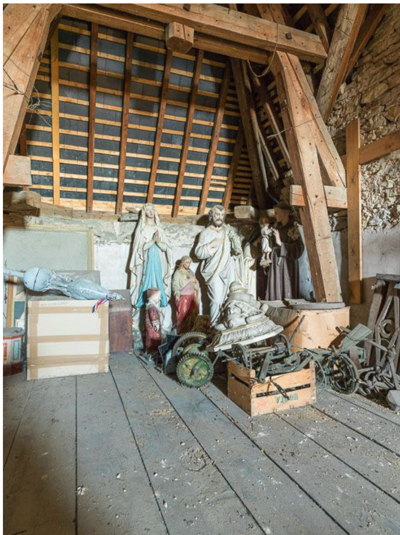
Dépôt d'objets dans les combles de la mairie.