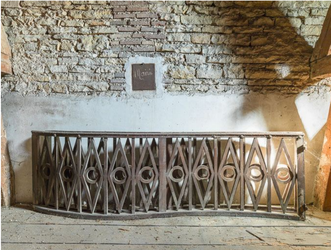
Clôture de chœur déposée : vue d'ensemble. 21, Chorey-les-Beaune