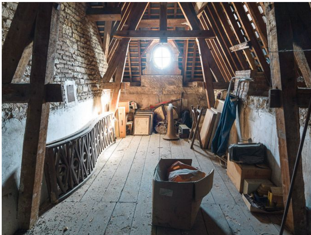
Dépôt d'objets dans les combles de la mairie.