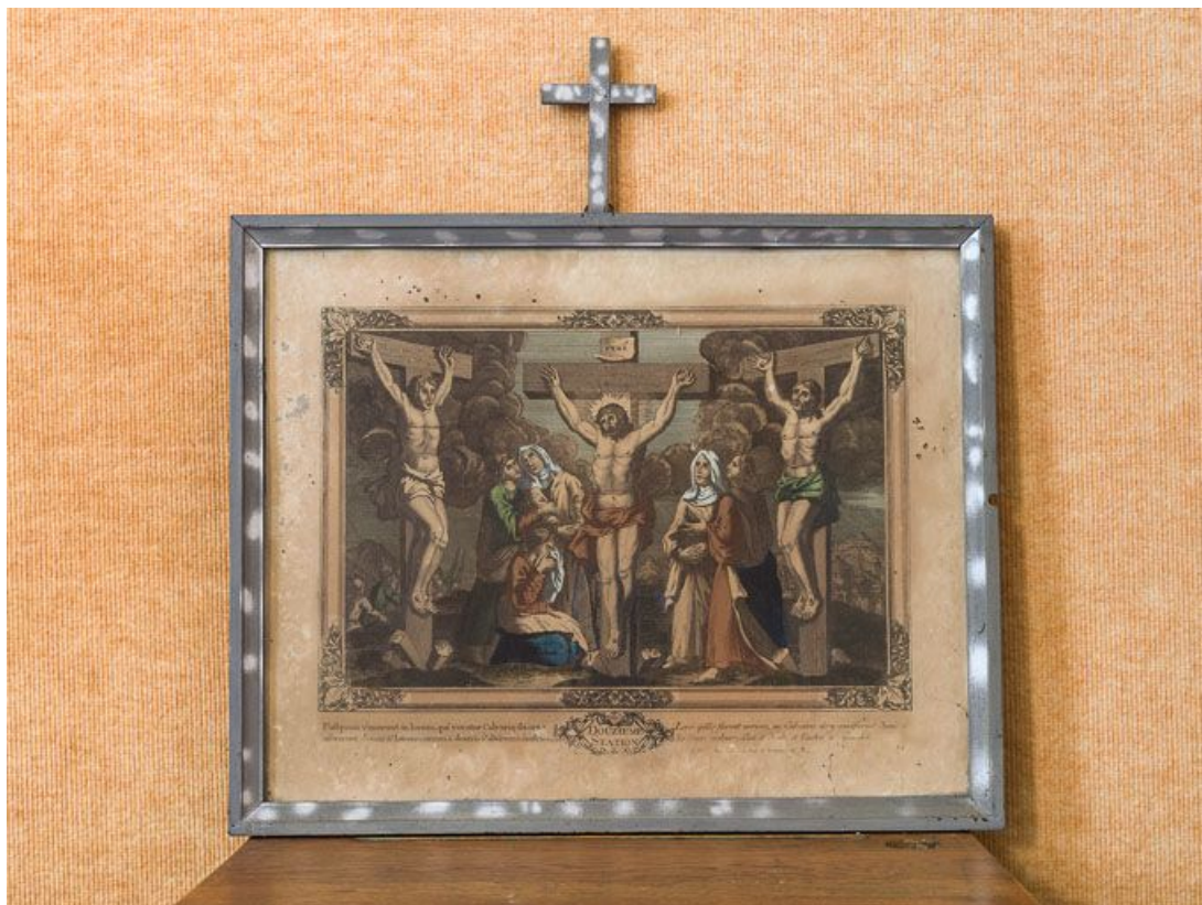
Douzième station : Jésus meurt sur la croix.