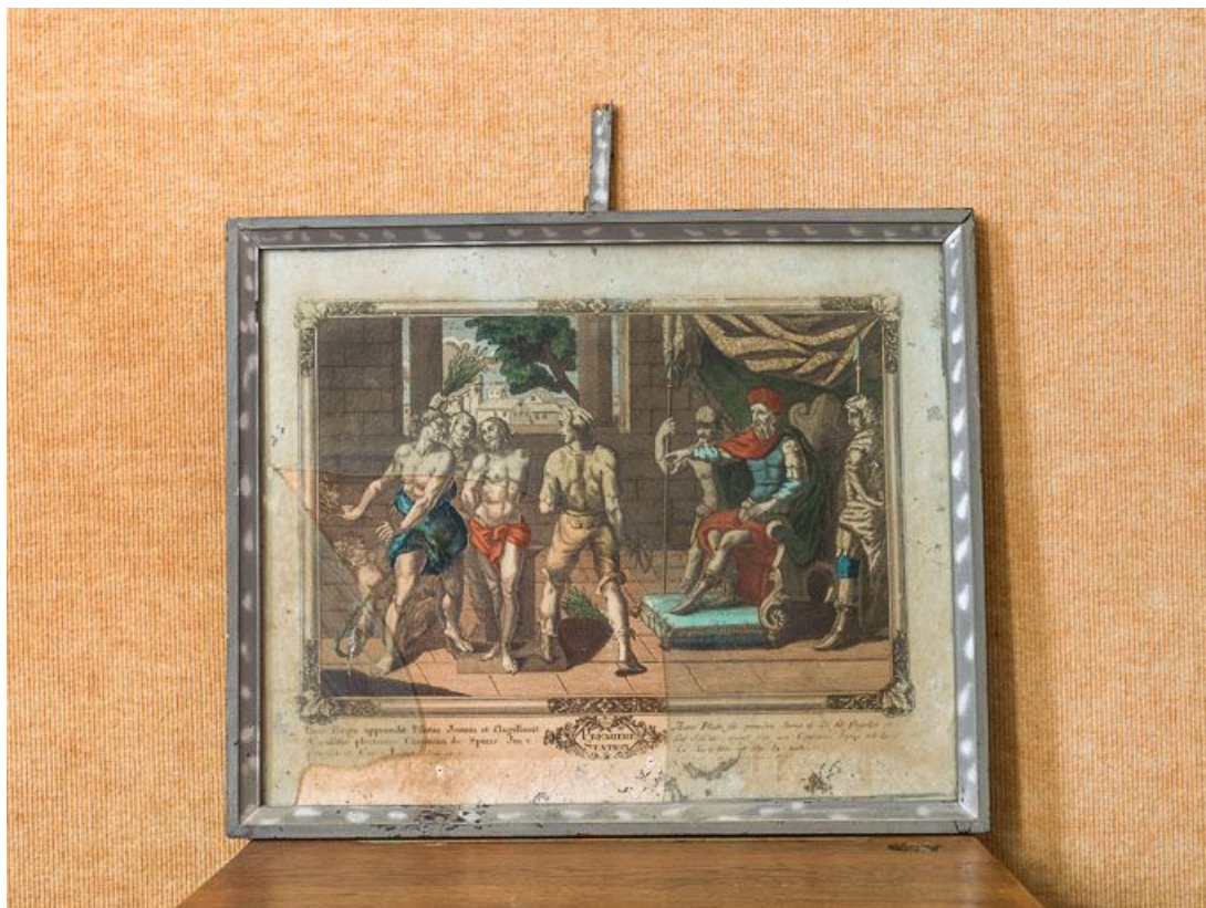
Première station : Jésus est condamné à mort.