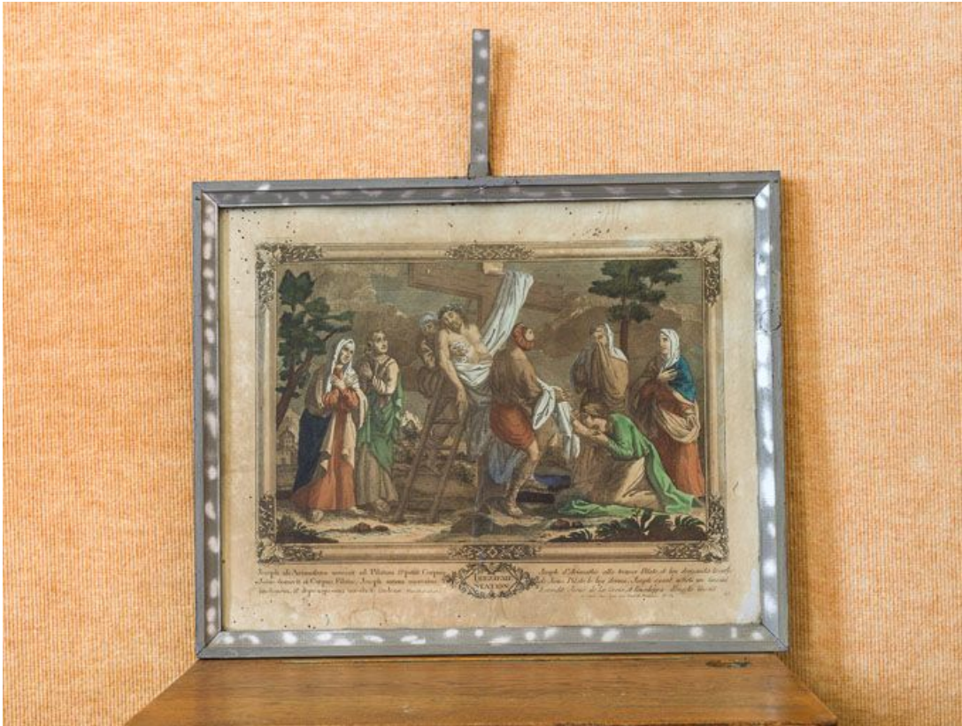
Treizième station : Jésus est descendu de la croix et remis à sa mère.