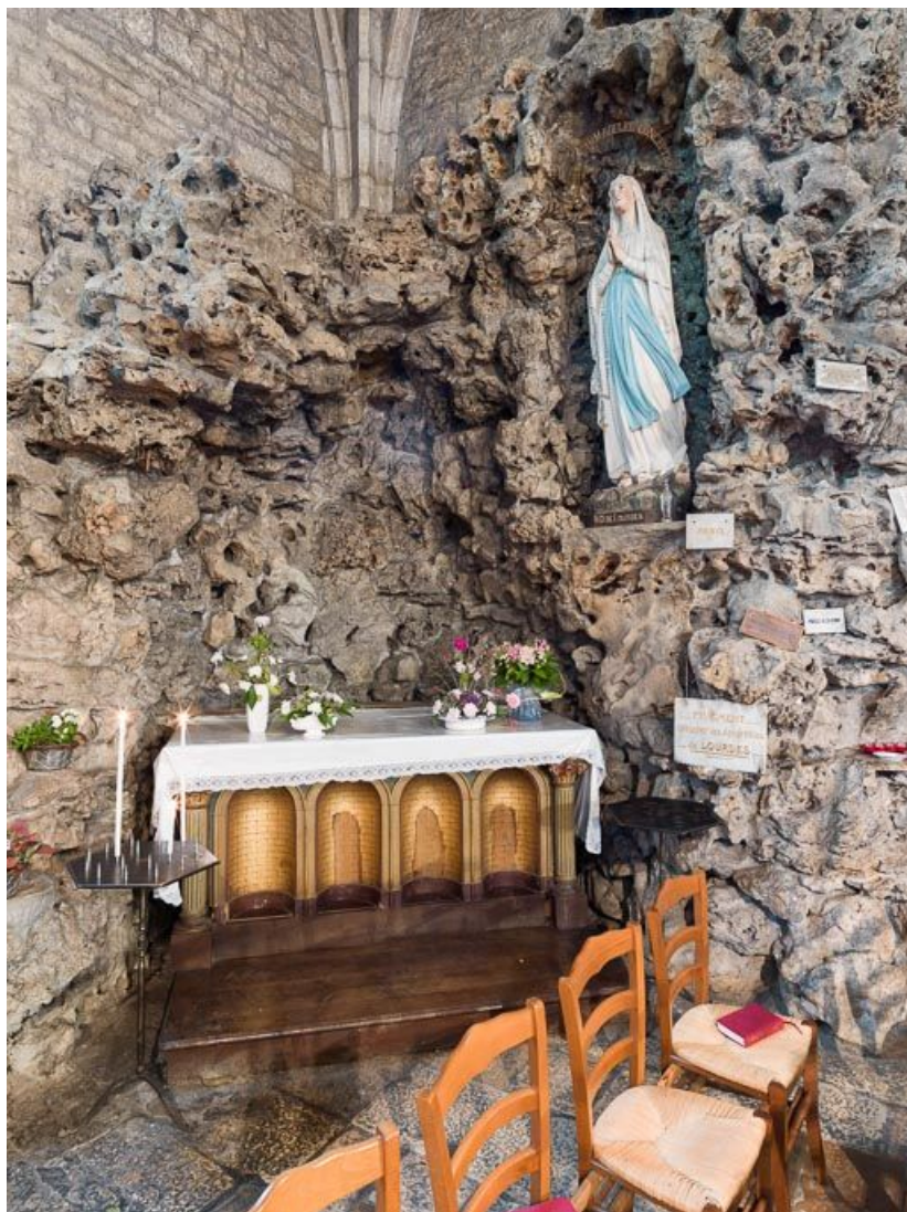
Détail : autel et statue.