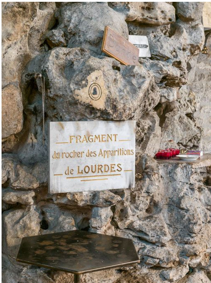
Détail : fragment de la grotte de Massabielle 21, Beaune rue de l' Église