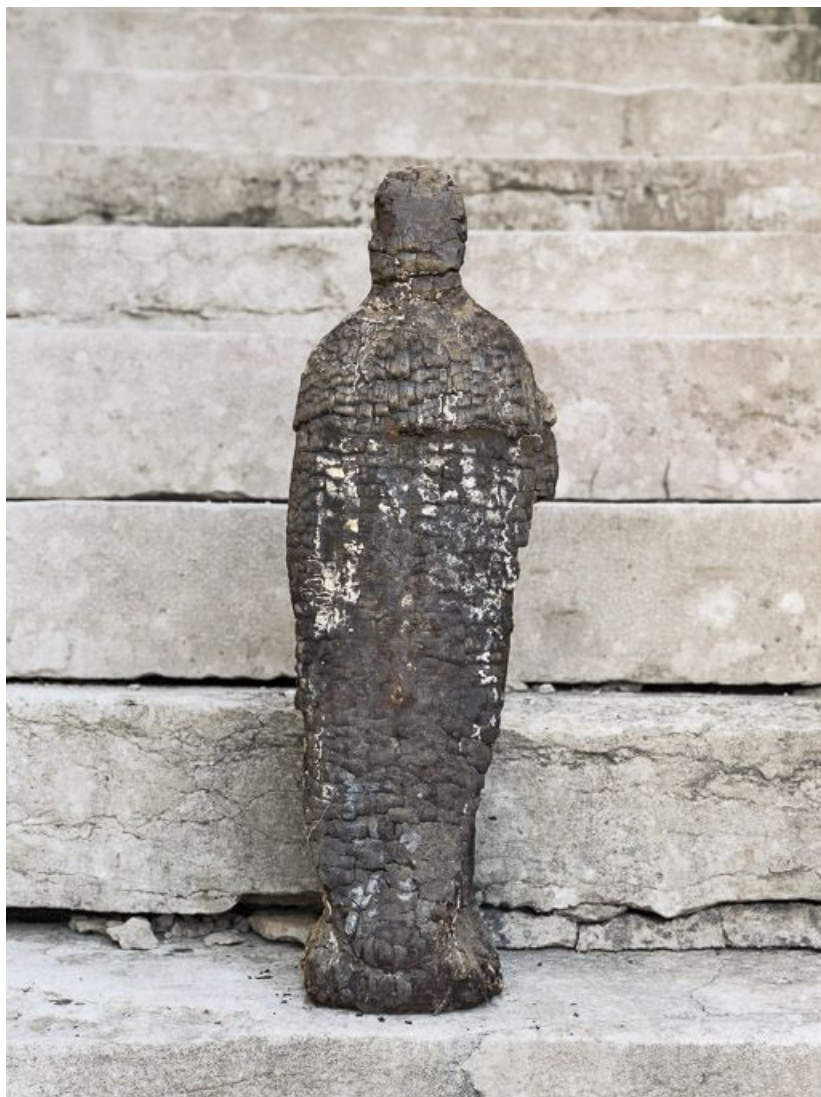
Revers. 21, Montheleie