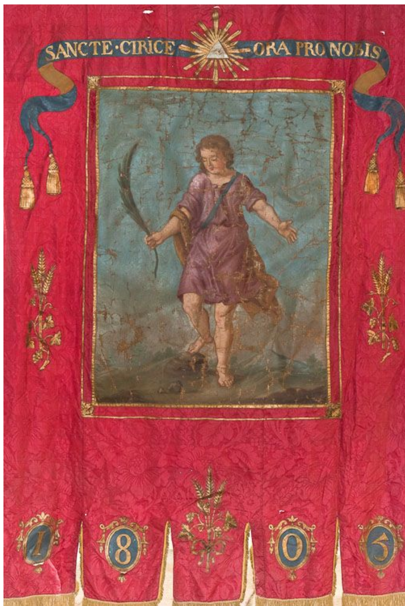
Détail : saint Cyr.