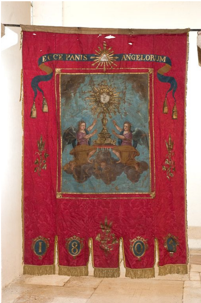
Vue d'ensemble : Adoration du Saint Sacrement. 21, Volnay