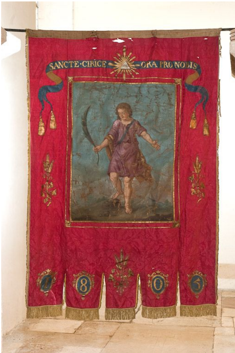
Vue d'ensemble : saint Cyr.