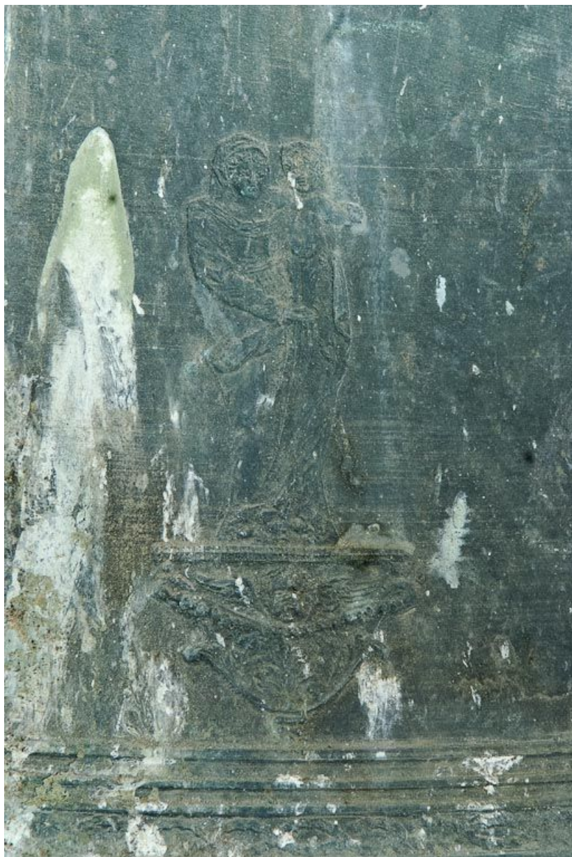
Détail. 21, Volnay