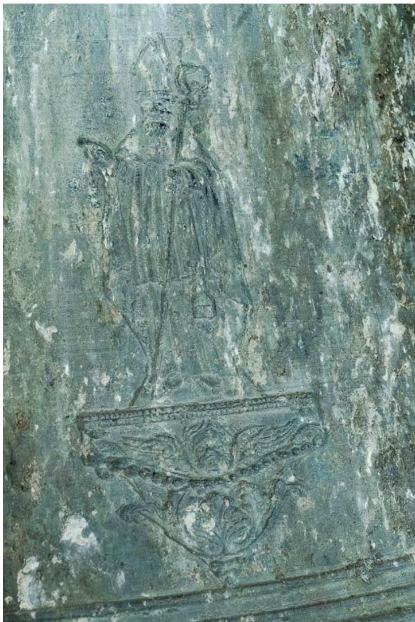
Détail. 21, Volnay