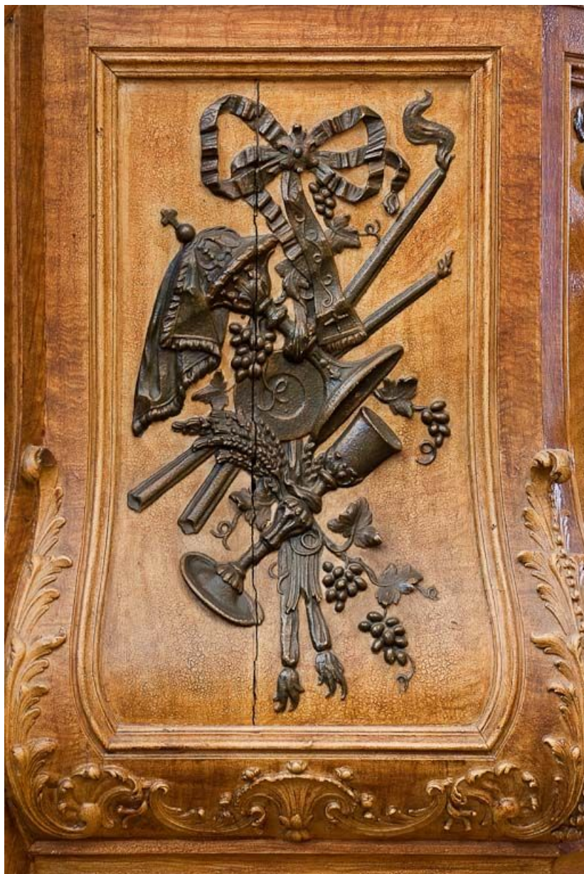
Détail d'un panneau.