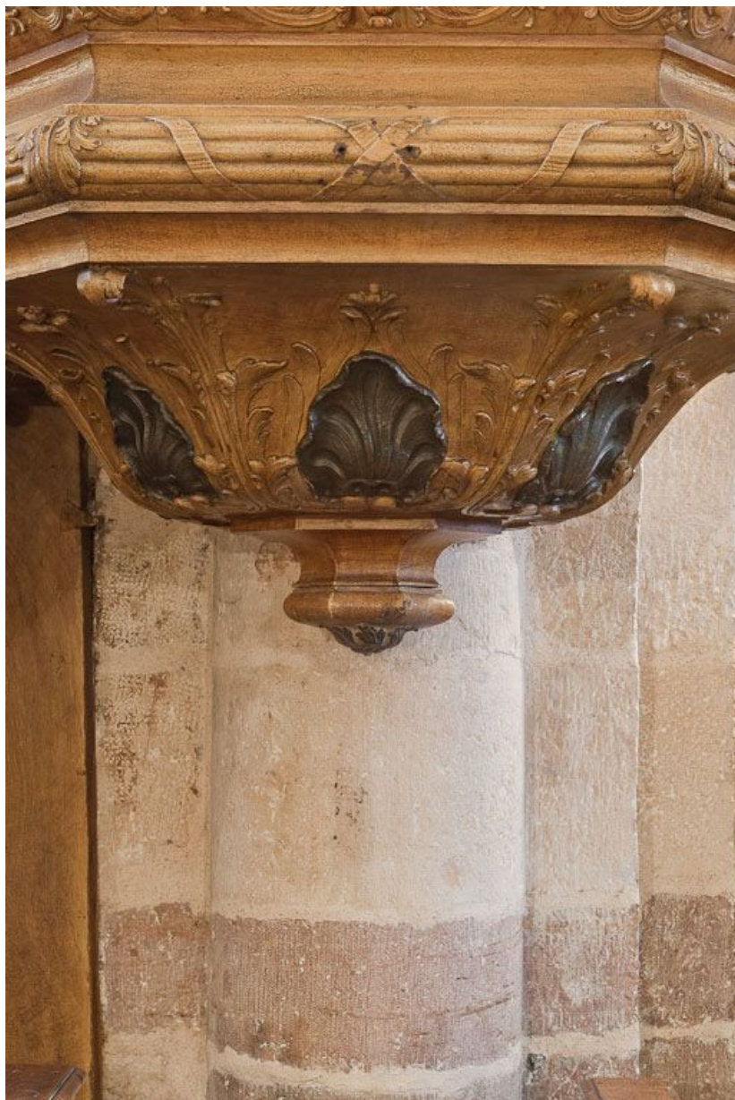
Détail du cul-de-lampe.