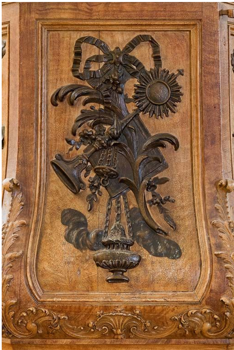
Détail d'un panneau.