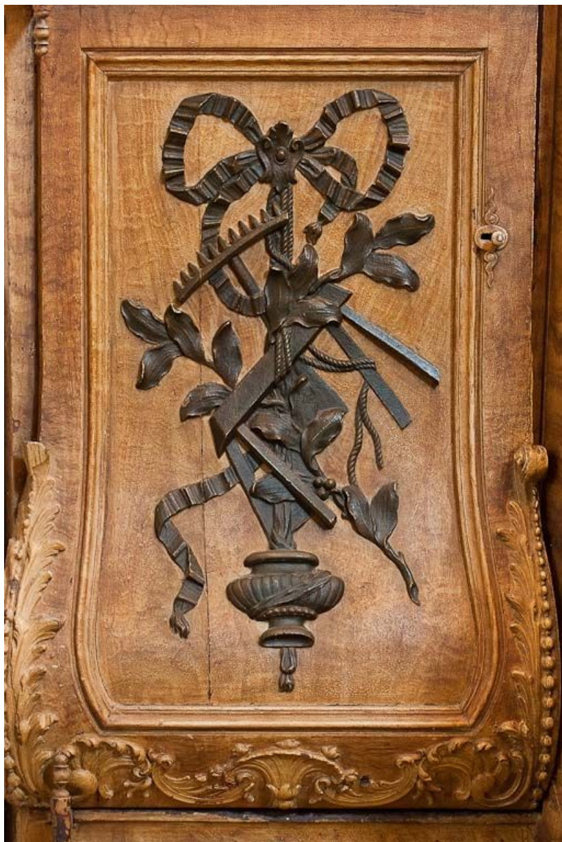
Détail d'un panneau.