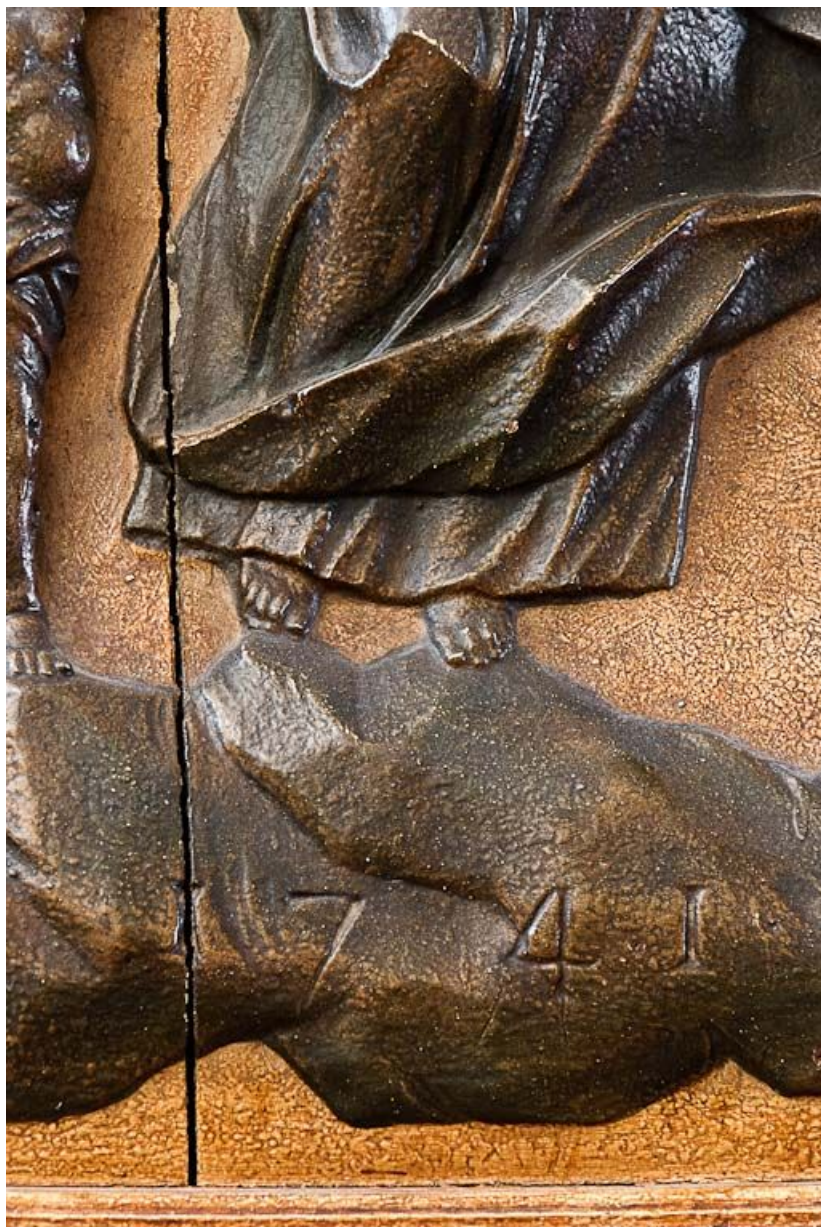
Détail de la date.