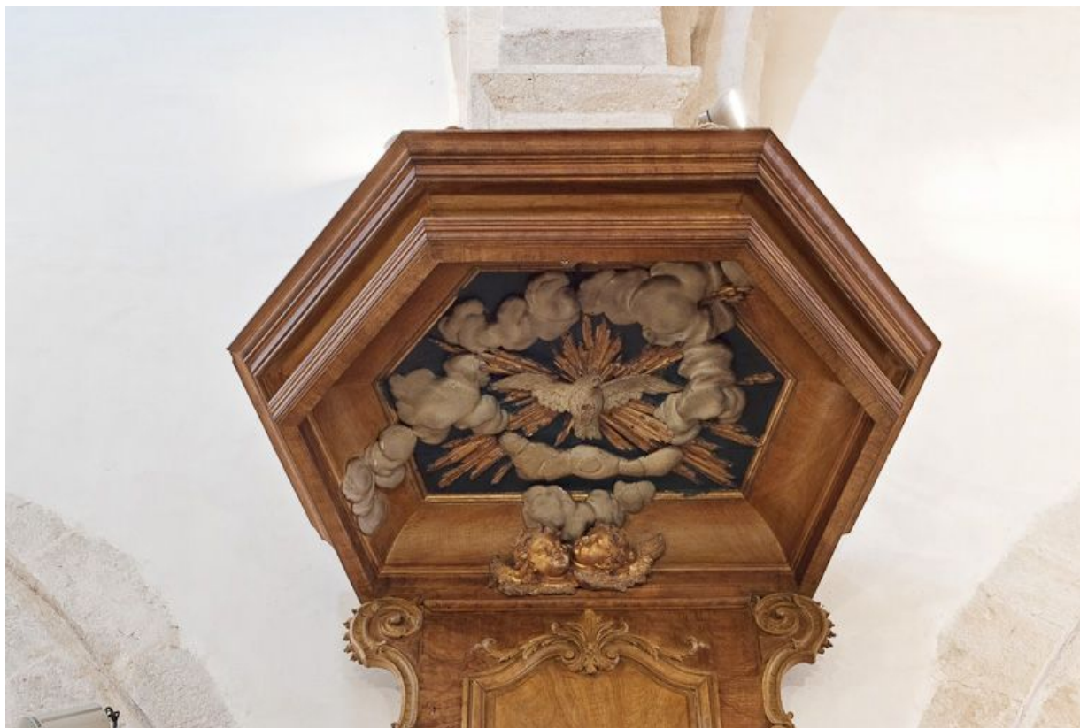
Détail de l'abat-voix.