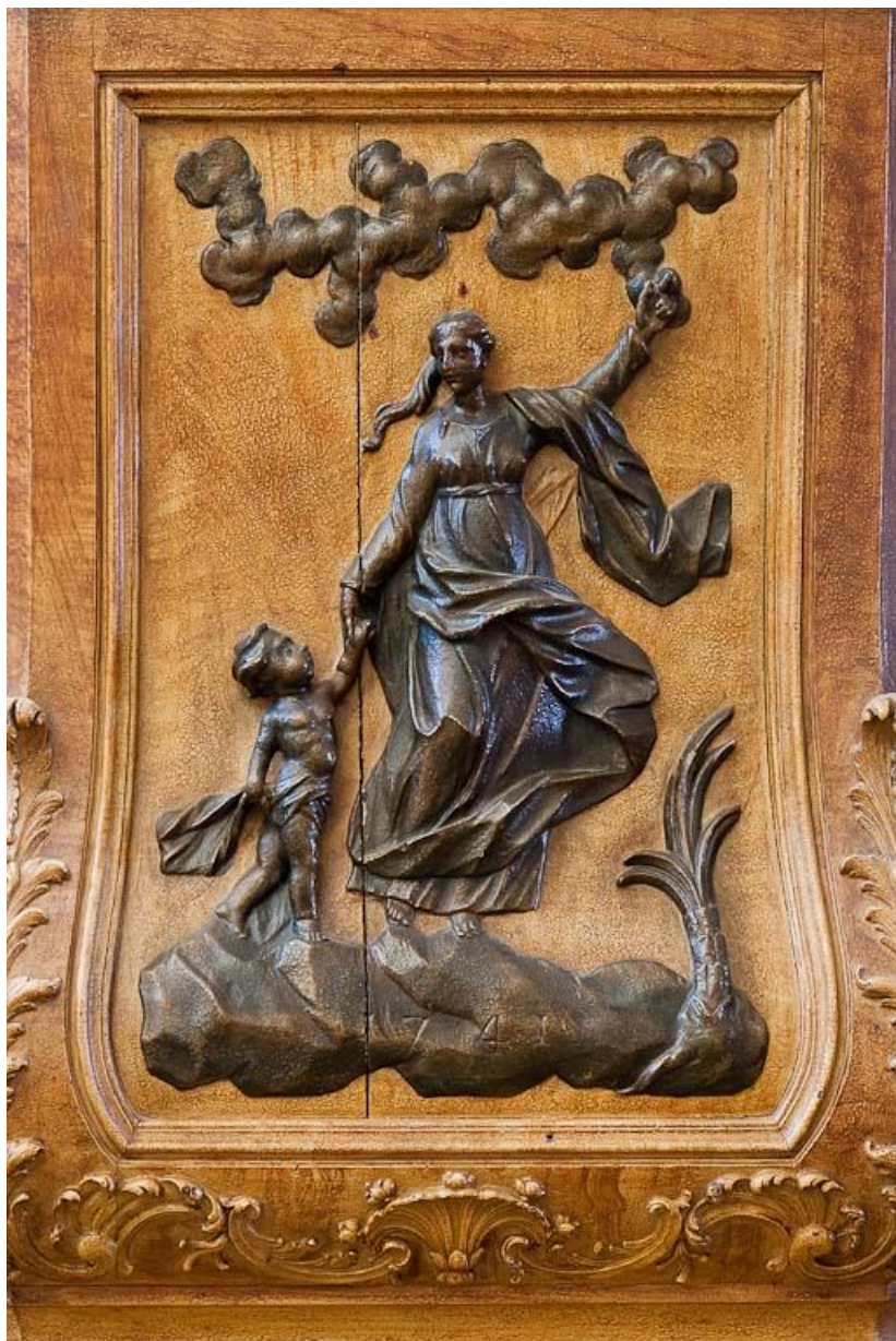
Détail d'un panneau.