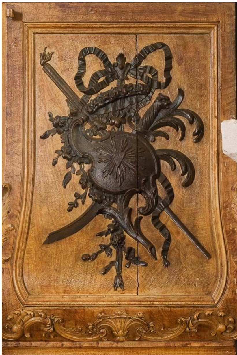
Détail d'un panneau.