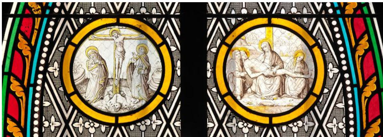
Rondels du vitrail droit du choeur : Calvaire et Descente de Croix. 21, Volnay

N° de l'illustration : 20112100148NUC4AQ