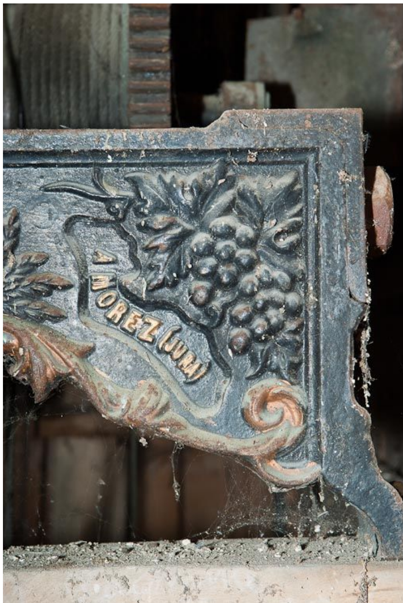
Mécanisme d'horloge : détail.