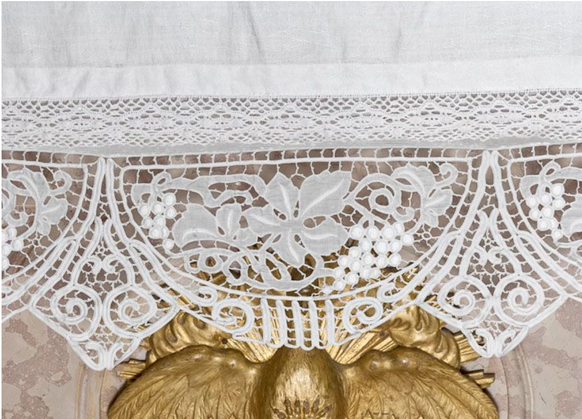
Nappe d'autel : détail.