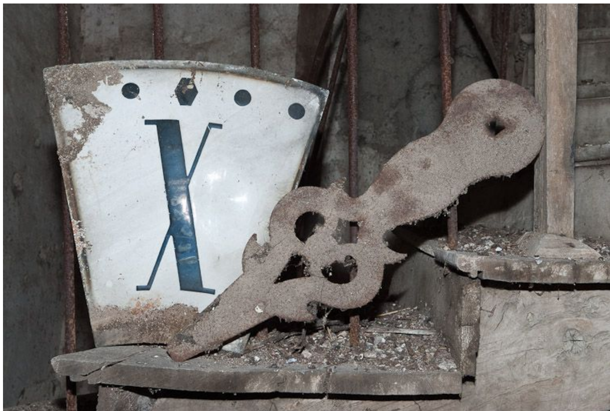
Horloge : détail.