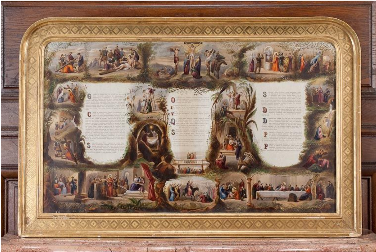
Canons d'autel : canon central.