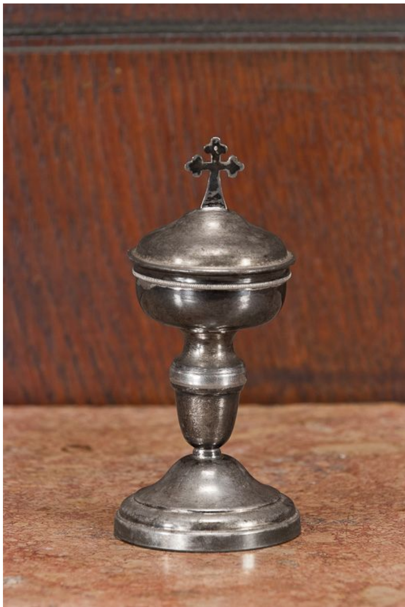
Ciboire-chrismatoire : vue d'ensemble.