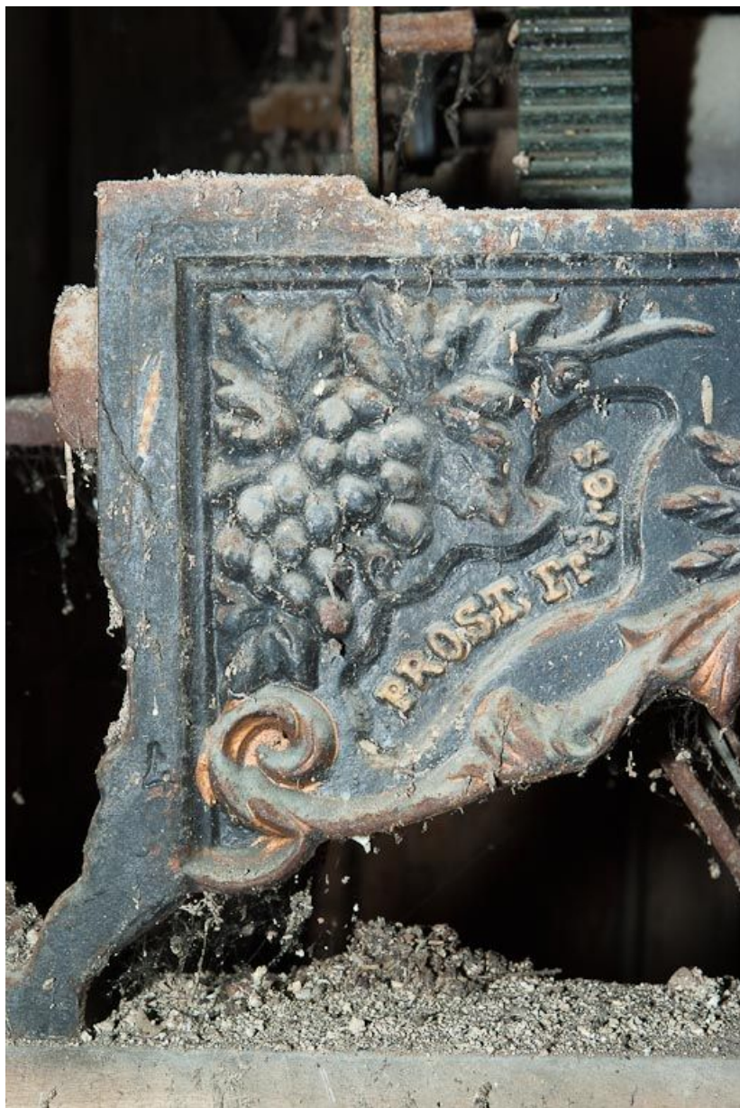
Mécanisme d'horloge : détail.