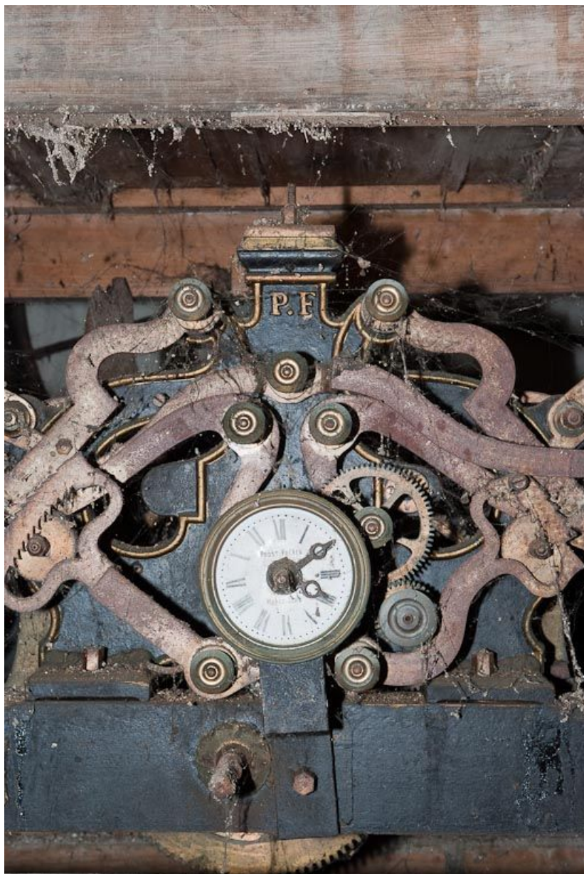
Mécanisme d'horloge : détail.