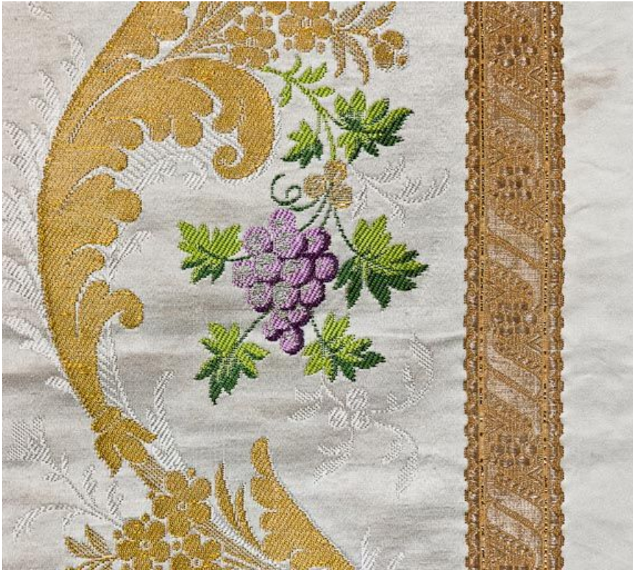
Détail de la chasuble.