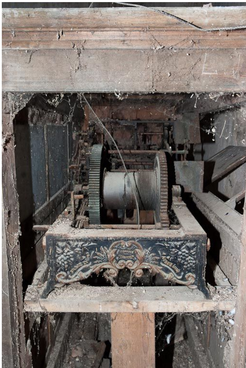
Mécanisme d'horloge : vue de profil.