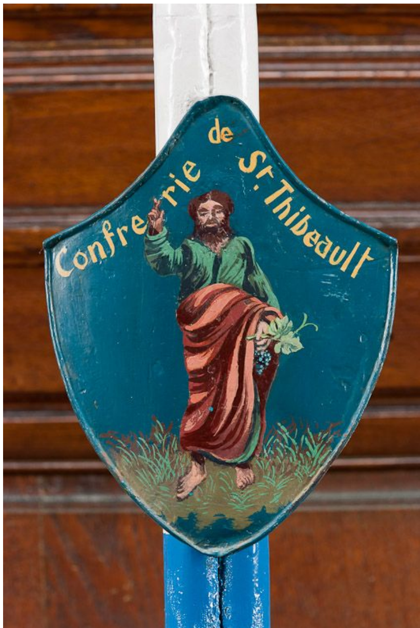
Cierge de procession : panonceau repeint. 21, Pommard