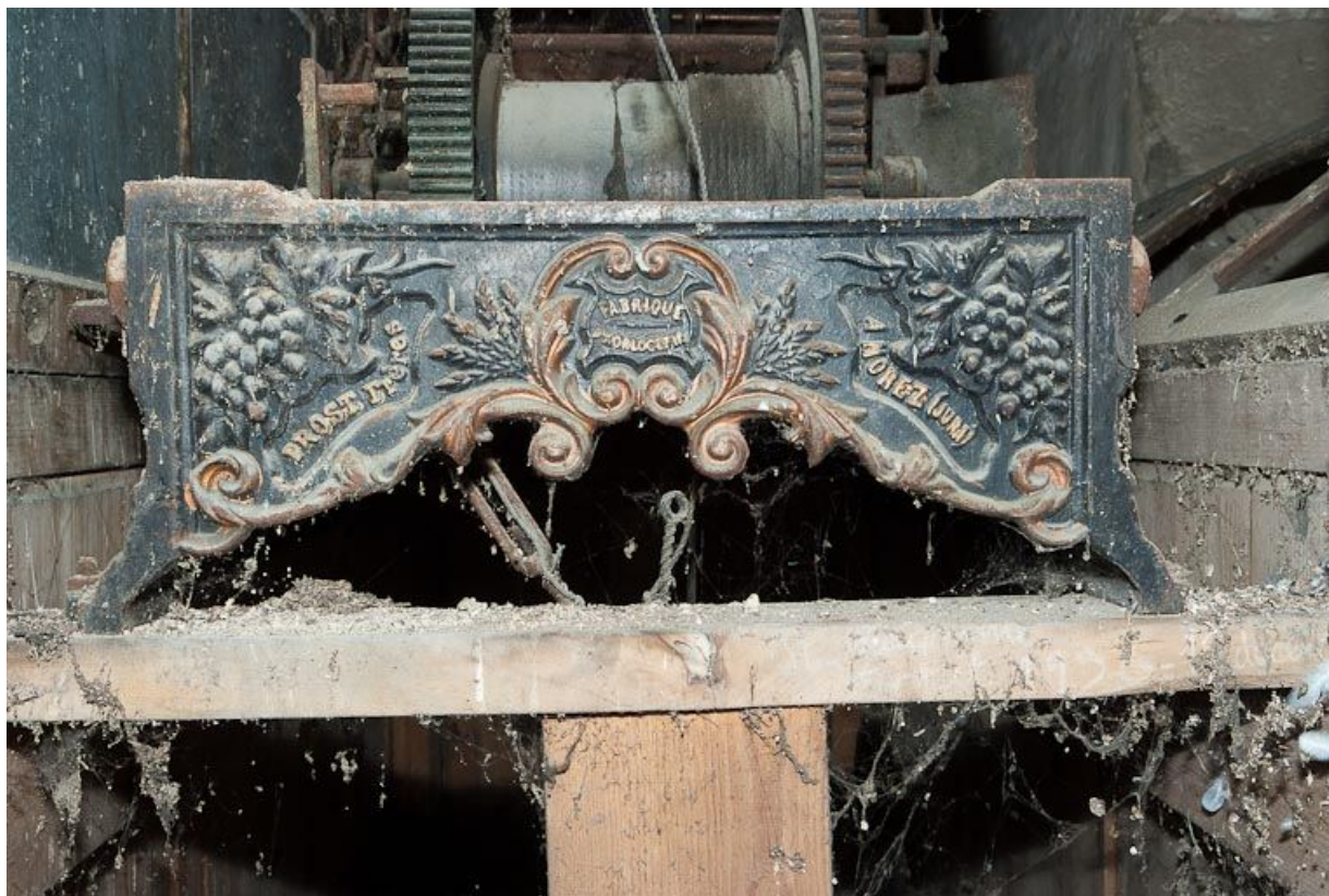
Mécanisme d'horloge : détail.