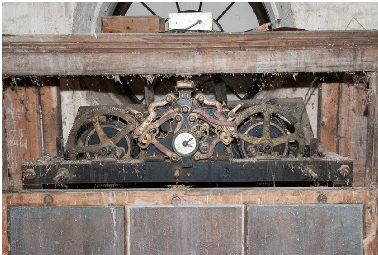
Mécanisme d'horloge : vue d'ensemble.