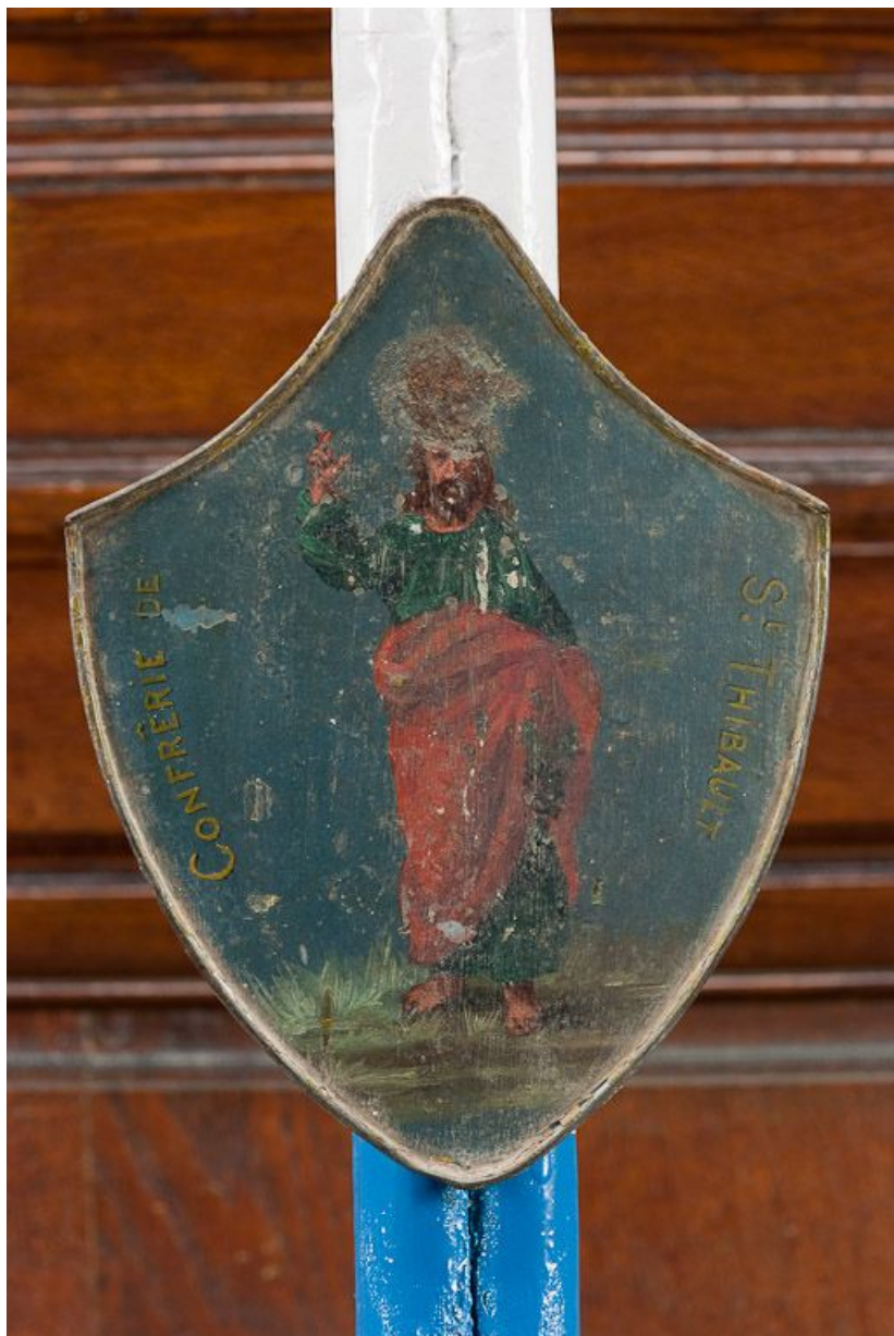
Cierge de procession : panonceau.