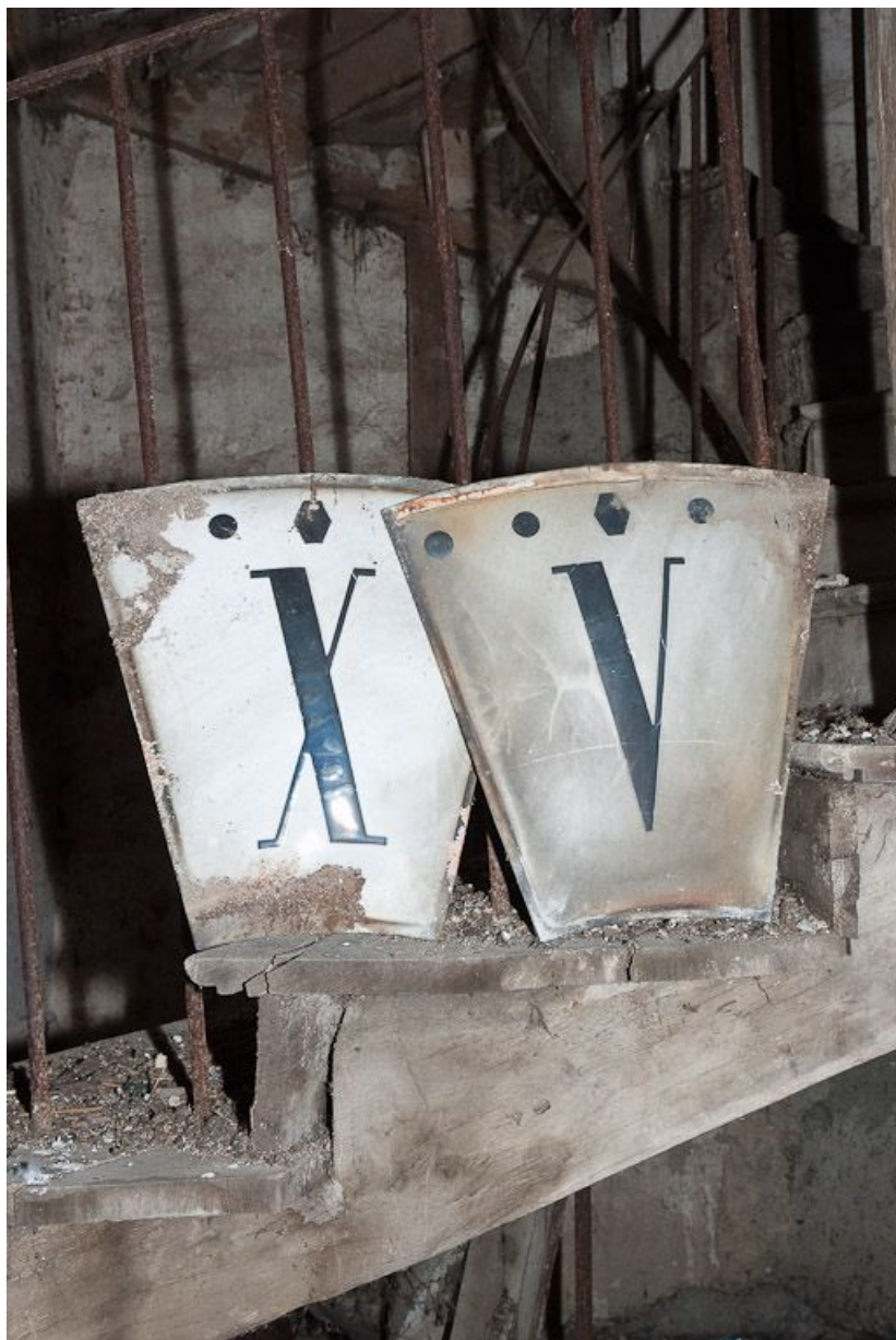
Horloge : détail.