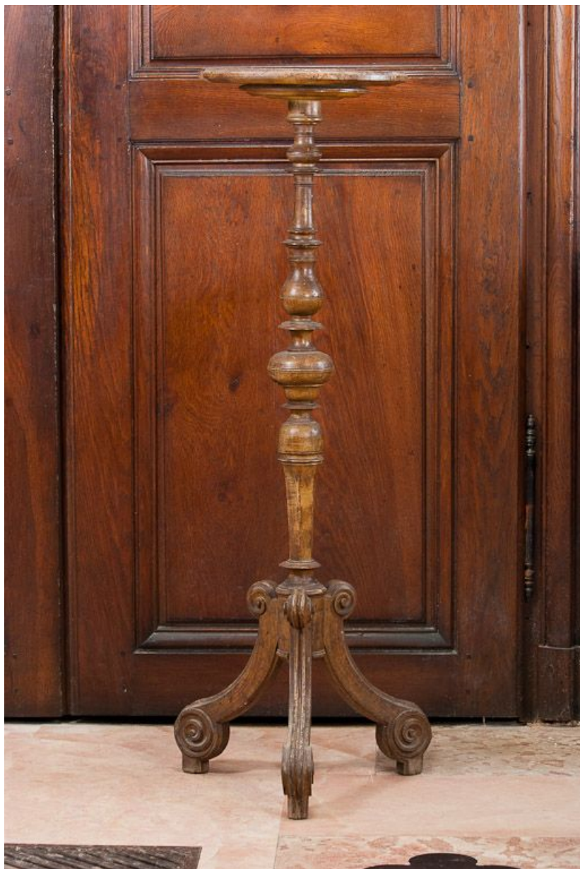
Guéridon porte-luminaire : vue d'ensemble. 21, Pommard