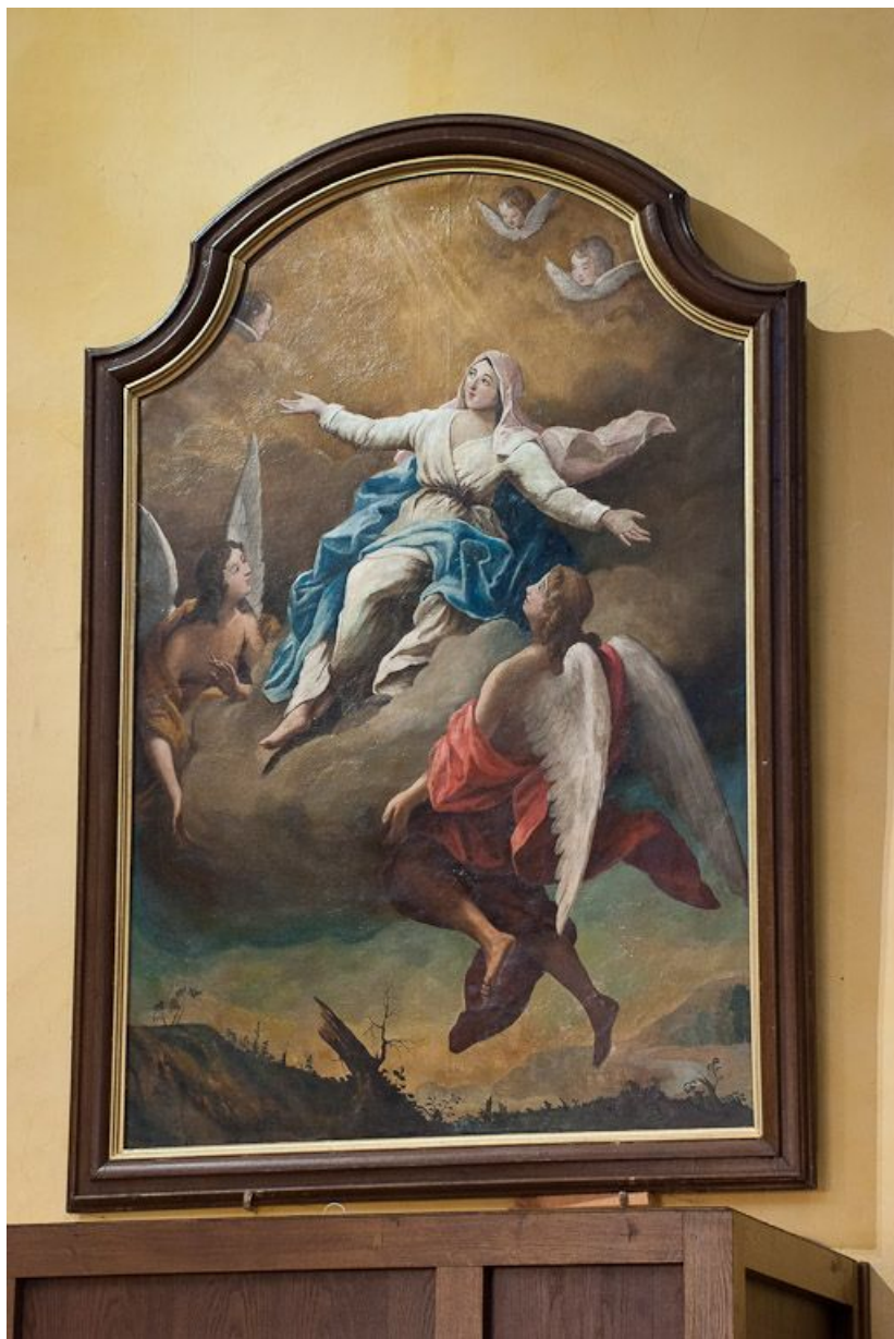
Vue d'ensemble. 21, Pommard