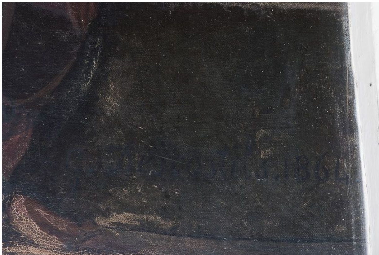
Délivrance de saint Pierre par un ange : signature.