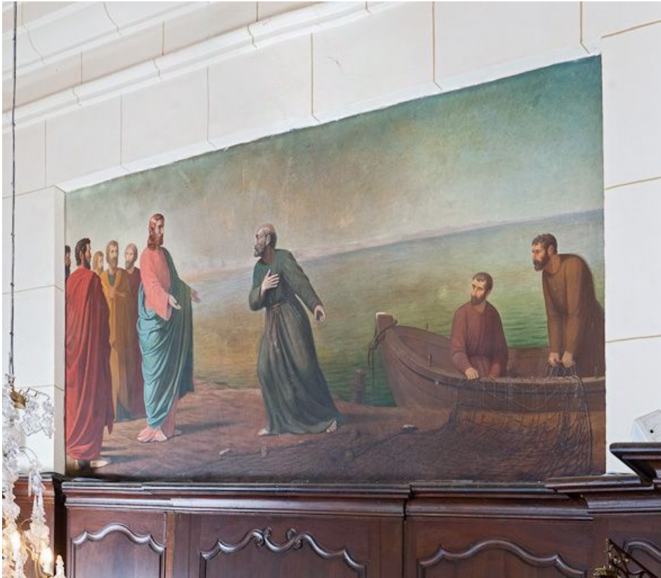
Vocation de saint Pierre.