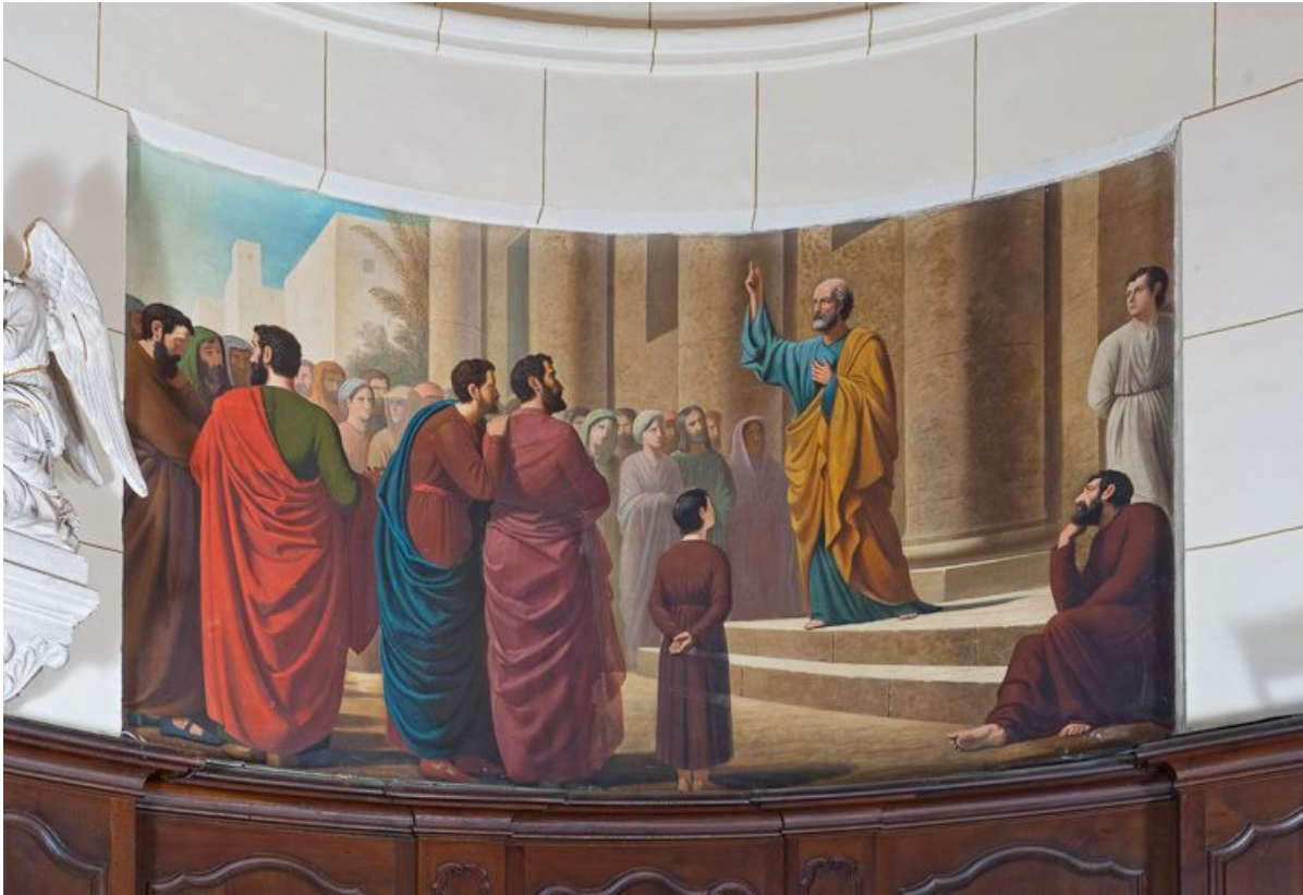
Prédication de Saint Pierre.