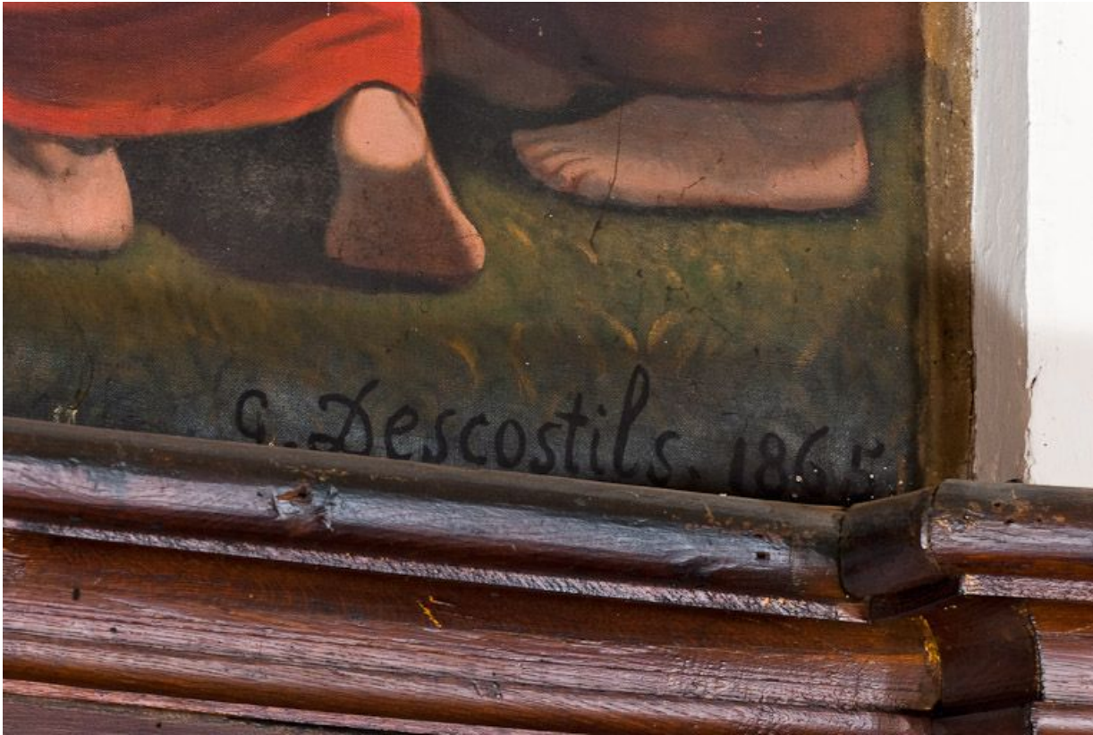
Remise des clefs à saint Pierre : signature.