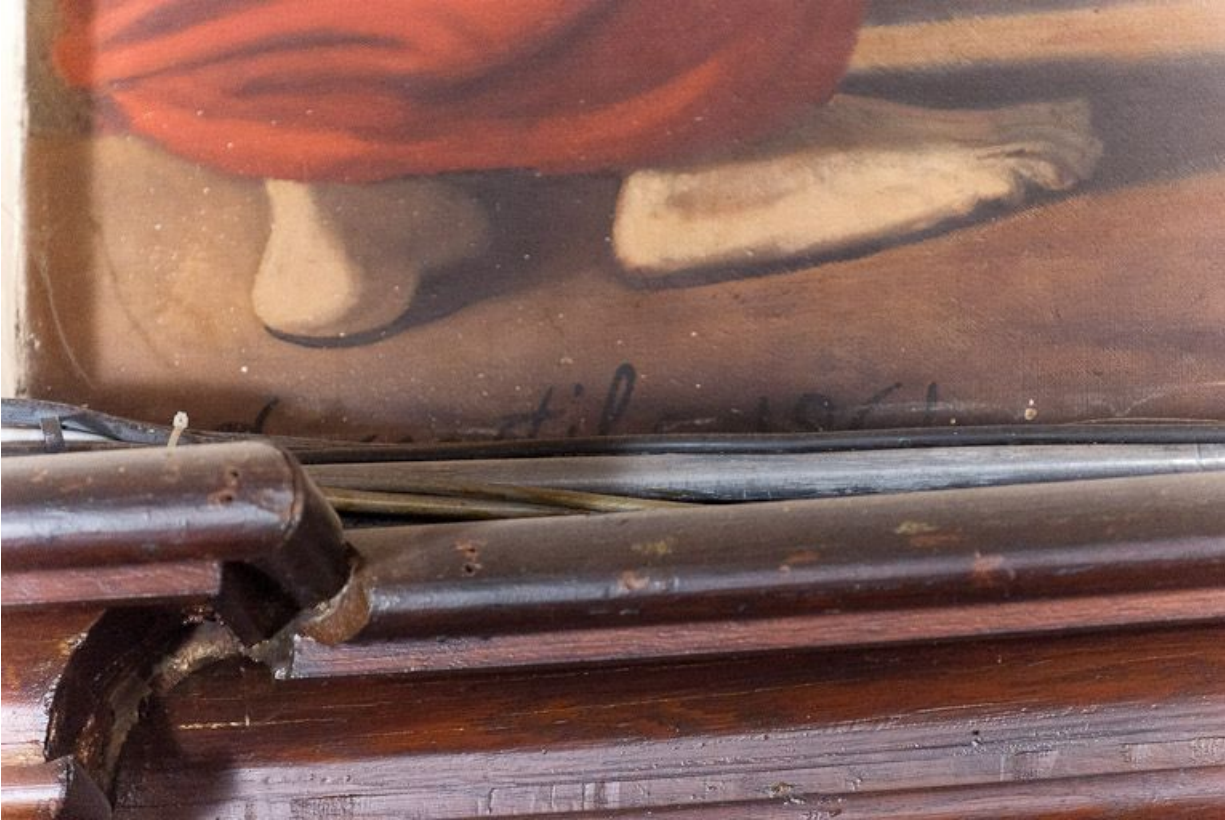
Vocation de saint Pierre : signature.