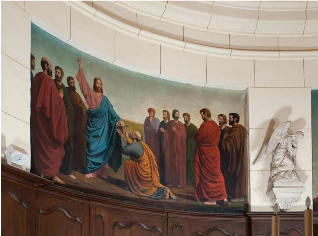
Remise des clefs à saint Pierre.