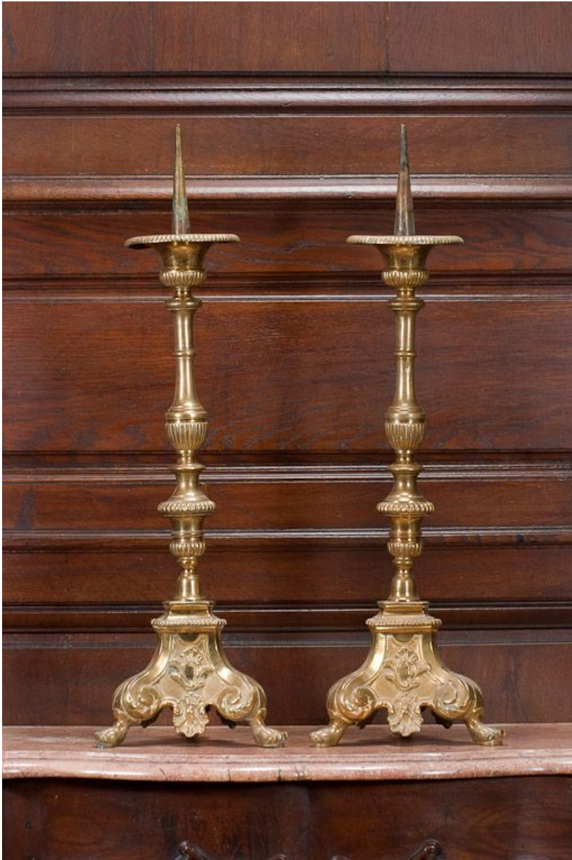
Vue de deux chandeliers d'autel.