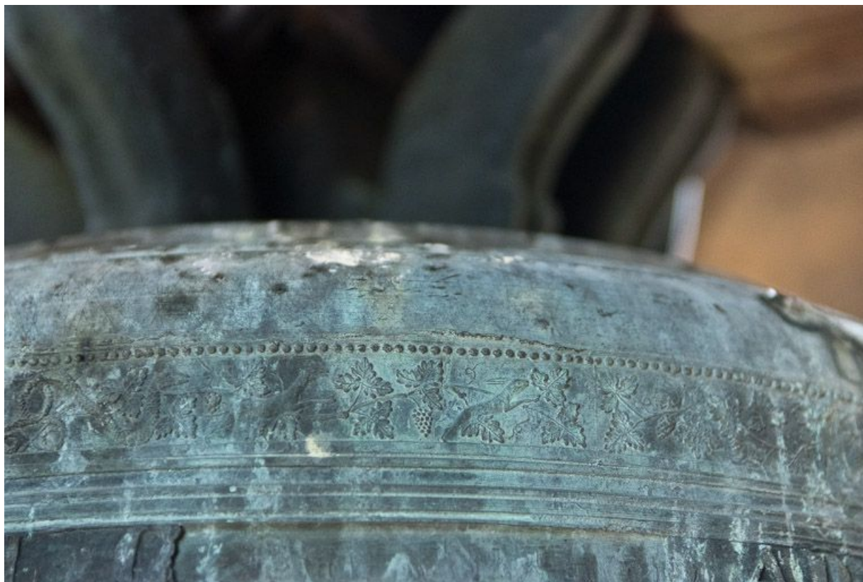
Détail de la frise.