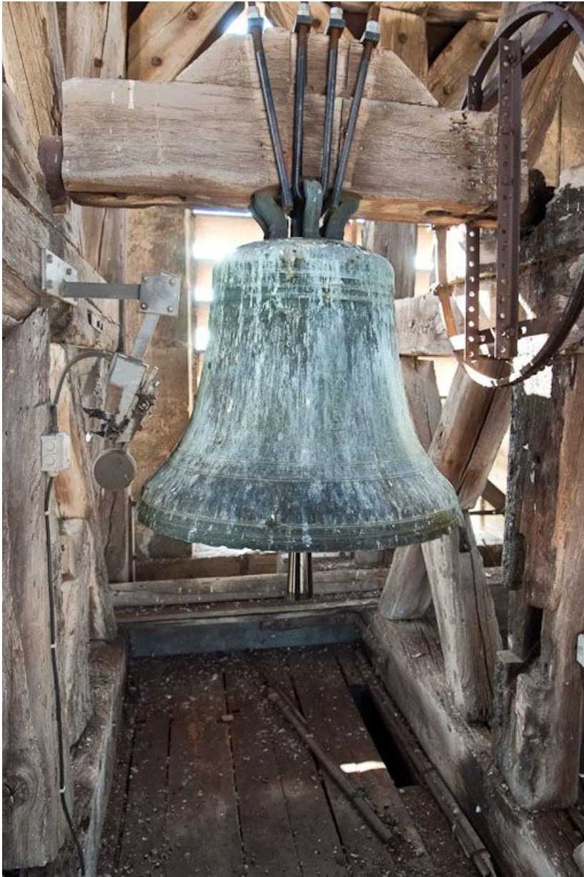
Vue d'ensemble. 21, Pommard