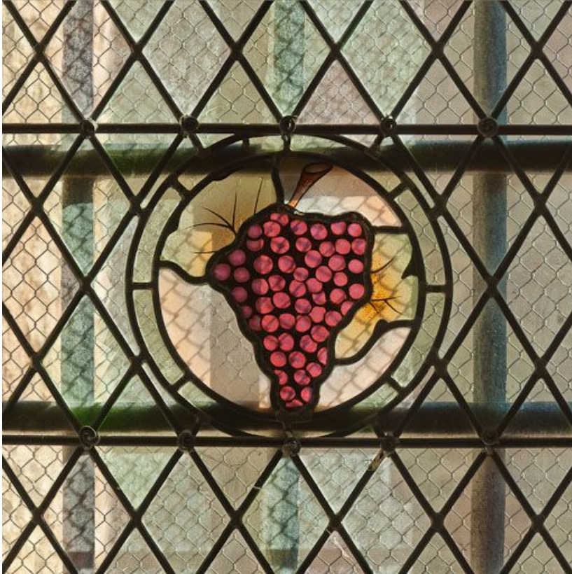
Verrière : détail de la grappe.