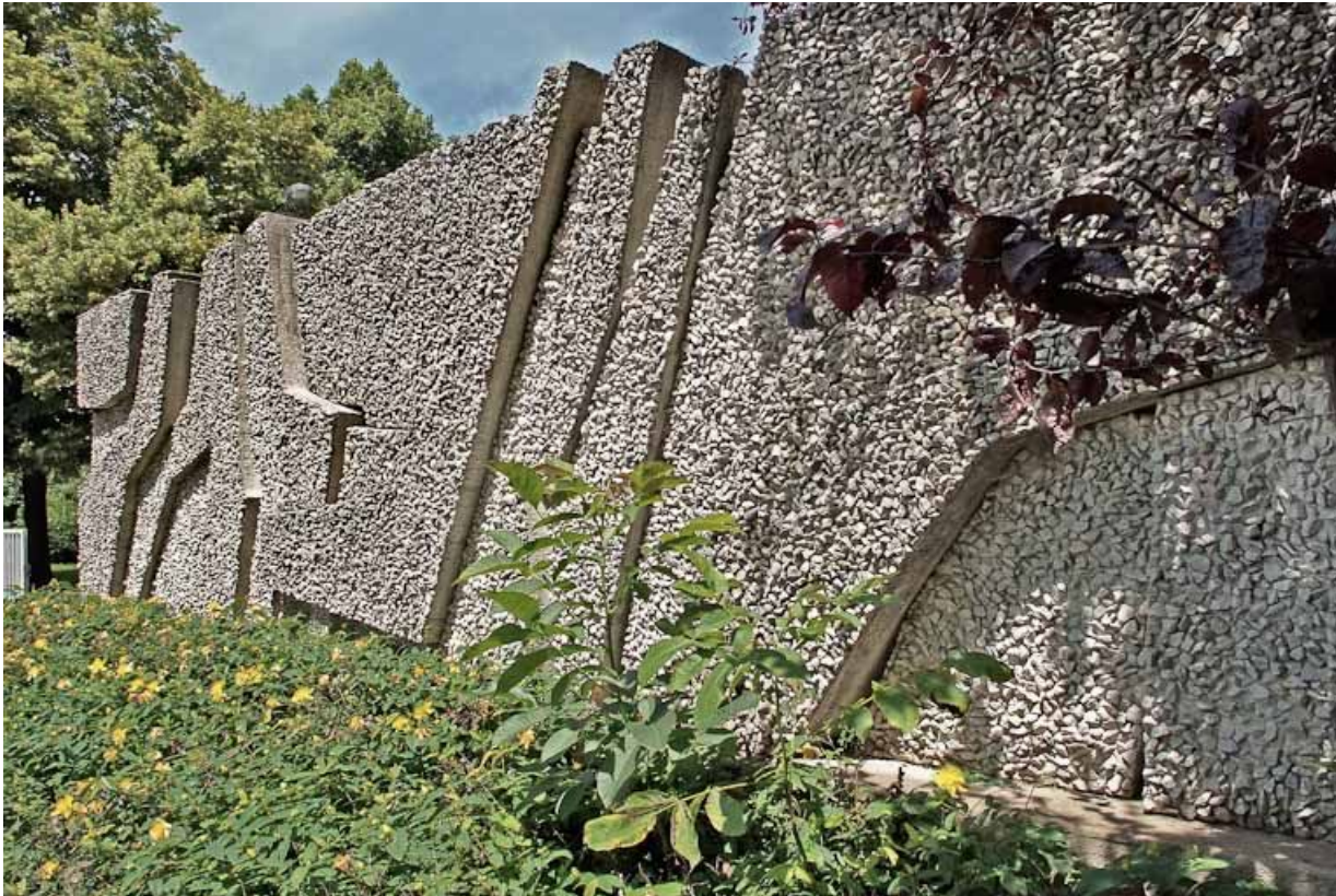
Vue de face, détail.