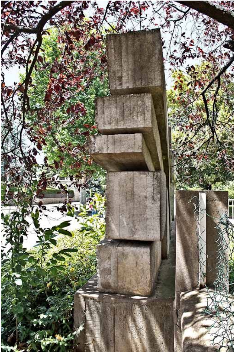
Vue de côté.