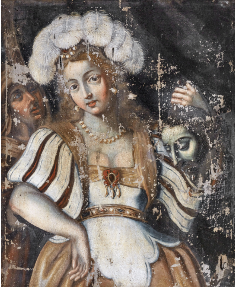
Tableau avant restauration (en 2004).