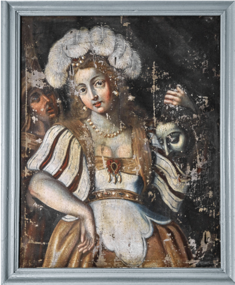
Tableau avant restauration (en 2004). 21, Châteauneuf