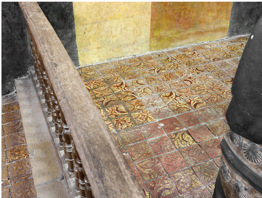
Vue d'ensemble des tapis de carreaux de pavement de la chapelle. 21, Châteauneuf