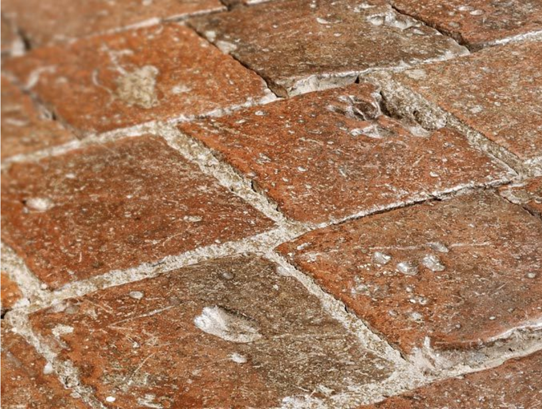
Carreaux de pavement de la chambre de Vienne : détail.