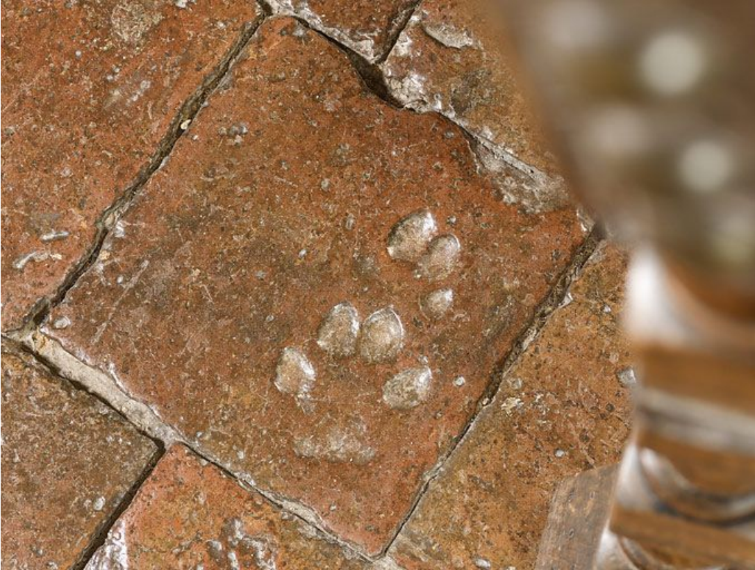
Carreaux de pavement de la chambre de Vienne : détail. 21, Châteauneuf