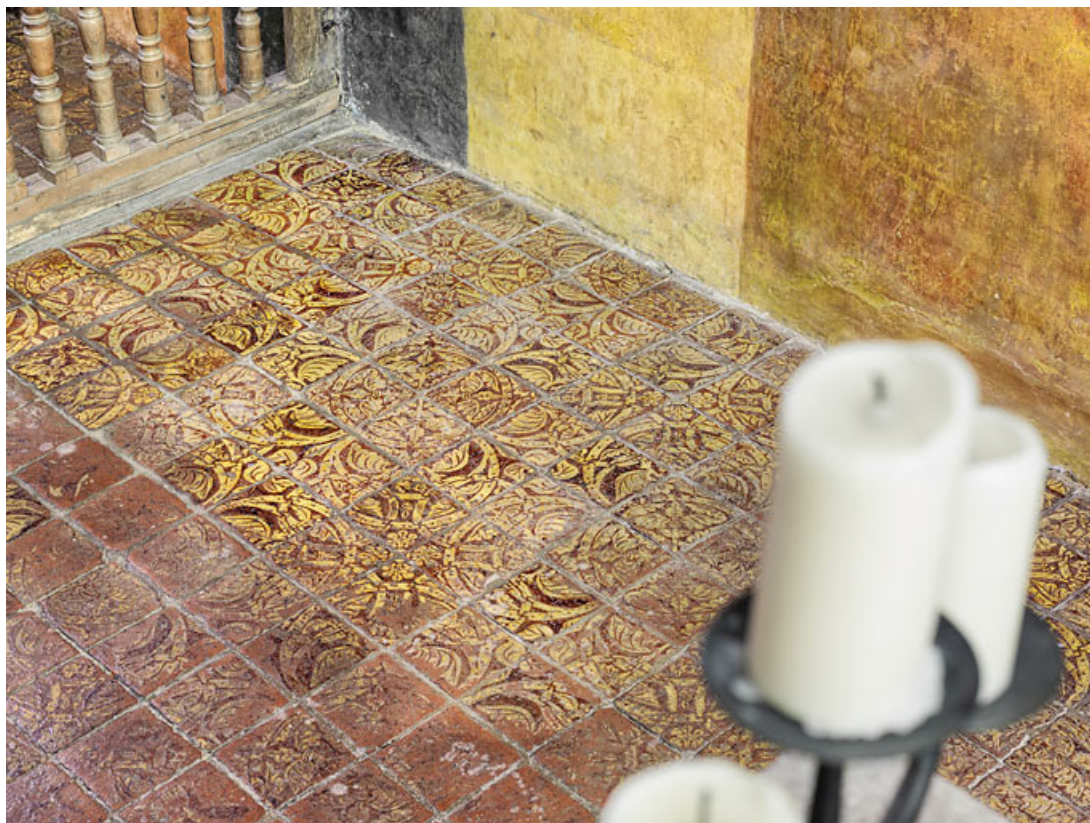
Vue d'ensemble des tapis de sol de carreaux de la chapelle. 21, Châteauneuf