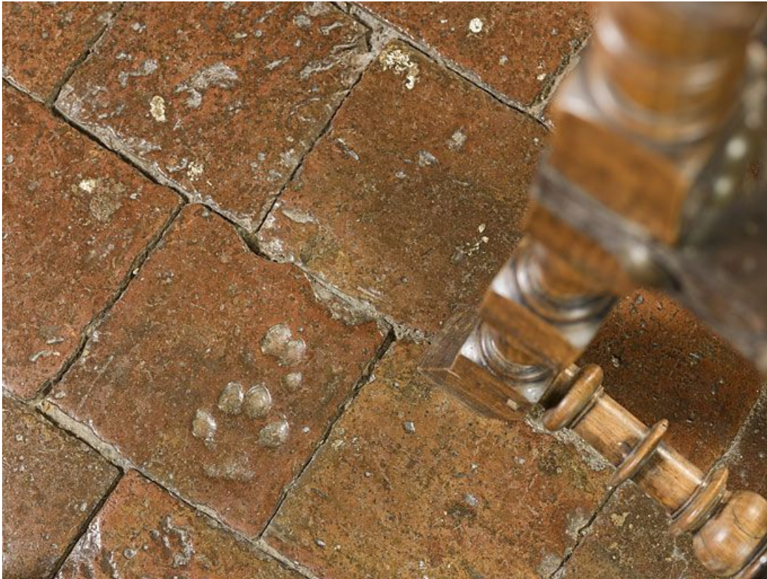
Carreaux de pavement de la chambre de Vienne : détail. 21, Châteauneuf