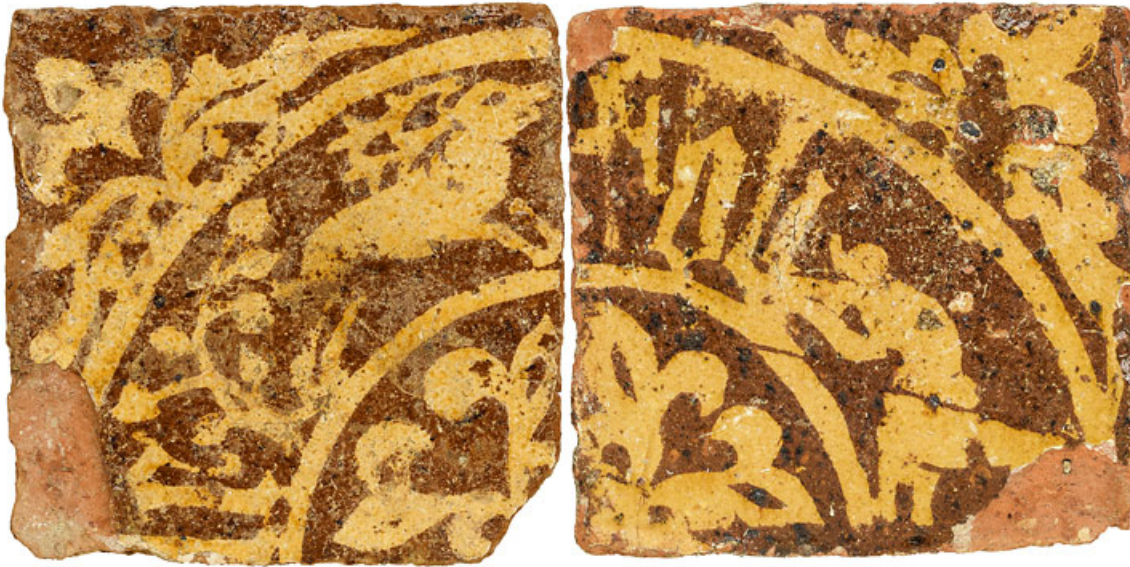
Carreaux de pavement, fragments archéologiques : détail.