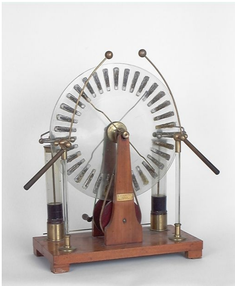
Machine vue côté marque.