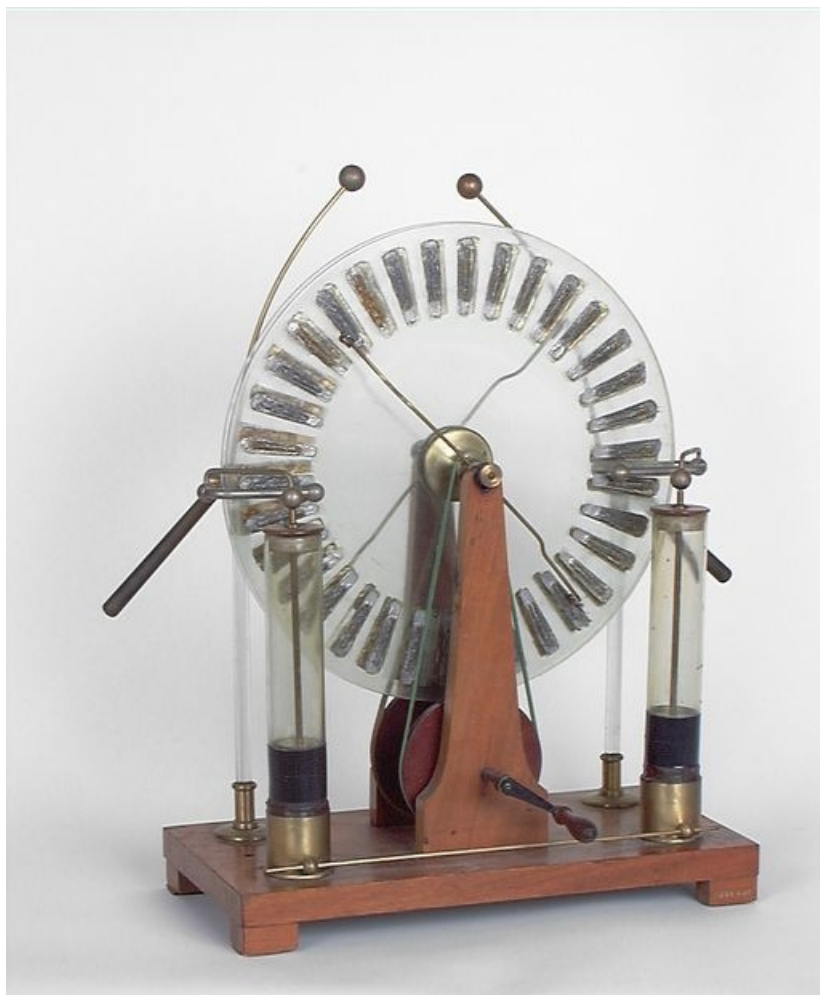
Machine vue côté manivelle.