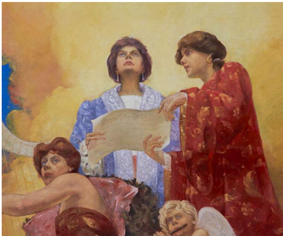
Salle, en 1996, détail du plafond peint par Henri Collin : chanteuses lisant une partition avec une inscription anticléricale (à bas la calotte).