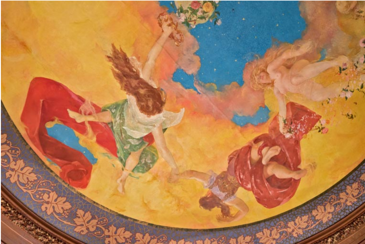
Salle, plafond : 2e groupe de personnages (la danse rendant hommage à la musique ?).