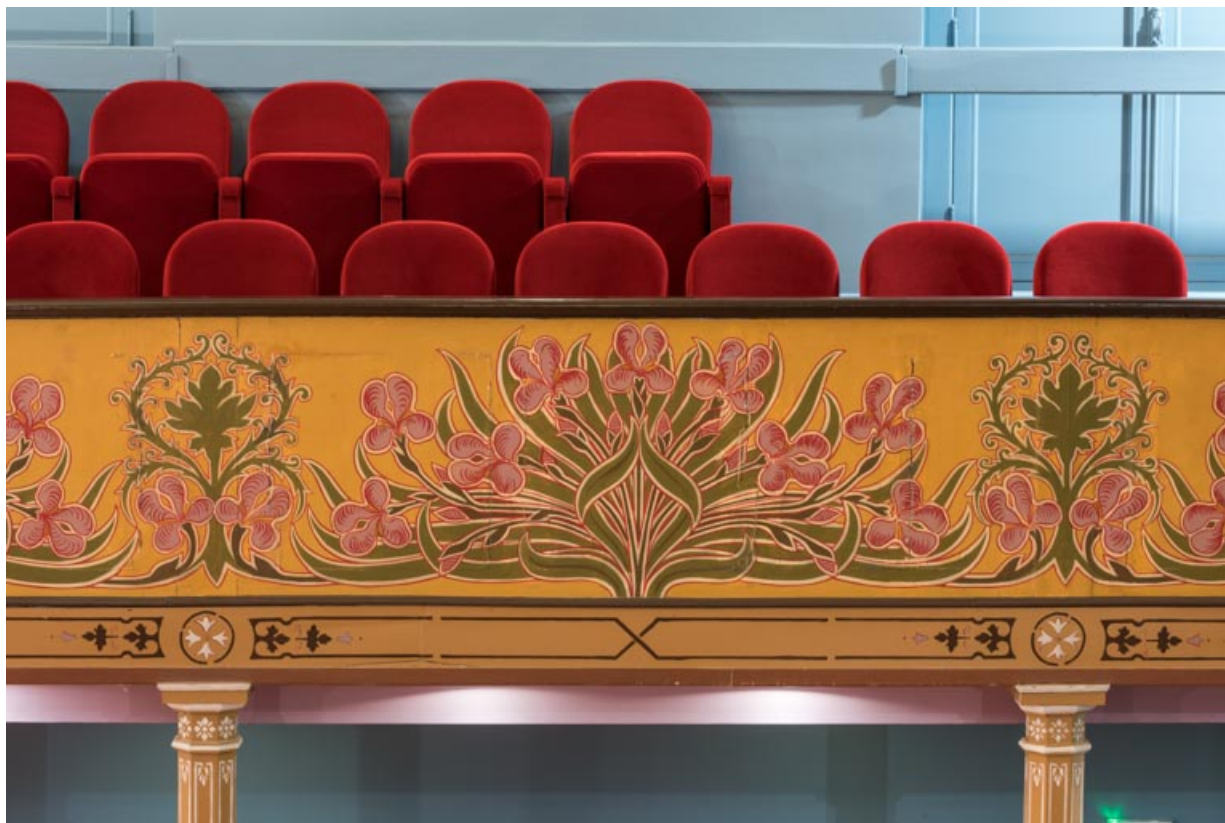
Salle : décor du garde-corps du balcon.