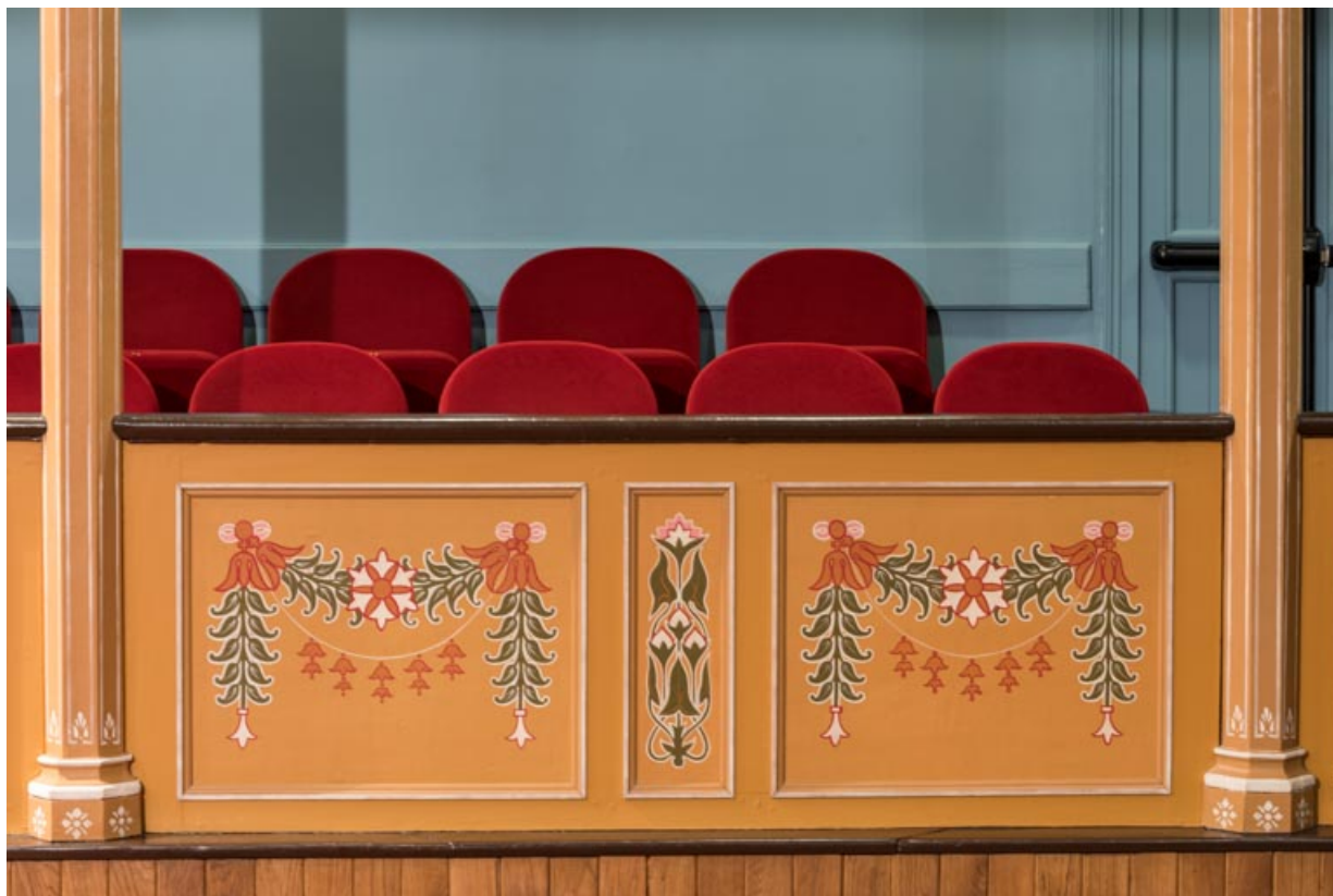
Salle : décor du garde-corps du parterre assis.