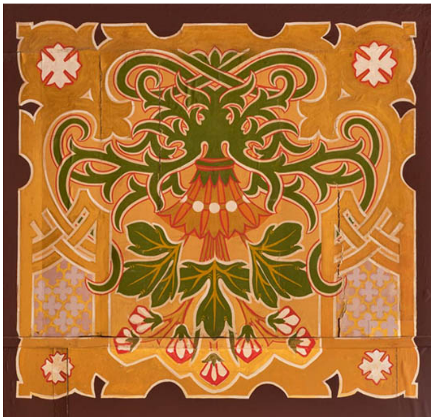
Salle : décor du cadre de scène.