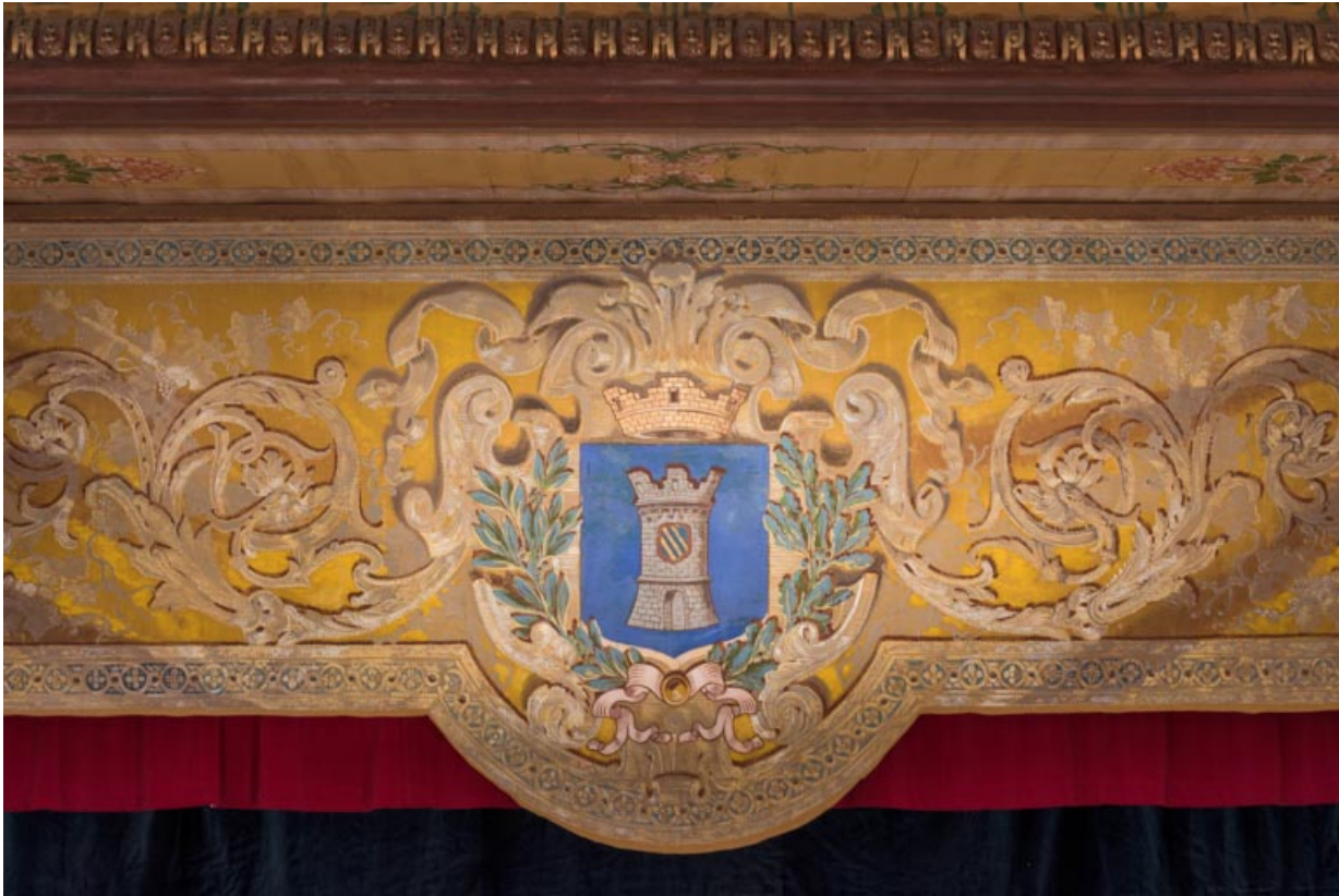
Salle : partie centrale du lambrequin, avec le blason de la ville.