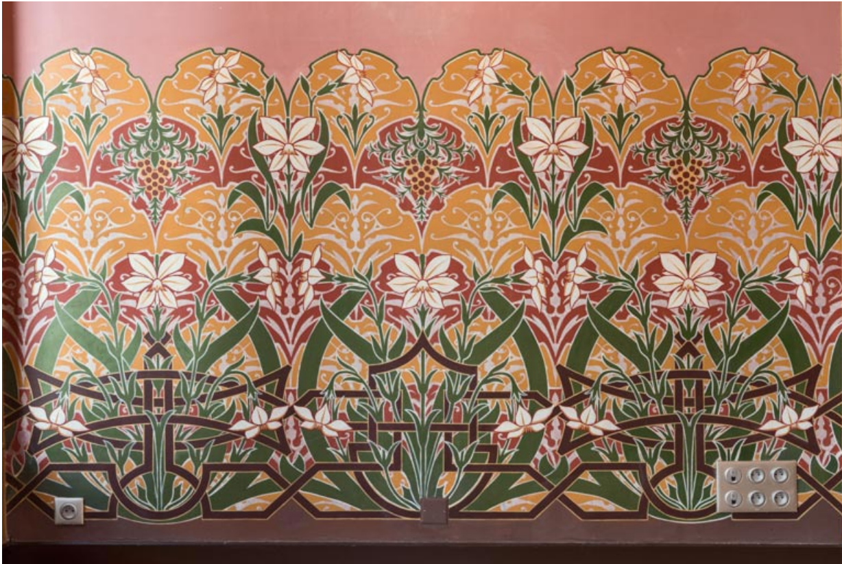
Foyer, mur est : décor en partie basse.