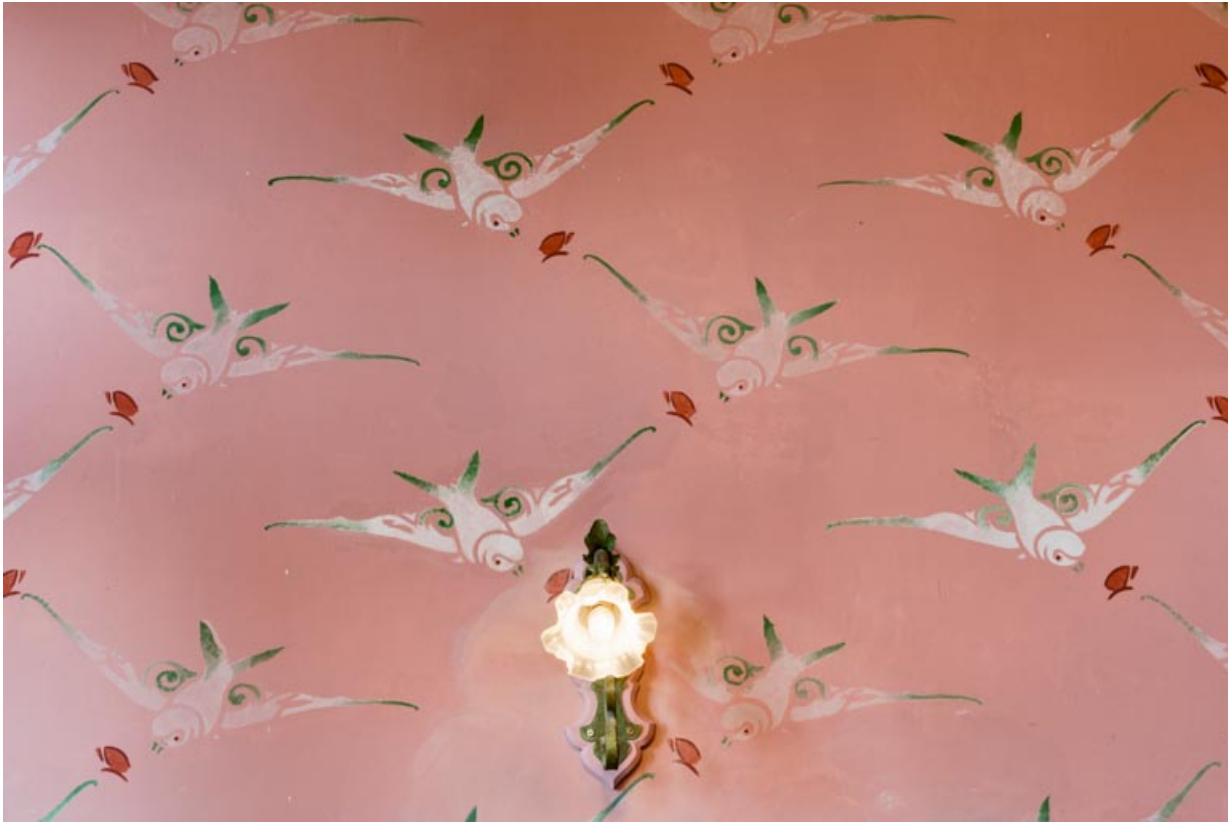
Foyer, mur est : luminaire d'applique et décor d'hirondelles en partie haute.