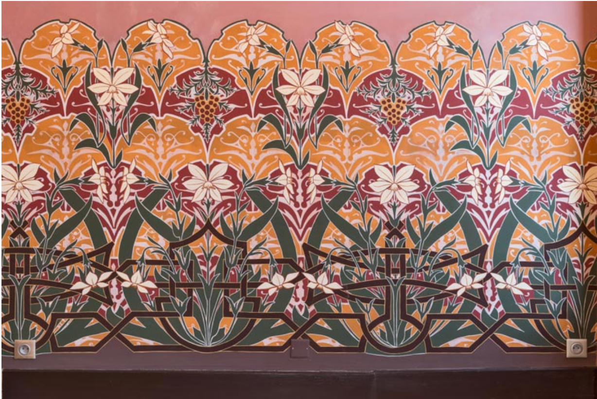
Foyer, mur ouest : décor en partie basse.