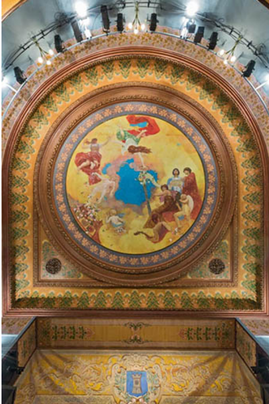
Salle : plafond.