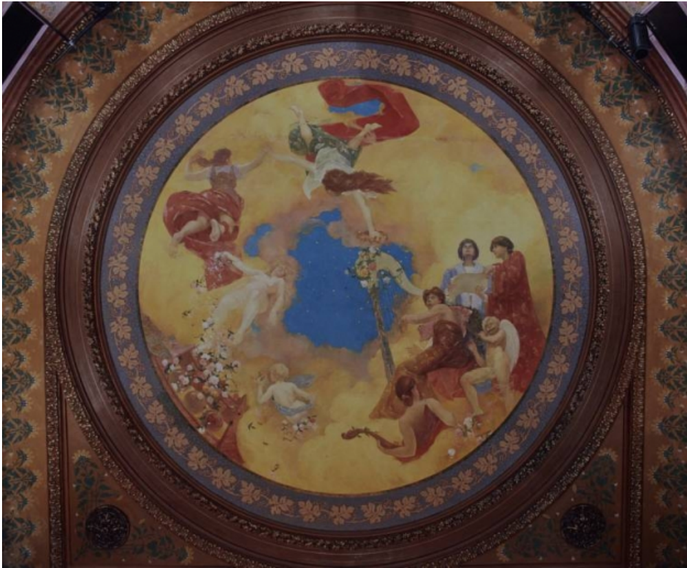
Théâtre de Semur-en-Auxois : décor peint du plafond.