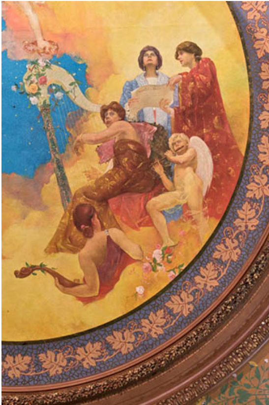
Salle, plafond : 1er groupe de personnages (la musique vocale et la musique instrumentale ?). 21, Semur-en-Auxois, 11 rue du Rempart