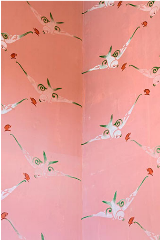
Foyer : décor d'hirondelles en partie haute, dans un angle.