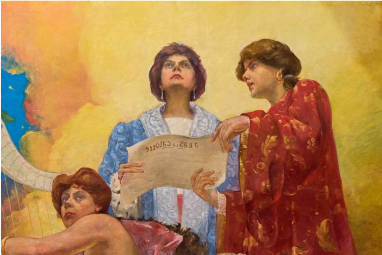
Salle, plafond : 1er groupe de personnages (vue rapprochée).