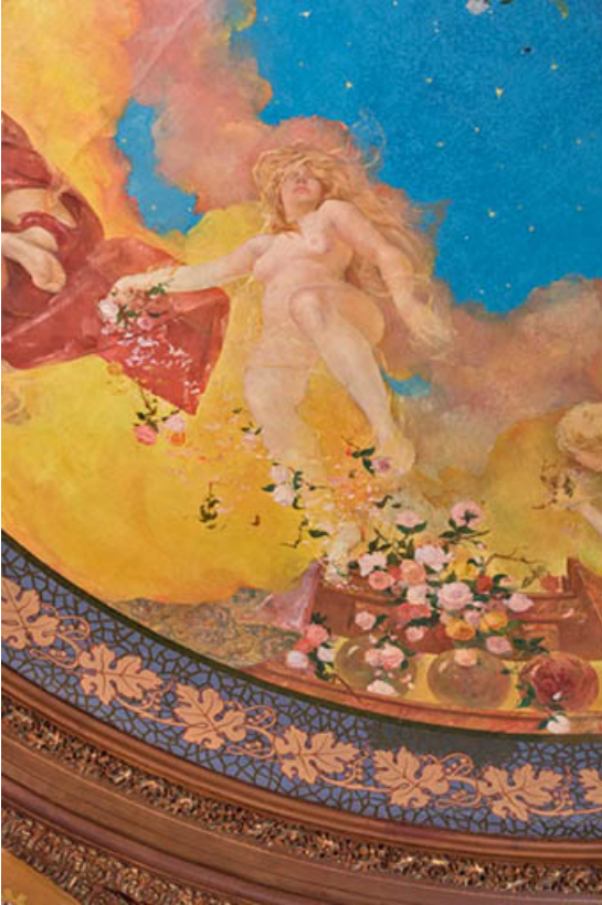
Salle, plafond : femme du 3e groupe de personnages. 21, Semur-en-Auxois, 11 rue du Rempart