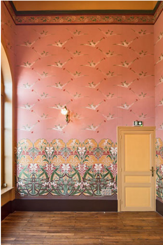
Foyer : mur est.