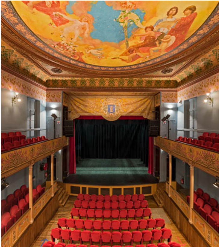
Salle : vue vers la scène, depuis le balcon.