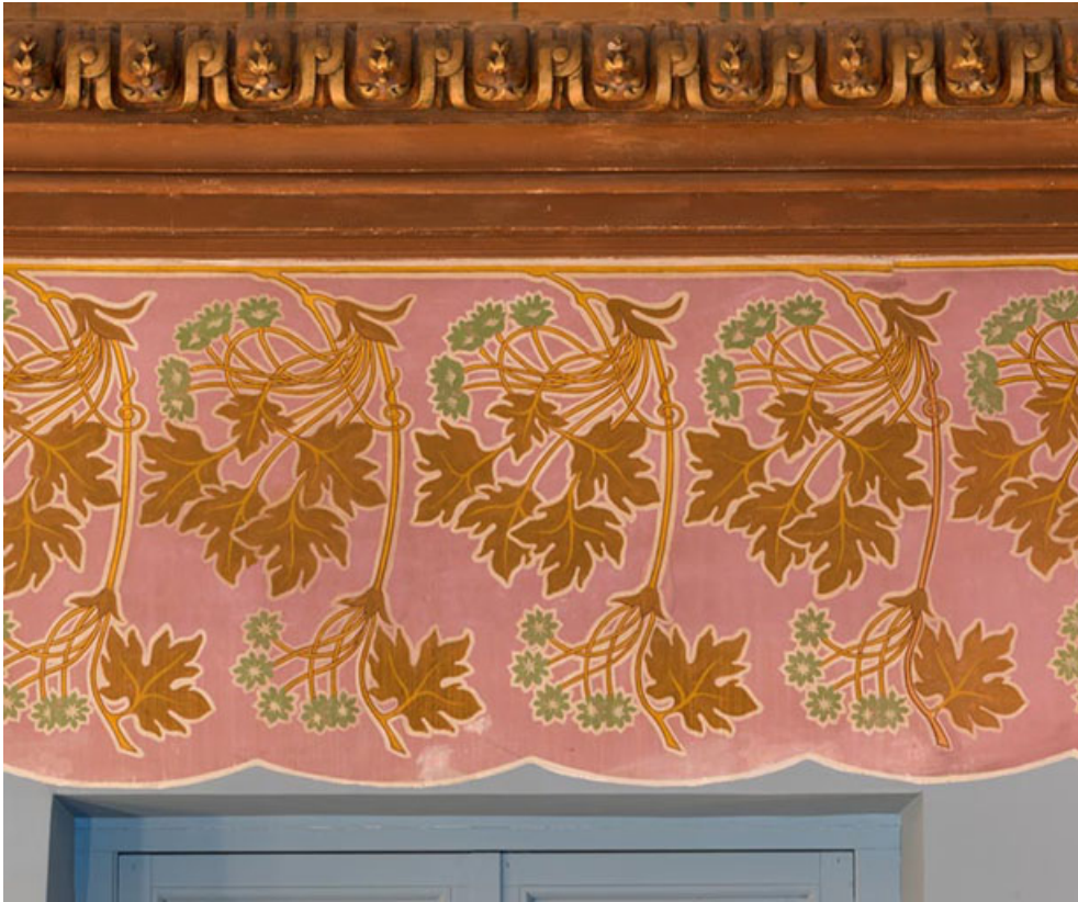
Salle : décor de la frise.