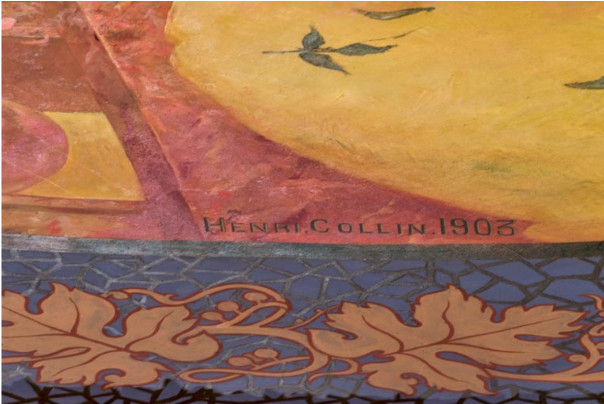
Salle, plafond : signature Henri Collin et date 1903.