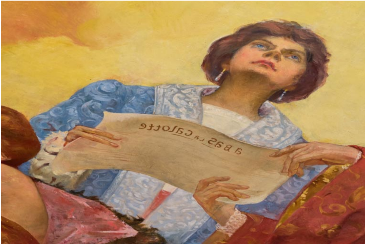
Salle, plafond : partition avec l'inscription "à bas la calotte" (vue à l'envers).