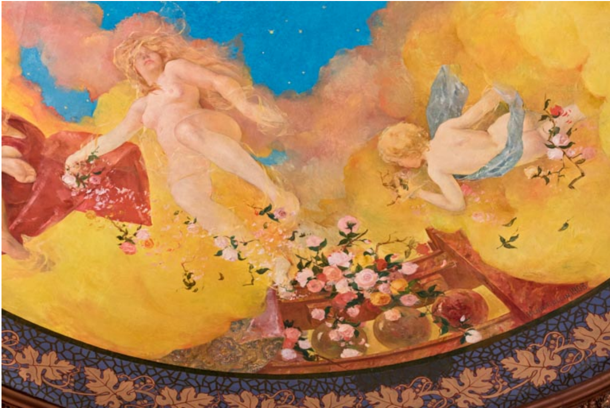
Salle, plafond : 3e groupe de personnages.