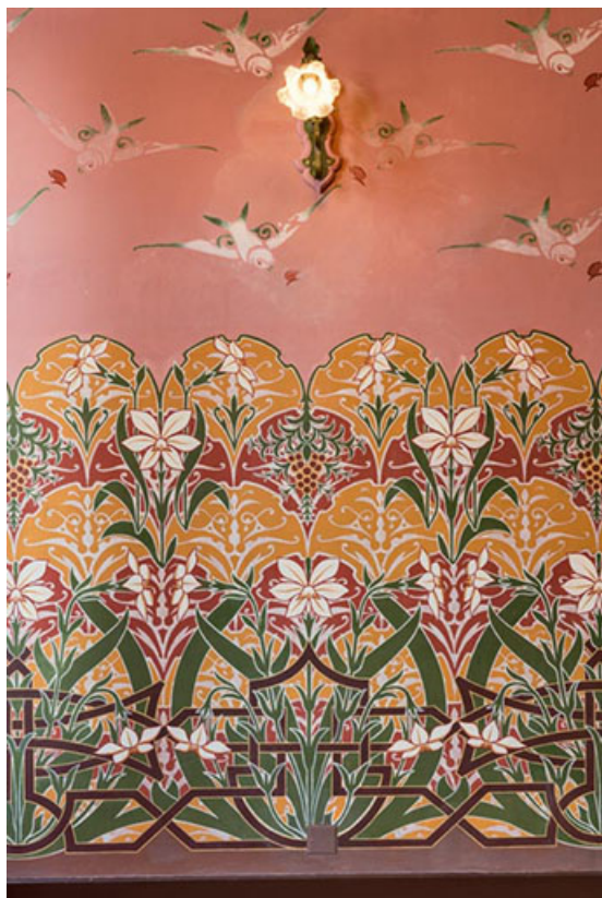
Foyer : mur est (vue rapprochée).