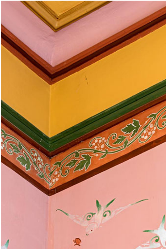
Foyer : décor en partie haute, dans un angle.