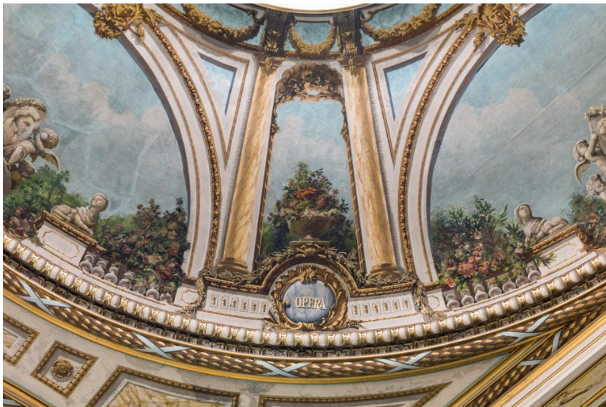
Plafond : décor entre les secteurs côté scène (à droite) et côté jardin, avec l'inscription Opéra. 21, Dijon place du Théâtre