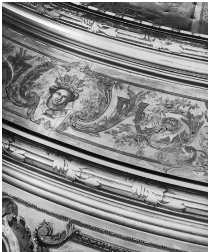
Détail plafond [avant travaux]. S.d. [1969]. 21, Dijon place du Théâtre