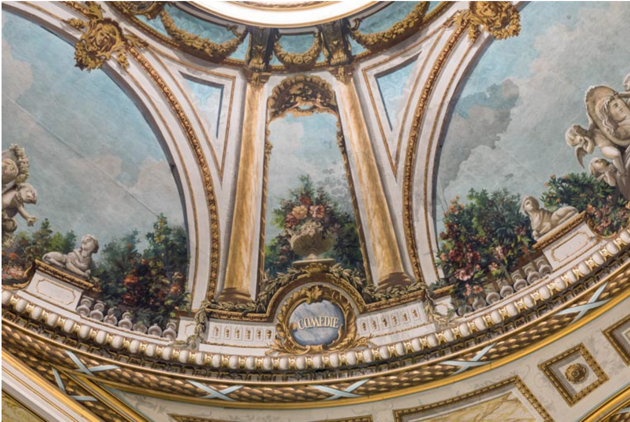
Plafond : décor entre les secteurs côté cour (à droite) et côté scène, avec l'inscription Comédie. 21, Dijon place du Théâtre