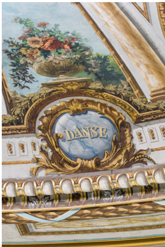
Plafond : inscription Danse.