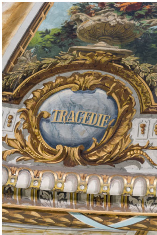
Plafond : inscription Tragédie.