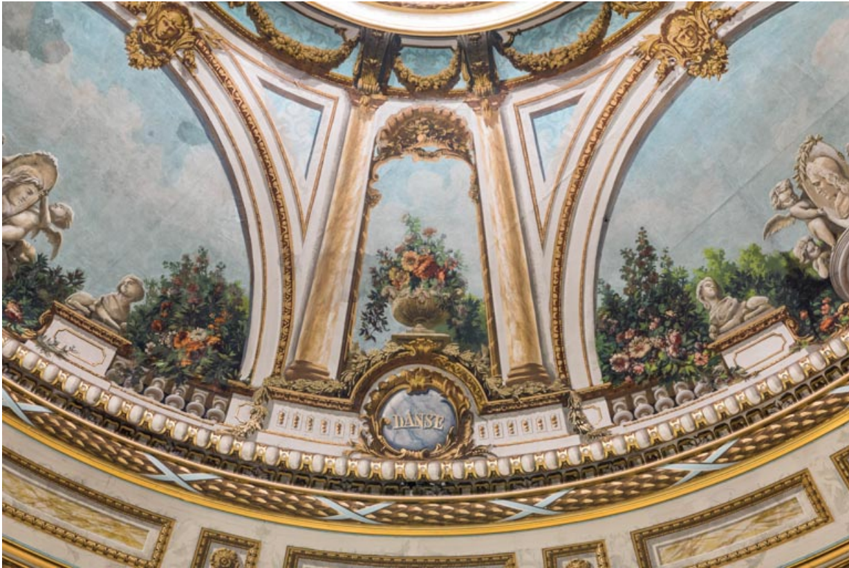
Plafond : décor entre les secteurs du côté du fond de la salle (à droite) et côté cour, avec l'inscription Danse. 21, Dijon place du Théâtre