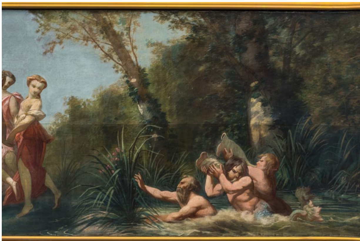
Arc du cadre de scène : tritons.