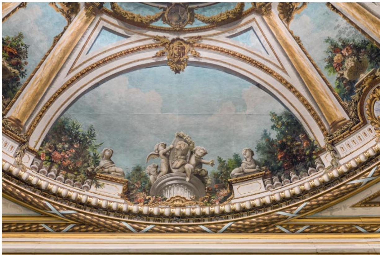
Plafond : décor du secteur côté scène.