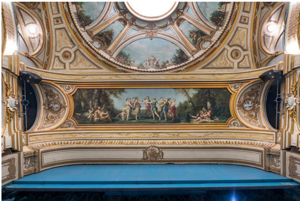
Décor de l'arc du cadre de scène.