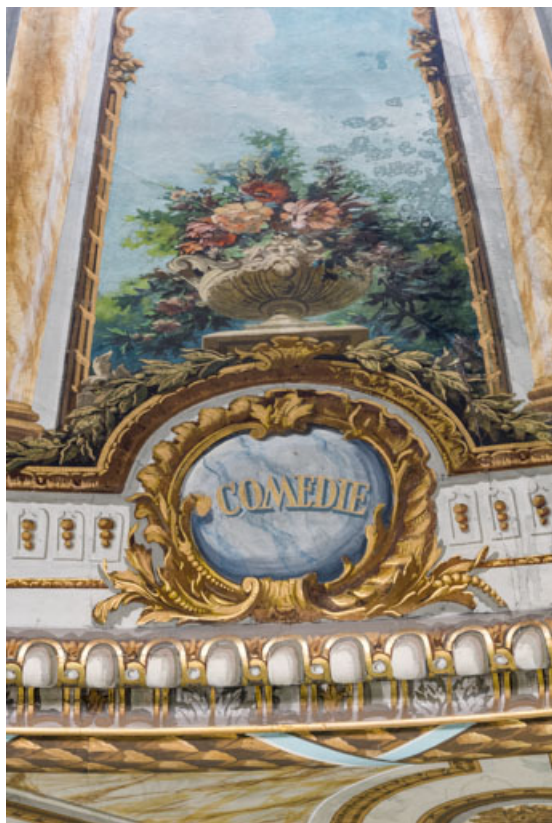
Plafond : inscription Comédie.