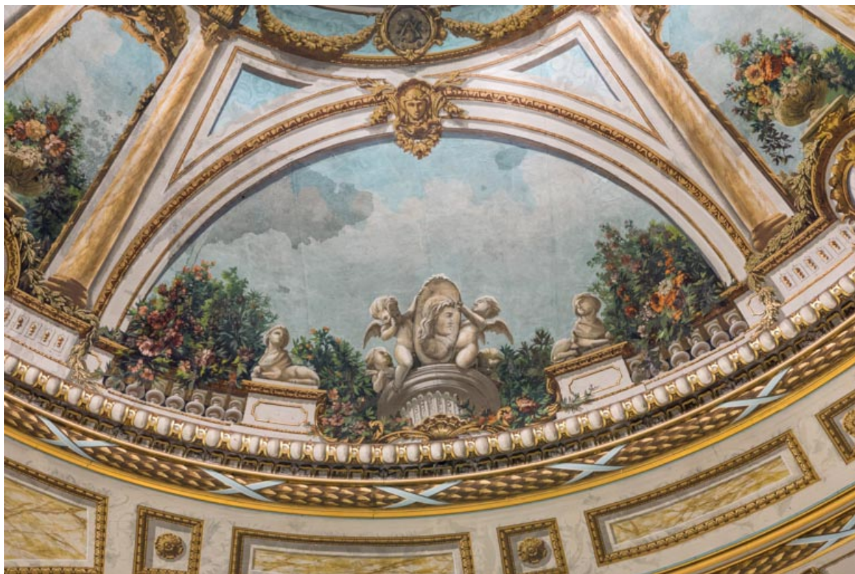
Plafond : décor du secteur côté cour.