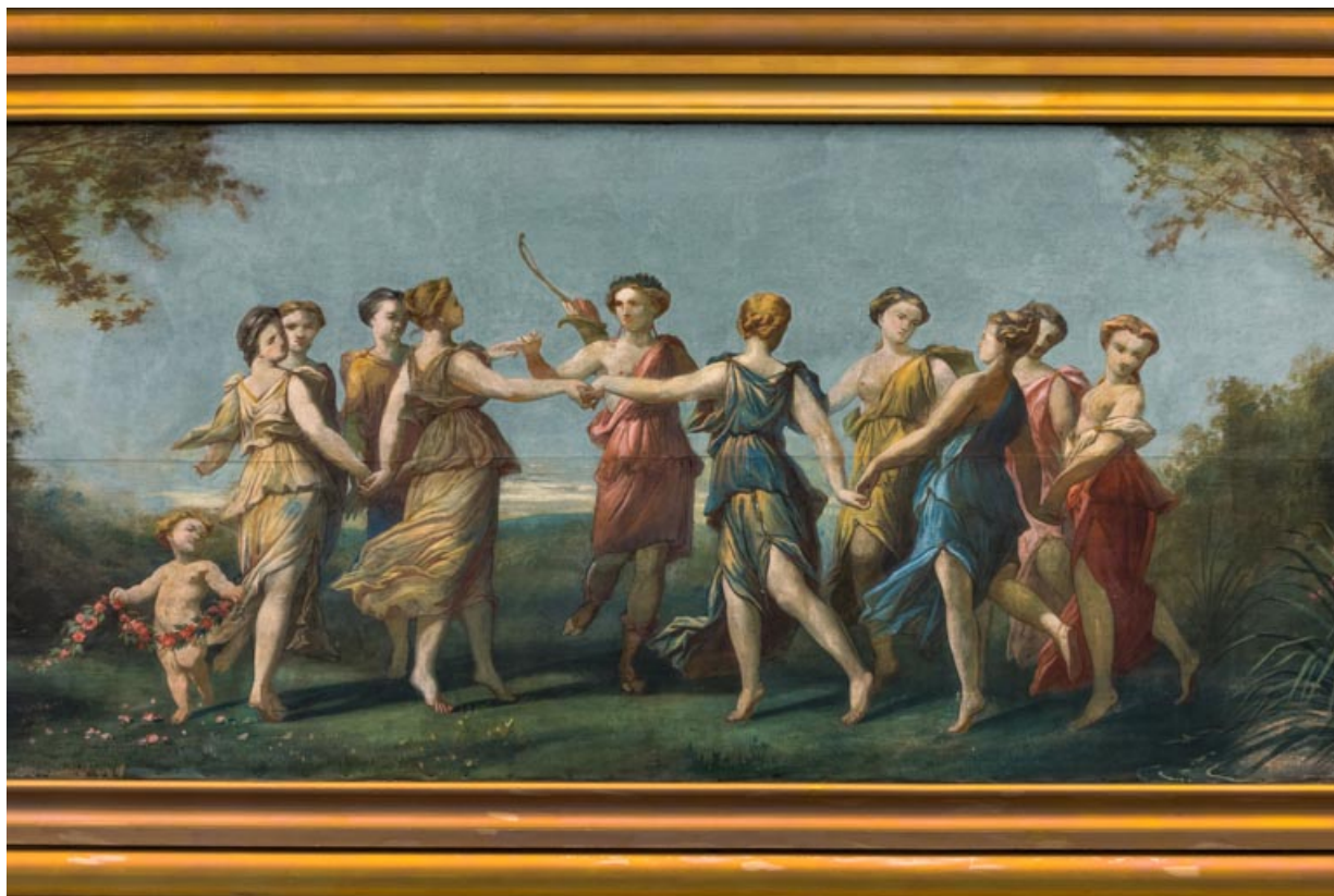
Arc du cadre de scène : Apollon et les neuf Muses.