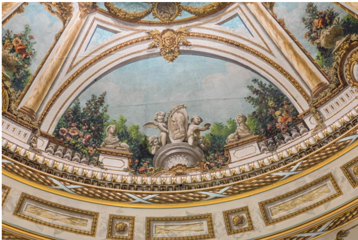
Plafond : décor du secteur côté fond de la salle.