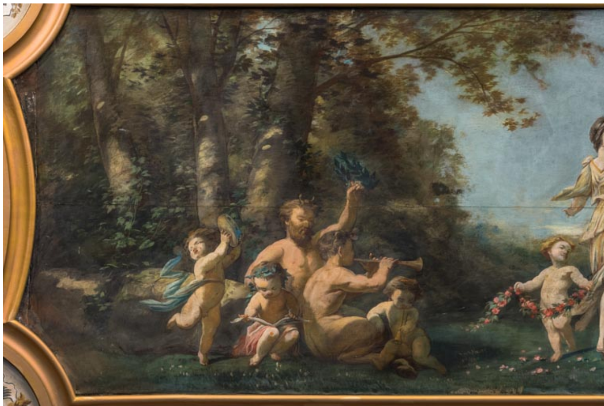
Arc du cadre de scène : faunes et amours.