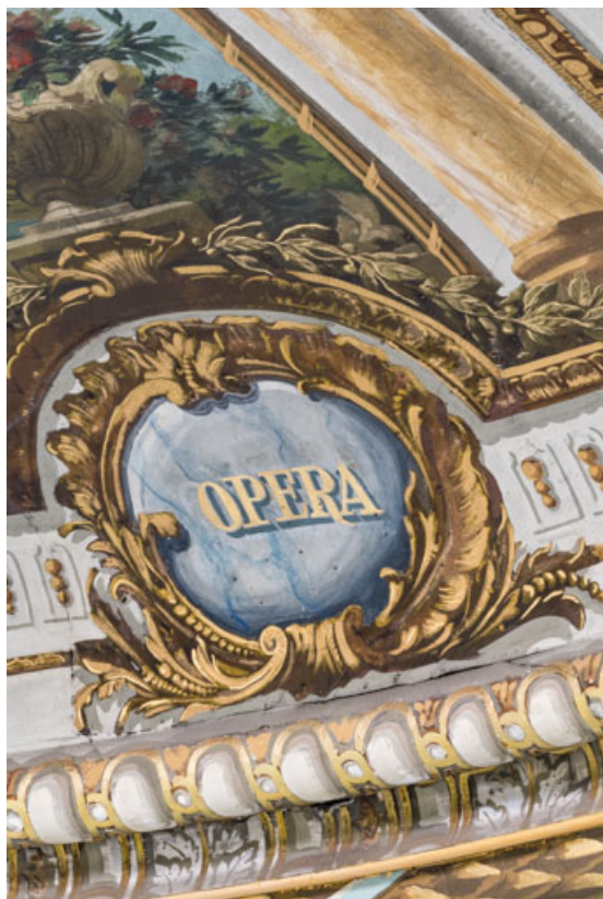
Plafond : inscription Opéra.