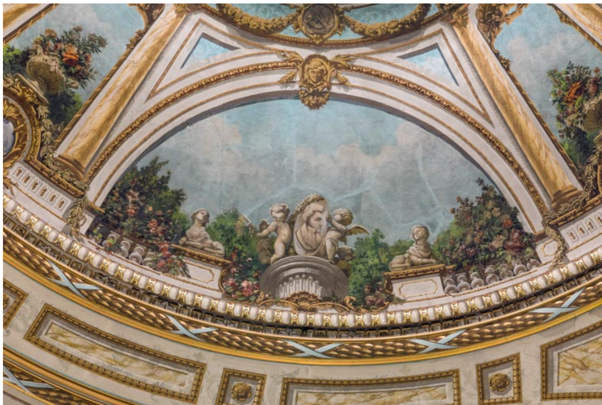
Plafond : décor du secteur côté jardin.