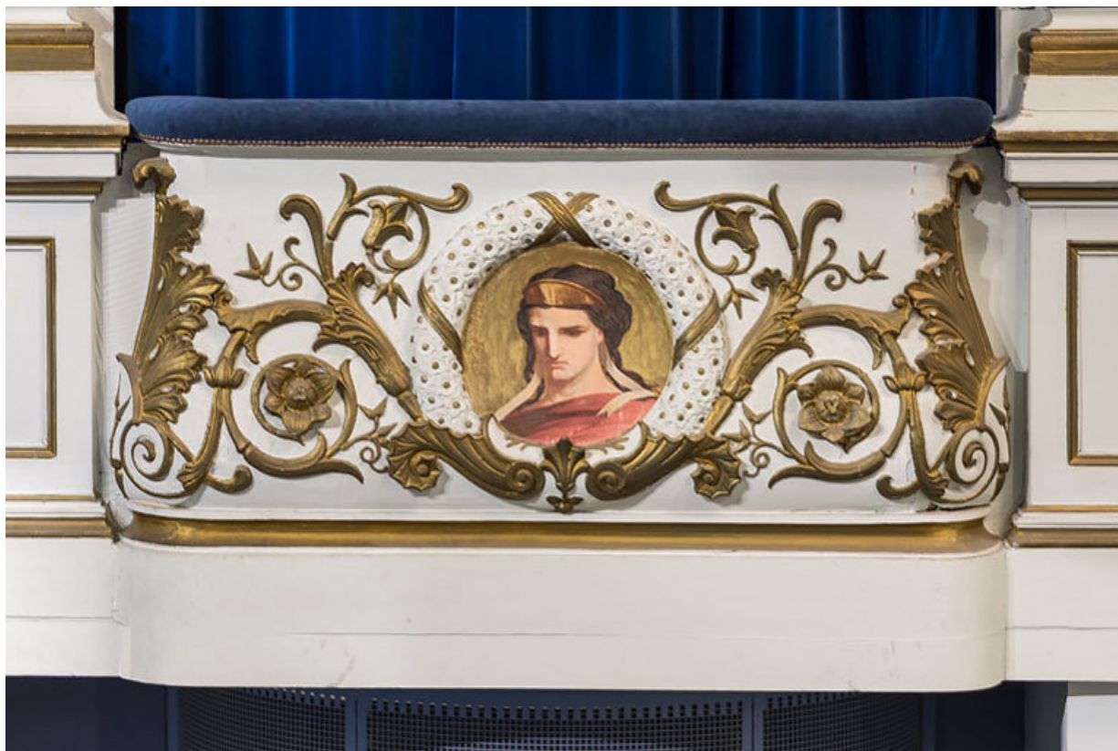
Loge d'avant-scène côté cour, 1er balcon : décor du garde-corps avec la représentation de la Tragédie. 21, Beaune, 64 rue de Lorraine