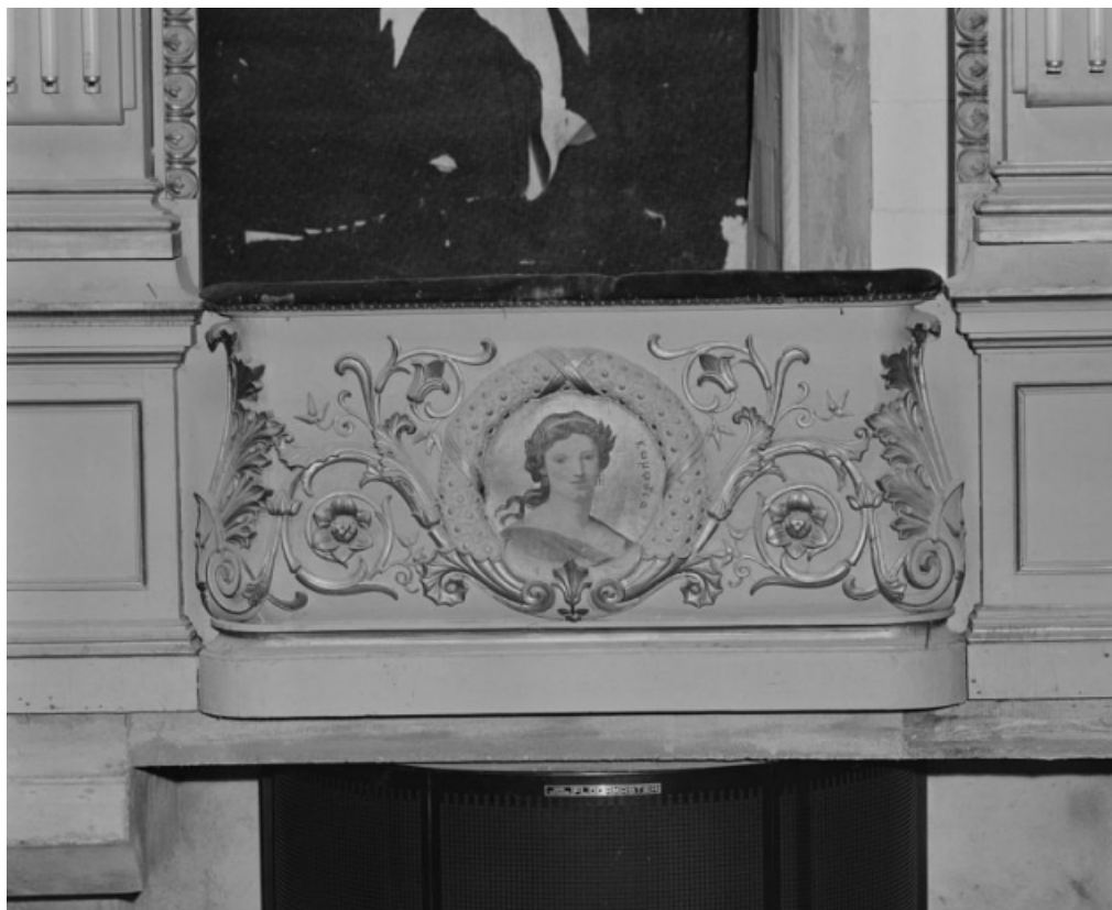
Loge d'avant-scène côté jardin, 1er balcon, en 1988, avant restauration : décor du garde-corps avec la représentation de la Comédie.