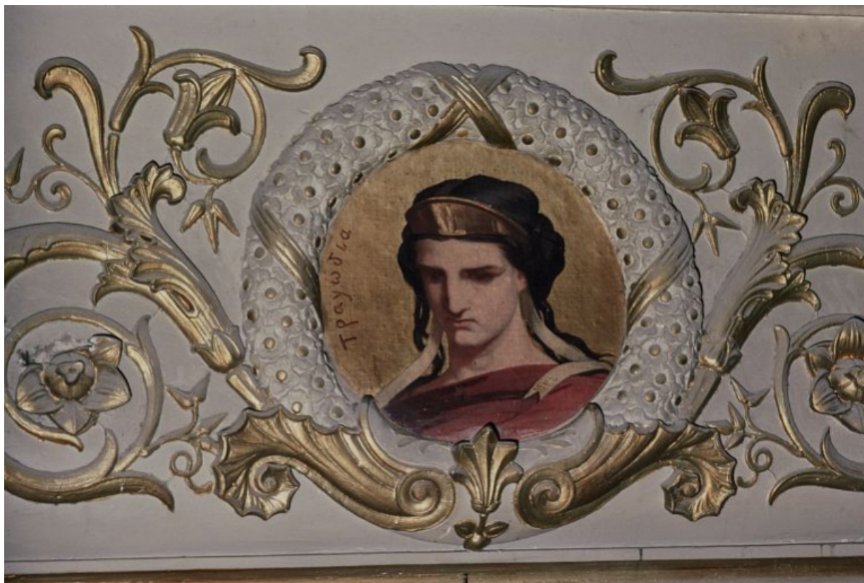
La figure de la Tragédie, en 1988, avant restauration.