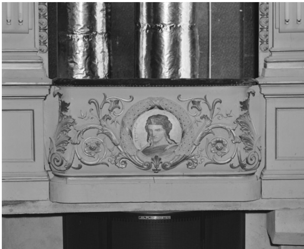
Loge d'avant-scène côté cour, 1er balcon, en 1988, avant restauration : décor du garde-corps avec la représentation de la Tragédie. 21, Beaune, 64 rue de Lorraine