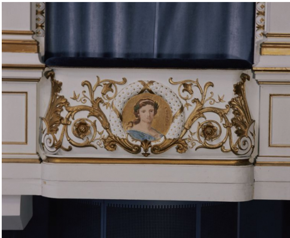
La figure de la Comédie, en 1996, après restauration.