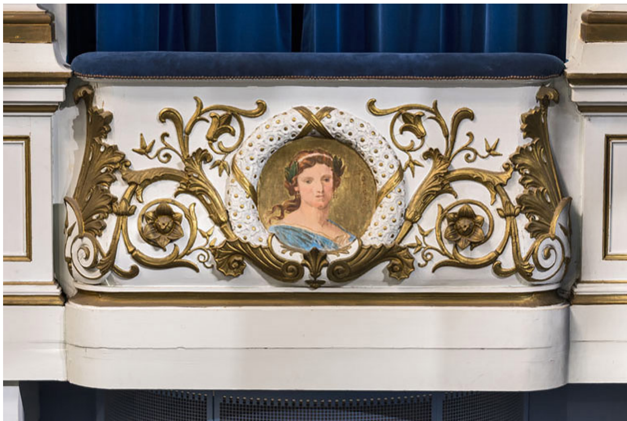
Loge d'avant-scène côté jardin, 1er balcon : décor du garde-corps avec la représentation de la Comédie. 21, Beaune, 64 rue de Lorraine