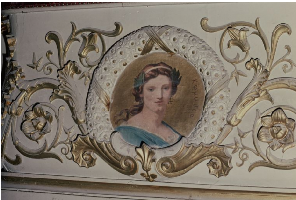
La figure de la Comédie, en 1988, avant restauration.