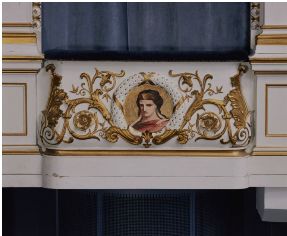
La figure de la Tragédie, en 1996, après restauration.