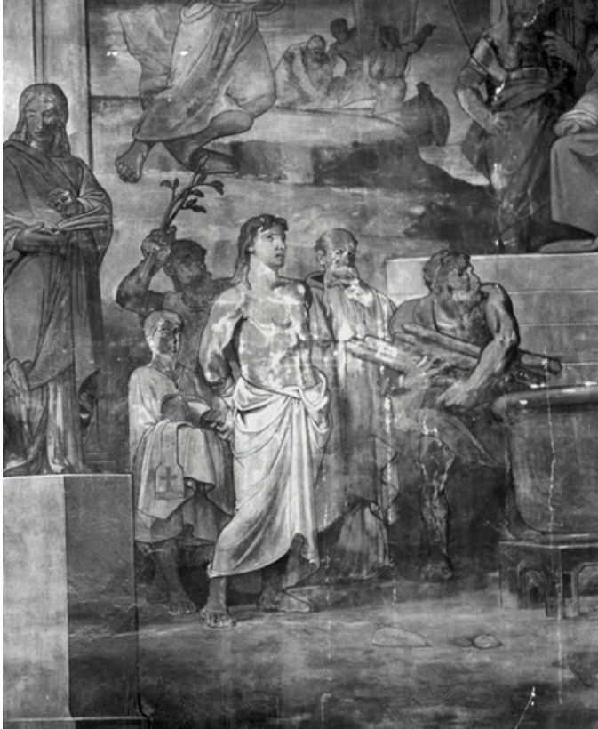
Partie droite, registre inférieur (1991) : saint Jean conduit au supplice. 21, Dijon, 15 rue Danton