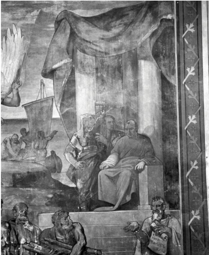
Partie droite, registre inférieur (1991) : juge sous sa tente assistant à la préparation du supplice de saint Jean. 21, Dijon, 15 rue Danton