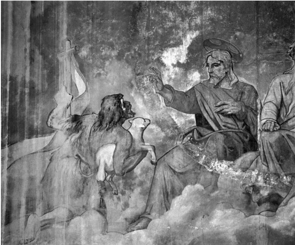
Registre supérieur (1991) : Saint Jean-Baptiste accueilli au Paradis.