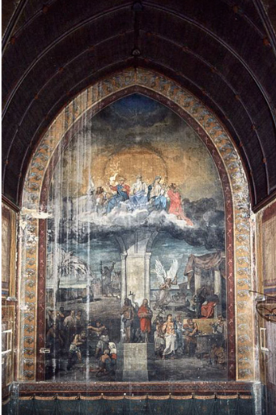
Vue d'ensemble (1991).