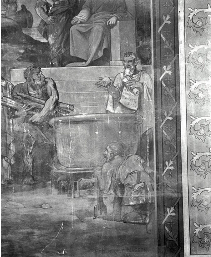
Partie droite, registre inférieur (1991) : personnage activant le feu sous la chaudière d'huile bouillante destinée au supplice de saint Jean.