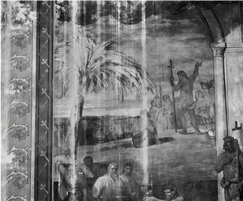
Partie gauche, registre médian (1991) : saint Jean-Baptiste prêche dans le désert devant une foule amassée. 21, Dijon, 15 rue Danton