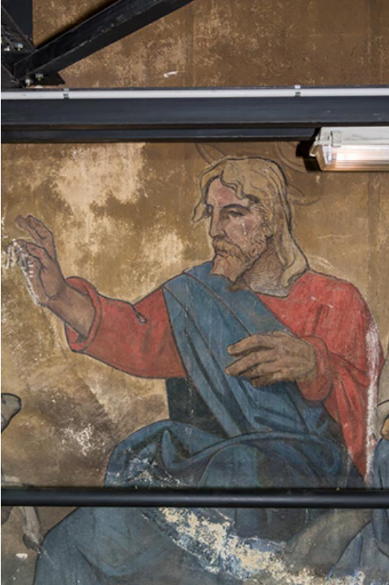
Registre supérieur (2022) : le Christ bénissant.