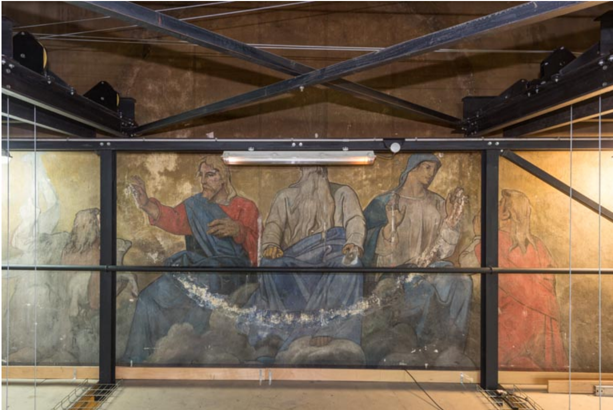
Registre supérieur (2022) : saint Jean-Baptiste et saint Jean accueillis au Paradis. 21, Dijon, 15 rue Danton