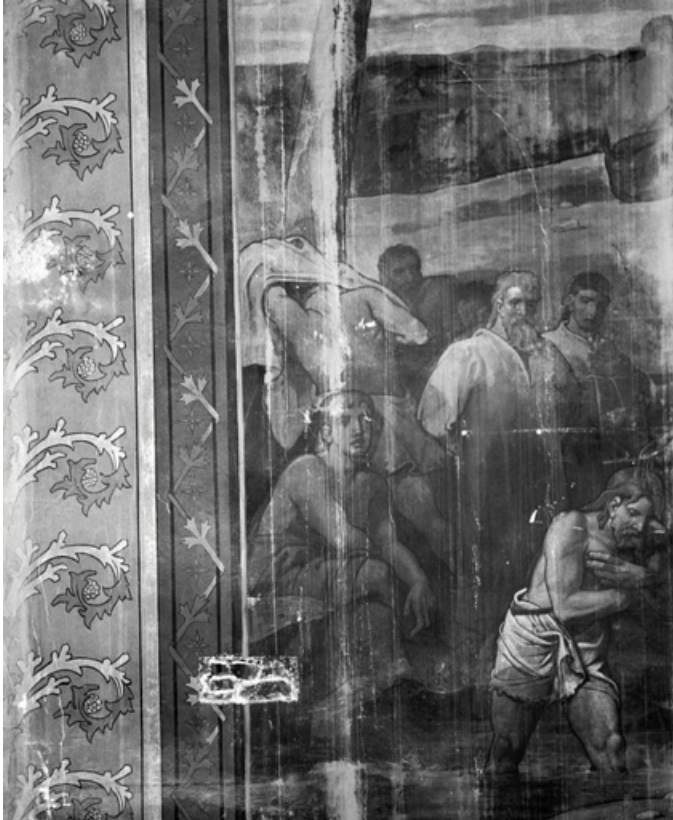
Partie gauche, registre inférieur (1991) : personnages assistant au baptême du Christ. 21, Dijon, 15 rue Danton