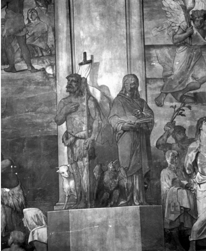
Partie centrale, registre inférieur (1991) : saint Jean-Baptiste et saint Jean. 21, Dijon, 15 rue Danton