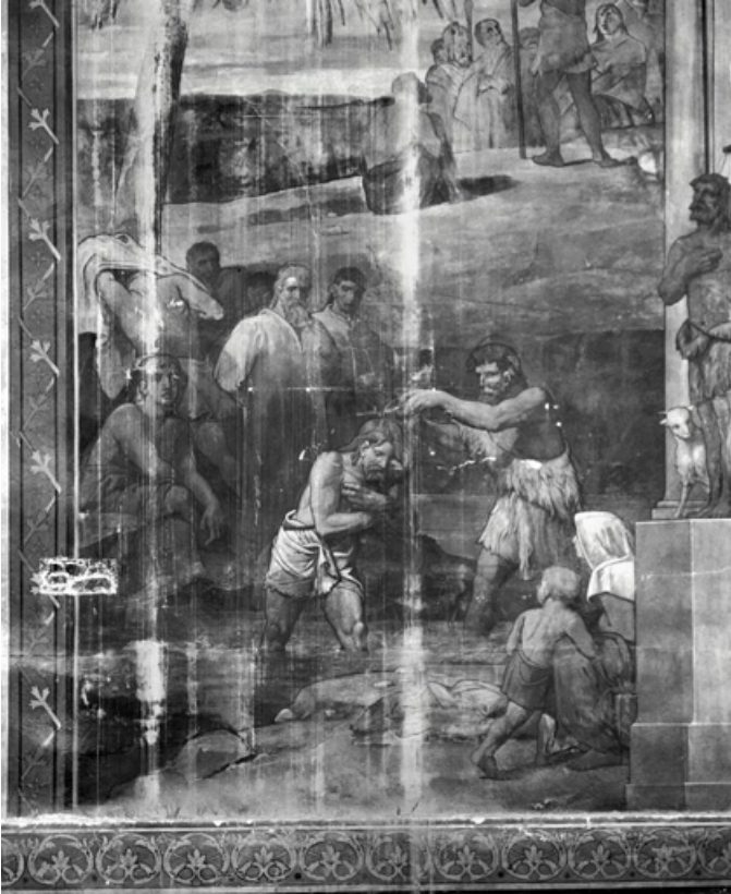
Partie gauche, registre inférieur (1991) : saint Jean-Baptiste baptise le Christ. 21, Dijon, 15 rue Danton