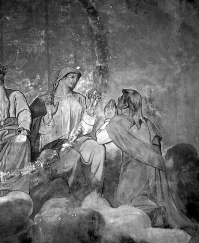
Registre supérieur (1991) : saint jean accueilli au Paradis.