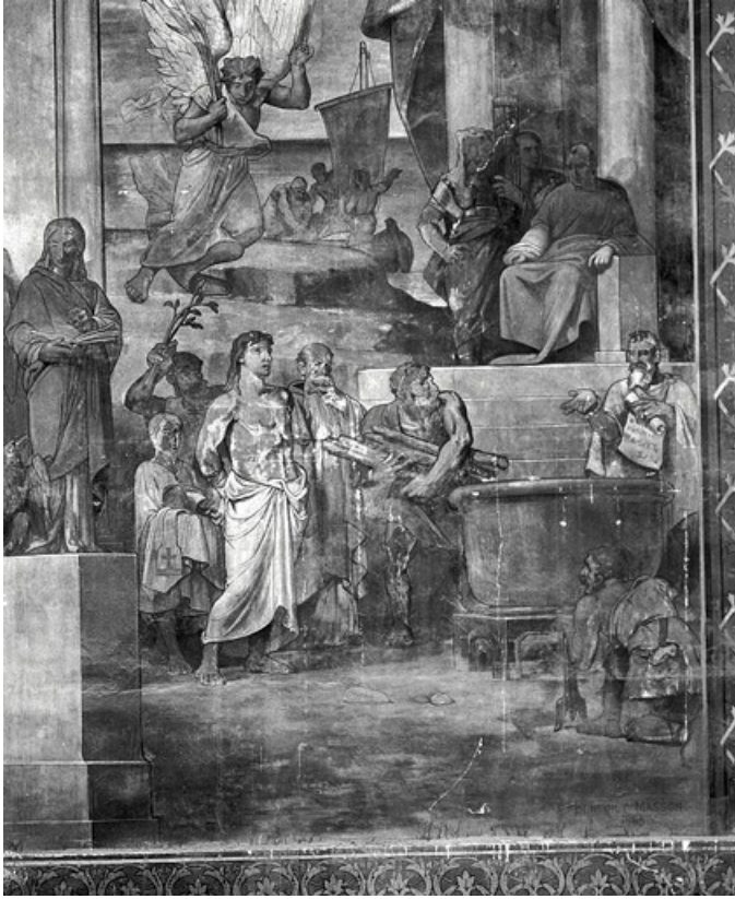
Partie droite, registre inférieur (1991) : le supplice de saint Jean. 21, Dijon, 15 rue Danton