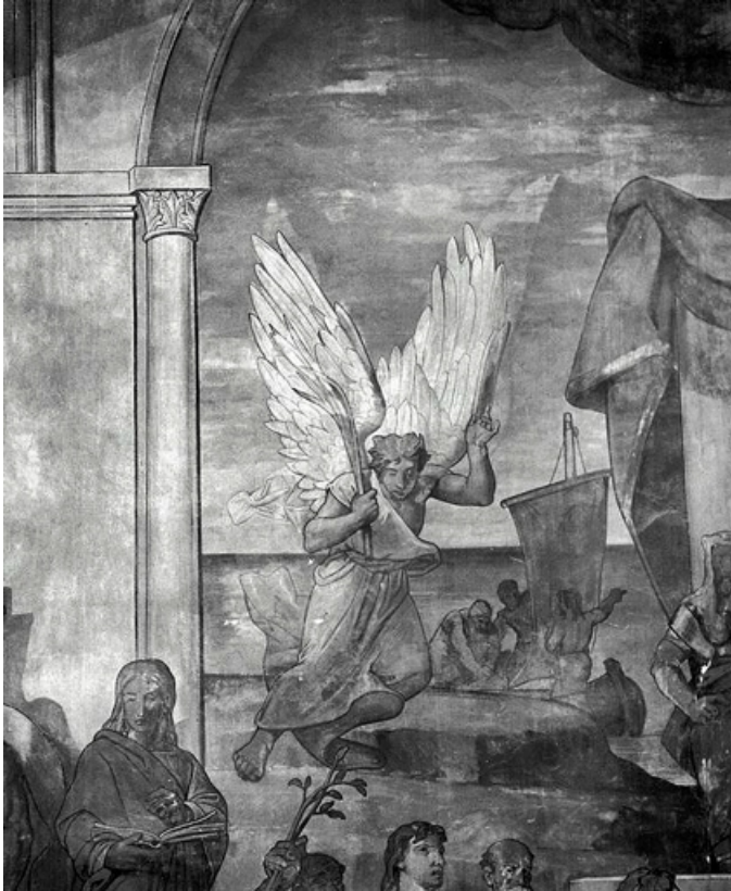
Partie droite, registre médian (1991) : un ange apporte la palme du martyre à saint Jean. 21, Dijon, 15 rue Danton