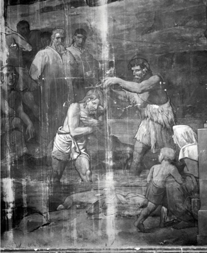
Partie gauche, registre inférieur (1991) : saint Jean-Baptiste baptise le Christ (détail). 21, Dijon, 15 rue Danton