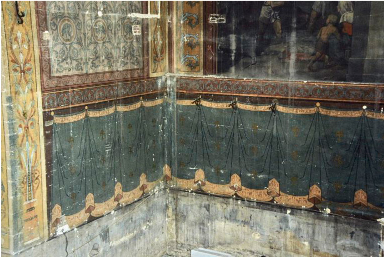
Partie inférieure (1991) : décor de draperies.