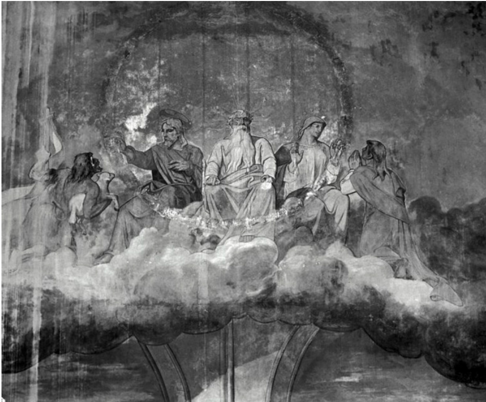
Registre supérieur (1991) : saint Jean-Baptiste et saint Jean accueillis au Paradis. 21, Dijon, 15 rue Danton