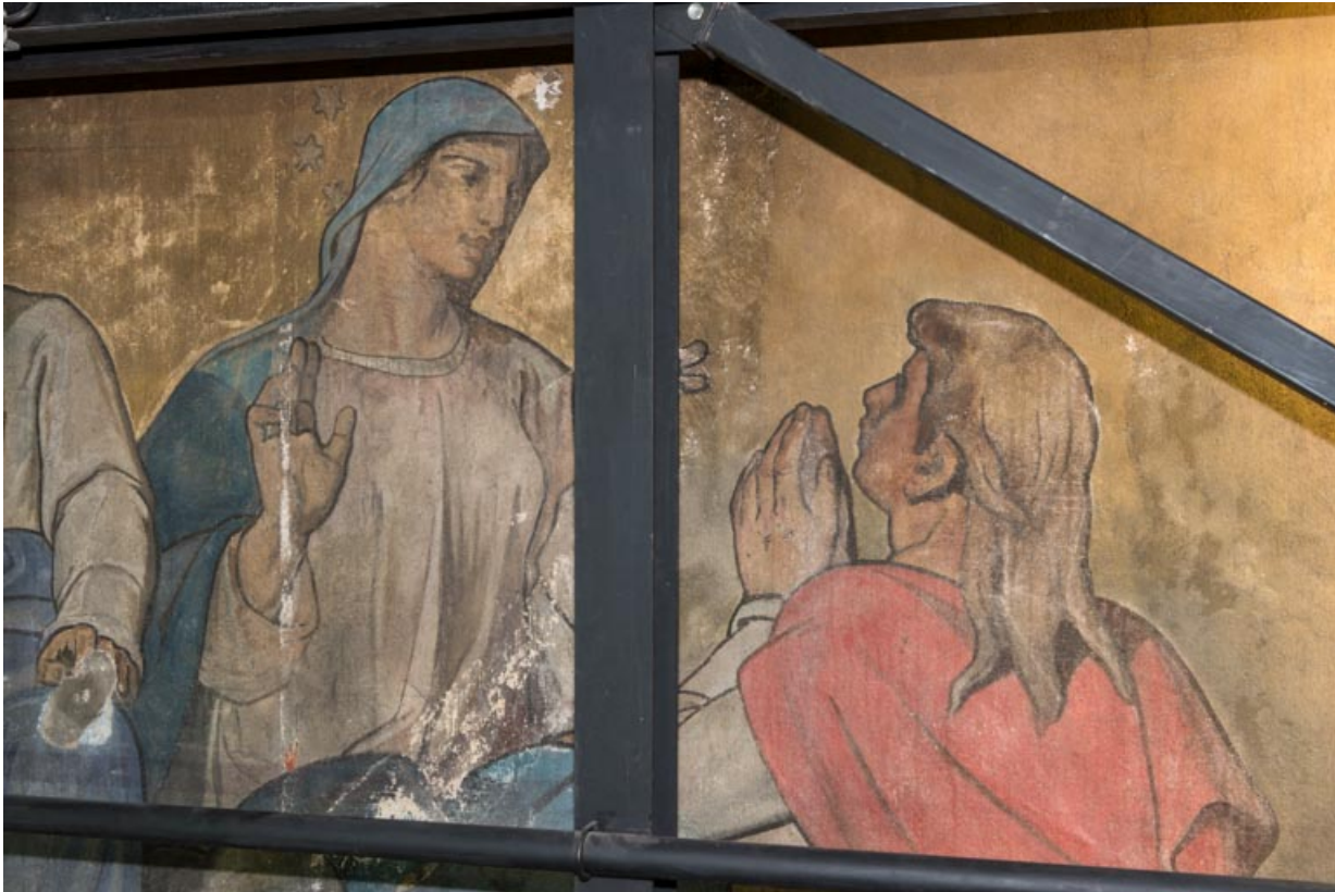
Registre supérieur (2022) : saint jean accueilli au Paradis (détail).