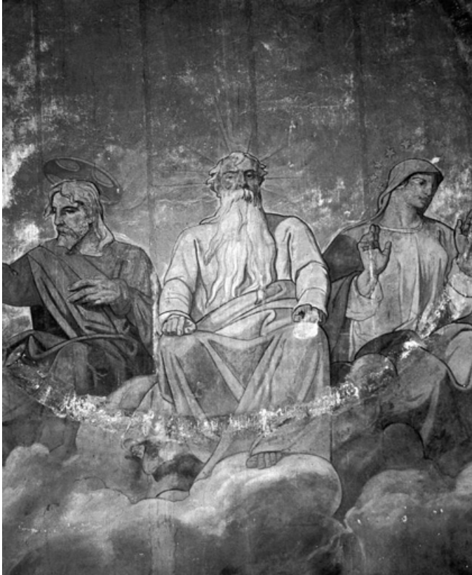
Registre supérieur (1991) : le Christ, Dieu le Père et la Vierge.