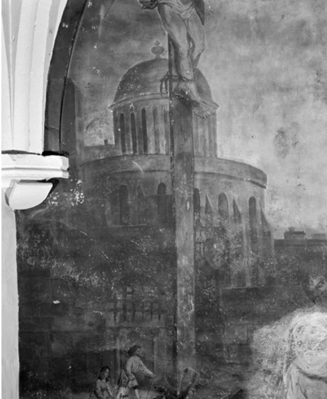
Partie supérieure (1991) : architecture à gauche.