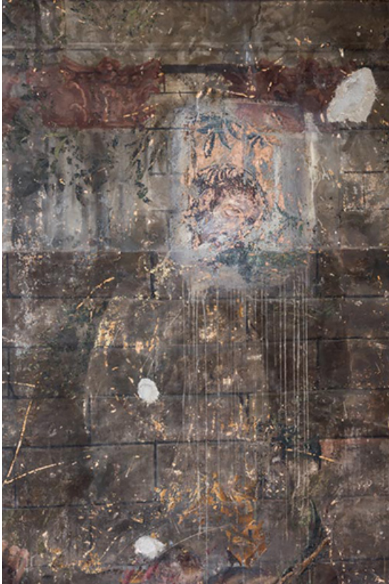
Sondage à droite, révélant une tête.