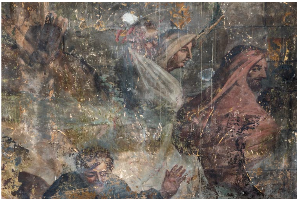
Deux personnages en bas à droite.