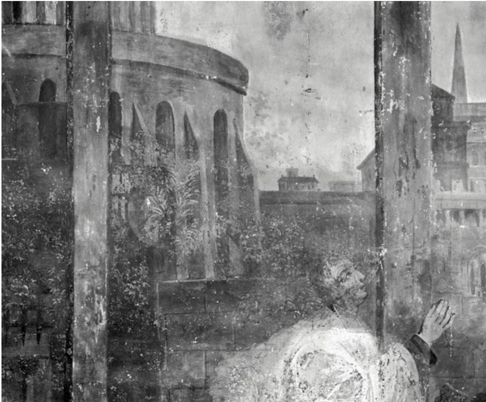
Partie supérieure (1991) : architecture à gauche (détail).