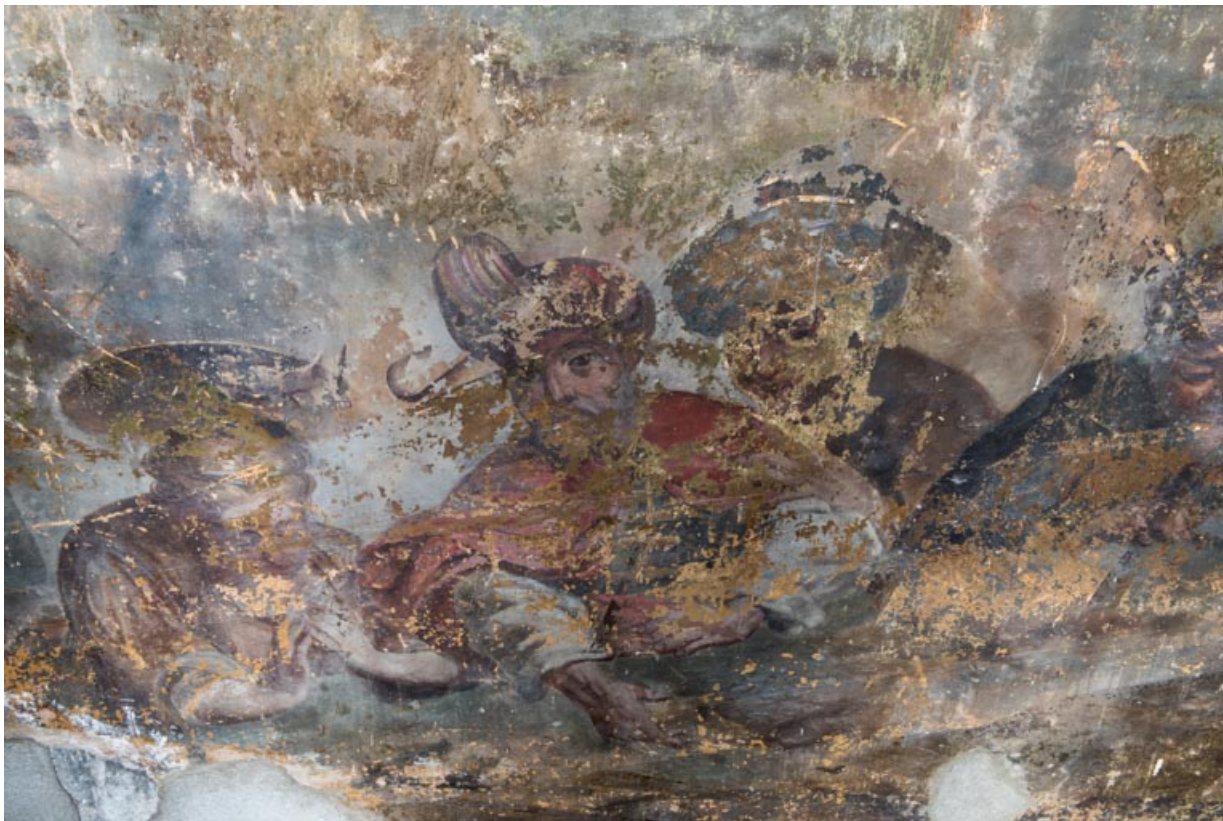
Groupe de trois personnages, en bas à droite.