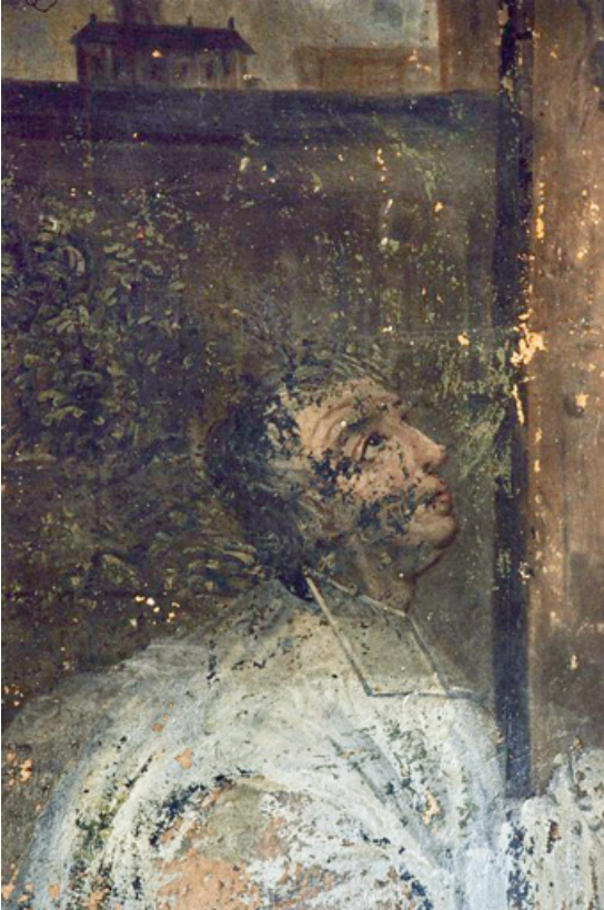
Partie inférieure (1991) : visage du prêtre agenouillé.