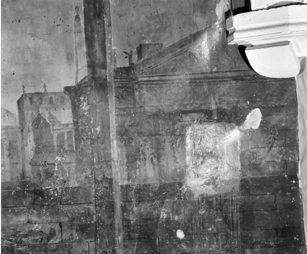
Partie supérieure (1991) : architecture à droite.