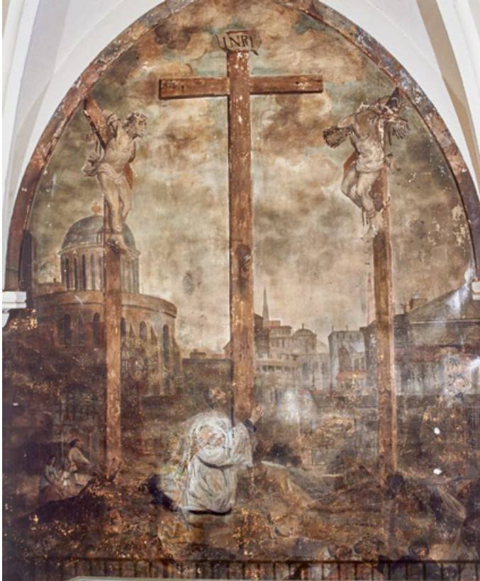
Vue d'ensemble (1991) : partie supérieure.