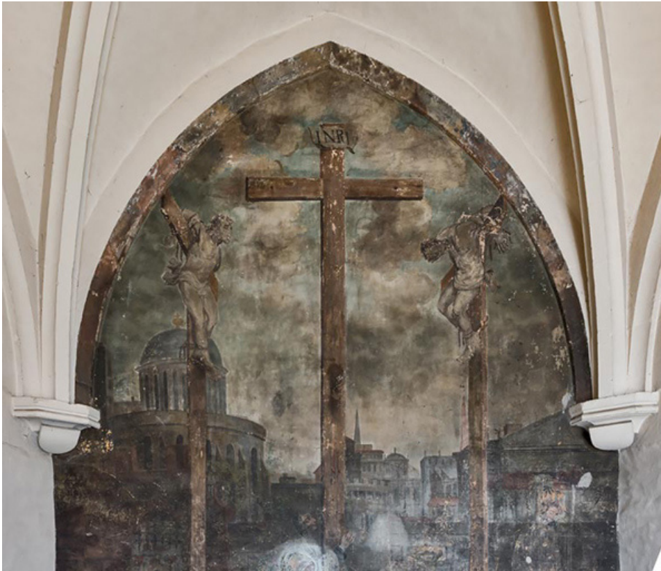
Partie supérieure : les croix.