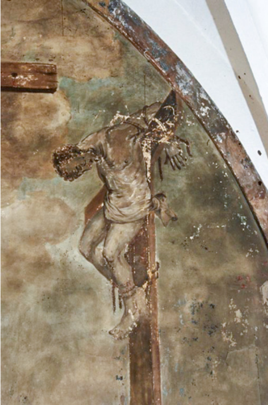
La mauvais larron (1991).