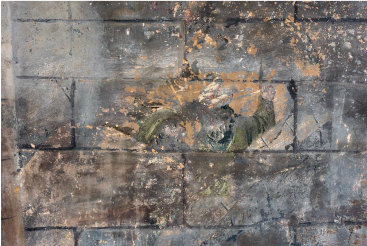
Sondage entre les deux croix de droite, révélant deux personnages.