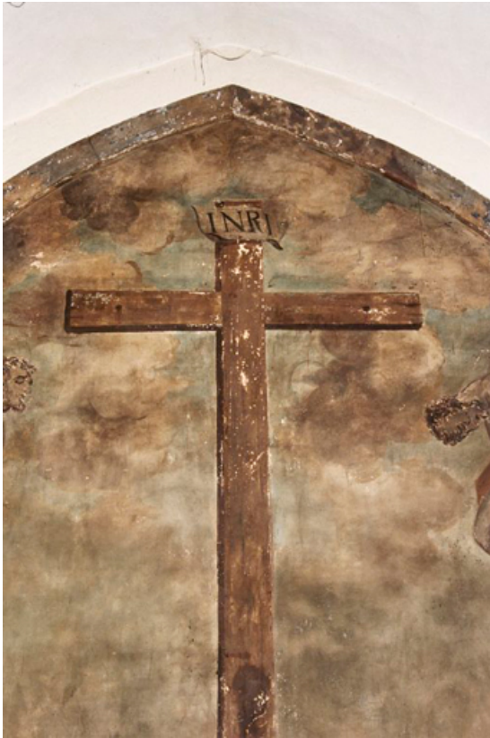
La croix du Christ (1991).