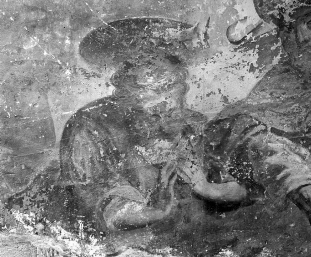
Personnage de droite du groupe de trois, en bas à droite (1991).