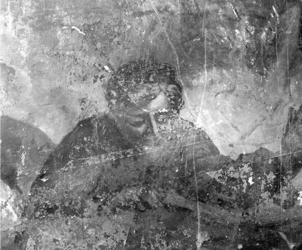
Personnage en bas à droite (1991).