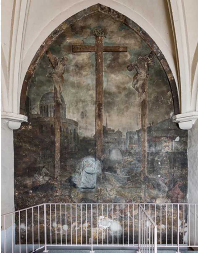
Peinture monumentale dans l'ancienne chapelle du Saint-Sépulcre (rez-de-chaussée de la tour sud). 21, Dijon, 15 rue Danton