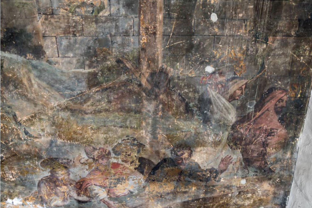
Ensembles de personnages en bas à droite.