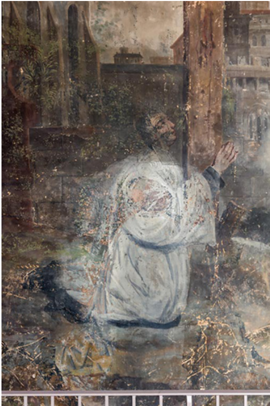
Partie inférieure : détail du prêtre agenouillé.