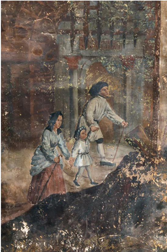
Couple et son enfant vêtus à la mode du 15e siècle, à gauche.