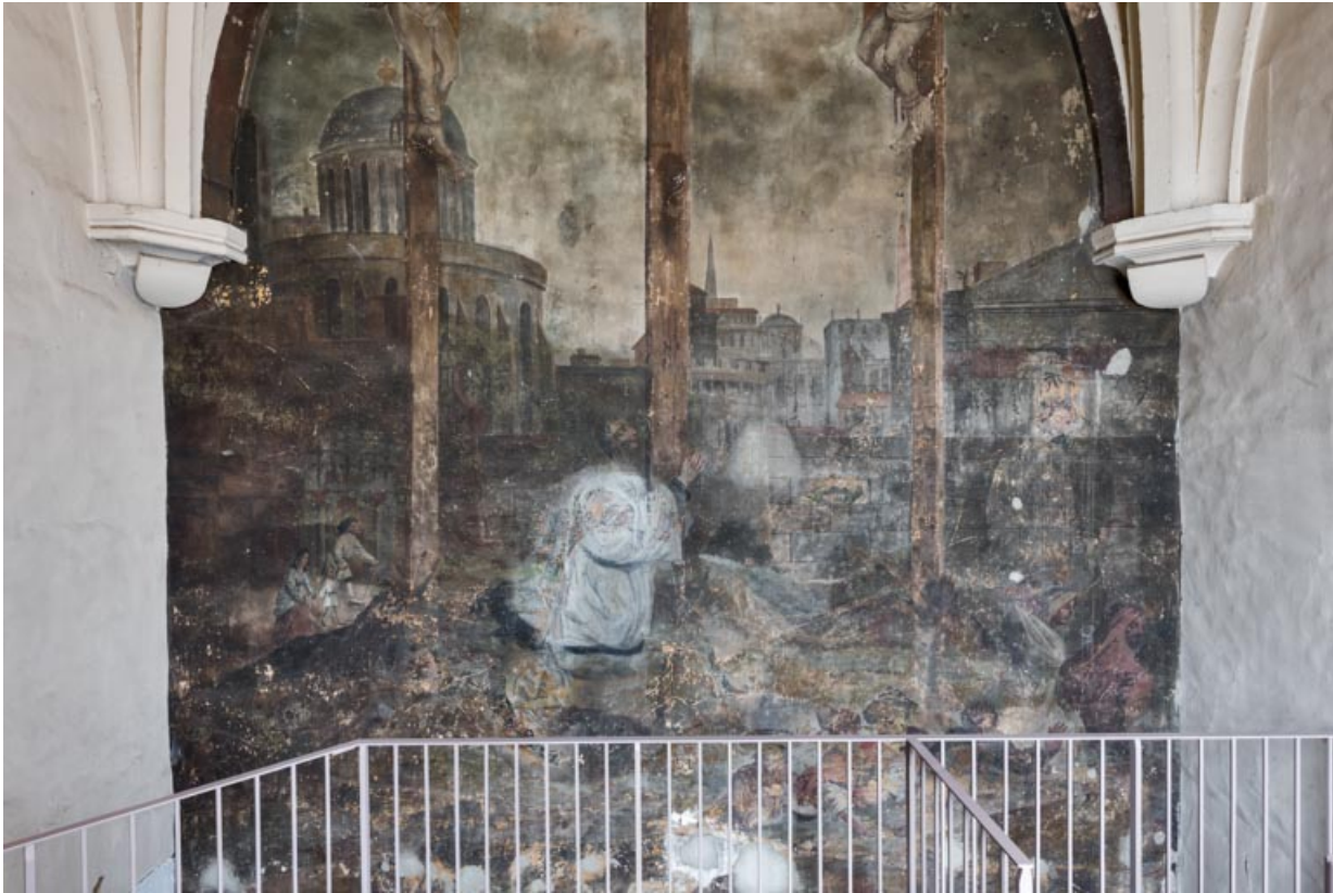
Partie inférieure : prêtre agenouillé au pied de la Croix.