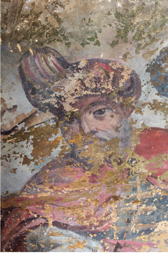
Personnage central du groupe de trois, en bas à droite.