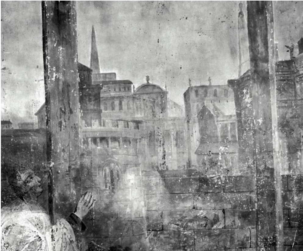
Partie supérieure (1991) : architecture au centre.