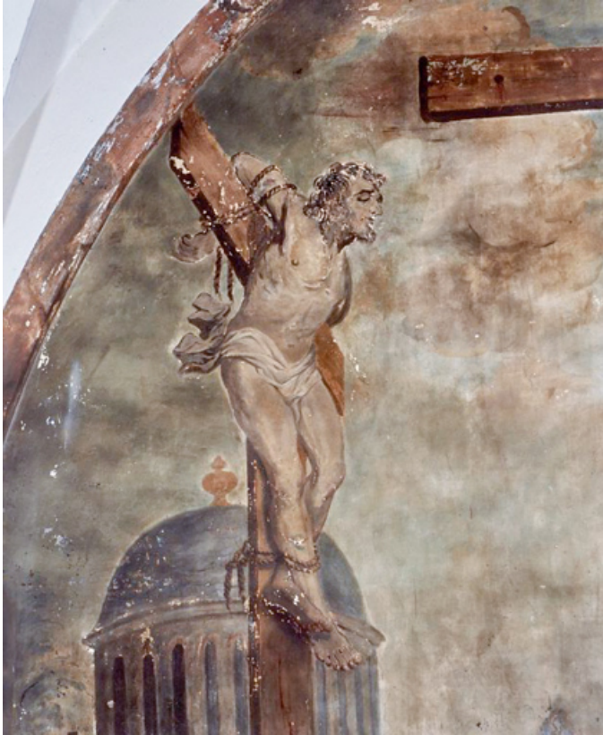
Le bon larron (1991).