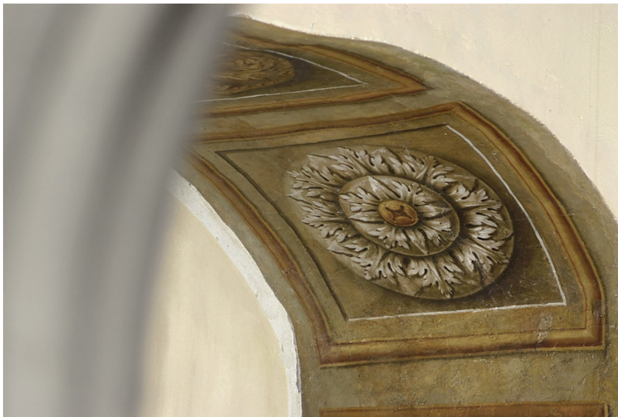
Peinture de l'embrasure de la porte : détail.