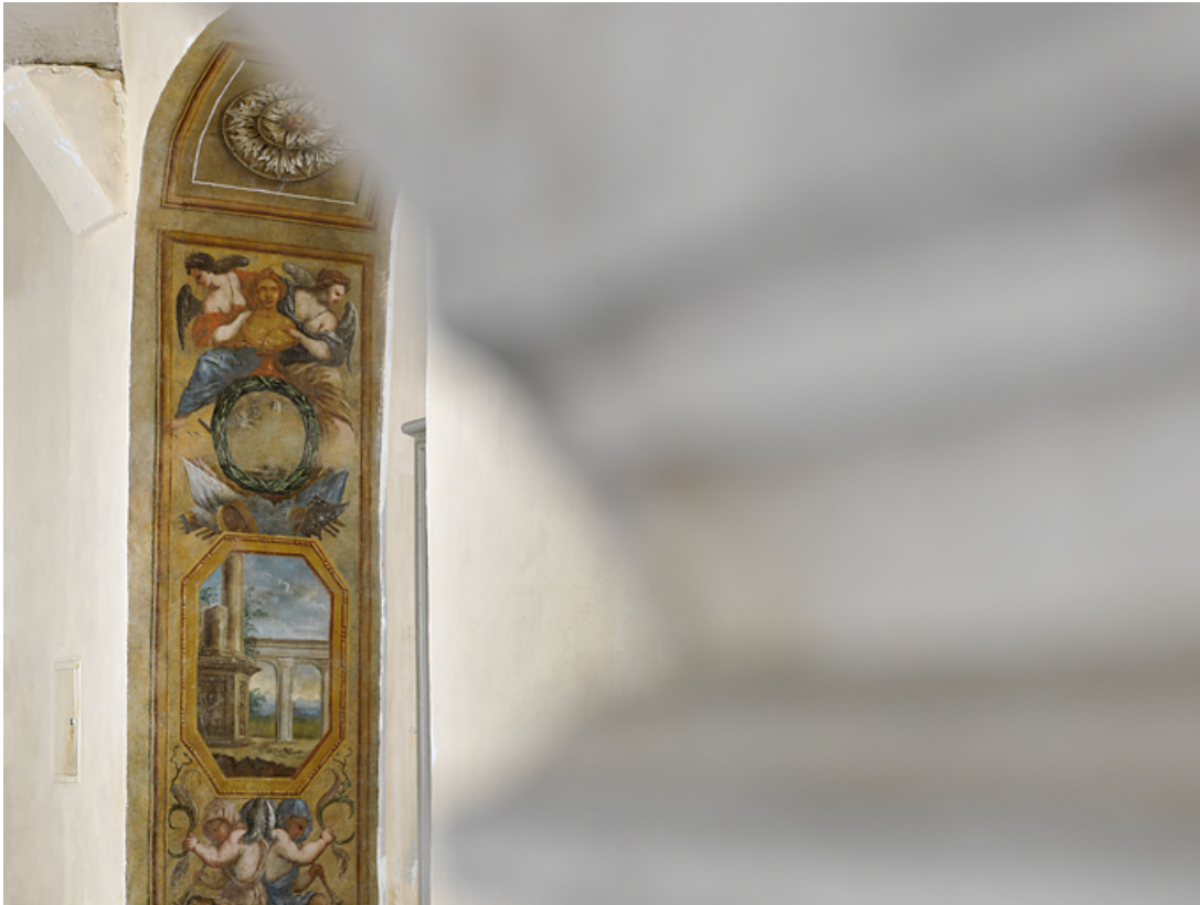
Peinture de l'embrasure de la porte : détail.