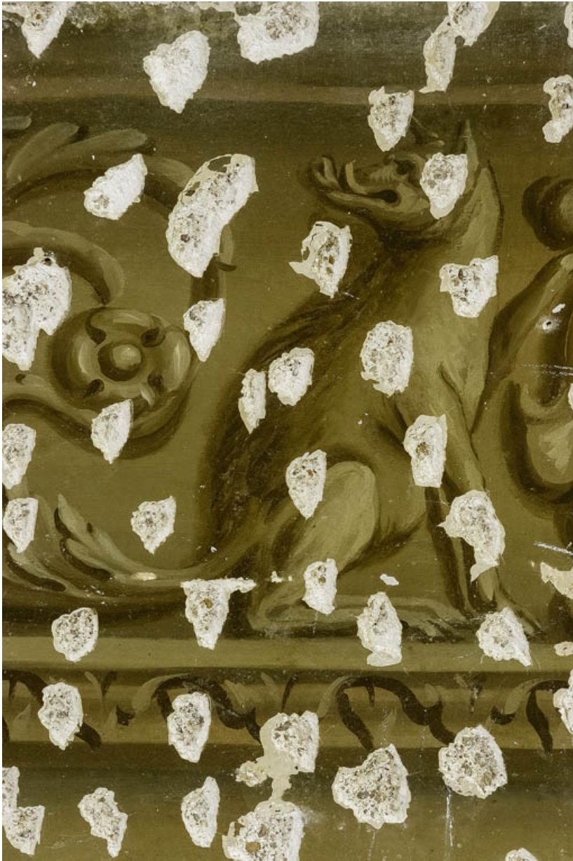
Peinture du petit salon : griffon.