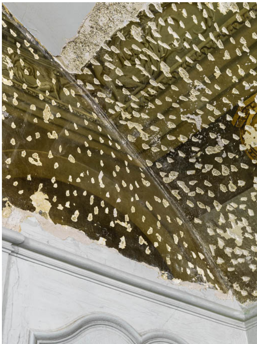
Peinture du petit salon : détail.