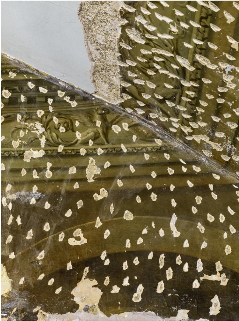
Peinture du petit salon : détail.