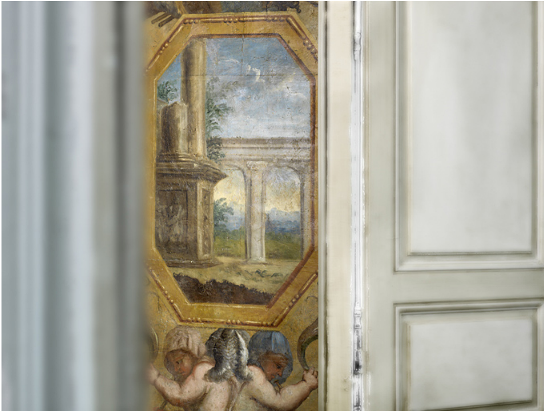
Peinture de l'embrasure de la porte : détail.