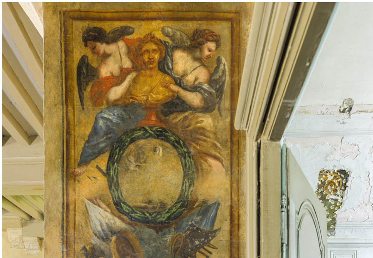
Peinture de l'embrasure de la porte : détail. 21, Châteauneuf château fort