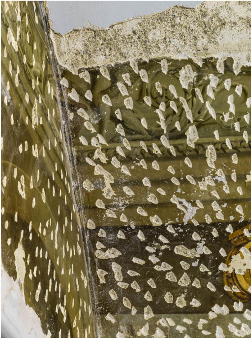
Peinture du petit salon : détail.