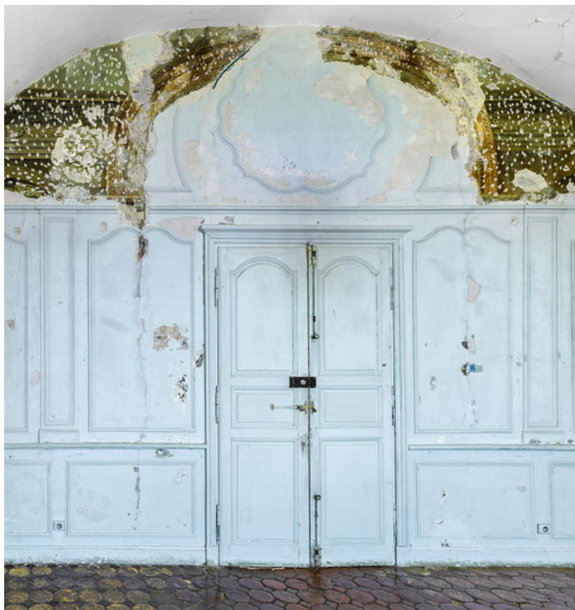
Peinture du petit salon : mur est.