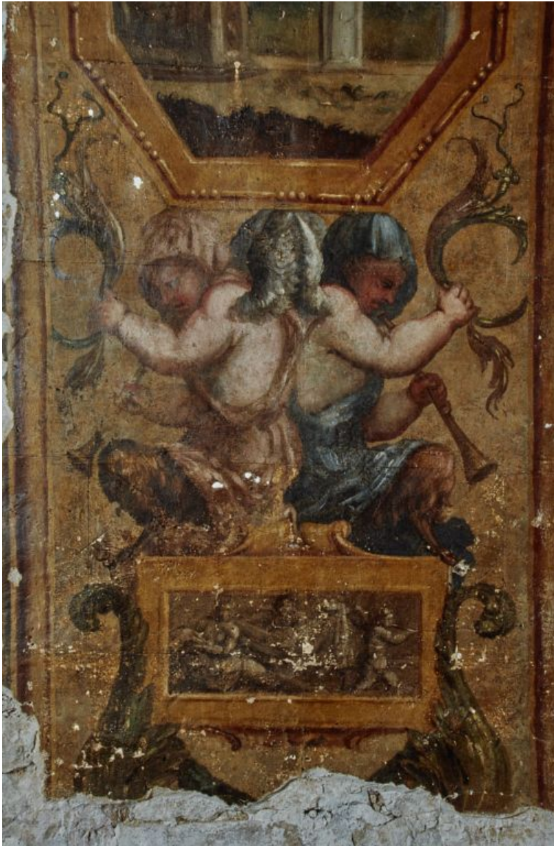
Peinture de l'embrasure de la porte : détail.