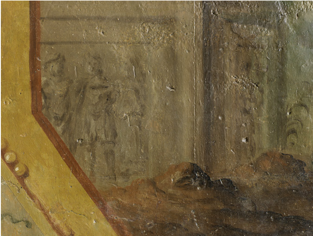
Peinture de l'embrasure de la porte : détail.