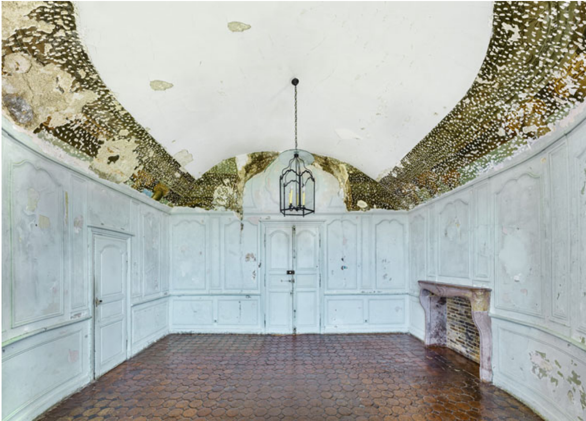
Vue d'ensemble des peintures murales du petit salon.