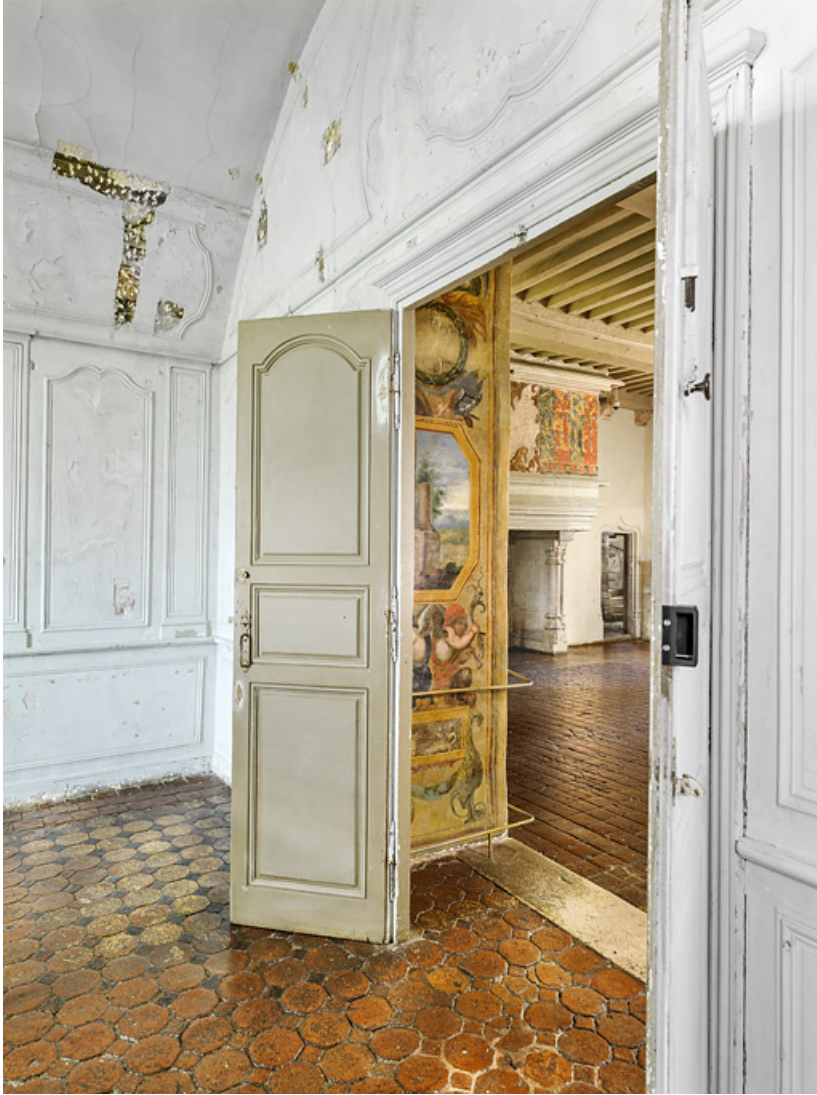
Entrée dans le petit salon pendant le dégagement des peintures en 2016. 21, Châteauneuf château fort