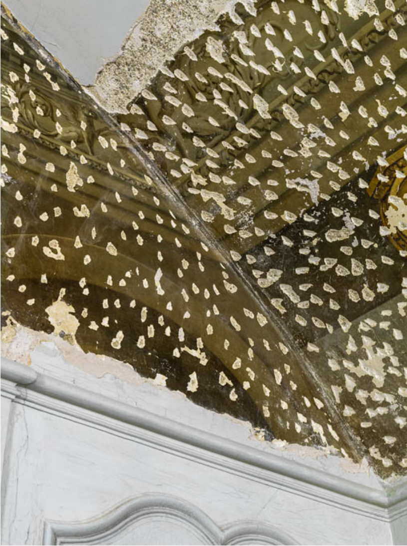
Peinture du petit salon : détail.