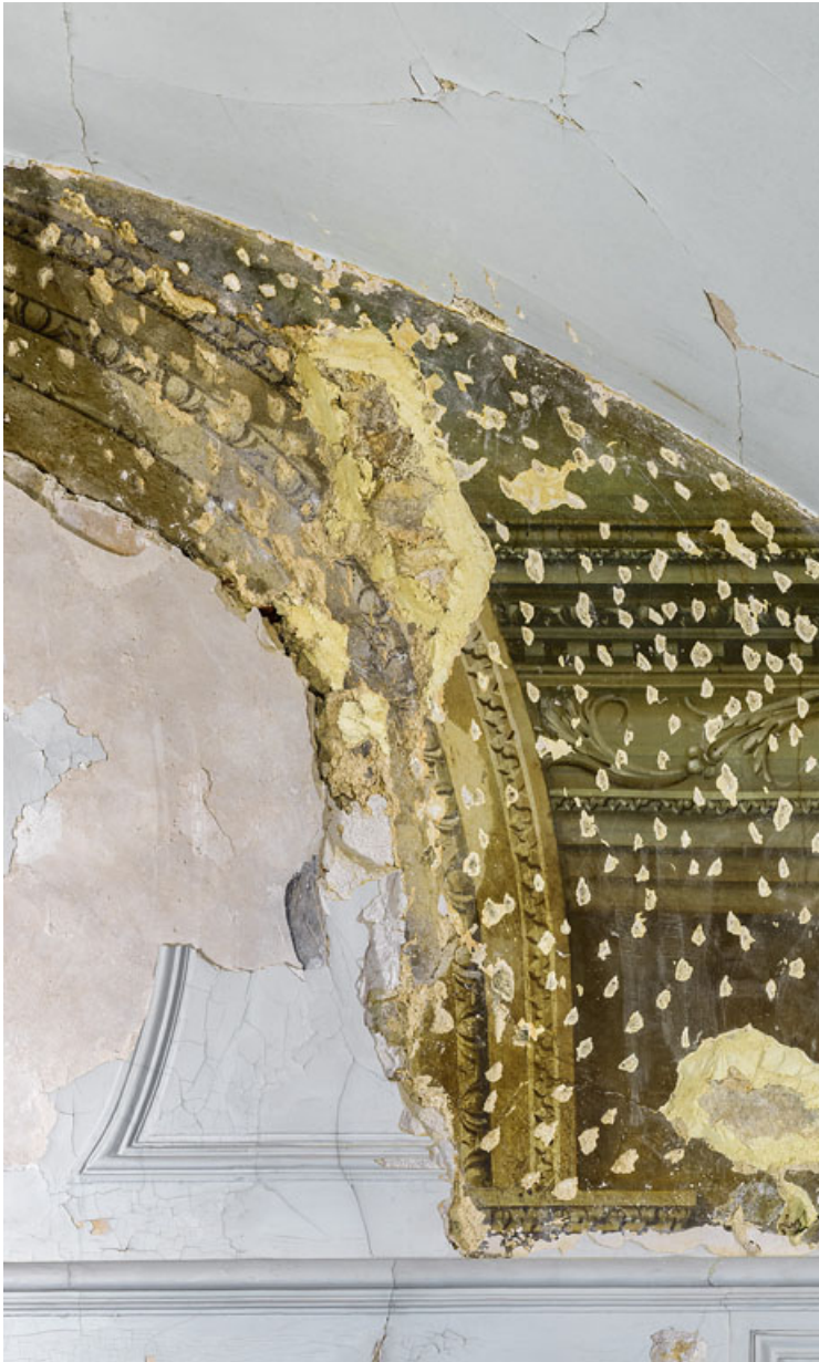
Peinture du petit salon : détail.