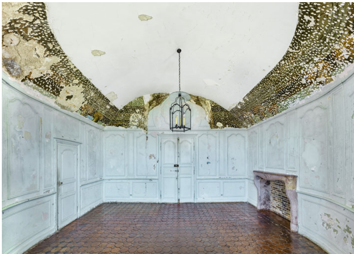
Vue d'ensemble des peintures murales du petit salon.