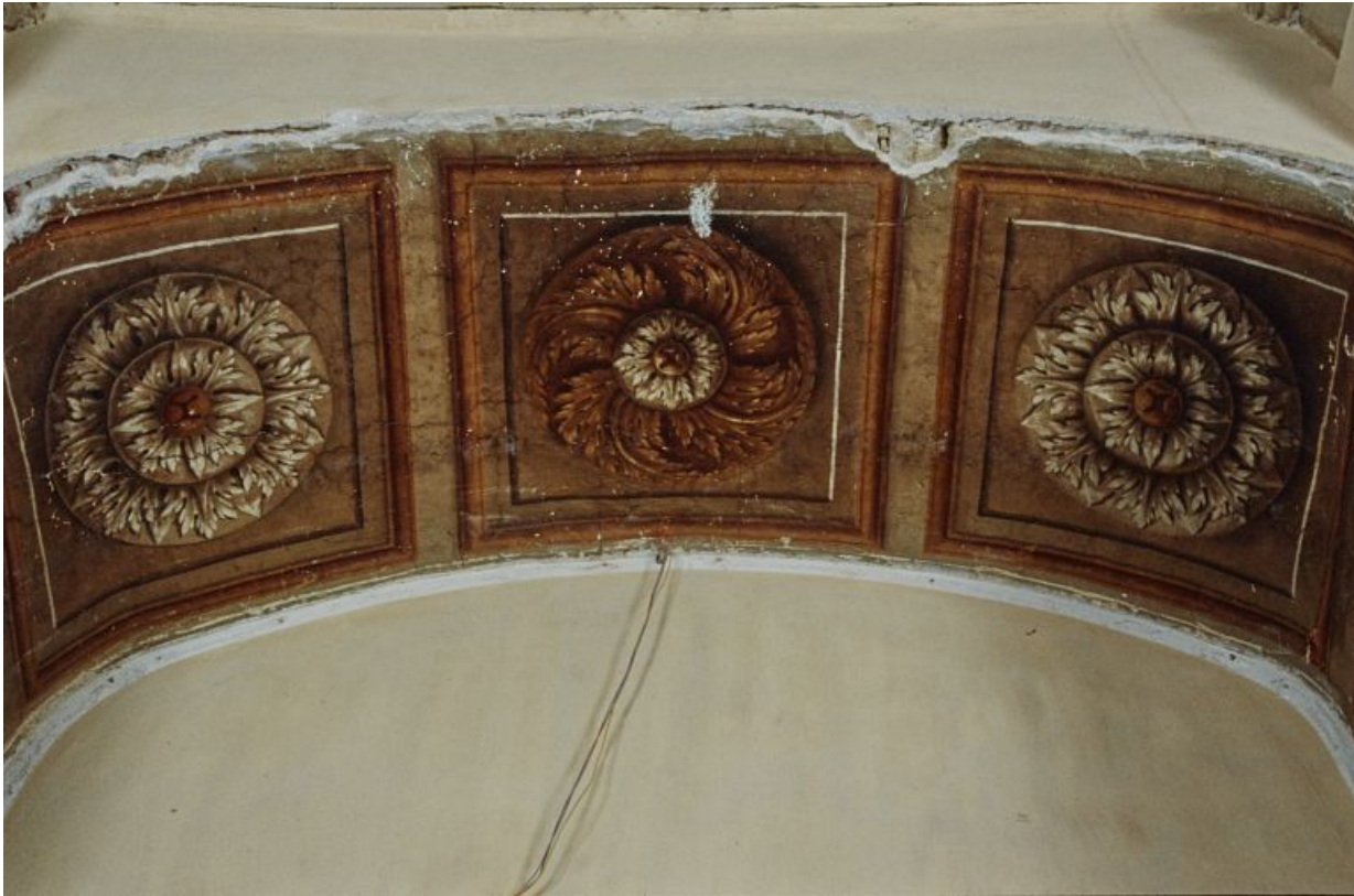
Peinture de l'embrasure de la porte.