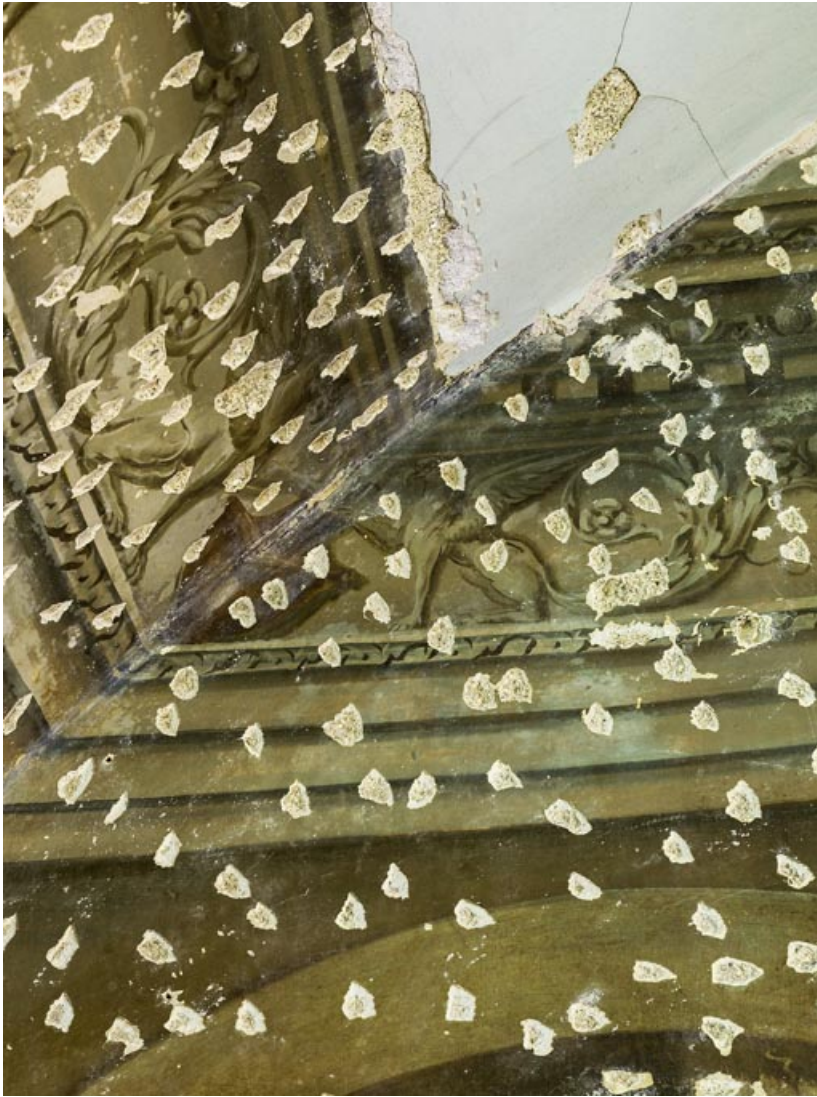
Peinture du petit salon : détail.