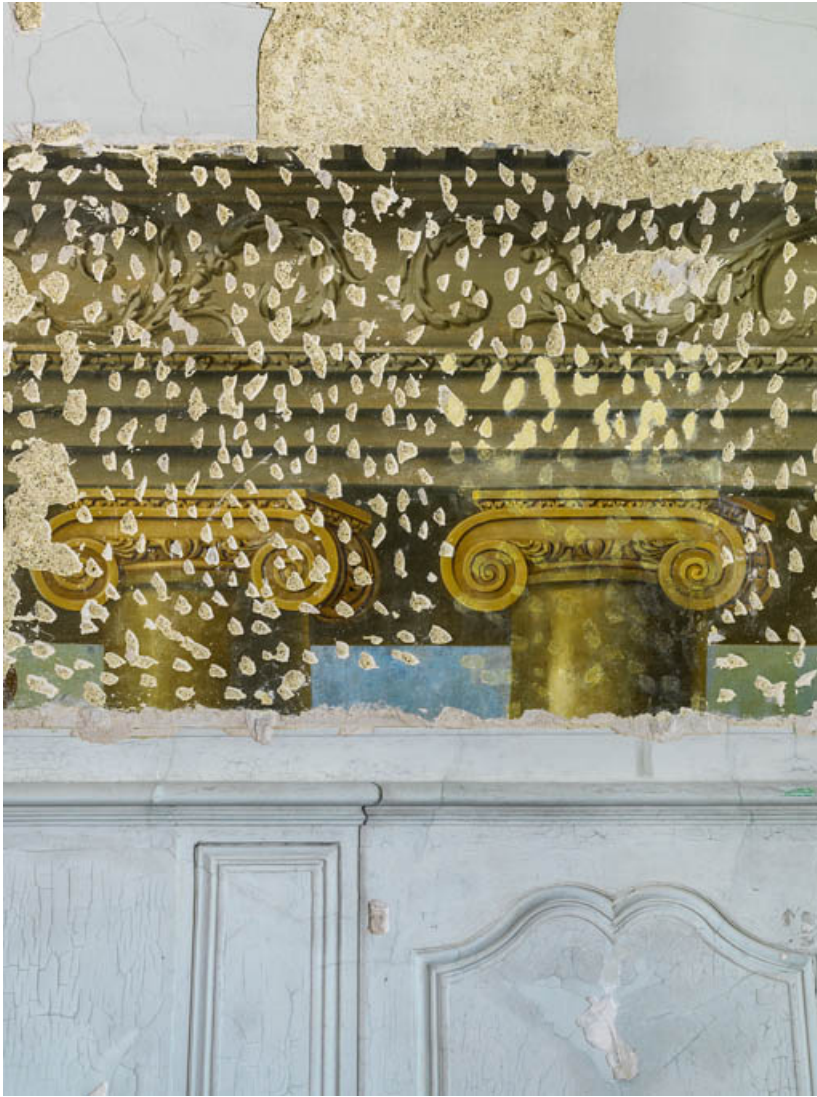
Peinture du petit salon : détail des chapiteaux à volutes en entablements ioniques. 21, Châteauneuf château fort