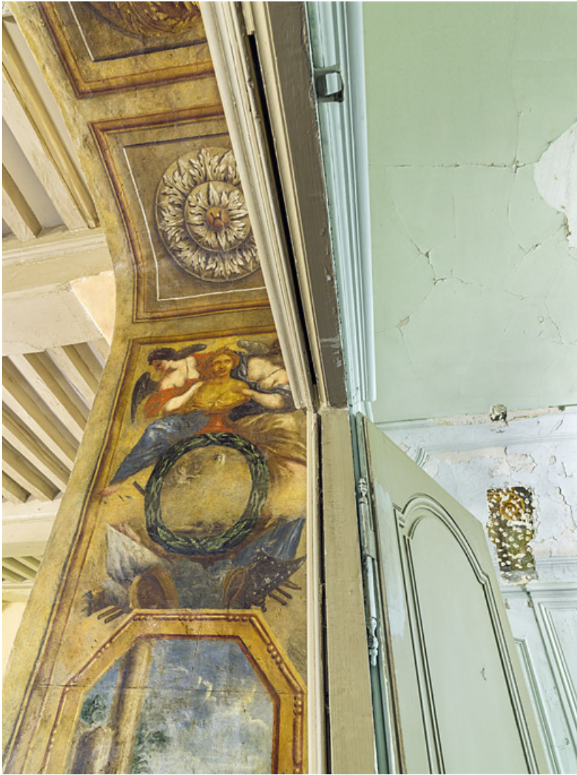
Peinture de l'embrasure de la porte.