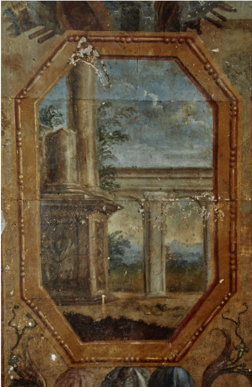
Peinture de l'embrasure de la porte : détail.