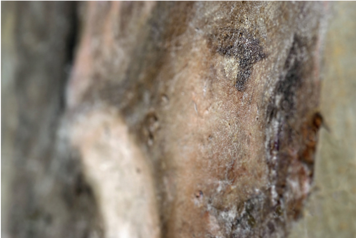
Peinture de l'embrasure de la porte : détail.