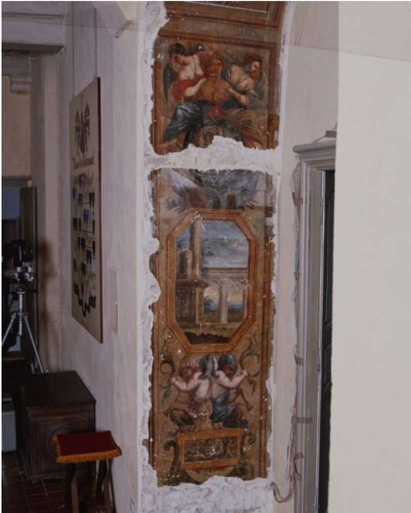
Peinture de l'embrasure de la porte.