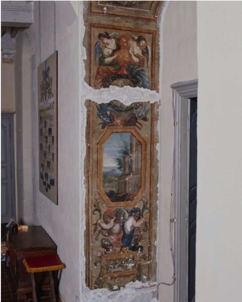
Peinture de l'embrasure de la porte.