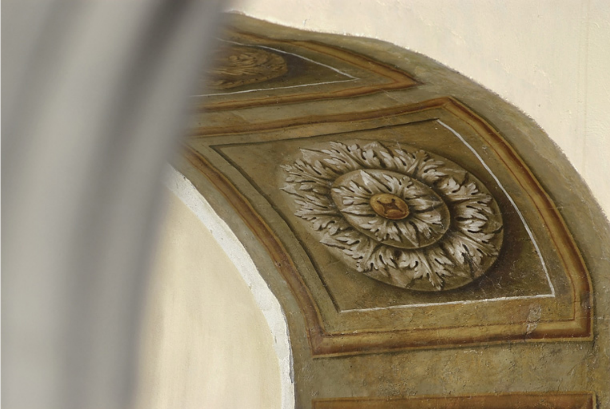
Peinture de l'embrasure de la porte : détail.