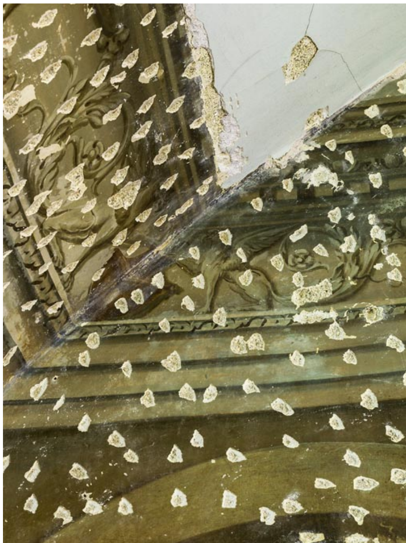
Peinture du petit salon : détail.