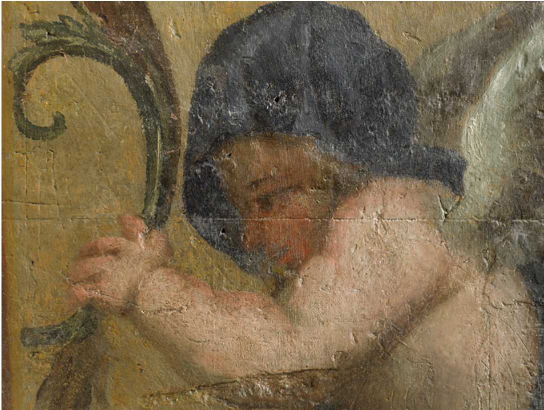
Peinture de l'embrasure de la porte : détail.