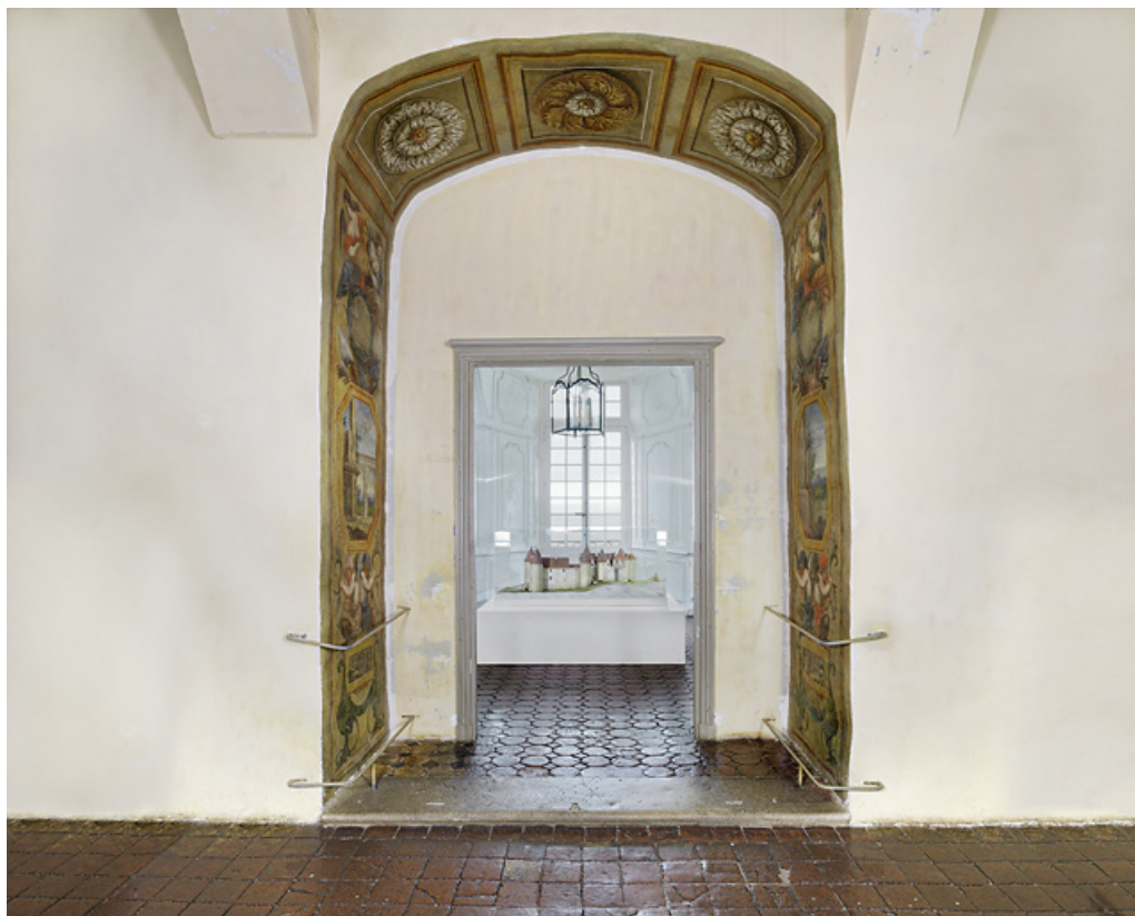
Vue d'ensemble de l'embrasure de la porte depuis la salle d'apparat.