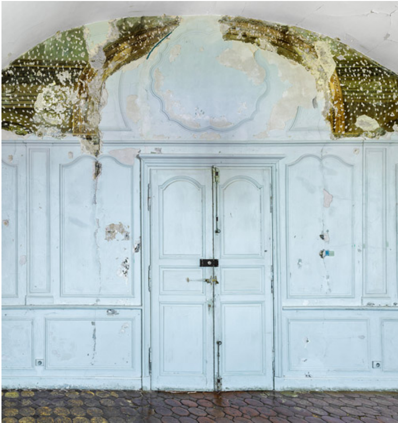
Peinture du petit salon : mur est.