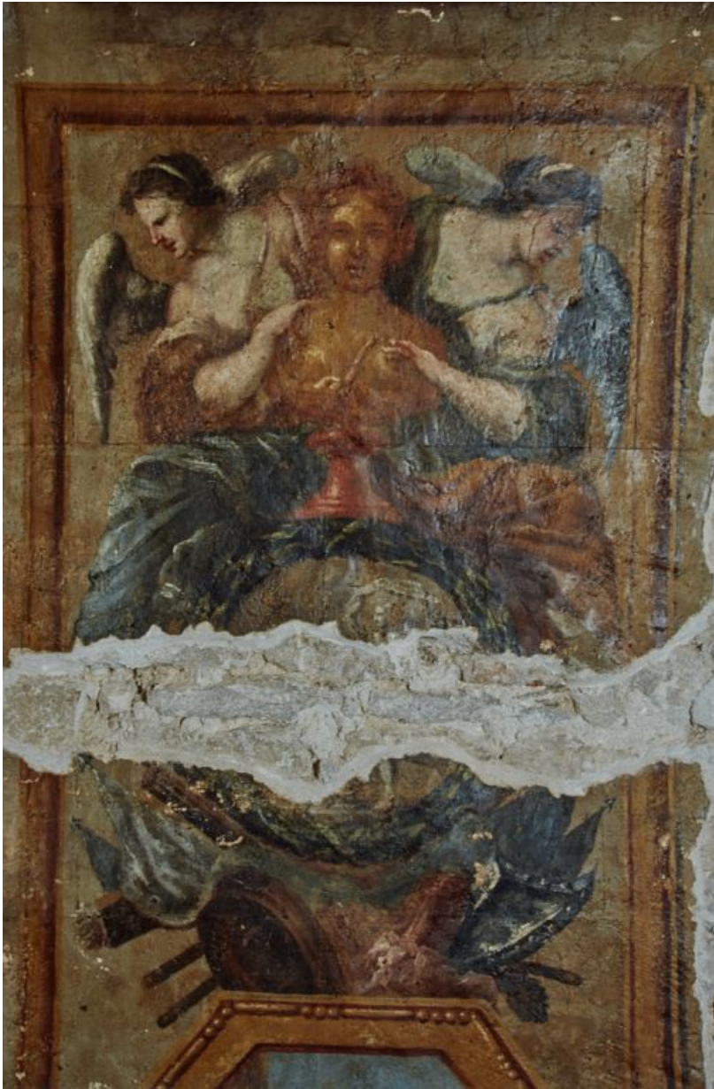
Peinture de l'embrasure de la porte : détail.