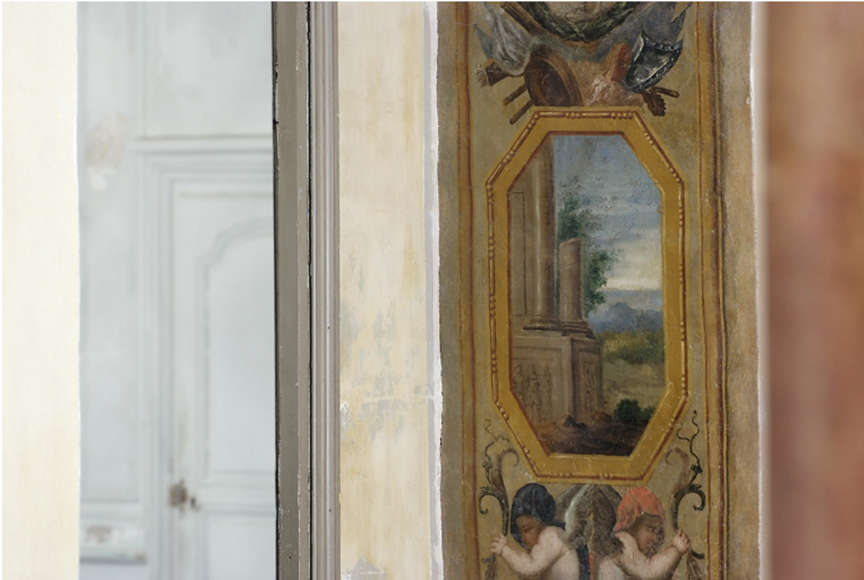
Peinture de l'embrasure de la porte : détail.