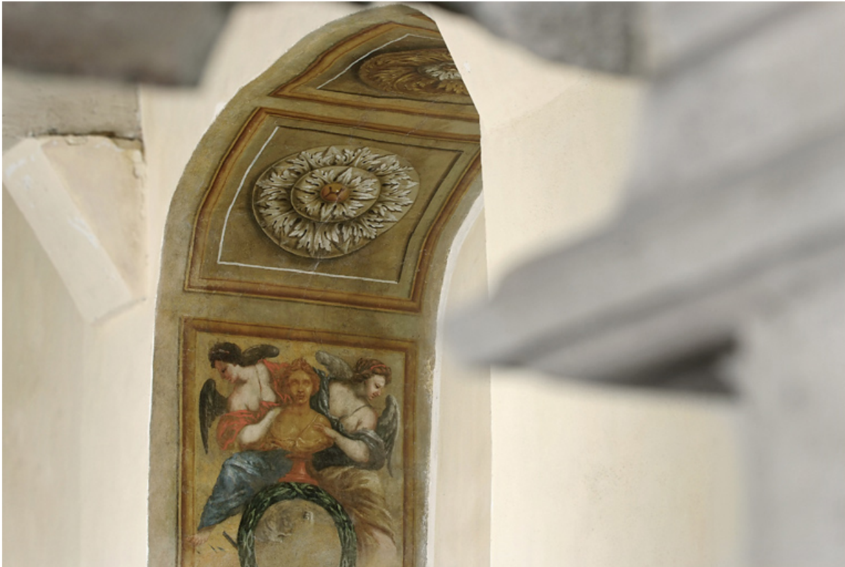
Peinture de l'embrasure de la porte : détail.