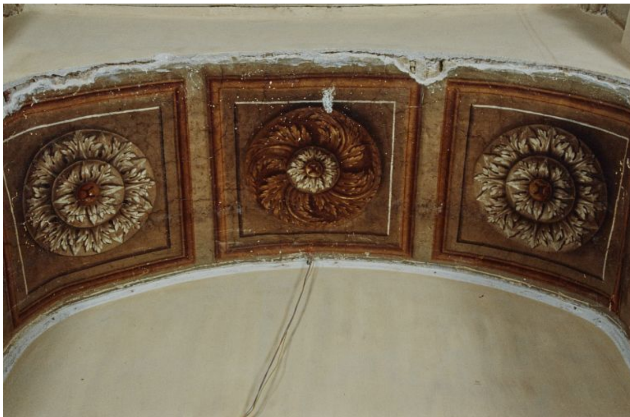
Peinture de l'embrasure de la porte.