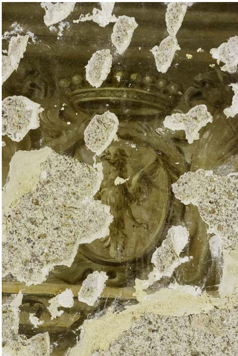
Peinture du petit salon : blason d'Henri de Vienne.