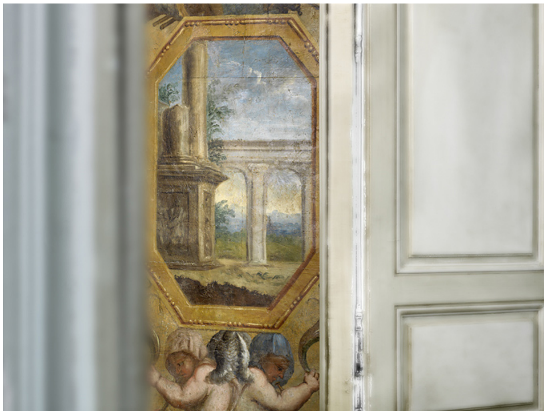
Peinture de l'embrasure de la porte : détail.