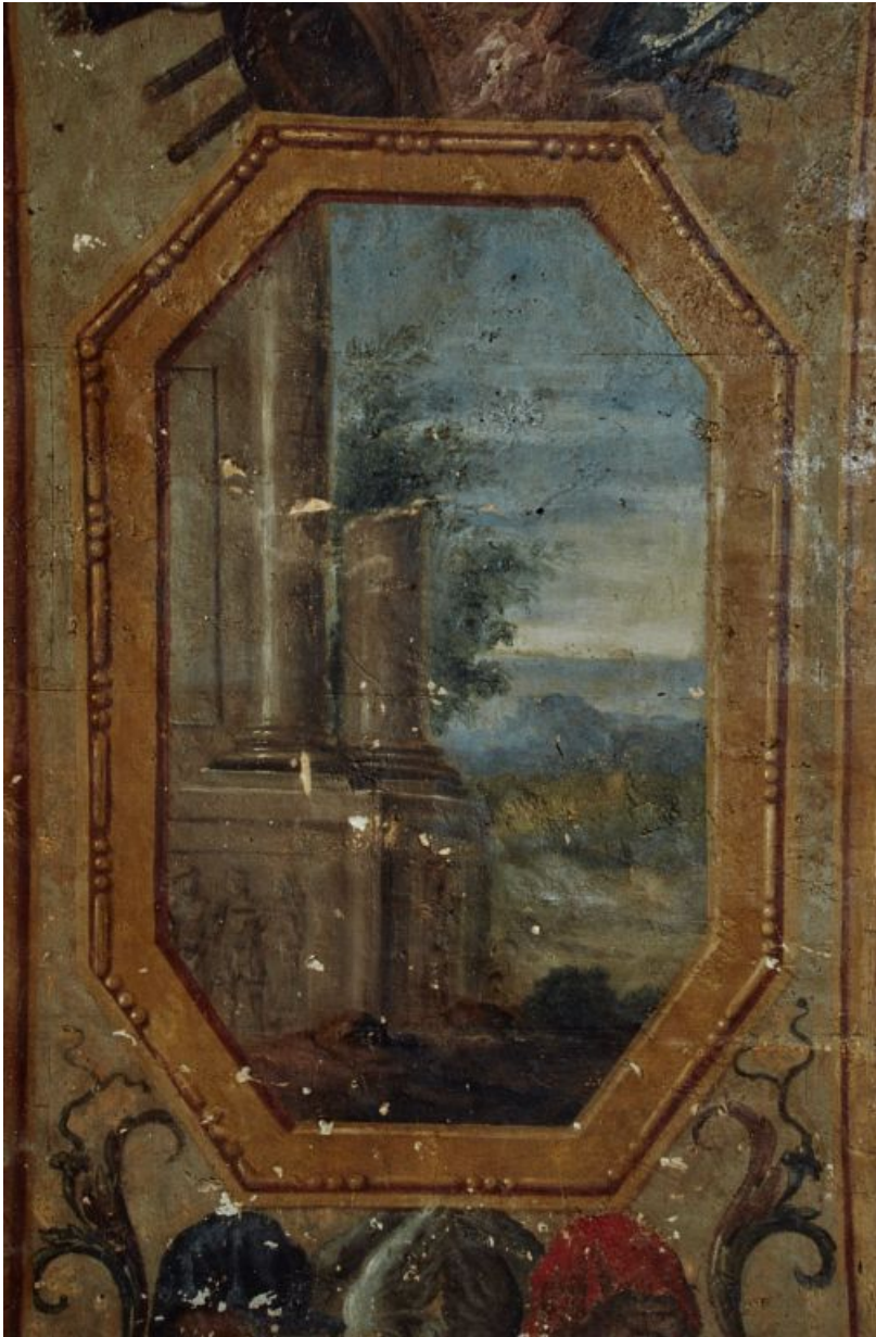
Peinture de l'embrasure de la porte : détail.