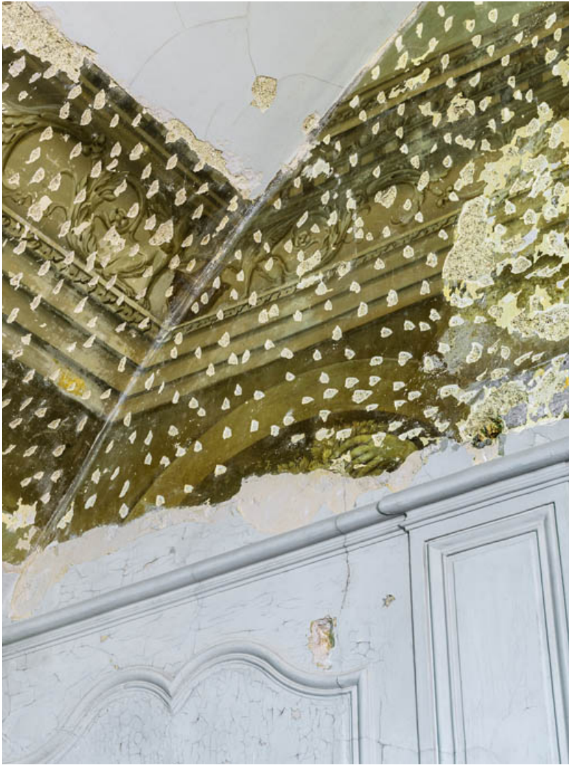
Peinture du petit salon : détail.