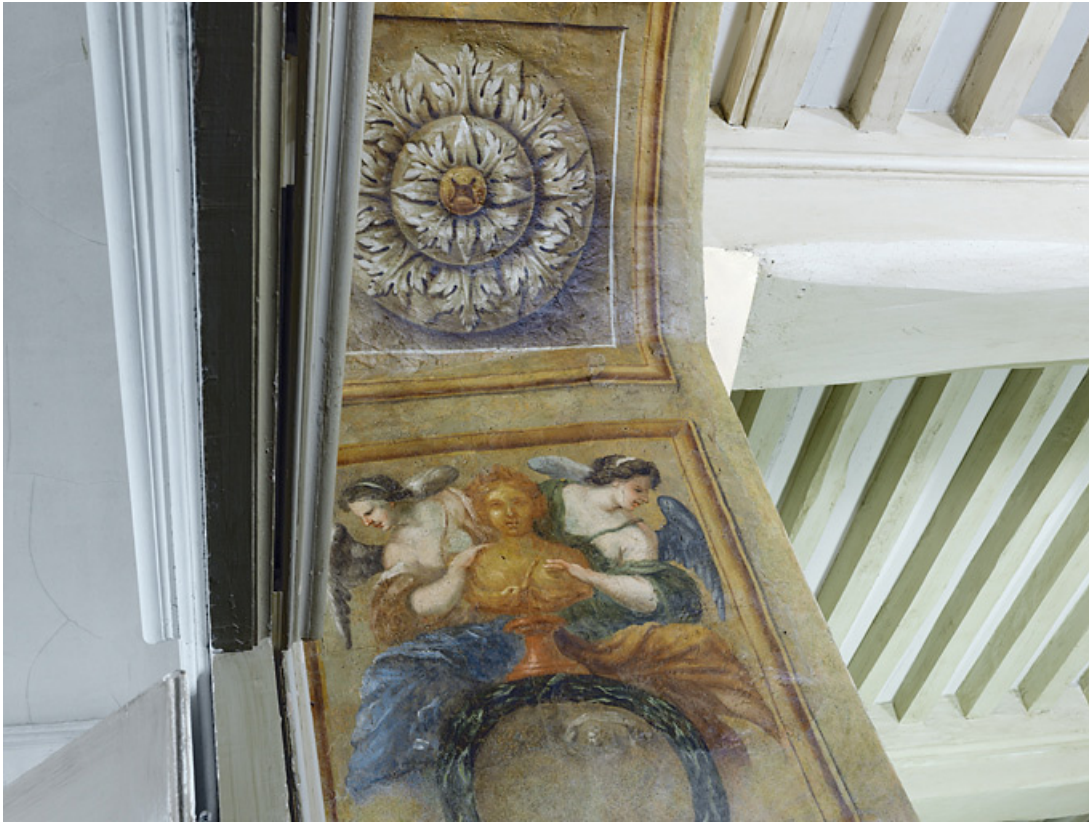
Peinture de l'embrasure de la porte : détail. 21, Châteauneuf château fort