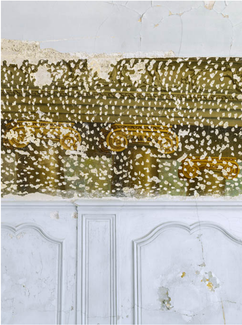
Peinture du petit salon : détail des chapiteaux à volutes et entablements ioniques. 21, Châteauneuf château fort