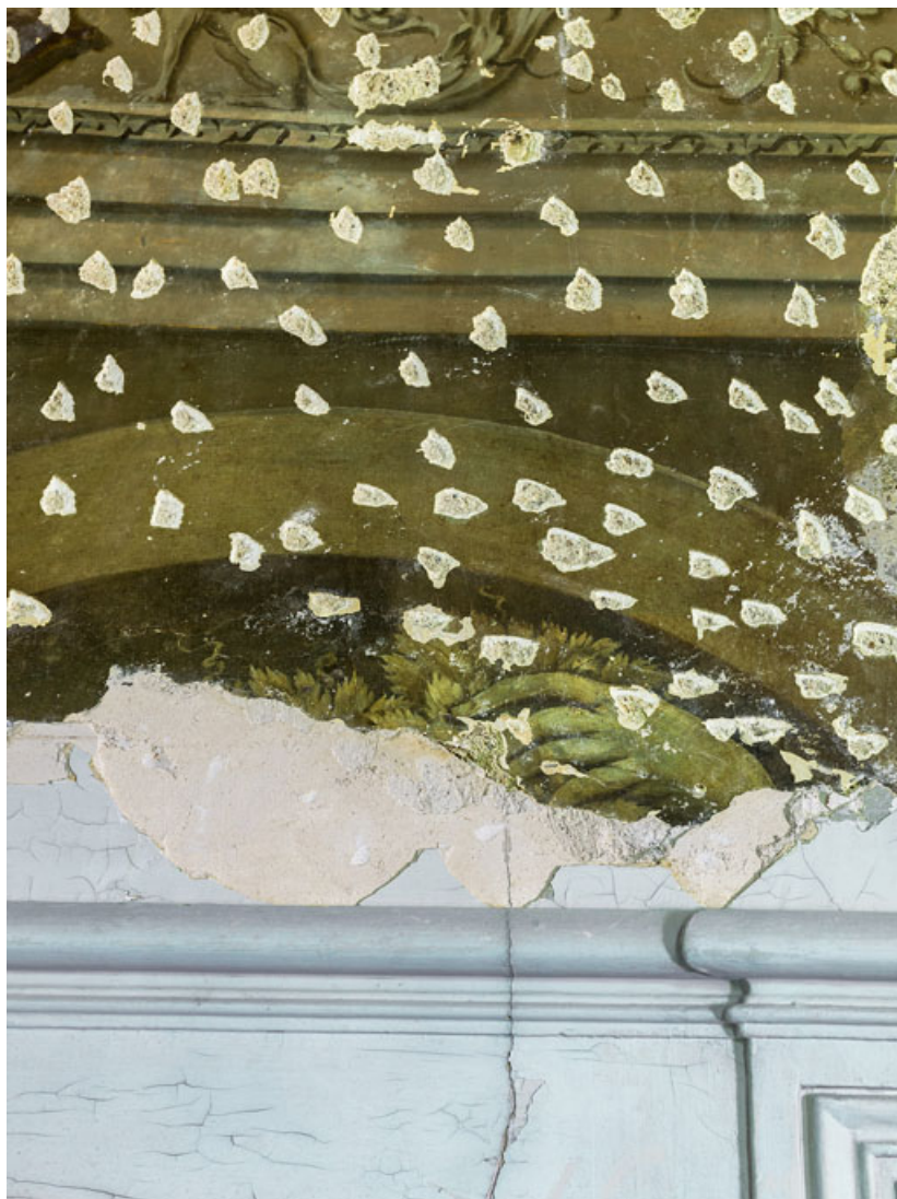
Peinture du petit salon : détail.