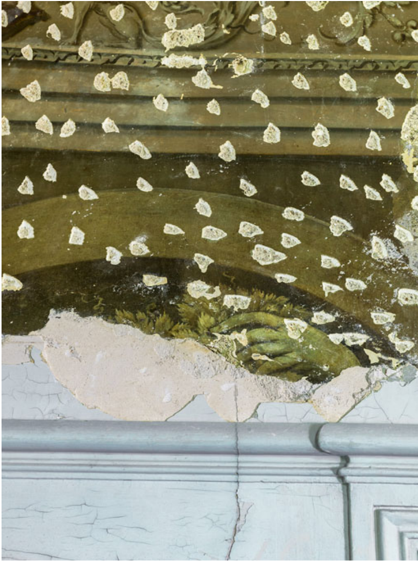
Peinture du petit salon : détail.