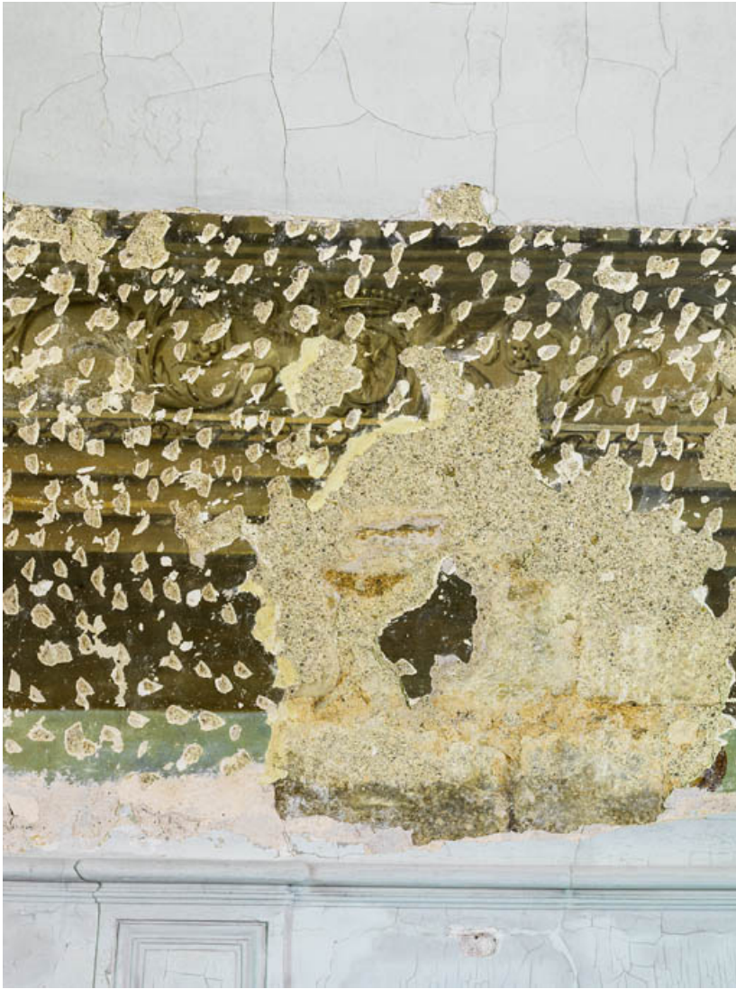
Peinture du petit salon : détail.