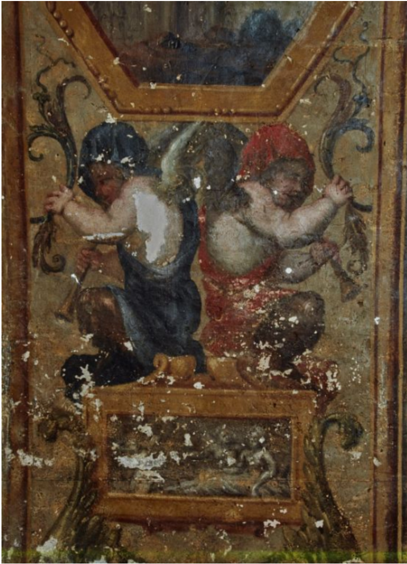
Peinture de l'embrasure de la porte : détail.