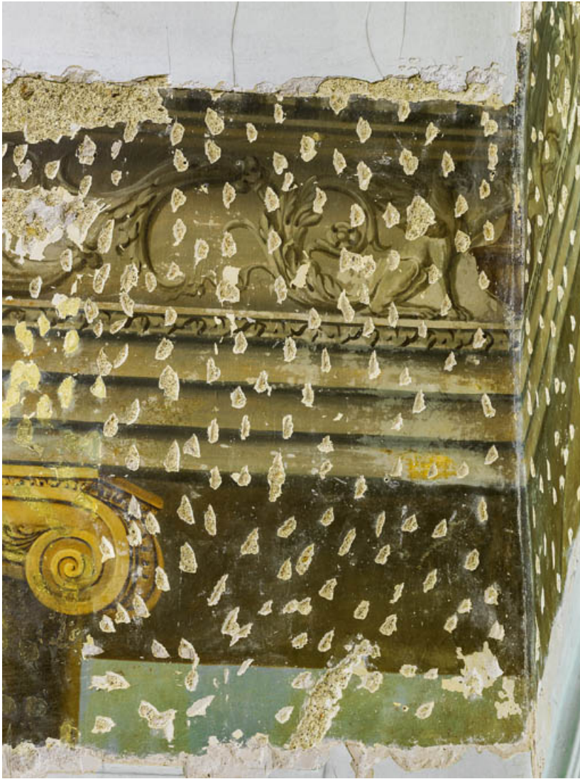
Peinture du petit salon : détail.