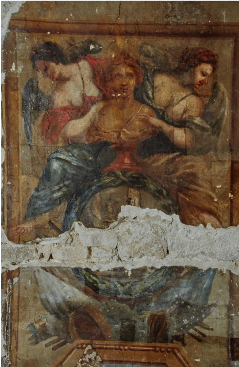
Peinture de l'embrasure de la porte : détail.