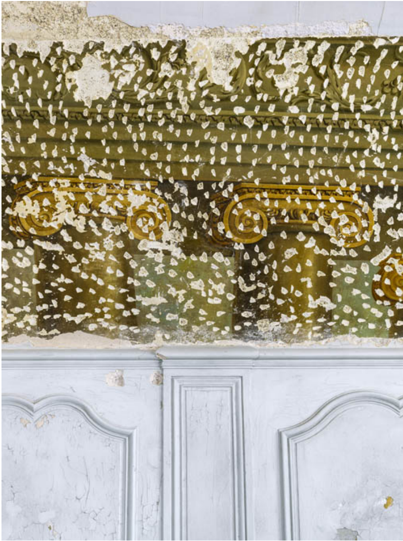
Peinture du petit salon : détail des chapiteaux à volutes et entablements ioniques. 21, Châteauneuf château fort