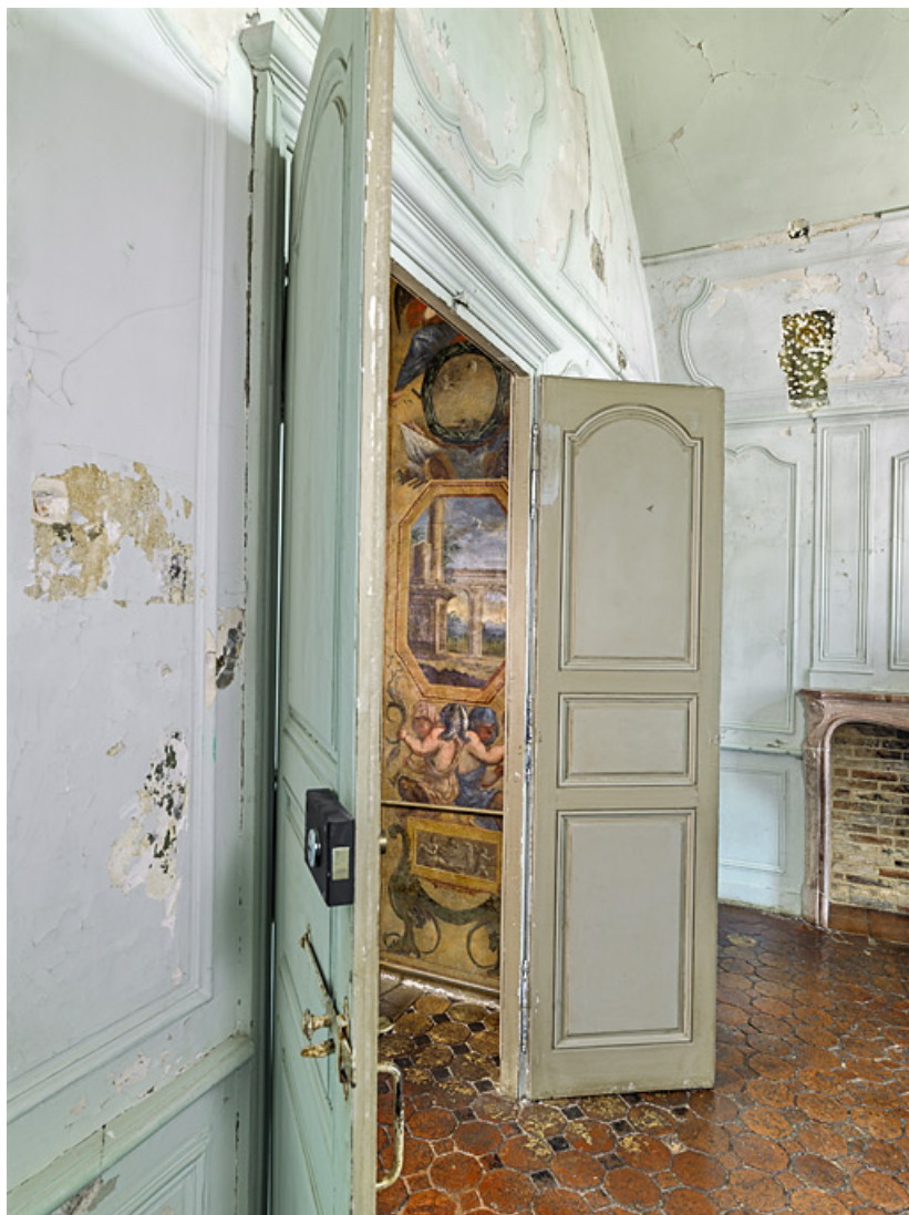
Entrée dans le petit salon pendant le dégagement des peintures en 2016. 21, Châteauneuf château fort