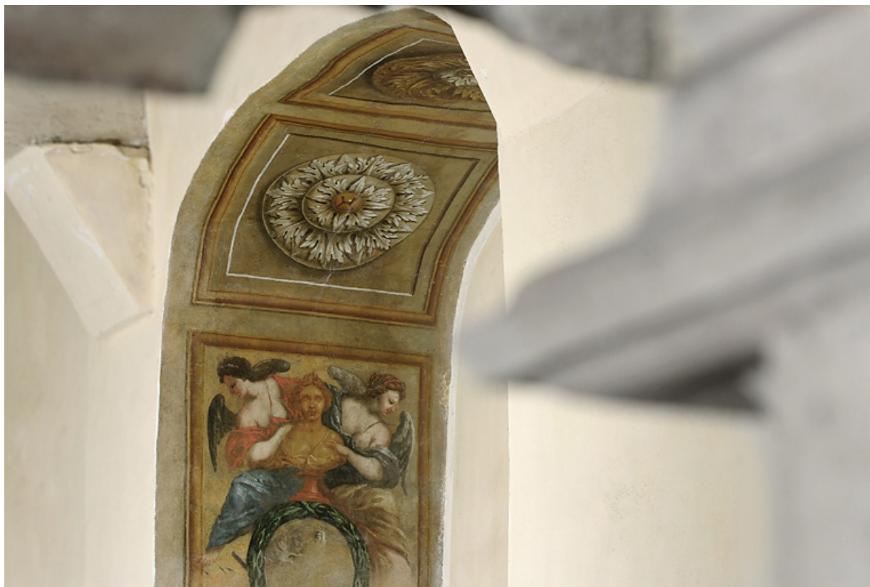
Peinture de l'embrasure de la porte : détail.