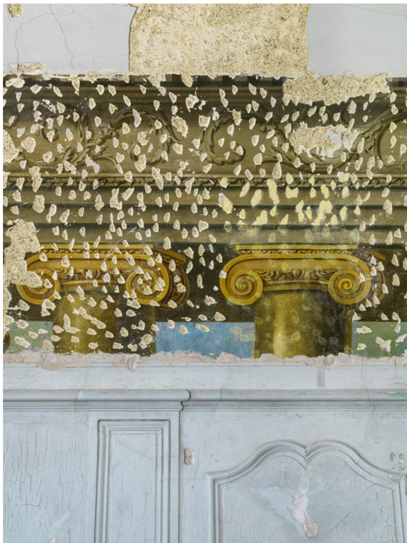
Peinture du petit salon : détail des chapiteaux à volutes en entablements ioniques. 21, Châteauneuf château fort