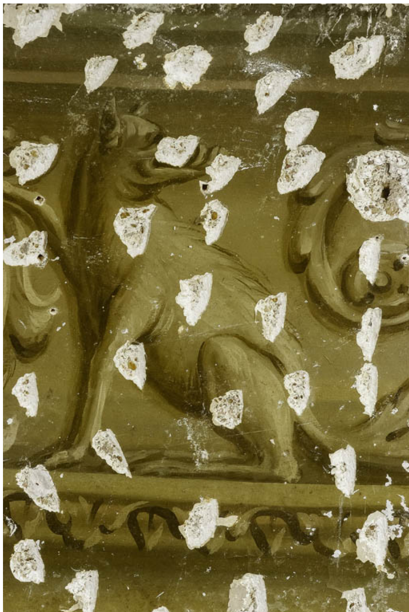
Peinture du petit salon : griffon.