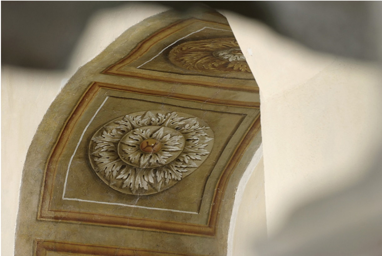
Peinture de l'embrasure de la porte : détail.