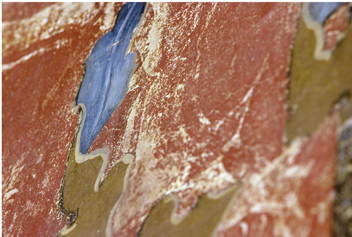
Peinture monumentale : détail.