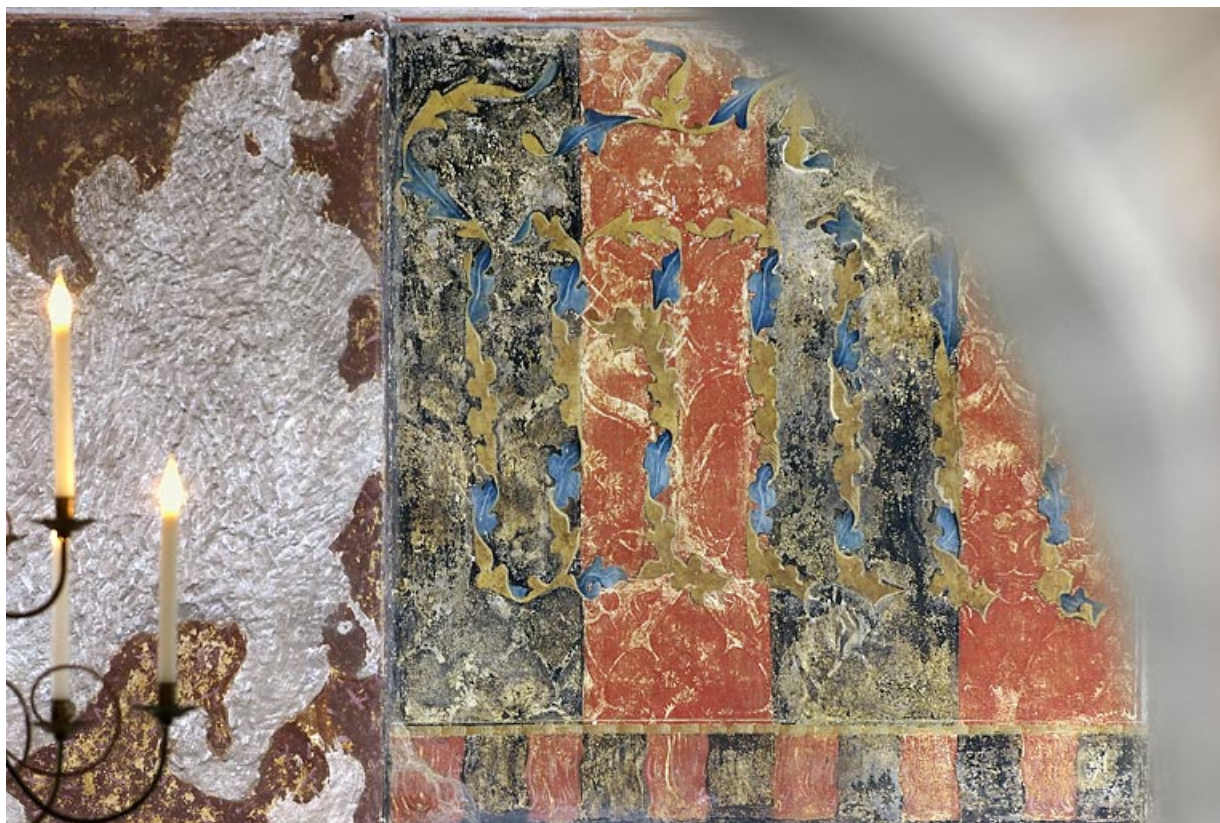
Peinture monumentale : détail.