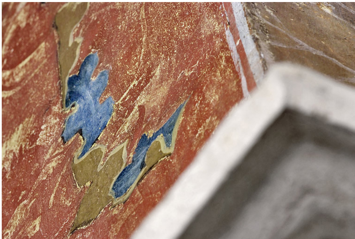
Peinture monumentale : détail.