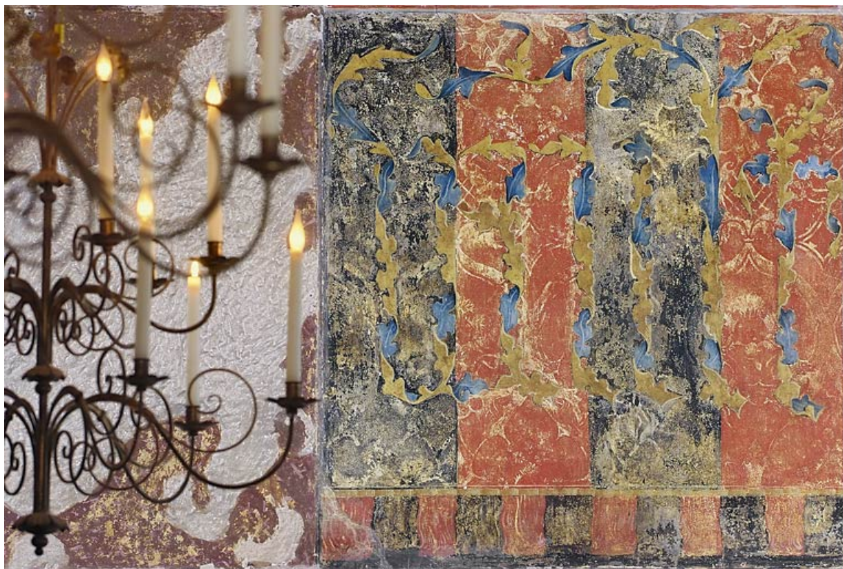
Peinture monumentale : détail.