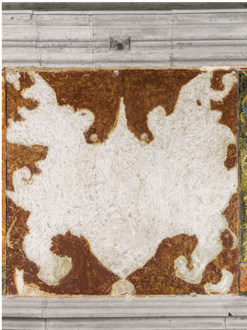
Détail : armoiries martelées.