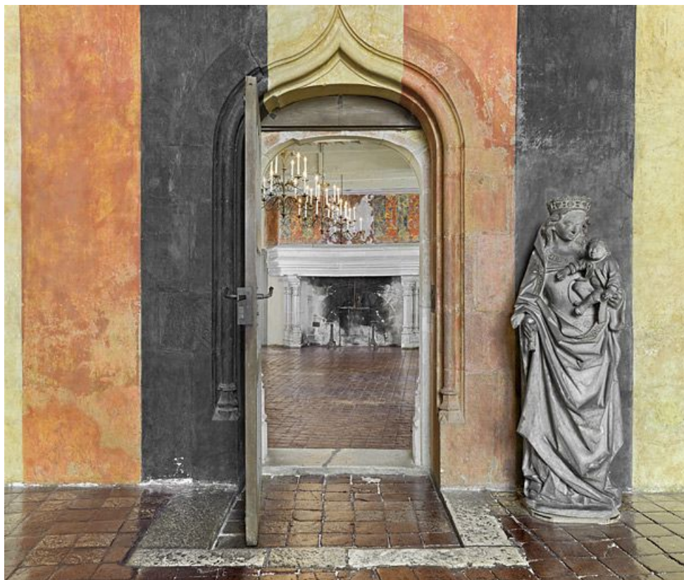
Vue d'ensemble depuis la chapelle.