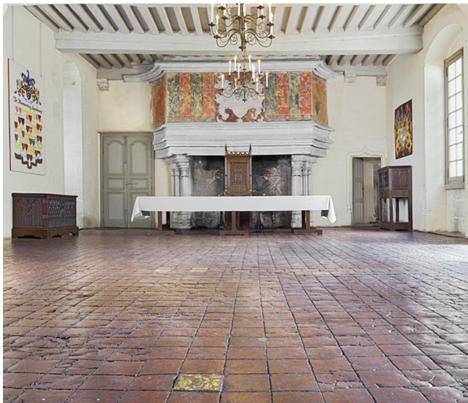
Vue d'ensemble de la salle d'apparat dans le grand logis.