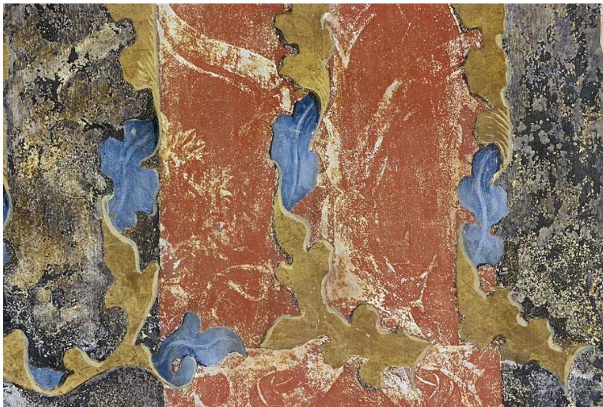
Peinture monumentale : détail.