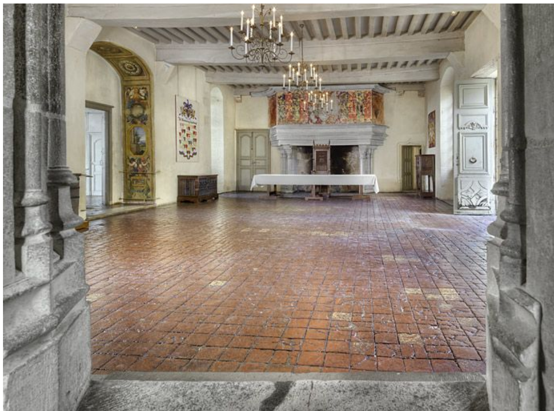
Vue sur la grande salle depuis la chapelle.