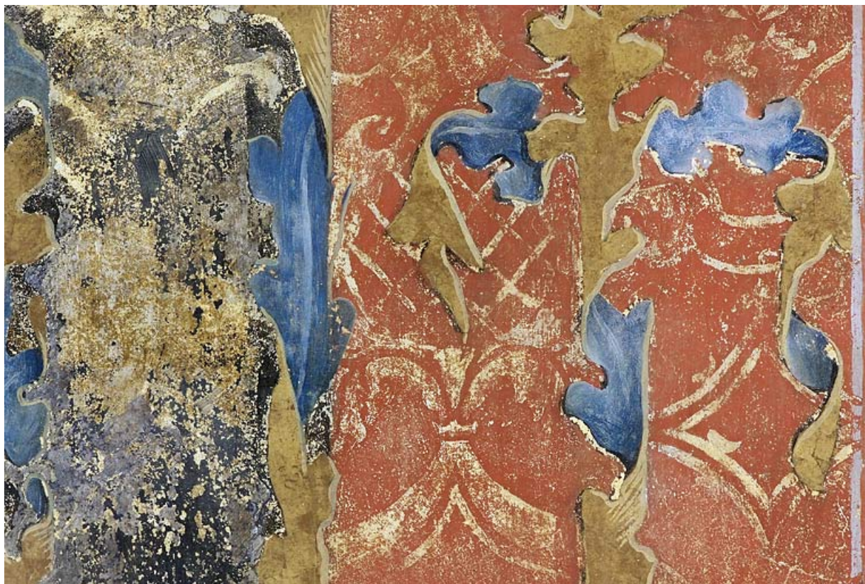
Peinture monumentale : détail.