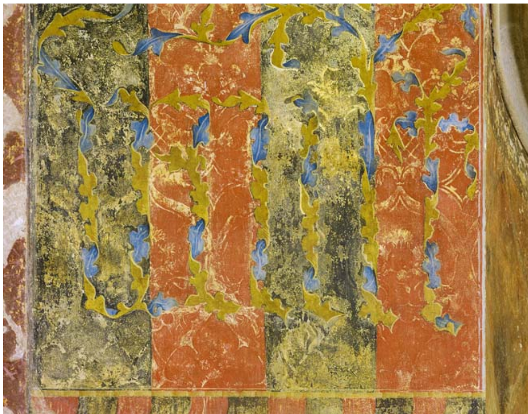
Détail de l'inscription : "Vault".