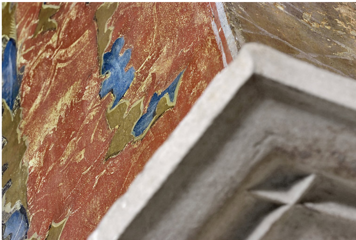
Peinture monumentale : détail.