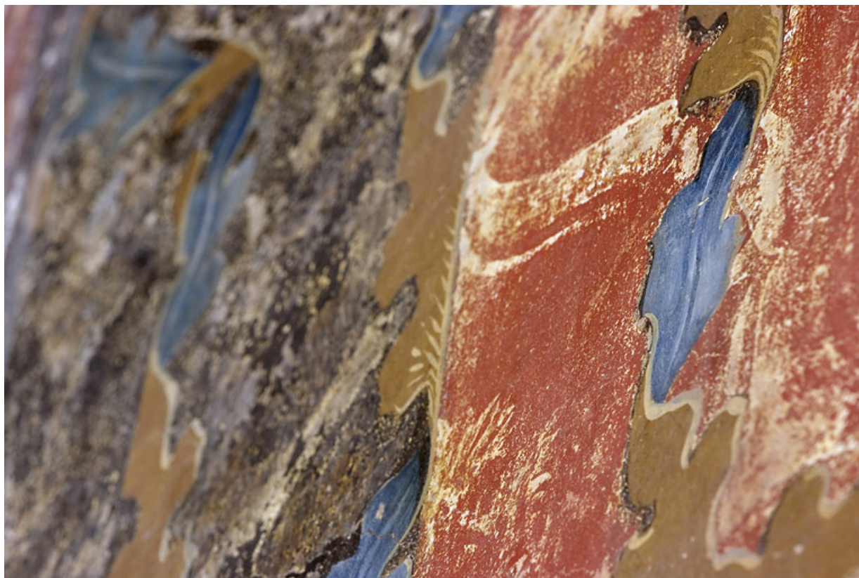
Peinture monumentale : détail.