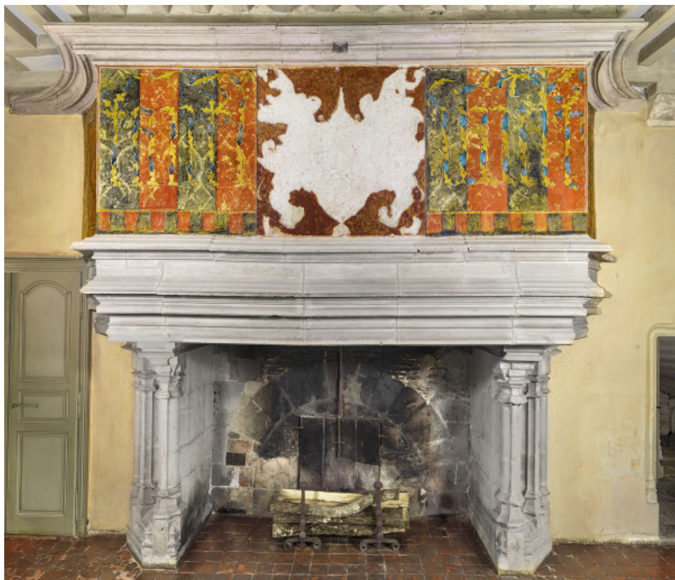
Vue d'ensemble de la cheminée.