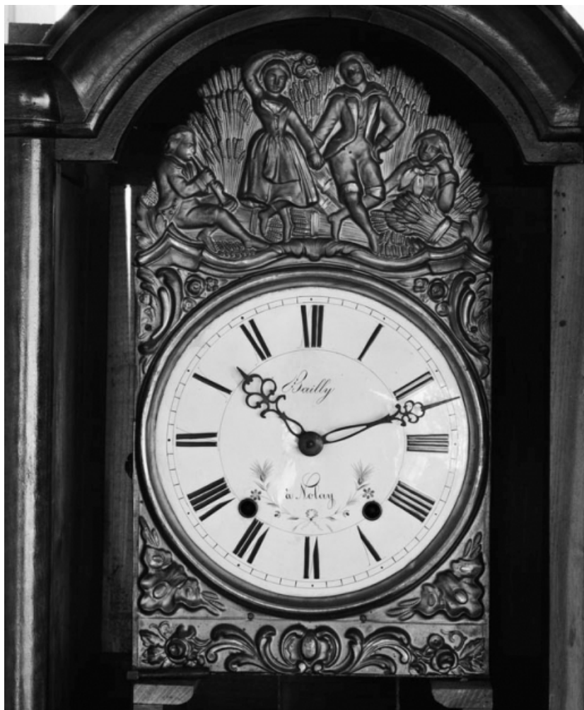
Détail du cadran.